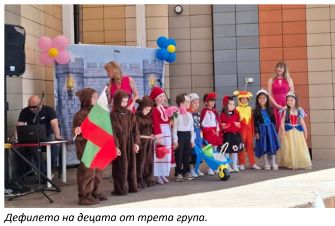
Дефилето на децата от трета група.