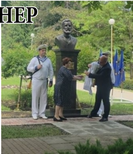
Председателят на Общинския съвет и кметът на общината откриха бюст-паметника на Христо Ботев в градския парк.

Присъстващите – жители и гости на общината, сведоха глава в знак на почит към