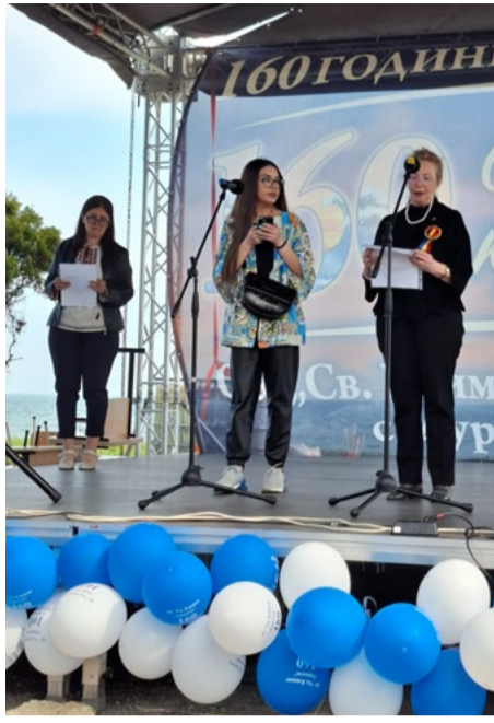
Гостите от Румъния.