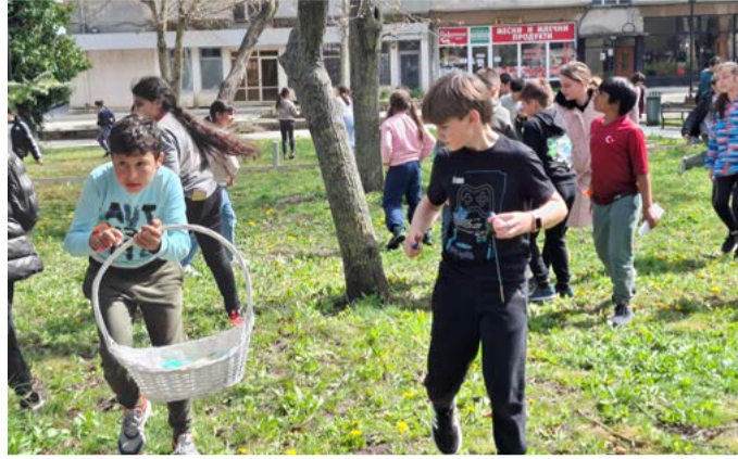
Безброй обективи запечатаха срещата с жълтия гост. Всички ученици, които се включиха, получиха подаръци и незабравими спомени.

Появи се Великденско пиле. То предизвика много слънчеви детски усмивки и настроение у децата, и желания всички да се снимат с него пред специален великденски кът, поставен от организаторите.