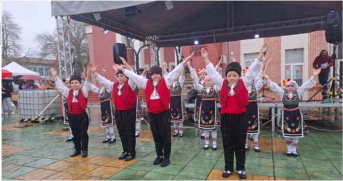
Смелите и талантиливи деца от „Бърборино“.

На празника бяха раздадени 7 поощрителни награди и на-