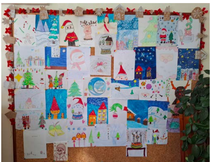
Дни преди Коледа, ученици от СУ „Асен Златаров“ Шабла подготвиха кът с рисунки за святия ден.