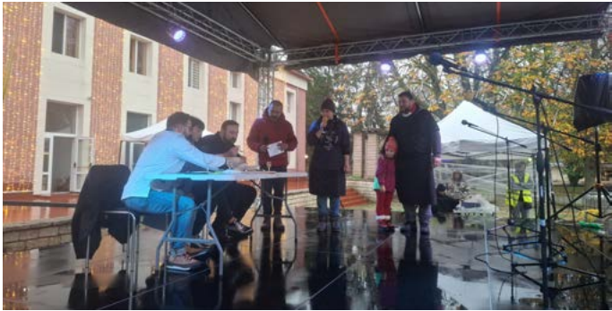
Представянето на „Casa mia“.