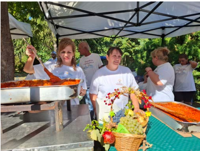
Работещите в Домашния социален патронаж в града приготвиха и раздадоха едросмляна лютеница - гарнитура към шишетата на Ути.