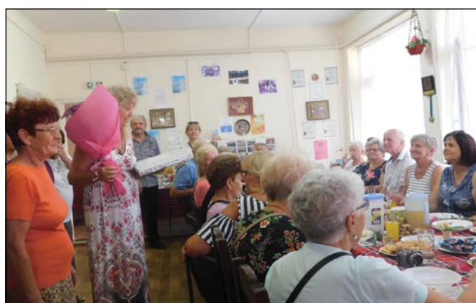
С нашите съмишленици от Терешин, Полша.