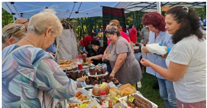
„Най-нестандартен щанд“ ЦСР Шабла.