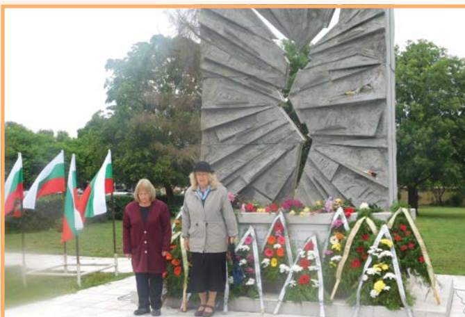
Пред Паметника на загиналите в бунта на 1 юни 1906 година.