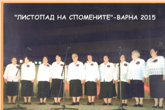
"ЛИСТОПАД НА СПОМЕНИТЕ" - ВАРНА 2015