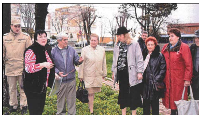
На гости в Мангалия.