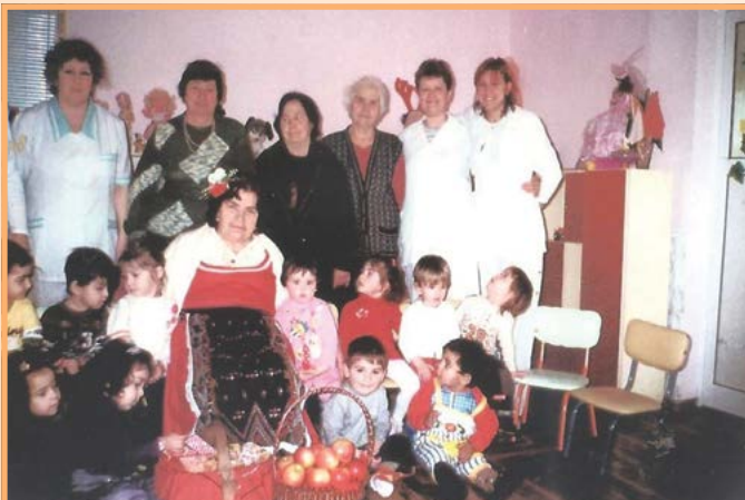
Баба Марта при децата от ЦДЯ „Радост“ Шабла.