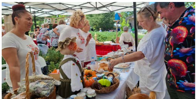
„Най-характерен обреден хляб“ с. Дуранкулак.