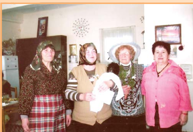
Бабинден, 2016 година.