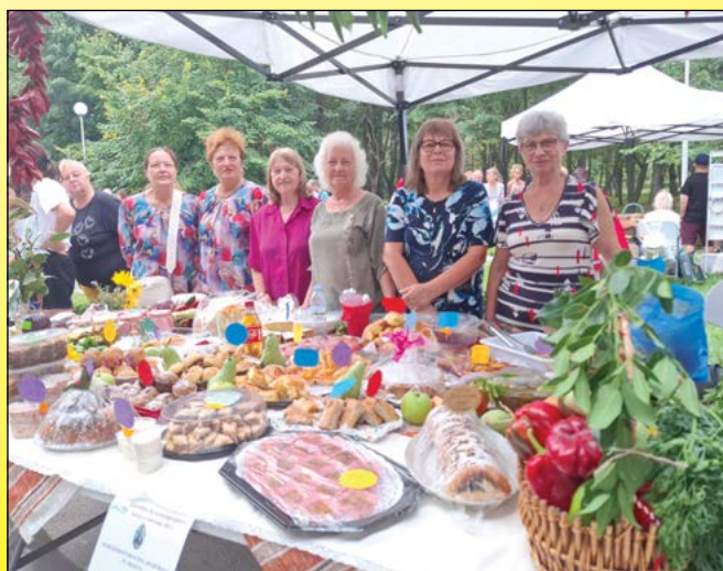
На празника на плодородието, 2024 година.