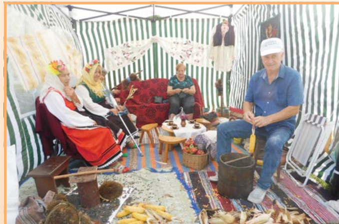
2023 година – пресъздаване на обичая „Белянка“.