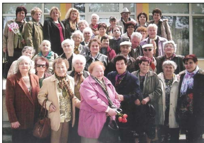
С приятели от Тервел.