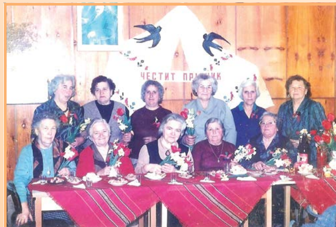
Посрещаме Първа пролет!