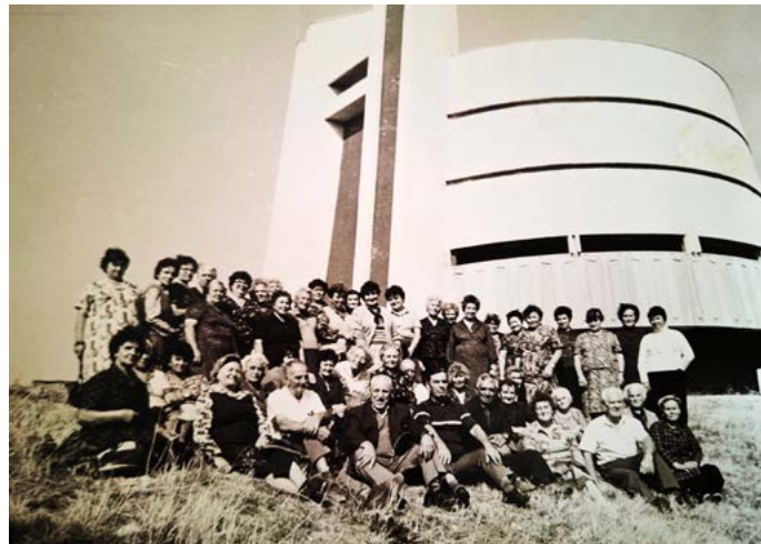
Пред панорамата „Плевенска епопея“.

Девет председатели бележат 50-годишния „живот“ на „Надежда“. Стоотици хора са намирали духовно убежище, разтуха, осмисляне на свободното време, участия в национални и международни фолклорни и театрални форуми, екскурзии. Честит половинвековен