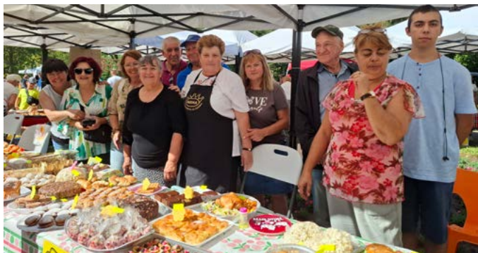
„Най-богат щанд“ с. Прелез и с. Божаново.