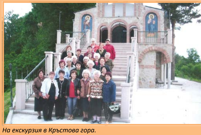
На екскурзия в Кръстова гора.