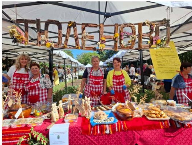
„Най-добре аранжиран щанд“ с. Тюленово.