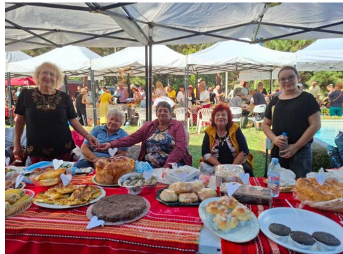
Най-вкусни местни и национални ястия“ - кметство Горун.