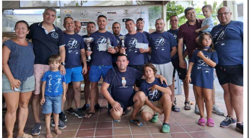
Част от отбора и семейства на МК „Портус Кариа“.

брега живи и здрави от стихийното море и бяха обилно нагостени от любезните домакини от ресторант „Делфина“, дойде моментът за меренето на улова.