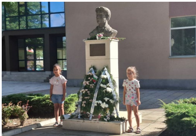
Деца от ДГ „Дора Габє“.