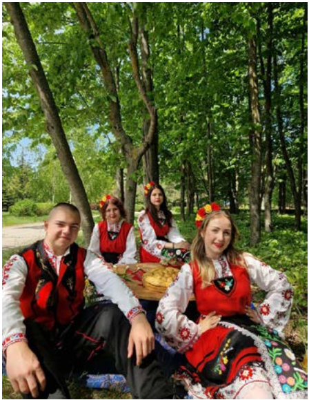
Библиотека при НЧ „Зора 1894“ Шабла

се включиха във възстановката и допринесоха за нейния дух и автентичност! С тяхната помощ събитието се превърна в истински празник на българското народно творчество. Благодарим на всички, които участваха и допринесоха за този празничен ден!