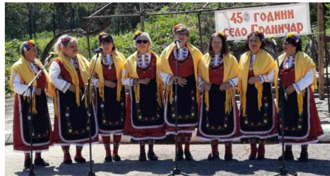
Певческа група от с. Дуранкулак.