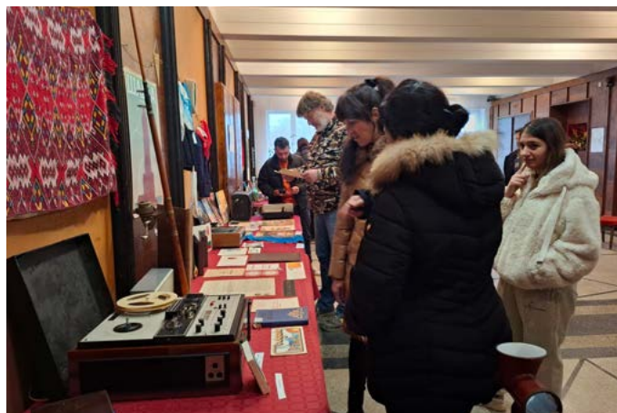
Мнозина се върнаха години назад.