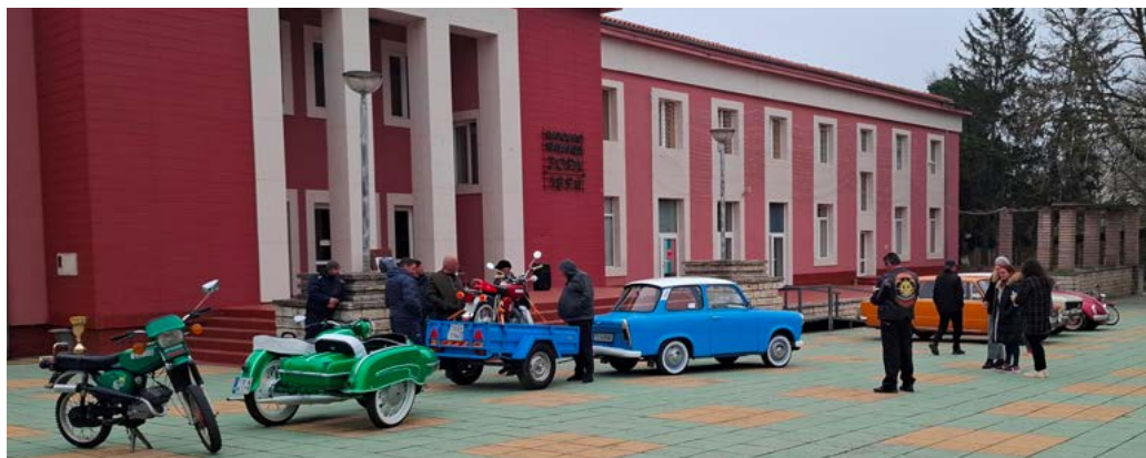
Ретро парад на мотоциклети и автомобили.

На площада пред читалището „привличаха“ 4 ретро-мотоциклета и 4 ретро автомобила, които и до днес са в движение, и са донесли немалко награди на своите собственици.