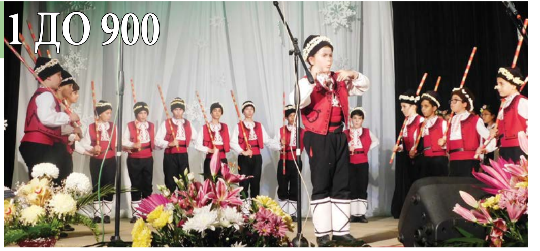
ДТС „Бърборино“, 2019 година.

проекта възлиза на 263 387,67 лв. без ДДС и представлява 100% от одобрените и реално извършени разходи“, е водещата новина в Брой 500.