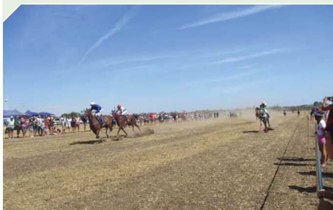
Турнир в памет на Панайот и Константин Карамилеви, 2024 година.