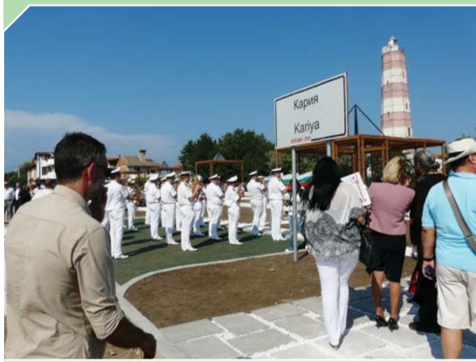
2014 година – откриването на облагородената по проект площ пред фара, т.нар. „пирамиди“.