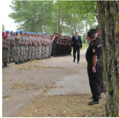
Президентът приема строя.

тели. Идеята идва от председателя на общинската организация на пенсионерите, Веска Димова, след като прочита във вестник „Юнак“, в Шабла се поставя началото на организирано спортно движение. На 9 октомври 2010