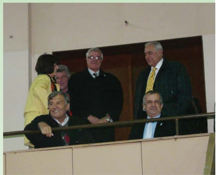
Иван Славков по време на честването 100 години спорт в Шабла, 2010 година.