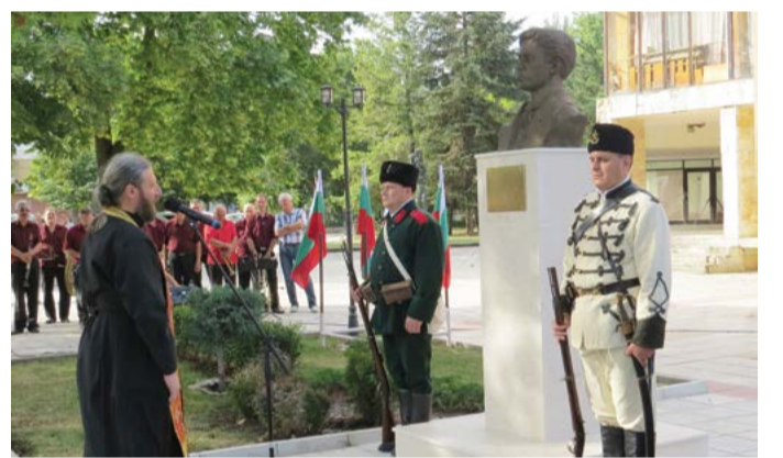
На 17 юли 2018 година в Шабла бе открит паметник на Васил Левски.