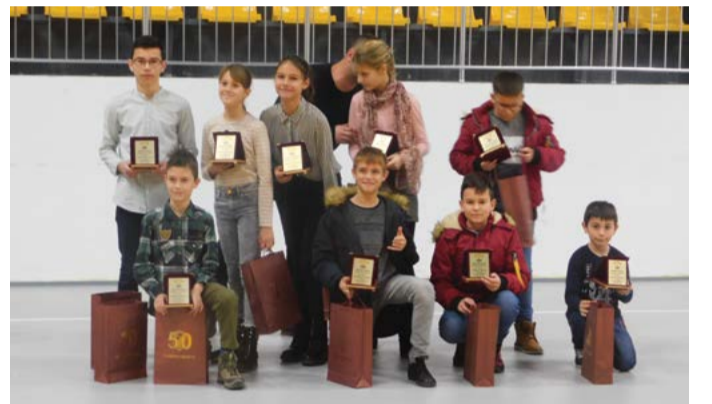
Награждаване на „Спортист на Шабла“, 2019 година.