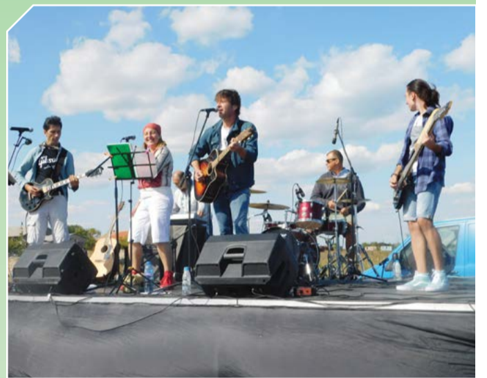
Деси в действие!