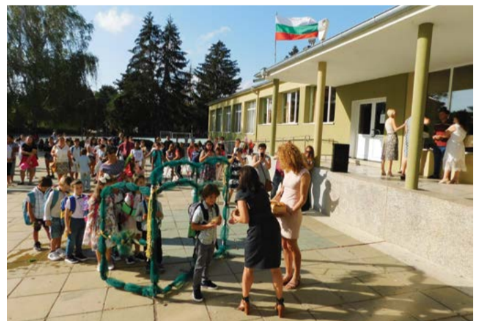
Откриване на новата учебна година, 15 септември 2020 година.