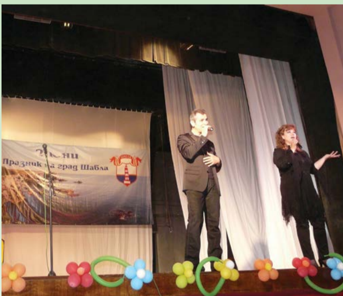
На сцената дует „Шик“, 2013 година.