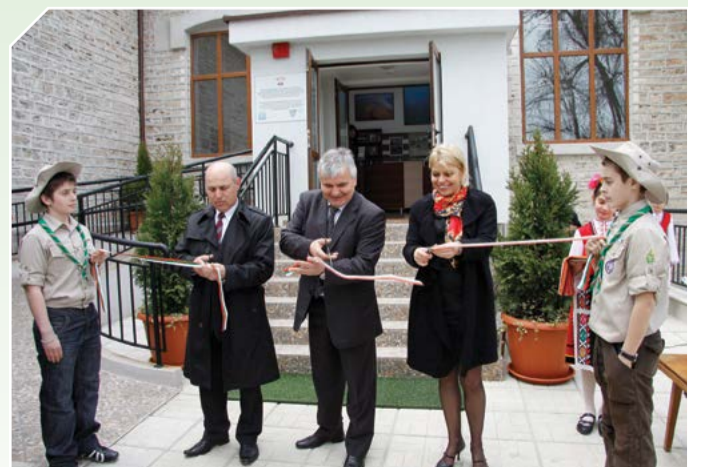
Откриване на Зеления образователен център, 2011 година.