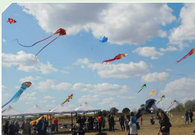
Фестивал на хвърчилата, 2019 година.