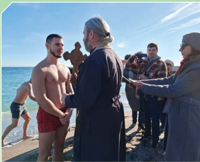
Йордановден в Крапец, 2024 година.