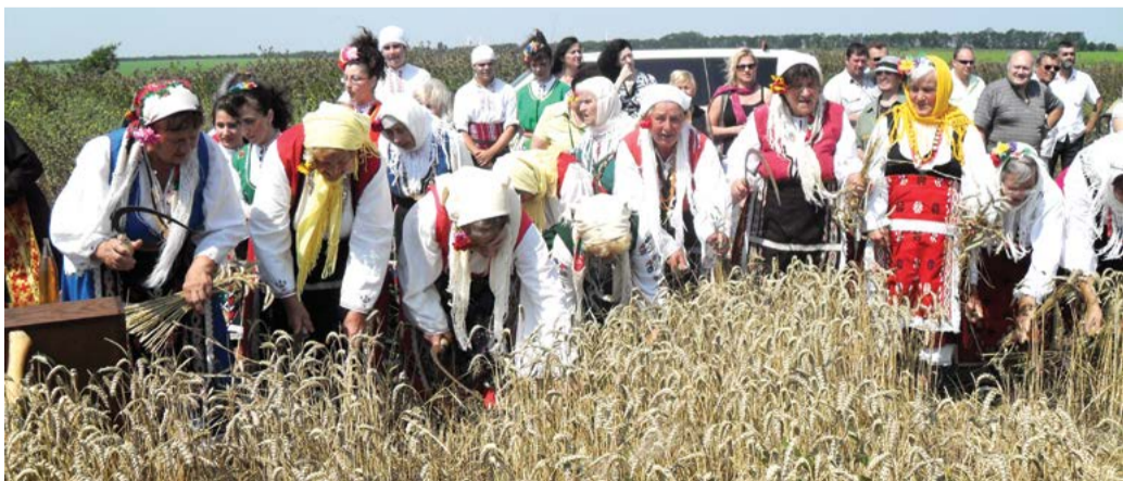
Пресъздаване на обичая „зажъване“ – фестивал „Хляб и мед“, Шабла 2010 година.