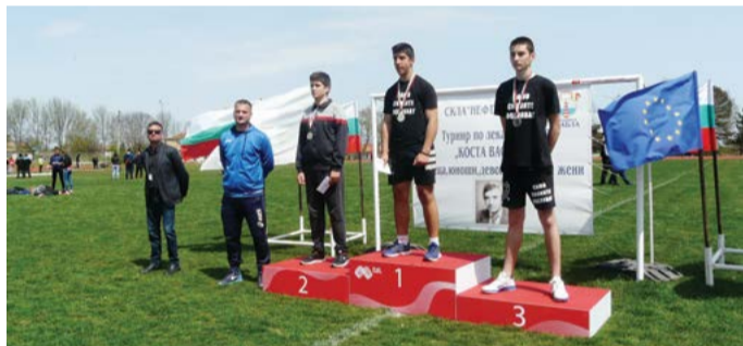
Кадръ от награждаването на турнира по лека атлетика „Коста Василев“, 2017 година.

нефт и газ“ АД. Това е част от ангажиментите на дружеството към общината, поети във връзка със съвместната инициатива по изграждане на голф-комплекс“.