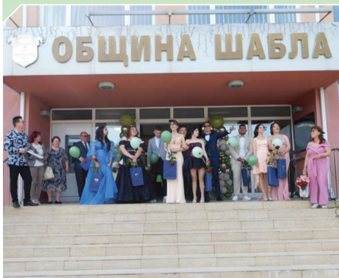
24 май 2024 година – изпращане на абитуриентите пред общината.