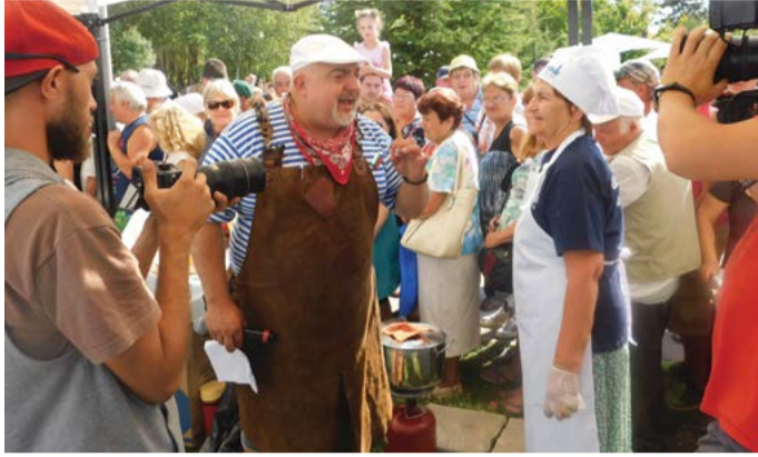
Ути! Просто Ути!

„На 16 септември в пленарната зала в сградата на Общинска администрация – Шабла се проведе среща на общинското ръководство със спортни дейтели