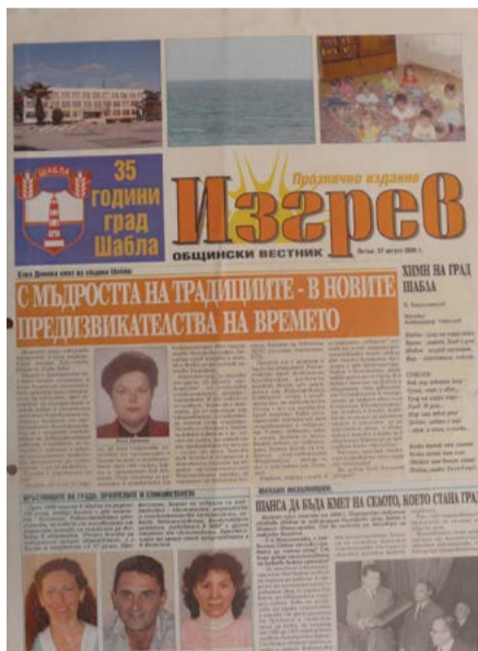
„Пилотно издание“ на вестник „Изгрев“ от 27 август 2004 година по повод 35 години Шабла град.

Брой 81 (26 април 2006 г.) – „НАШ СЪГРАЖДАНИН – УДОСТОЕН С ГРАМОТА ОТ БЧК“, АПЕЛ: „Да има къде да сложим китка цветел!“