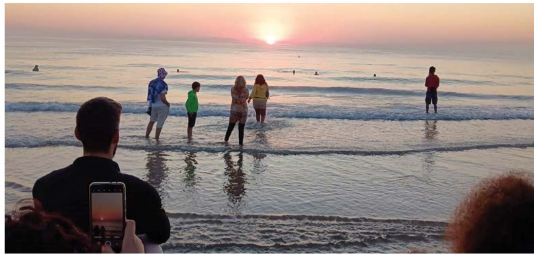
Джулай морнина, 2024 година.

„И ето, най-сетне, появява се слънцето и се възвзема по стръмното било на Персенк. Докато се изкачва то, птиците песни кълтят, върховете бият чела в земята и въздишат, пчелите надуват бръмчилата си с пълна сила, цветовете излъчват най-възшебните си аромати. И всичко заживява и запява, щастливо, че отново е настъпил ден.“