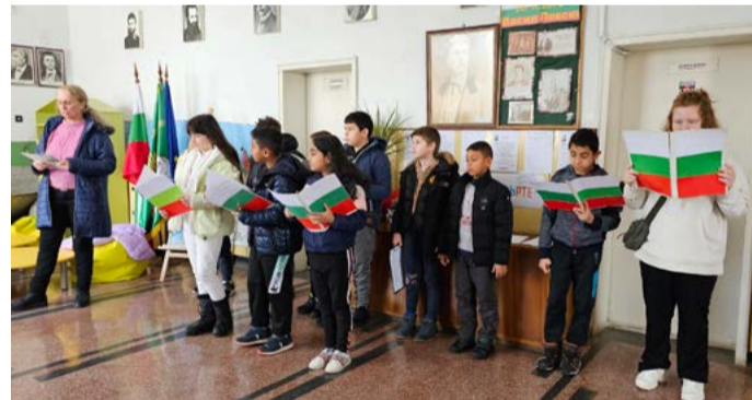
На 19 февруари 2025 година, с четене на стихове за Васил Левски, учениците от ОУ „Св.Кл.Охридски“ с. Дуранкулак отбелязаха 152-та годишнина от обесването на Дякона.