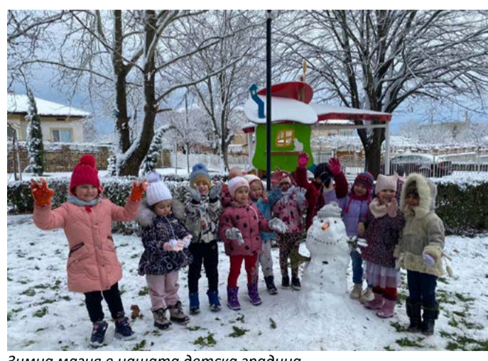
Зимна магия в нашата детска градина.