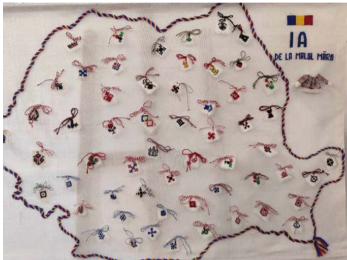
Мартеници от различни области на Румъния.