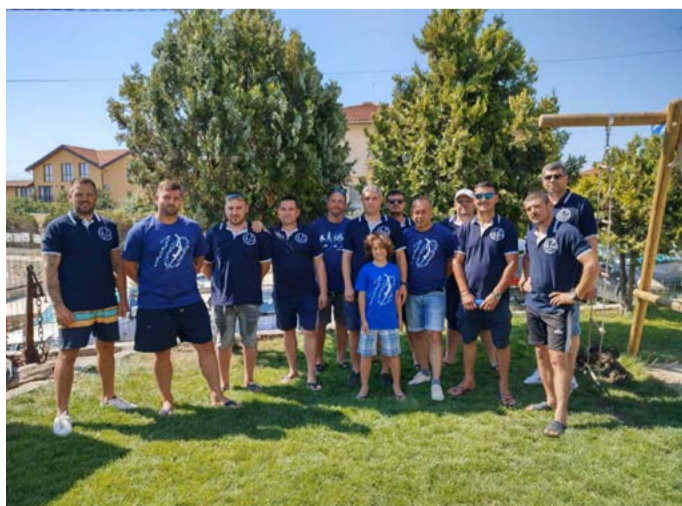
Портус Кариа в с. Тюленово, състезание на купа „Шабла“ 2024 г.

Получихме признание от реномирано жури и в друга сфера, която ни е страст – кулинарията. С дружни усилия в доставянето на рибата и приготвянето, отборът ни спечели наградата „Най-вкусна рибена чорба“ на Празника на рибената чорба в гр. Шабла през 2023,