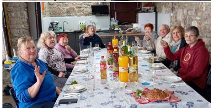
Пенсионерите от пенсионерския клуб спазиха ритуала.