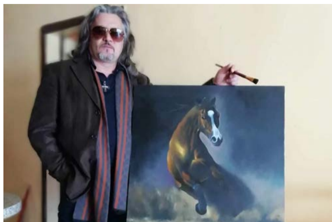
В творческа обстановка.

Изгрев – Не е тайна, че от години живеете в Англия.