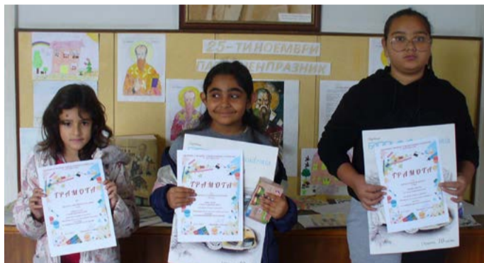
Част от отличените малки художници.

На 22 ноември 2024 година директорът на ОУ „Св.Кл.Охридски“ с. Дуранкулак Маргарита Тодорова награди победителите в училищните конкурси, посветени на патронния празник.