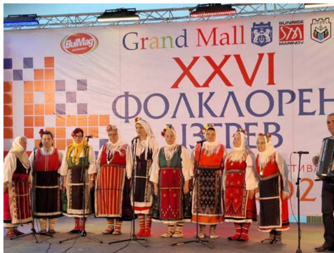
ПГ „Кардарина“ при НЧ „Победа – 1941“ с.Горичане с призовото първо място от фестивала „Фолклорен изгрев“ Варна.

Даренията ще приемаме в детския отдел на библиотеката на НЧ „Зора 1894“ срещу договор за дарение.