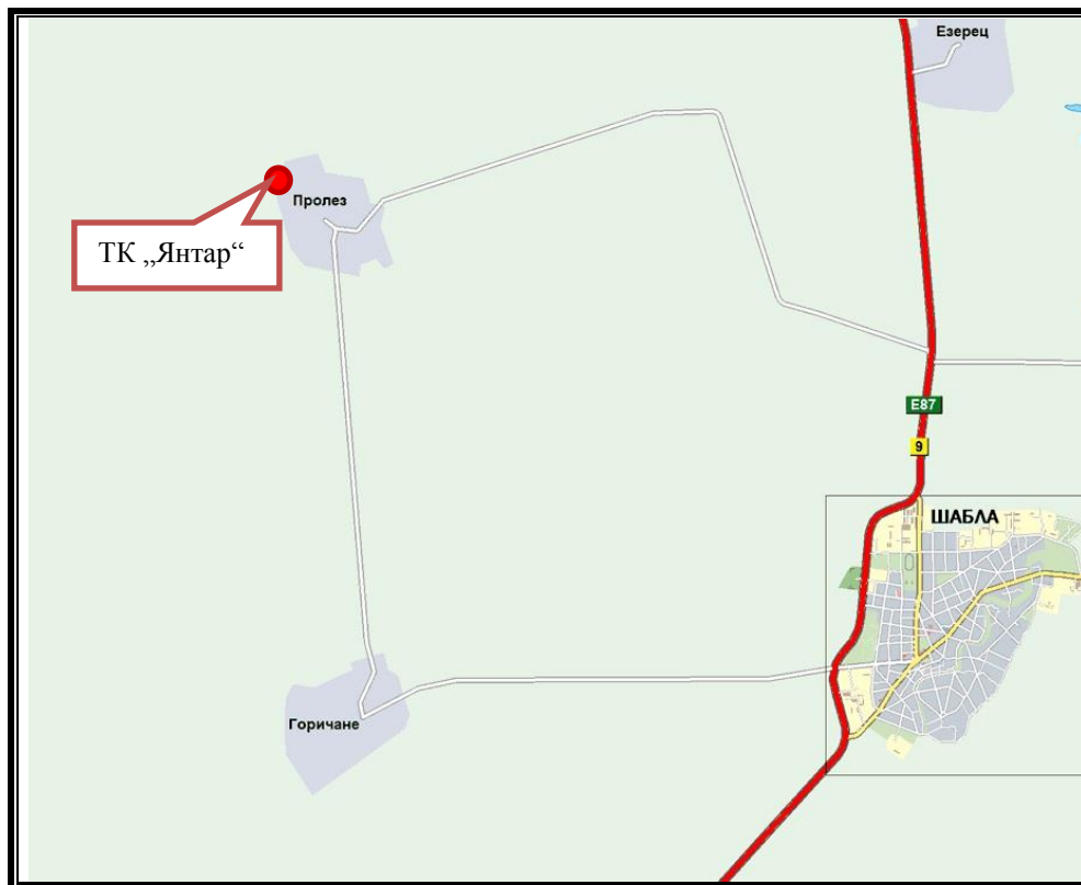
Фиг. 2. Карта със съществуващата пътна мрежа в района на с. Пролез, с. Горичане и гр. Шабла, общ. Шабла с разположение на ТК „Янтар“