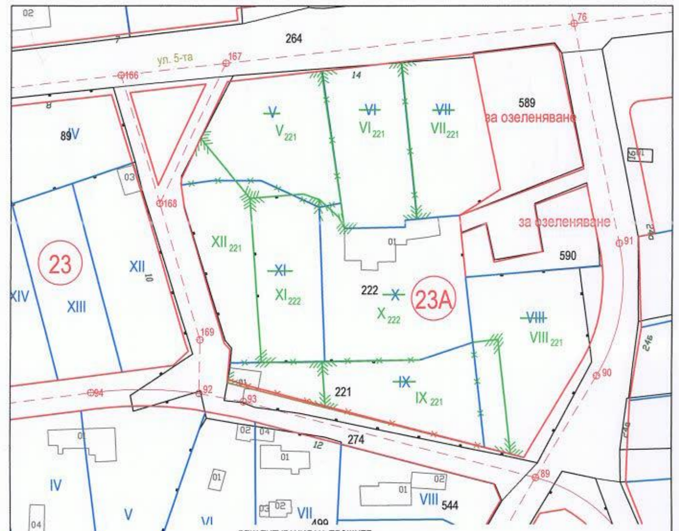
РЕКАПИТУЛЯЦИЯ НА ПЛОЩЕТЕ (м²)