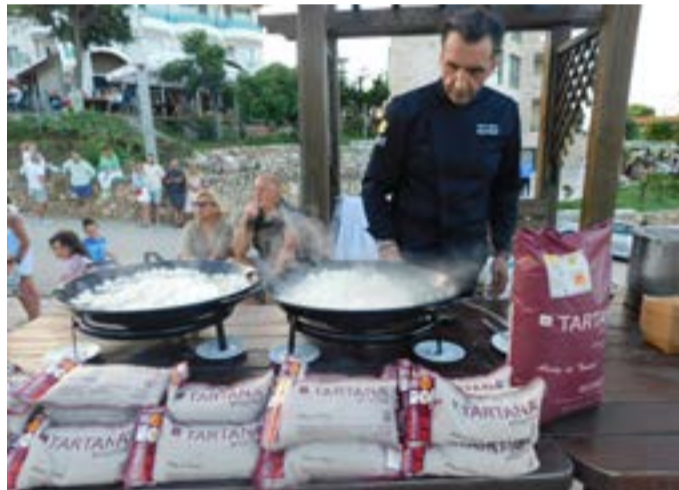
Приготвянето на морска паеля.