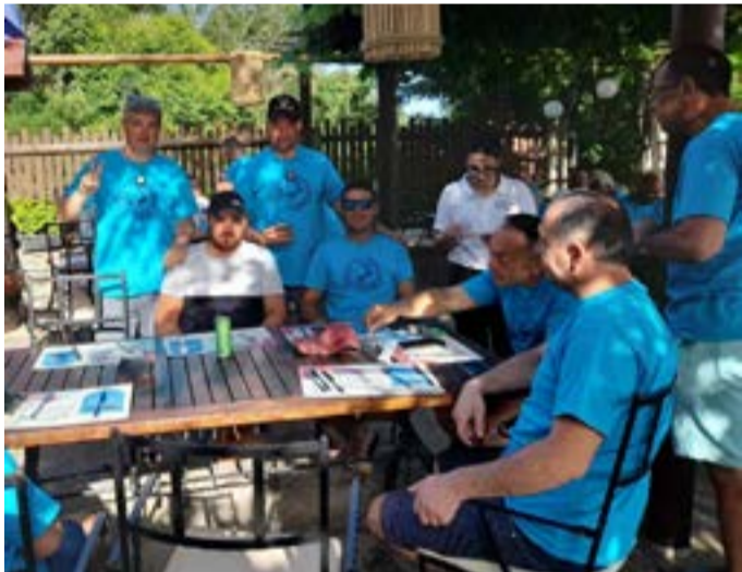
Отборът на Морски клуб „Портус Кариа“, взел участие в състезанието за купа „Бяла“.