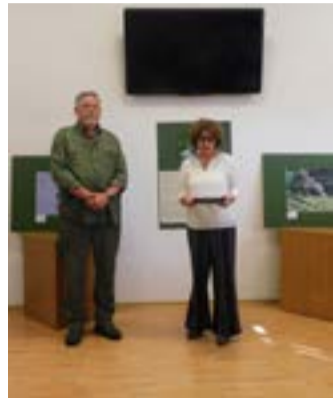
Ръководителят на Зеления образователен център представя гостуващия фотограф.

Много сме щастливи, че Зеления образователен център бе избран като място за популяризиране на полската култура и така стана част от поредицата събития, отбелязващи тази годишнина.