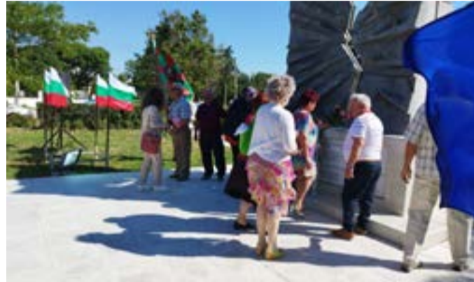
Венци и цветя пред Паметника на загиналите в бунта през 1900 година.