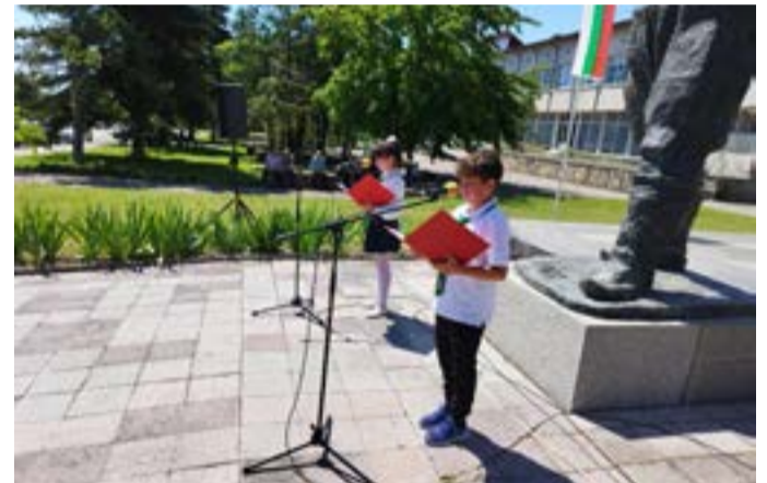
Рецитал на ученици от ОУ „Св.Климент Охридски“ с.Дуранкулак.