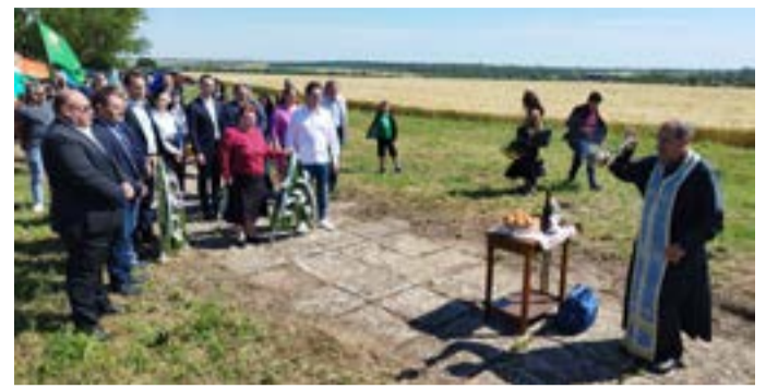
На Грекова могила.

традиция се пренесе на „Грекова могила“, където Отец Атанас отслужи възпоменателна панихида. Към шествието се присъединиха и представители на земеделски партии и организации от страната. Отново всички отдадоха почит към загиналите. Третият етап от церемонията бе пред „Паметника на въстаналия селянин“ в Дуранкулак. Програ-