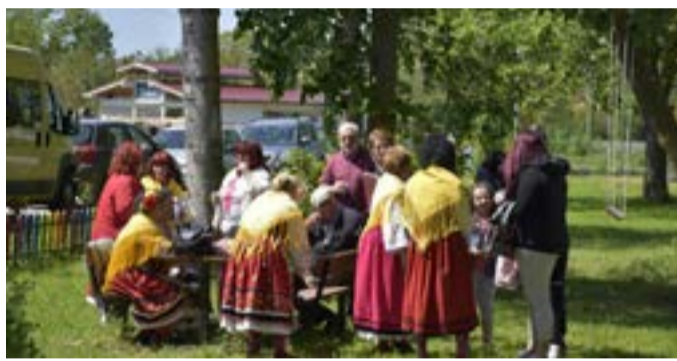
Група от Езерец.