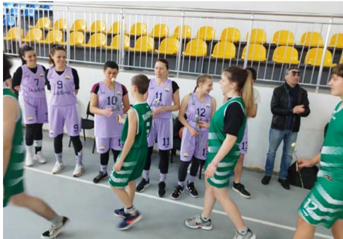
Кадетите от Добрич подаряват цвете на шабленските дами преди началото на мача.