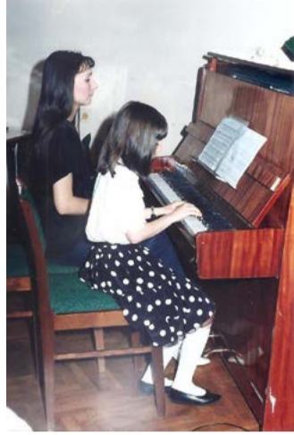
Годишна продукция на читалище „Зора 1894“ Шабла, 30 май 1995 година.