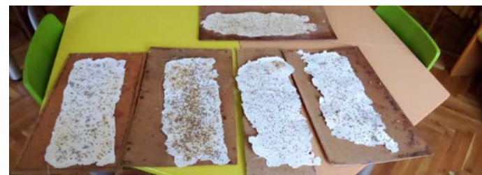
Новата хартия – майстори, учениците от IV клас.