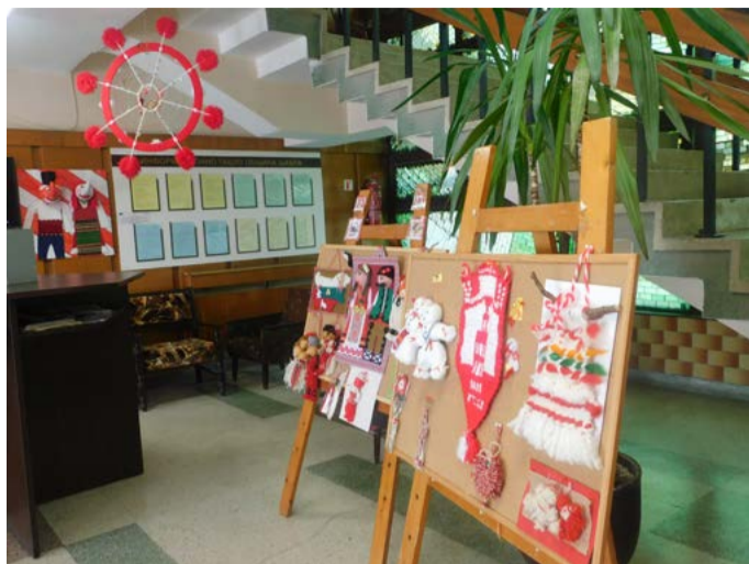
Изложба на мартенички от конкурса във фойето на общинска администрация Шабла.

– „Най-голяма мартеница“ печелят III клас от СУ „Асен Златаров“, гр. Шабла с класен