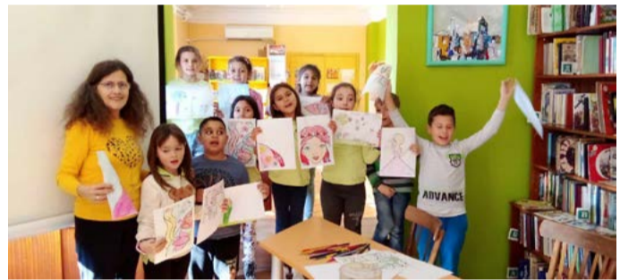
Цветните творби на най-малките.

През миналата седмица в детския отдел на читалищната библиотека се проведе три мероприятия. Десислава Петрова – библиотекар посрещна своите гости – ученици от пети, девети и първи клас.