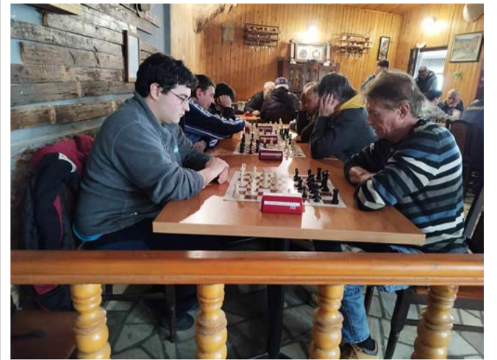
По време на турнира.

Шабла завърши на второ място в регионалния любителски турнир по шахмат, който се проведе на 25 февруари в Дуранкулак. Нашият отбор не загуби нито един мач, но равенството 2:2 с Тервел в първия кръг се оказа решаващо за крайното класиране и Белослав ни изпревари с 1 мач-точка. Решаващият двубой за титлата, по ирония на събрата, се състоя точно във финалния тур. Шабла се нуждаеше от победа, дори минимална, а съперникът от равенство. Срещата бе много оспорвана, но в крайна сметка завърши 2:2 и Белослав вдигна купата.