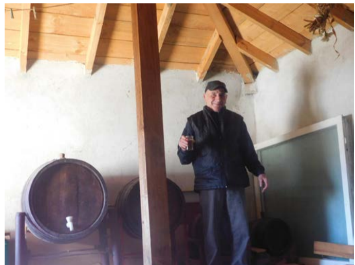
Майсторът, пред своето „творение“...