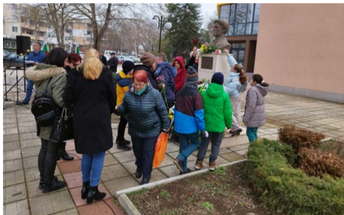
Жителите на Община Шабла отдадоха почит на Апостола.