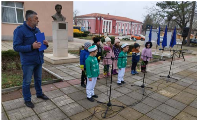
Децата от четвърта група „Смехорани“ на ДГ „Дора Габе“.