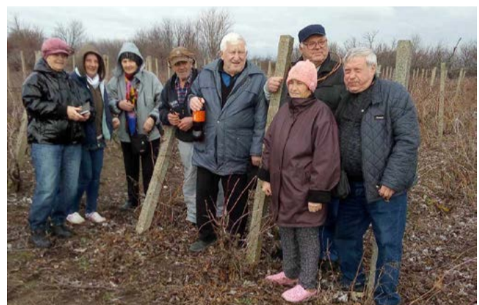
Трифон Зарезан в Тюленово.