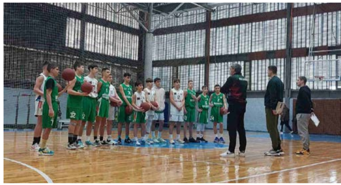
По време на лагера.