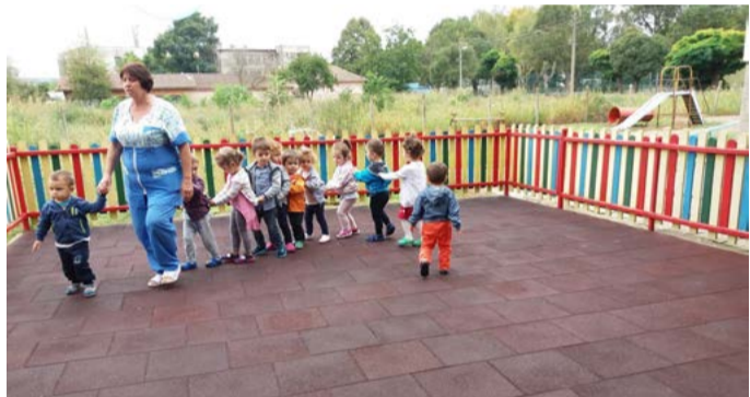
По време на занимание с деца в яслата.

ята. За съжаление и до ден днешен тя си остава недооценена. Най-хубавите ми моменти бяха в детската ясла. Последните години от професионалния ми път. Тук трябва да спомена, че не бях директор в смисъла на думата, който хората най-често разбират – да стоя цял ден на бюро, да разпределям задачите и да върша само административна работа. Аз съчетавах две длъжности – медицинска сестра в групата и директор. Т.е. постоянен контакт, комуникация и занимания с децата. Трудности имаше в началото, докато свикна с всички изисквания, закони, правилници, наредби и пр. Изчетох много