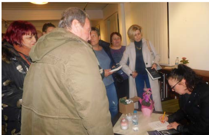
Много бяха желаещите да получат автограф.

га за много неща“. Героите са прототипи на съществуващи хора, с които тя се е запознала, обикаляйки селата Тюленово и Белгун.