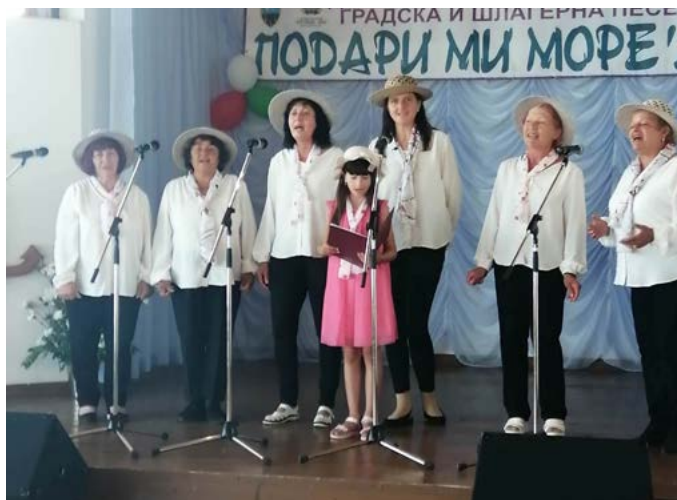
ВГ „Детелина“ с. Граничар.

Наградата на публиката взе хор „Лири“ при дом за стари