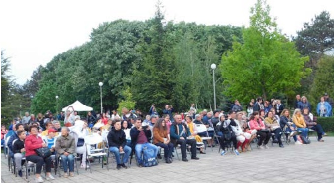
Публиката на „Песни и хора край жаравата“.