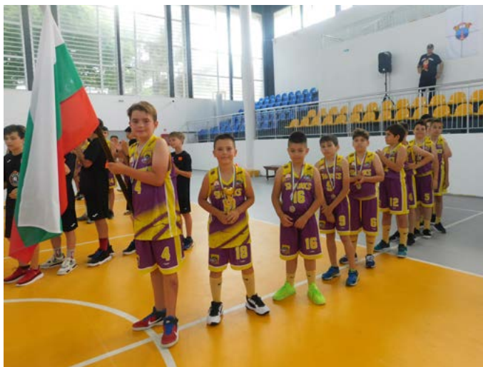
Момчетата от „Акулите“ след награждаването.

При момчетата родени 2012-2013 година първи стана отборът на Варна, следван от Павликени и Шабла. При момчетата в същата възрастова