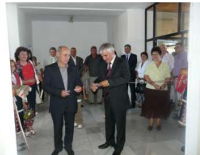
Областният управител Желязко Желязков и кмета на община Шабла Красимир Кръстев, 27 август 2009 година.