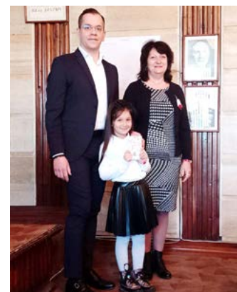
Колективът на ДГ „Дора Габе“

Пожелаваме на Алия да е здрава и все така смело и уверено да крачи по пътя на