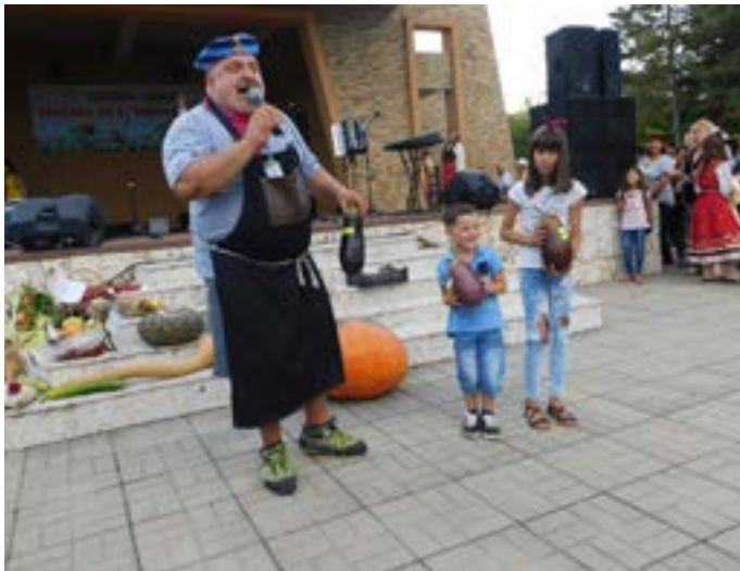
Архив в-к „Изгрев“, 2018 година.

тември 2023 г. Допуска се участие в повече от един конкурс. На кандидатите за участие ще бъде предоставена безплатно изложбена площ, върху която да аранжират своите продукти