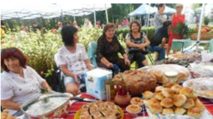
„Най-вкусно тестено изделие“ – с. Граничар.