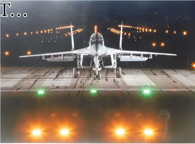
Фотография от пътуващата изложба в Шабла.

ва, летял със самолет през 1910 г.; • авиаторът Симеон Петров пръв в света приземява самолет със спрял двигател през 1912 г.; • също той, осъществява първата в света нощна бомбардировка по време на Балканската война; • Симеон Петров прави и първото в света разузнаване и бомбардиране над противникова столица – Цариград; • Райна Касабова е първата жена в света, извършила боен полет над Одрин по време на Балканската война. • през 1913 г. Милчо Митев и Джовани Сабели осъществяват първото в света прелитане от континент на континент; • първото военно летище в света е край Мустафа паша (сега Свиленград), откъдето е действало 1-во аеропланно отделение по време на Балканска-