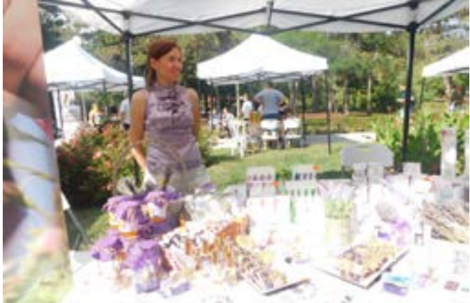
Специална награда на журито, на Празника на плодородието 2023 година за семейно участие – производители на продукти от лавандула, с.Дуранкулак.