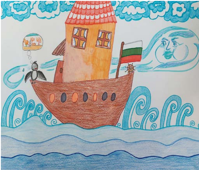
Илюстрация върху приказката „Майчина сълза“ - Ванеса Радева (3 клас)