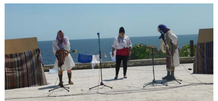
В края на програмата, самодейците от НЧ „Димитър Минчев 1896“ с.Паскалево, представиха театралната постановка „Женско царство“.