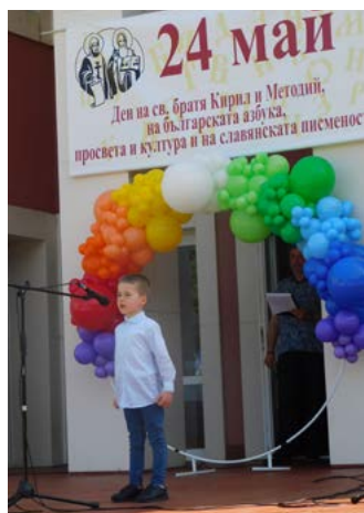
И най-малките с гордост ре- дяха стих след стих в просла- ва на двамата братя.

Последните участници бяха самодейците от детски танцов състав „Бърборино“ с ръково-