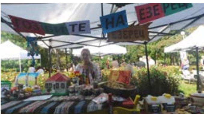
„Най-нестандартният щанд“ на с. Езерец.