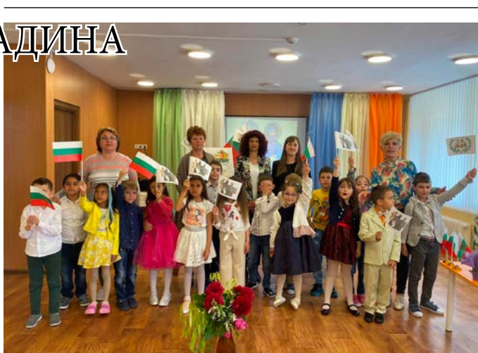
Най-големите рецитатори, техните учители и журито.