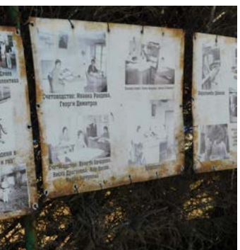
Експонираната на площад „Морски“ в Тюленово изложба от архивни снимки.

наместник на селото, поздрави присъстващите и каза, че „две неща бележат историята на селото – първото е присъствието на тюлени-монах по брегове-