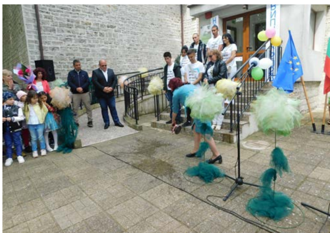
Директорът ливна символично менче с вода.