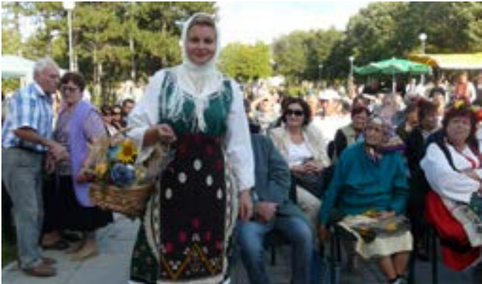
2013 година - началото