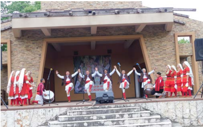
ТШ „Възрожденци“ Варна.