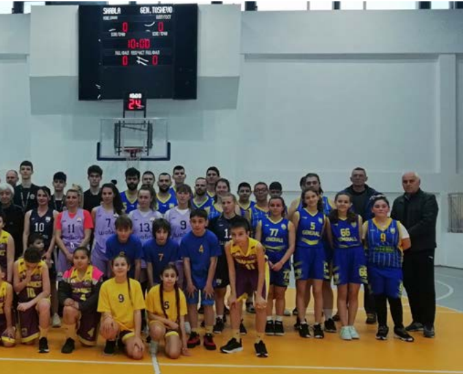
Обща снимка за спомен след края на баскетболния празник.