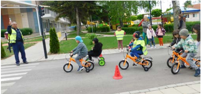
И практическите ситуации не затрудниха малчуганите.