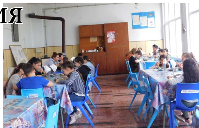
Всеки ученик или учител си има постоянно място.