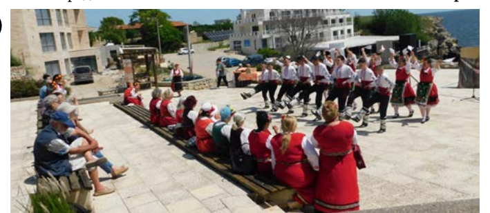
„Бърборино“ се погрижи за настроението на тюленовци и гостите на селото.