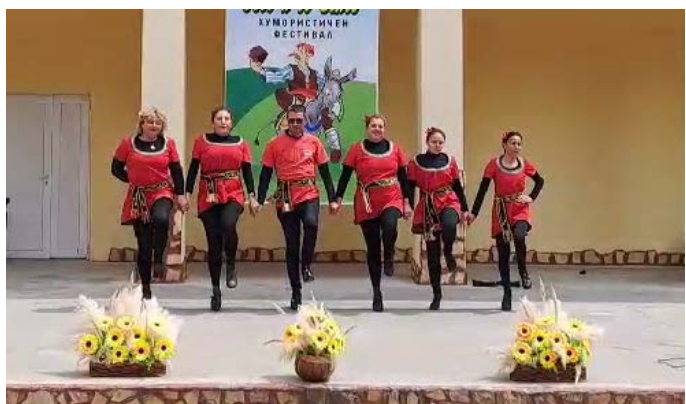
Танцов клуб „Кибела“.