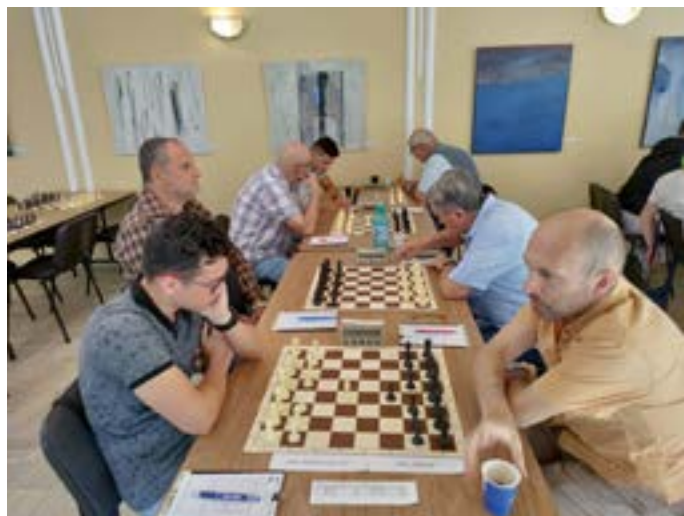
„Хармония 25“ в началото на мача срещу „Враца“.

би от шампиона „Бургас 64“, но с минимален резултат 1.5:2.5. Така се стигна до ситуация, в която „Враца“ и „Хармония 25“ финишираха с равни мач-точки, брой точки и 2:2 в двубоя помежду си. Четвъртият допълнителен показател, Коефициент „Бергер“ (по-добри резултати срещу по-предно класирани противници), оба-