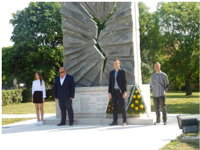
Кметът на общината пред паметника в Шабла.

Всяка година на 1 юни, граждани, представители на обществени, образователни, политически и земеделски организации и сдружения в Шабла, и на общинска администрация Шабла, отдават почит с цветя и венци пред паметта на обикно-