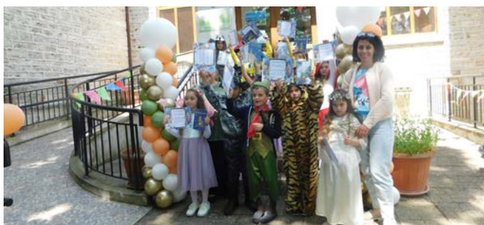
С грамота и книга артистите запечатаха своето представяне.