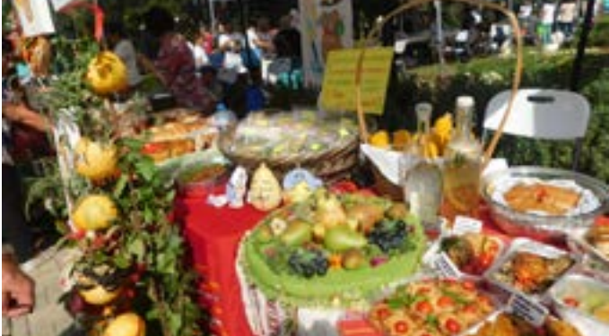
Най-добре аранжираният щанд на с. Тюленово.