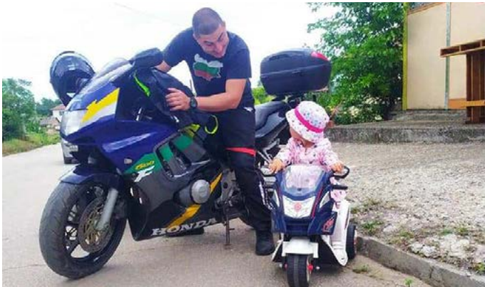
Приемственост на поколенията – баща и дъщеря на откриването на мотосезона.