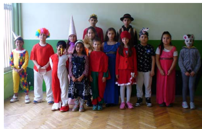
Карнавал, карнавал, весел детски карнавал.