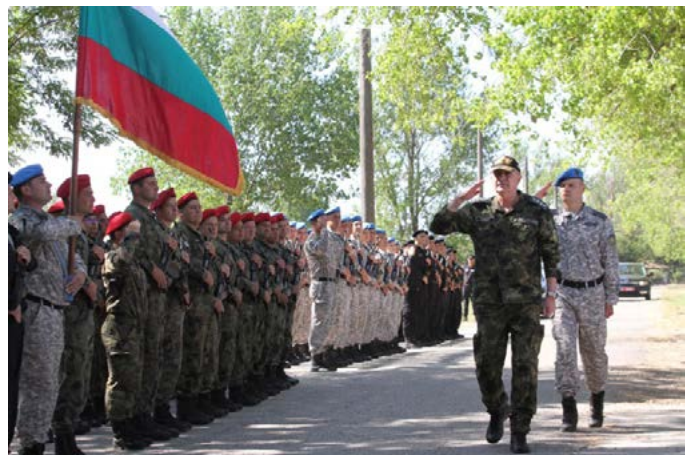
Адмирал Емил Ефтимов приема строя.