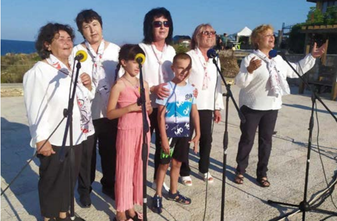
Самодейците от Граничар.