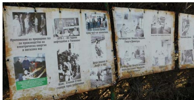
Експонираната на площад „Морски“ в Тюленово изложба от архивни снимки.

На 31 май, село Тюленово отбелязва своя празник. Датата не е избрана случайно. На този ден през 1951 година е открит първият нефт в Тюленово.