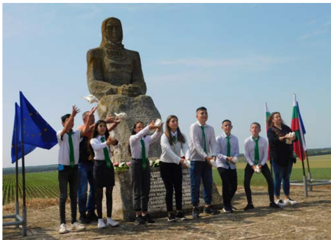
На Грекова могила ученици от Дуранкулак пуснаха гълъби в небето.

вения селянин, тръгнал на борба срещу социалната неправда. Паметните места: паметникът на бунта от 1900 година в Шабла, паметникът на скърбящата майка на Грекова могила и този на въстаналия селянин в центъра на Дуранкулак, събраха жи-