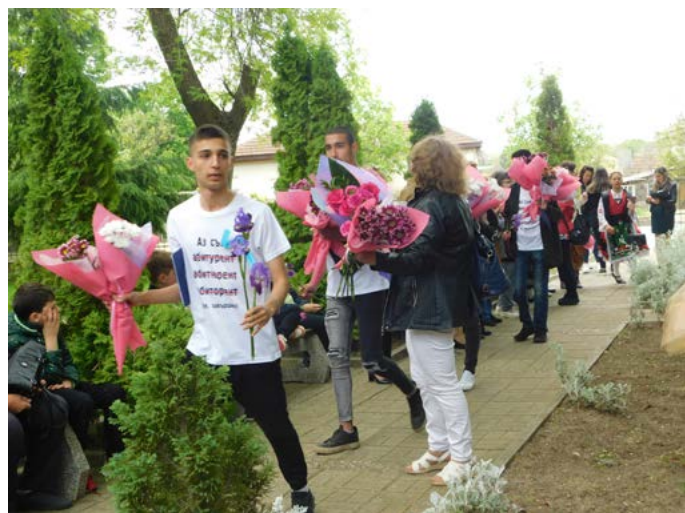
Близки и приятели посрещнаха абитуриентите в двора на Зеления център.