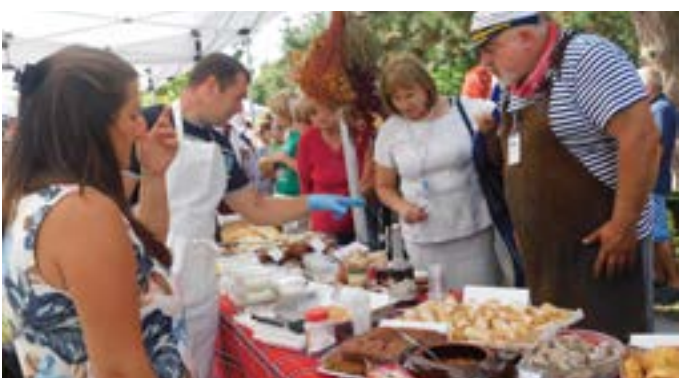
Най-характерен обреден хляб – с. Дуранкулак.