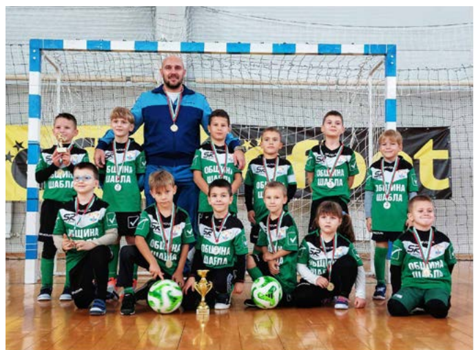
Бъдещите шампиони на Шабла и техния треньор.

На 02.12.23 година новосформираният футболен отбор от деца родени 2016 и 2017 година, взе участие в турнир, който се проведе в спортната зала на град Суворово. Малките ни състезатели се представиха повече от достойно, въпреки възрастовото предимство, което имаха съперниците.