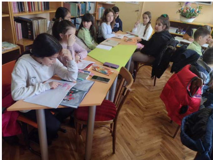
Учениците от IV клас.