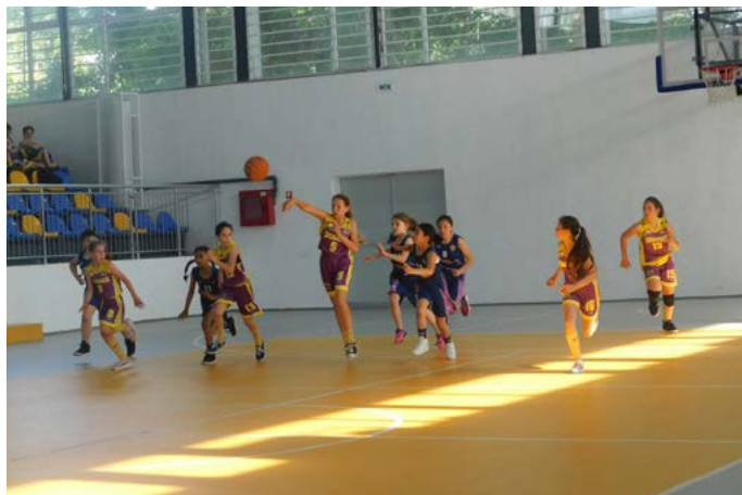
Кадър от срещата между отборите на Павликени и Шабла.

Официално турнирът бе открит на 15 юни от кмета на община Шабла Мариан Жечев. Пред строените отбори в Спортния комплекс, той