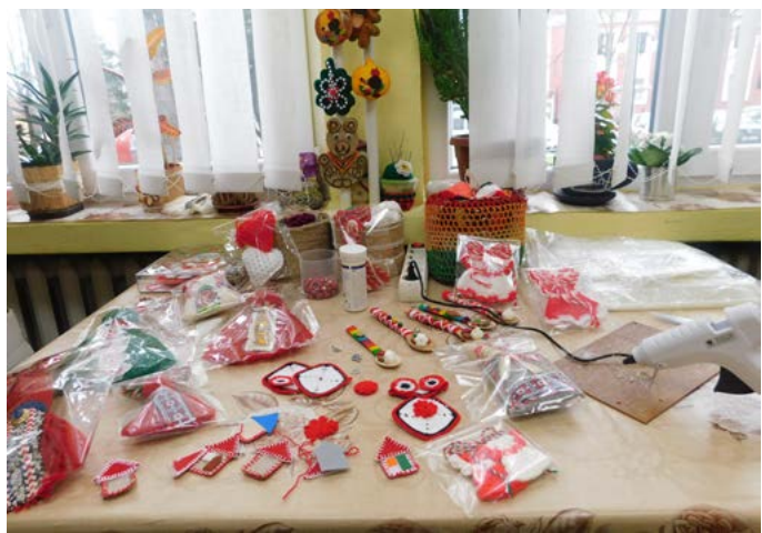
В работилницата на центъра за социална рехабилитация и интеграция.