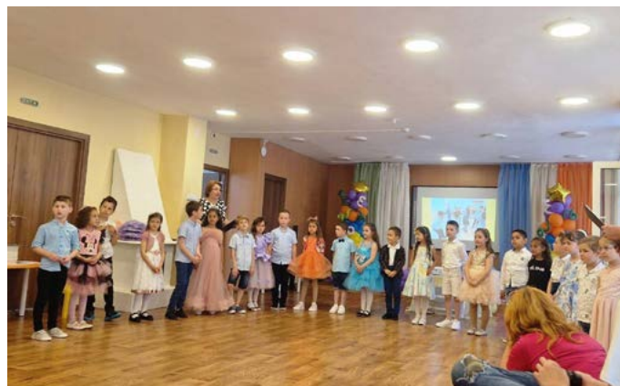
„Довиждане детска градина“! казаха бъдещите първокласници от четвърта група „Звездичка“ при ДГ „Дора Габе“ - Шабла.

гр. Добрич 9300, ул. „Генерал Гурко“ № 4, Дом-паметник „Йордан Йовков“ (за конкурса). Телефон за контакти: 0884 311 492; 058/ 602 213 Краен срок: 30 септември 2023 г. Радио „Добруджа“