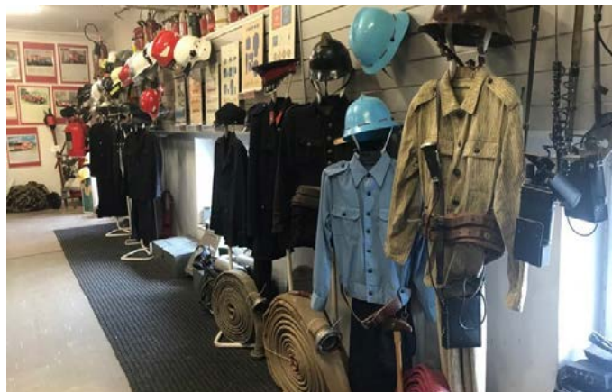
В музея на противопожарното дело в с. Папротня, където могат да се видят пожарни коли, униформи и оборудване от преди близо век.

„Впечатлен съм от вековната традиция в дейността на