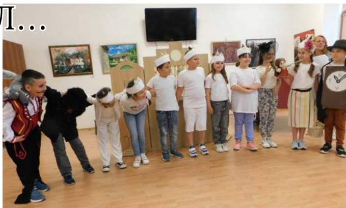
Малките, големи артисти.

ва поздравиха участниците и техните гости с примимерата на „Вълкът и седемте козлета“. Едно брилянтно първо представление, достойно за всяка сцена.