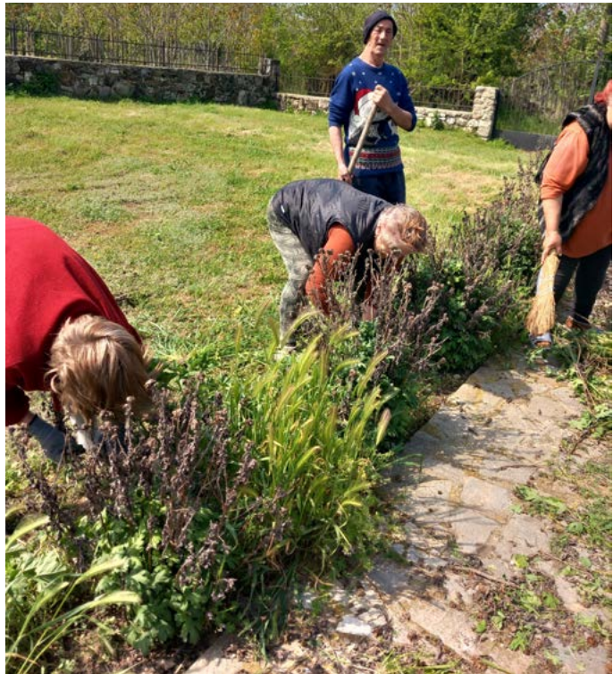
Доброволци от село Горичане в акция по почистване на двора около църквата.

ПРЕДПЕЧАТНА ПОДГОТОВКА: Марин Цанов ПЕЧАТ: Печатница "Влади" – В. Влаев, Каварна