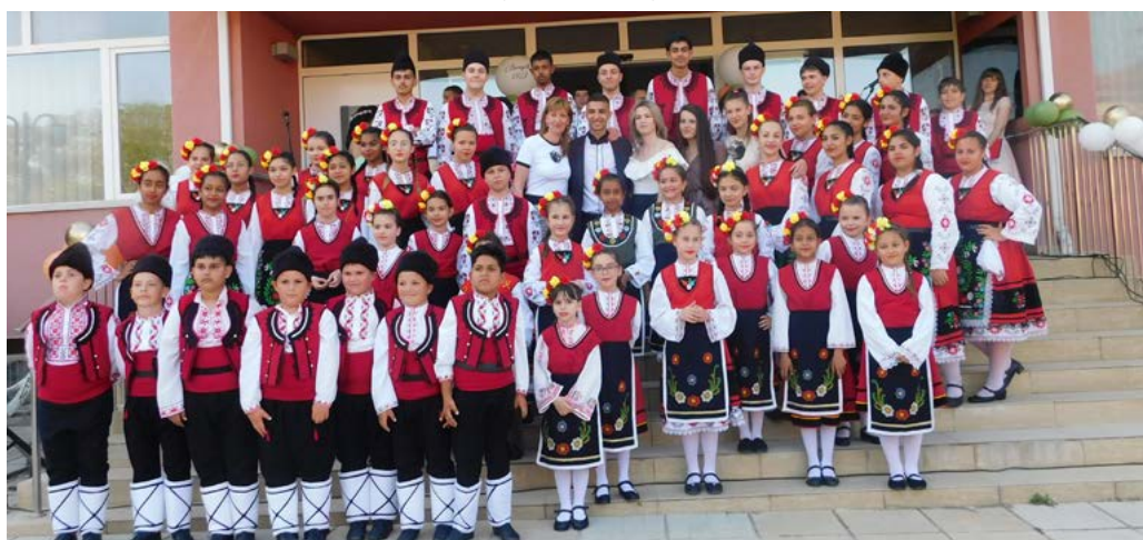
Всички самодейци от „Бърборино“.