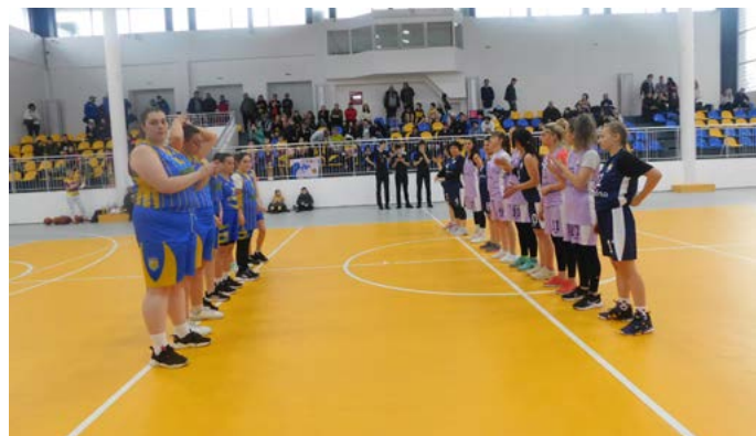
Преди началото на мача на жените.