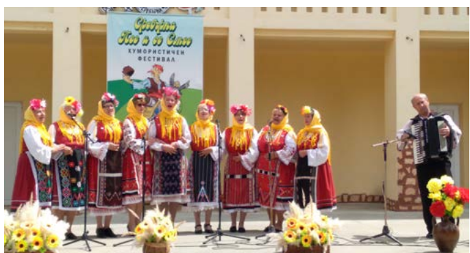
Групата за народни песни.