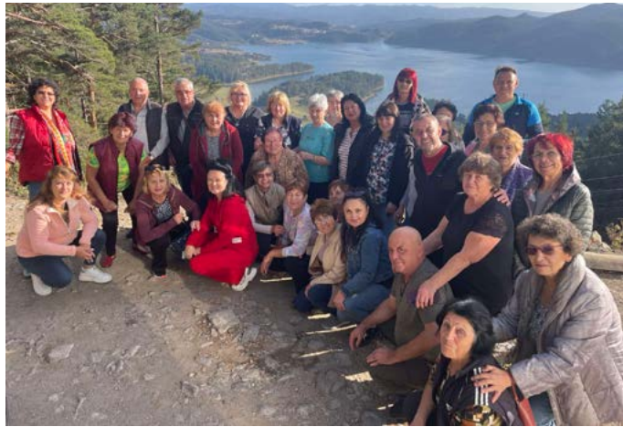
На язовир „Доспат“.

Вторият ден след обедната ни разходка бе до гр. Констандово – с. Дорково в самия град Велинград. В Констандово посетихме известния кили-