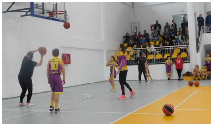
Родителите в действие.