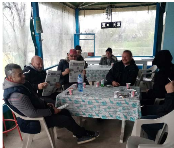
Сутрините в Езерец са вече тихи.