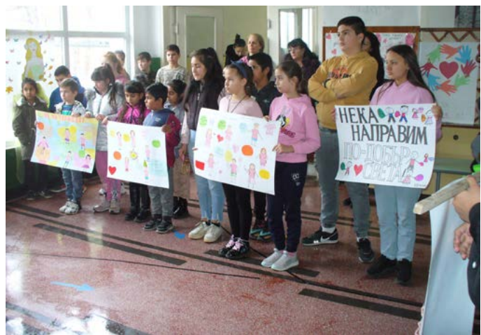
Отбелязването в Дуранкулак.