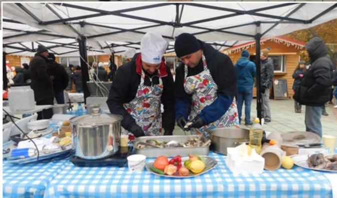
По време на кулнарната надпревара.

така известната саламурика и не на последно място – пре-