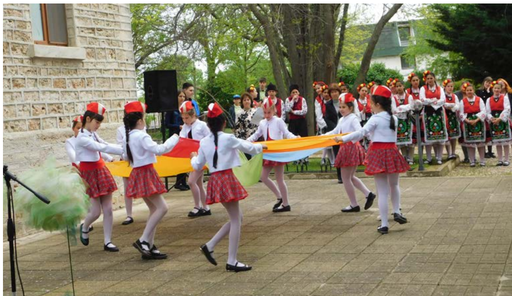
Танцът на мажоретките. От страни чакат танцьорите от „Бърборино“.

„На добър час, пораснали деца!“ – каза директорът.