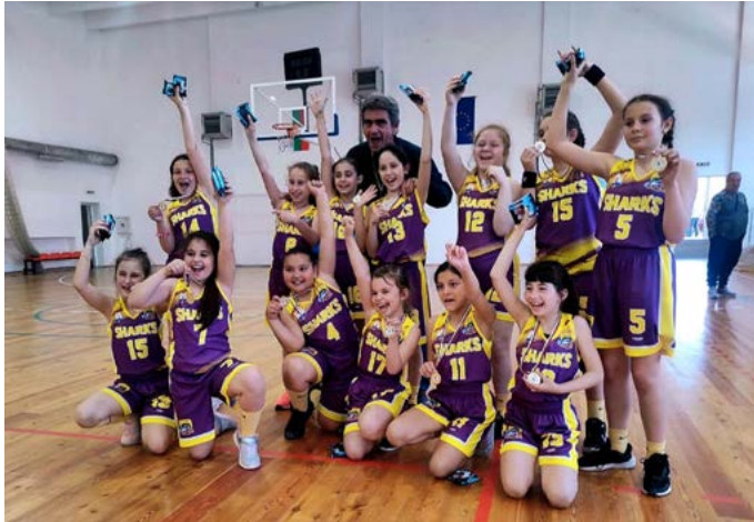
Момичетата "Акули" на Великопреславска земя.

И така, равностметка: Отново баскетболната зала е пълна с деца. От първи до осми клас