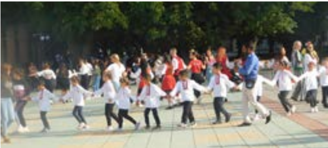
Малки и големи се заловиха на хоро.

запна тълпа“. Представлява предварително запланувана и организирана масова акция, в която голяма група хора се появява внезапно на обществено място и в продължение на броени минути изпълнява някакво действие, след което се разотитва също така внезапно, все едно нищо не се е случило. Флашмоб