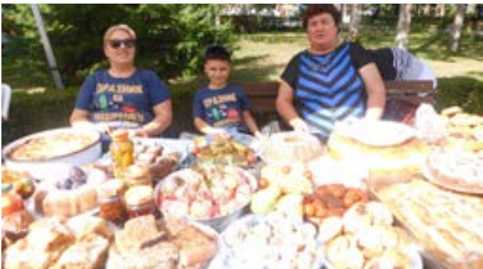
Най-вкусни местни и национални ястия – с. Черноморци.