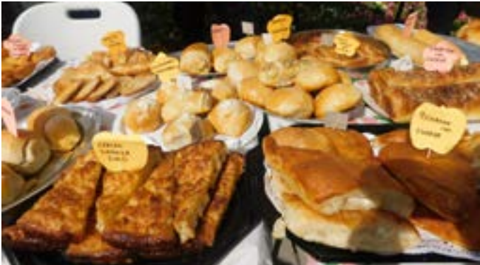
Най-богат щанд – с. Пролез.