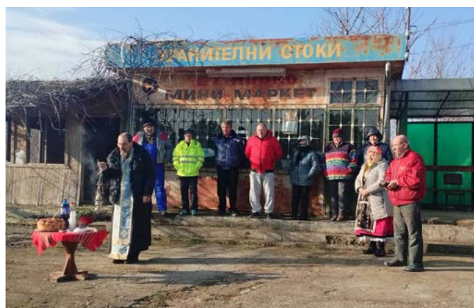
Празникът в с. Граничар.