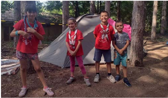
Вълчетата от СК „Ястребите“ Шабла.