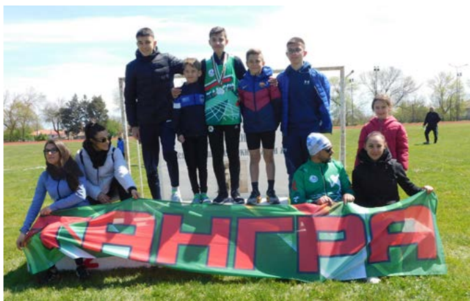
Младите състезатели на един от отборите, които за пръв път участват на турнира „Коста Василев“ – СКЛА „Тангра“ Варна.

Рано сутринта в съботния ден започна атлетиката за деца, като най-малките състезатели са родени през 2014 г. Най-големите участници в „Атлетика за деца“ бяха родените през 2009 година. В рамките на продължилата до обяд „Атлетика за деца“, се проведе дисциплина