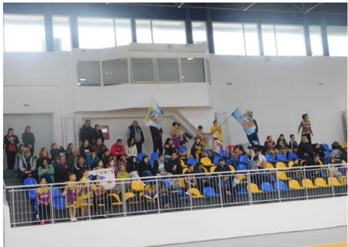
Публиката на баскетболния празник.