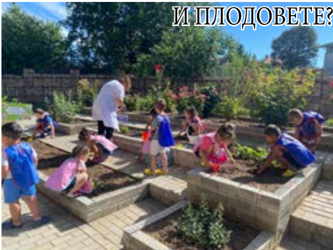
Малките градинари от ДГ „Дора Габе“...

Какво е необходимо на цветята, за да поникнат?