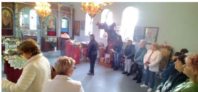
Жители на общината уважиха храмовия празник на църквата в Дуранкулак – 8 ноември, Архангеловден.

ЗЕЛЕН ОБРАЗОВАТЕЛЕН ЦЕНТЪР, гр. Шабла, ул. „Равно поле“ 57А, тел. 05743/ 42 00; имейл: greencenter@ob-shabla.org