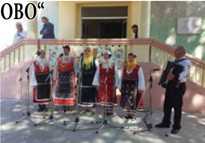
Групата от Шабла