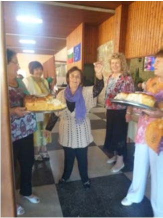
Празнуващите бяха посрещнати с хляб и сол.