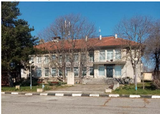
Подмени се и осветлението пред НЧ „Зора 1942“ в селото.

вече от 10 години не можем да завършим църквата в селото. Намерихме спонсори, но има-