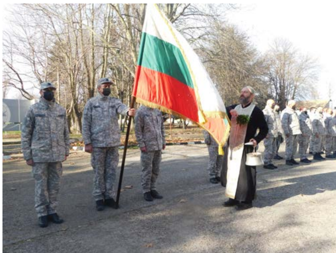
Традицията на Йордановден да се освещават и бойните знамена в шабленското поделение бе възстановена.