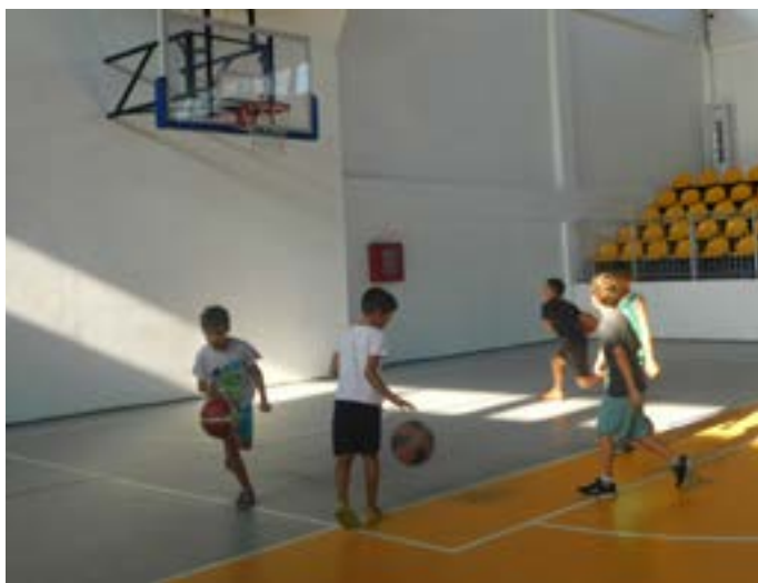
Бъдещите баскетболисти на Шабла.