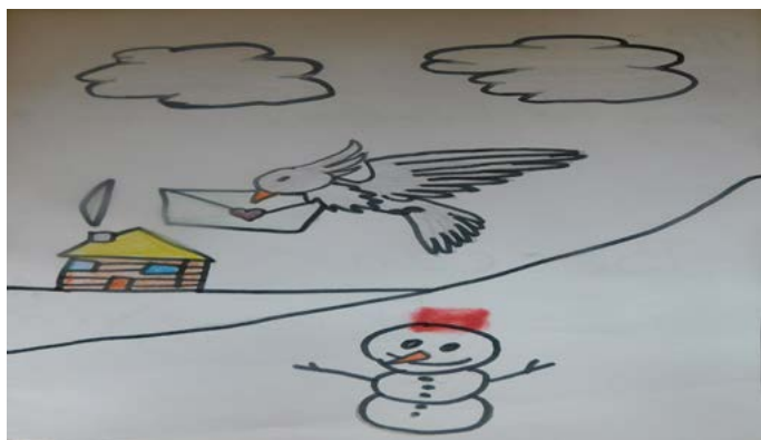
Стелияна Атанасова, 9 г. (Дуранкулак)