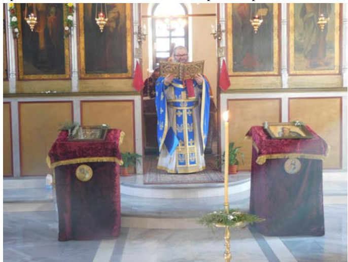
Отец Константин води празничната света литургия.

на св. Харалампиий - покровител на пчеларите. Архимандрит Константин