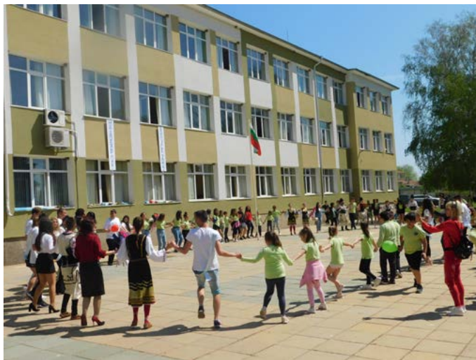
Всички на хорото...