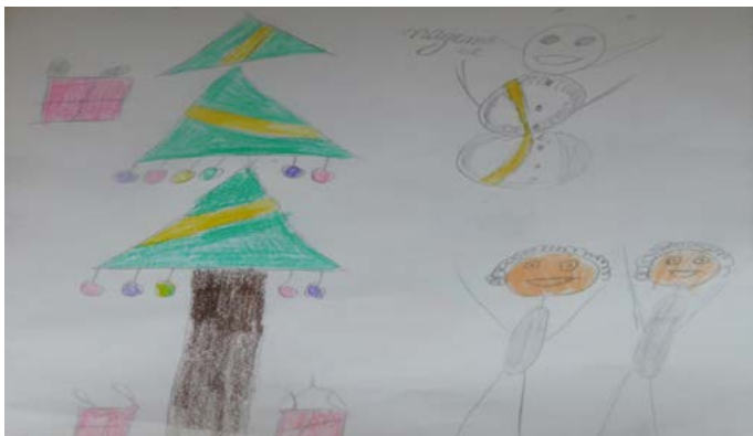
Божидар Пенков, 9 г. (Дуранкулак)