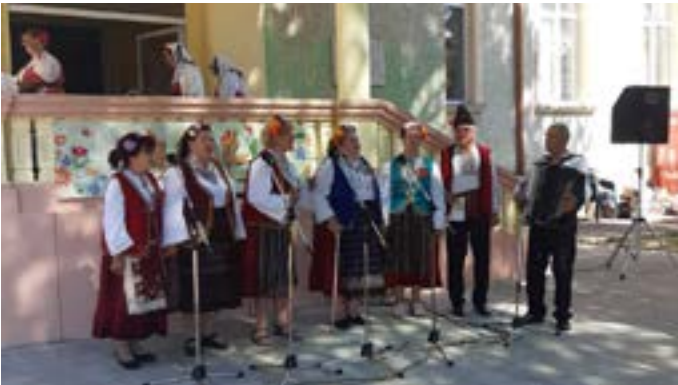
...и тази от Крапец