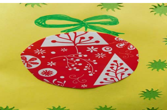
Пламена Юлиянова, 6 г.