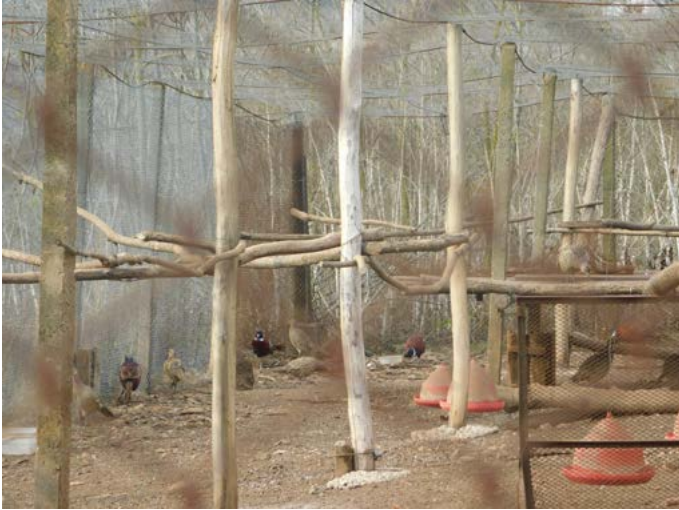
Фазанарията във Ваклино.

щината. Местата са определени като ловни райони. Ловуваме основно диви свине и хищници. От дребния дивеч – фазани, яребици, зайци, горски бекаси и водоплаващ дивеч. Сърни и елени имаме, но не ги отстрелваме, защото са под запаса.