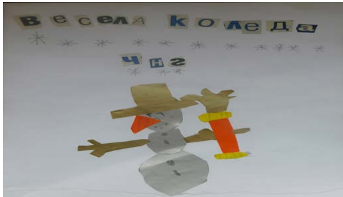
Петко Франгов, 8 г.