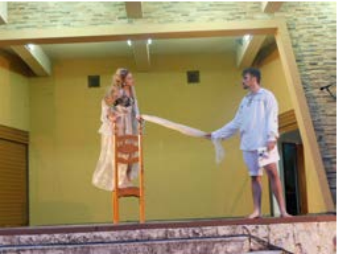
Момент от постановката.

миерата на спектакъла. Сред публиката беше авторът, а режисьорът се превъплъти в роля на сцената.