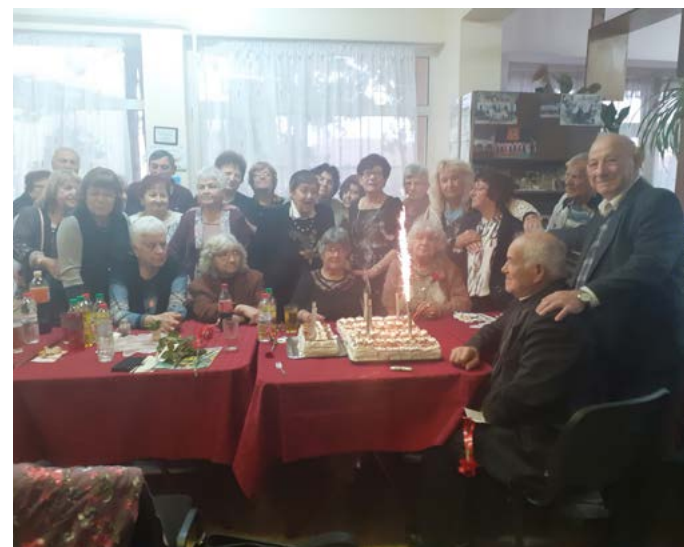
Празнуващите в ПК „Надежда“ Шабла – родени през първите девет месеца, 24 ноември 2022 година. Да са здрави и честити!