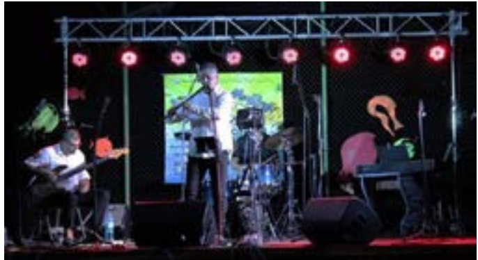
Вече и големият Теодосий Спасов свири на джаз-феста в Езерец...

авторски произведения, съчетани с фолклор, неравноделни размери, етно и джаз, смесени в магическо озарение. На Преображение Господне, поляната се