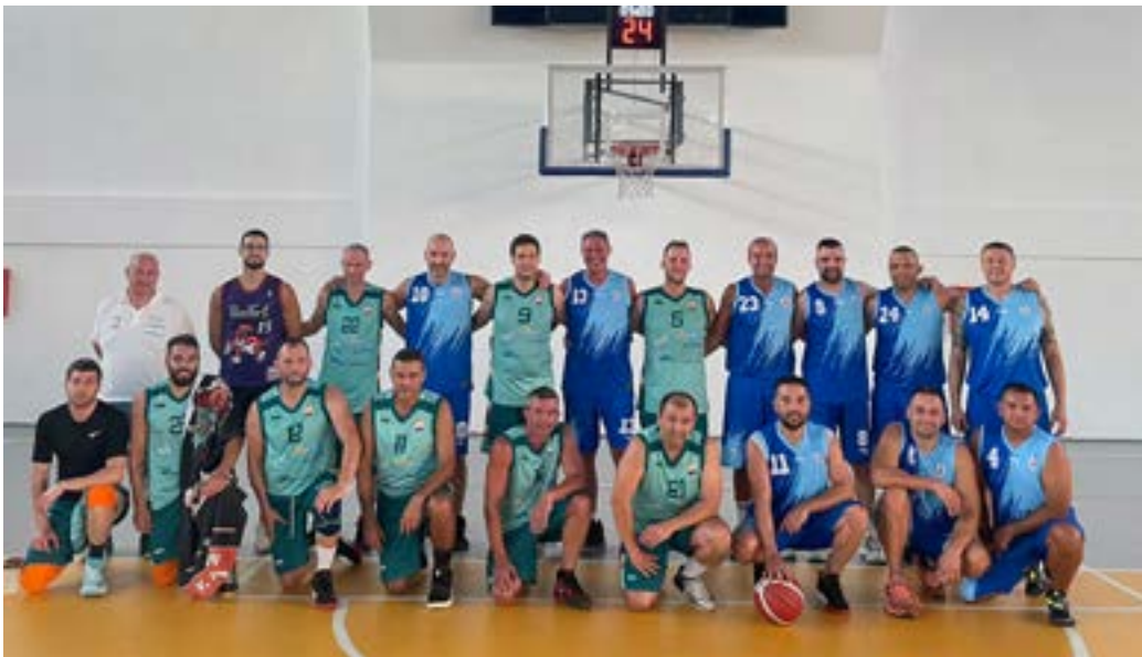
Двата мъжки тима.