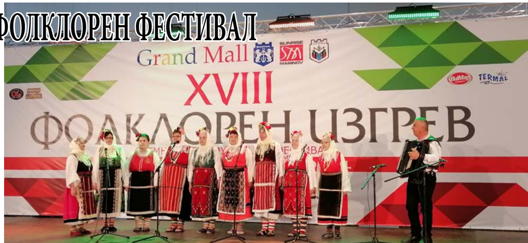
Фолклорна група „Добруджанка“