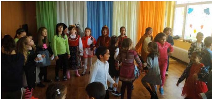
Празнуващите и гостите-артисти се забавляваха заедно.

На 25 ноември 2022 г. по традиция се проведе честване на рождените дни на всички възрастови групи на ДГ “Дора Габел”. С танци, песни и стихотворения открихме празненството, а децата от ОДК представиха постановка, в която герои от различни приказки