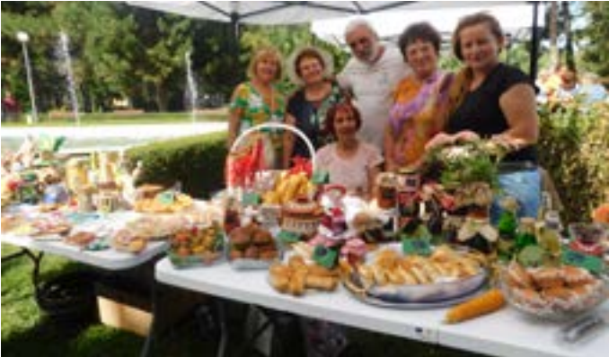
Красиво и вкусно беше на щанда на Центъра за социална рехабилитация и интеграция Шабла.

При желание – носете Вашето старо Лего в ОДК-Шабла, ул. „Комсомолска“ 12 Забележка: Ще приемаме само конструктори на тази марка.