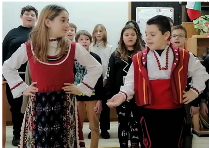
Четвъртокласниците се включиха с фолклорни изпълнения.