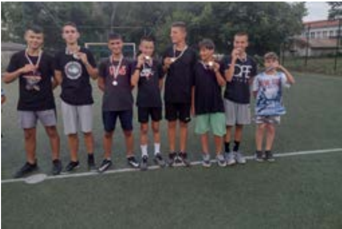
На финал отидоха младите футболисти от Крапец.

кулак с категоричното 3:0. За третото място играха Каварна срещу Дуранкулак, като победи отборът на съседния ни град с 2:0. На финала отбора на Кра-