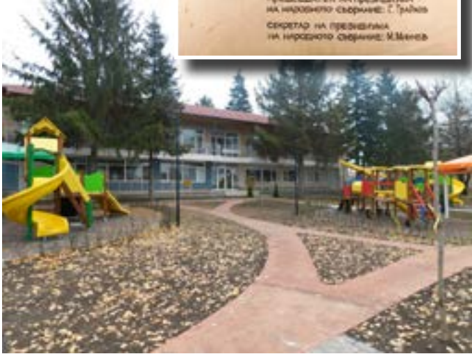
ДГ „Дора Габе“ Шабла – вторият дом за малчуганите.