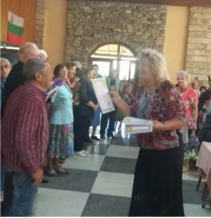
Грамоти за юбиларите.

Кметът на общината лично поздрави всички и изказа своето уважение към пенсионерите. Прочетен бе и поздравителен адрес от председателя на Об-