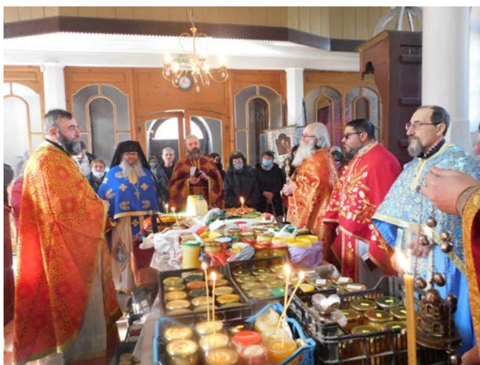
Освещаването на меда.