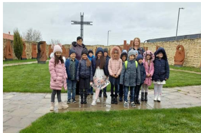
В Двора на кирилицата в Плиска

Един от най-големите празници за учениците от първи клас е Празникът на буквите.