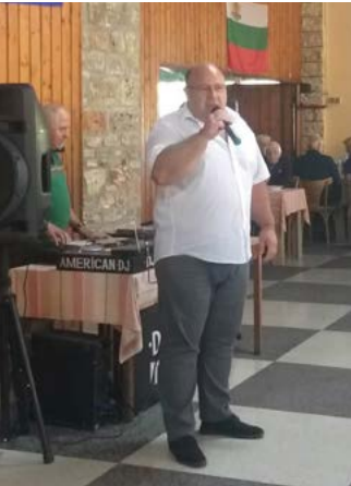
Кметът на общината поздравява възрастните хора.

Въртят се сезоните. Пролет, лято, есен! Есента е красив сезон. Не случайно я наричат „Златна есен“, а възрастта на пенсионера „Златна възраст“. Затова и първи октомври е избран за празник на възрастните хора!