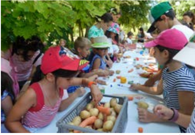
От моркови и картофи малчуганите направиха произведения на изкуството.

След това, малчуганите изгледаха приказката на Андерсен „Каквото направи дядо, все е хубаво“, изиграна от театралната труп. Придобедната програма завърши с изработването на „Кукли от фермата“ - еко работилница за кукли от зеленчуци.