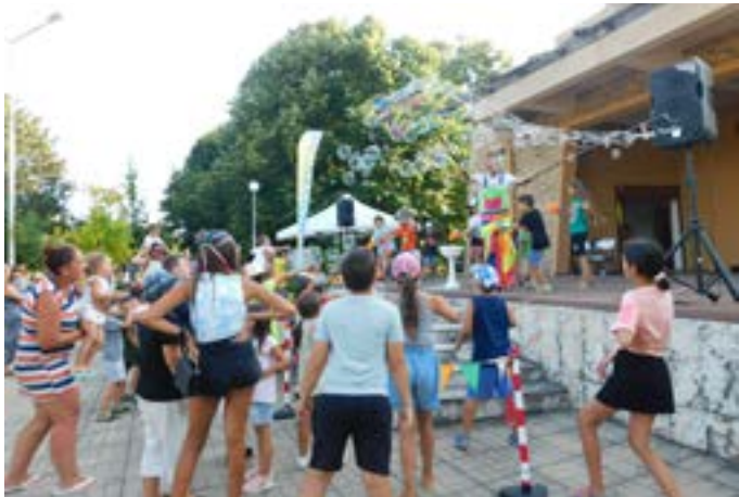
Впечатляващо шоу със сапунени балони.

За първи път фестивалът представи в Шабла и интерак-