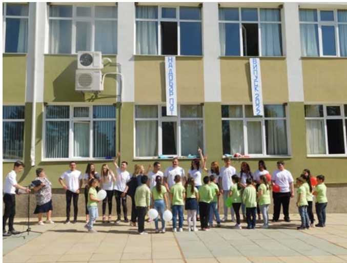
Първокласниците „поеха щафетата“ от абитуриентите

Мирослава Димова-Франгова, администратор на ФБ-група „Шабла помага“