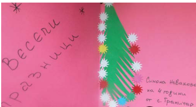
Симона Новакова, 4 г. (Граничар)