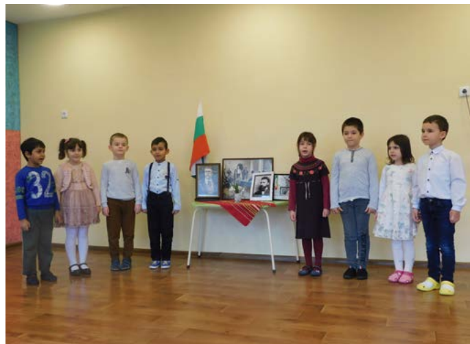
Поклон пред героите на България

Традиция в детската градина е подготовителните групи да отразяват всички национални и фолклорни празници. Учителите, подпомагани от родителите, подготвят своите възпитаници за тези изяви. Децата са желание и лекота, заучават стихове, песни и танци. Стремим