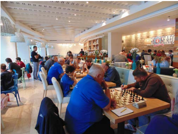
Турнирът през 2017 година в с. Тюленово.

ничения във връзка с Ковид епидемията. Първото издание на Фестивала е през 1994 година на Къмпинг „Добруджа“, а второто през 2001-а отново там. Традицията е възстановена през 2012 година, когато домакин е Зеленият център и до 2020-а се провеждат девет поредни турнира на различни места – в бившия МИЦ, Спортната зала и Тюленово. През годините форматът, продължителността и съпътства-