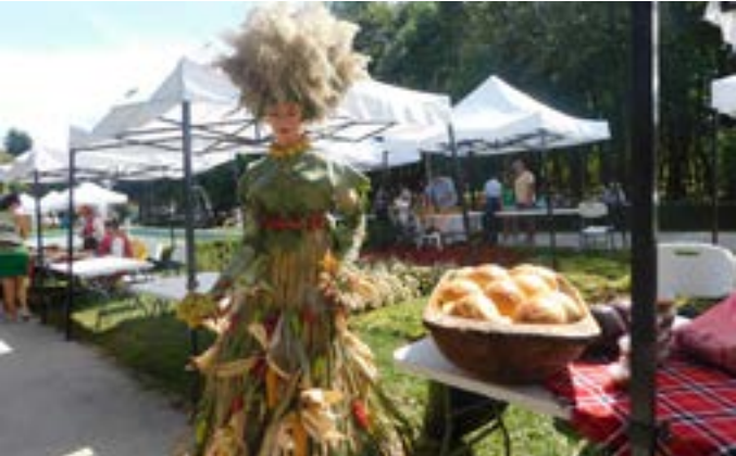
Щрихи от Празника на плодородието: Хубавица от Дуранкулак.