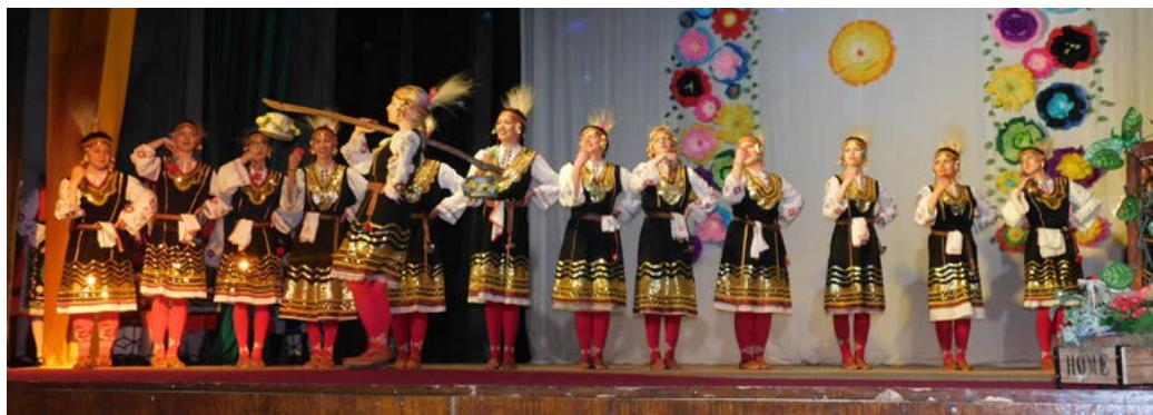
Младежки танцов състав „Българка“

зала децата бяха загубили форма, доста позабравили танците. Започнахме работата си почти отначало на 01.03.2022 година. През втората седмица на март в залата дойдоха две деца от