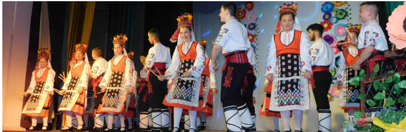
Детски танцов състав „Бърборино“