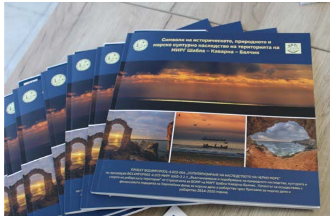
Каталогът „Символи на историческото, природното и морско културно наследство на територията на МИРГ Шабла – Каварна – Балчик.“

Беше представен и раздаден иновативно изготвеният каталог под названието „Символи на историческото, природното и морско културно наследство на територията на МИРГ Шабла – Каварна – Балчик“, чиято цел е да повиши информираността на обществеността, туроператорите и туристите, относно възможностите за културно – исторически туризъм в Североизточния черноморски район.