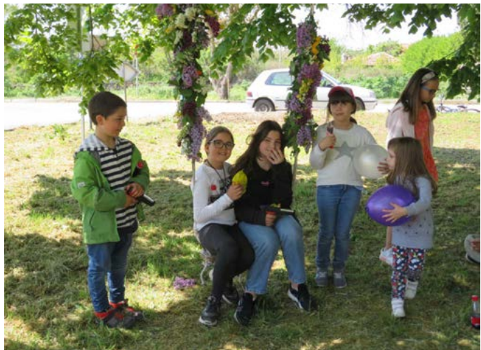
По традиция, на Гергьовден се залюляха цветни люлки...