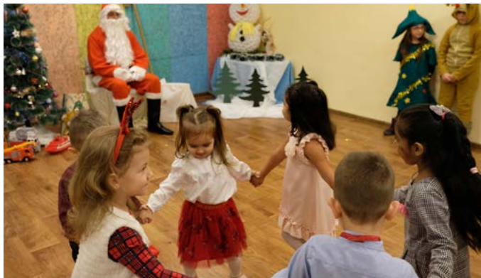
Деца от група „Мики Маус“ и артистите от ОДК (на заден план)

Въпреки пандемията от коронавирус Дядо Коледа успя да влезе в детската градина и да зарадва малчуганите. Педагогическите специалисти от