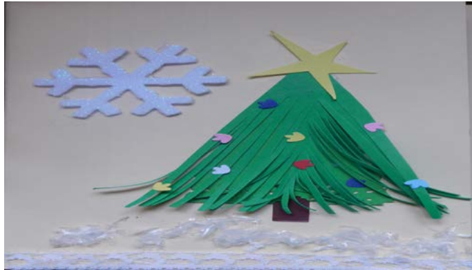
Пламена Димитрова, 7 г.