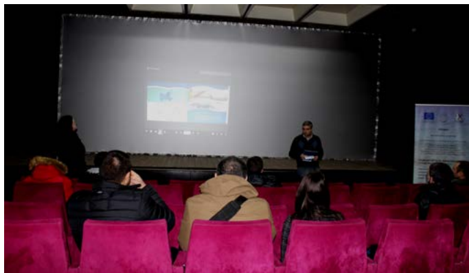
Конференцията в Каварна.