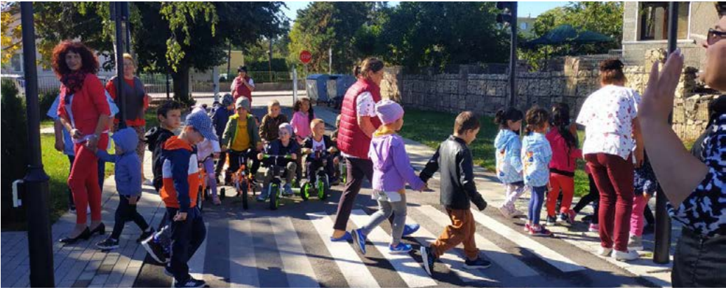
Колездачите търпеливо изчакаха преминаващите пешеходци.

В тази връзка за децата от детското заведение бе осигурена среда за учене чрез игра, съобразена с възрастовите особености на малчуганите. Децата показаха умения за разпознаване на основните пътни знаци, пътната маркировка, средствата за сигнали-