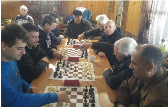
Начало на срещата между отборите на Белослав и Кардам.