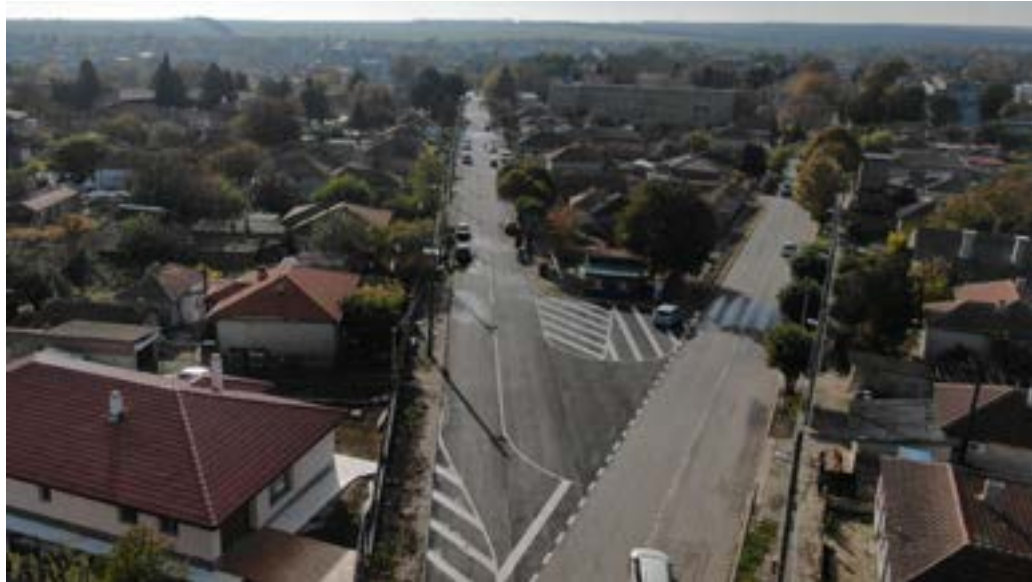
Улица „Добруджа“ (вдясно на снимката)