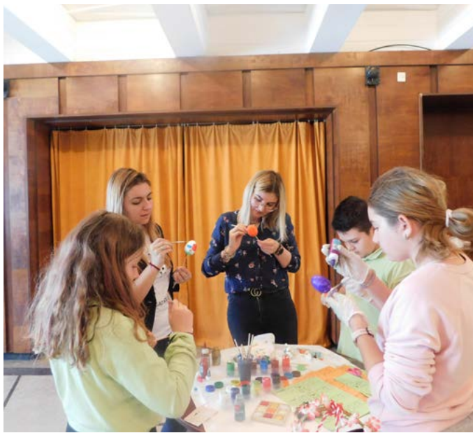
...и възпитаниците на ЦОП, заедно с ръководителите си...

чиха и малки потребители от Центъра за обществена подкрепа (ЦОП) в града.