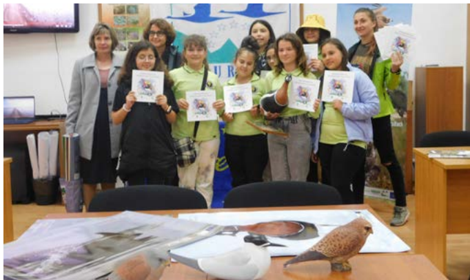
Инициативата в Шабла.