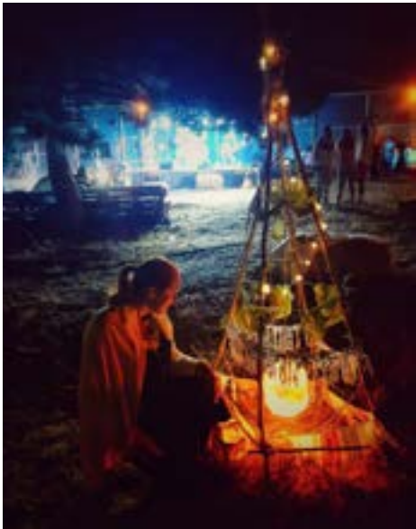
Духът на „Джаз до морето“ в Езерец.

ци, помогнали за това и четвъртото издание на джаз-феста в Езерец да бъде красиво и незабравимо.