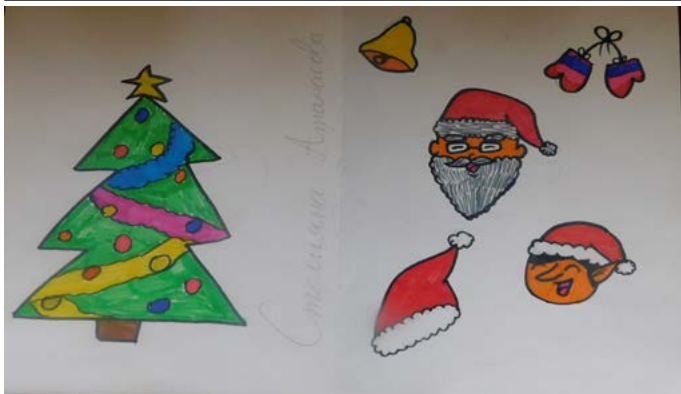
Стелияна Атанасова, 9 г. (Дуранкулак)