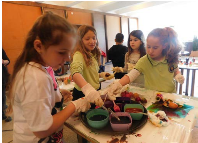
Деца от начален курс в СУ „Асен Златаров“ творят в библиотеката.