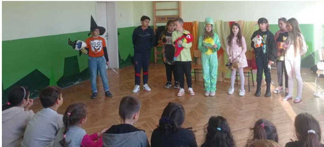
Фотооко: Ученици от „Куклено-театралния състав“ при ОДК гостуваха в ОУ „Св.Климент Охридски“ село Дуранкулак.