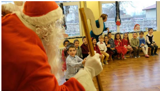
Деца от трета група „Звездичка“ посрещат Дядо Коледа.

С настоящата статия бих искала да ви запозная с празничната среда в ДГ „Дора Габе“ гр.Шабла. Ще се опитам да ви пренеса в няколко от най-незабравимите дни в детската градина, да ви докосна до начина, по който децата