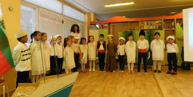
„По стъпките на Ботев и Левски“ – тържество в четвърта група, 2020 година.

Започвам във време, белязано от пандемични обстоятелства, ограничения, мерки – непознато до преди две, а вече и три години. Стриктно се спазват насоките на Министерство на образованието и Министерство на здравеопазването. Пропускателният режим в сградата забранява влизането на родители и външни лица. Спазват се всички указания за дезинфекция – четири пъти дневно. Приемът на деца се извършва от медицинския специалист