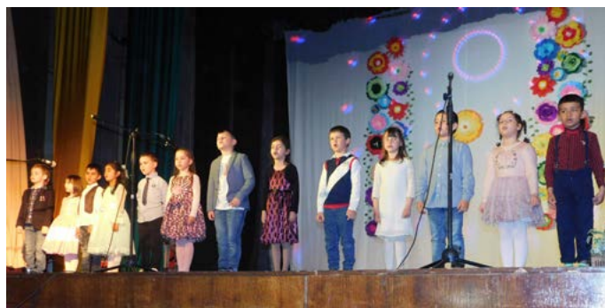
Изпълнението на бъдещите първокласници.

нови деца с желание да танцуват. Взе да ми се върти в главата идея за самостоятелен концерт. И тъкмо започнахме да го обсъждаме с децата.....изненада. Мерки за сигурност! Отворено, затворено, отворено, затворено...и така до безкрай. За смисъла на тези мерки не искам да говоря, не му е мястото тук. Резултатът обаче беше плачевен. След две години отсъствие от