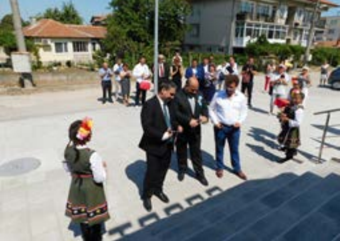
2019 година. Община Шабла чества своя 50-годишен юбилей. На снимката откриването на реновирания Спортен комплекс в града.

Честит празник на всички, които носят Шабла в сърцето си!