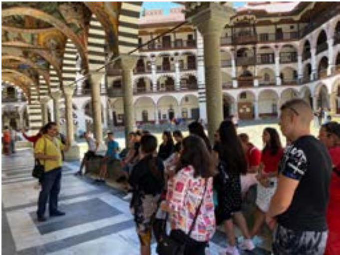
В двора на Рилския манастир.

Пътуване, изпълнено с безброй положителни емоции и настроение. Успяхме да се докоснем до част от нашата красива българска природа и да разгледаме различни градове и обекти. През първия ден посетихме гр. Пловдив и гр. Пазарджик. Втория ден бяхме в Сапарева баня, известна с минералния си извор, който е най-горещият – над 100 градуса. След това се отправихме към Стобските пирамиди, разположени в западна част на Рила планина. Денят приключи с посещение на Рилския манастир, където са и мощите на свети Иван Рилски. Ден трети – предизвикателство беше за групата да „превземем“ крепостта Цари Мали град.