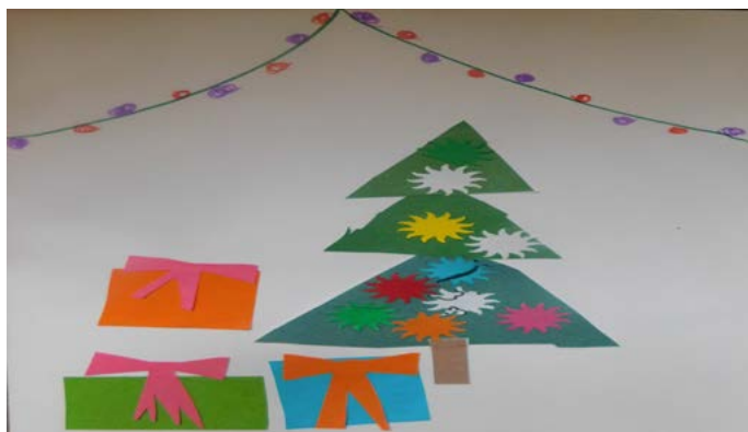
Бойко Бисеров, 4 г. (Дуранкулак)