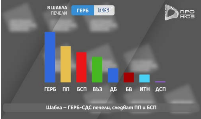
Графика: Про нюз Добрич