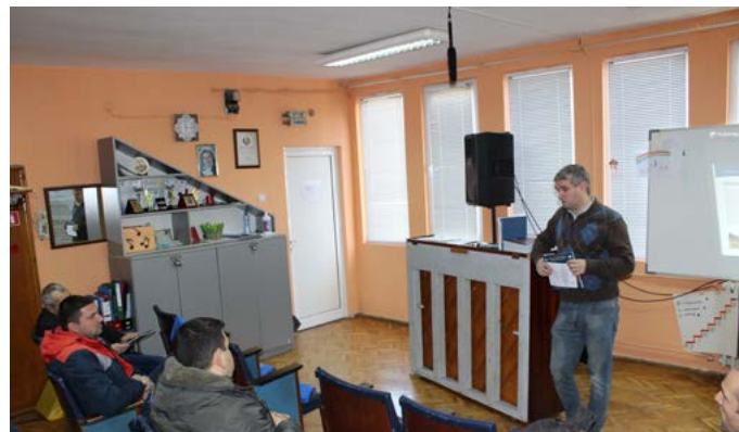
...и тази в Балчик.

BG14MFOP001-4.025 МИРГ ШКБ-2.2.1 „Възстановяване и подобряване на природното наследство, културата и спорта на рибарската територия“ от Стратегията за ВОМР на МИРГ Шабла-Каварна-Балчик, осъществяван с финансовата подкрепа на Европейски фонд за морско дело и рибарство чрез Програма за морско дело и рибарство 2014-2020 година.