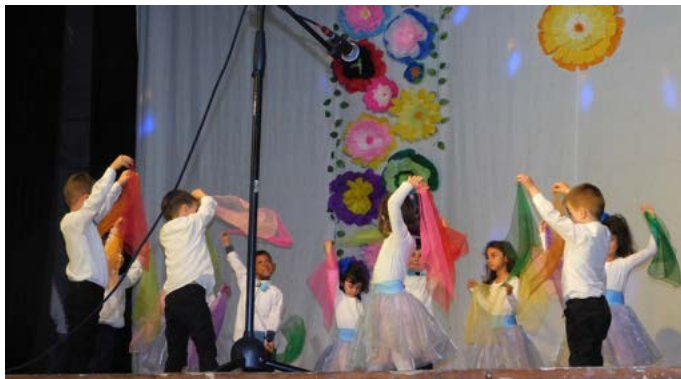
Най-малките изпълнители на пролетния концерт – децата от втора група „Смехорани“ на ДГ „Дора Габе“.