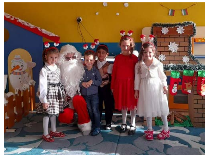
Дядо Коледа посети децата и в разновъзрастова група „Слънце“ в Дуранкулак.