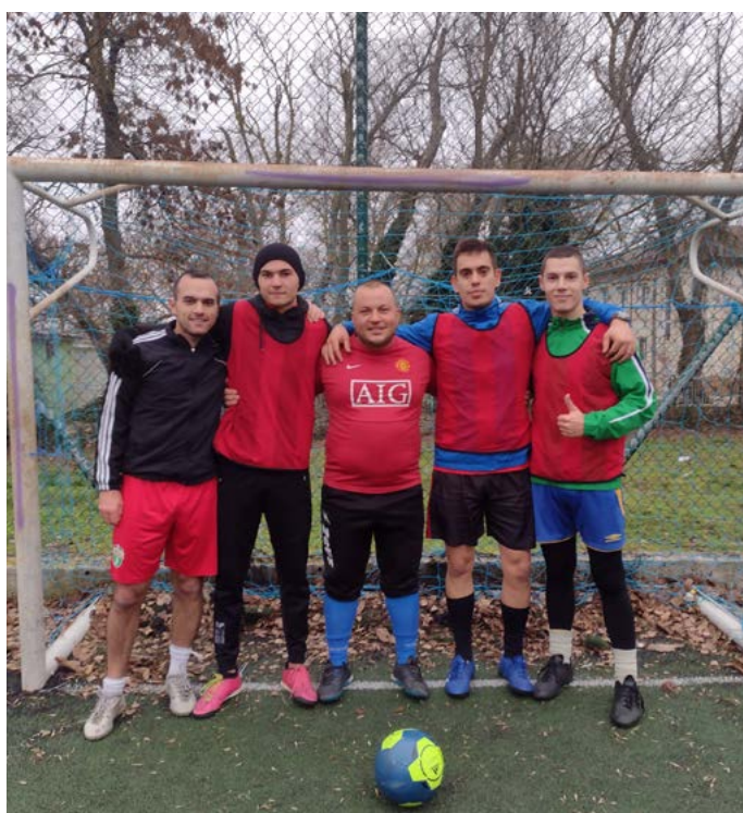
Победителите в коледния турнир по минифутбол – отборът на „Дядо Мраз Армейци“.

място, „Дуранкулак“ се наложи над „Донорите“ с 5:1. Финалът между „Дядо Мраз – Армейци“ и „Донорите“ не беше за зрители със слаби сърца – 3:3 в редовното време, 4:4 след продълженията, и чак при изпълнението на дузпите, „Армейци“-те се оказаха с по-здрави нерви, и спечелиха срещата с