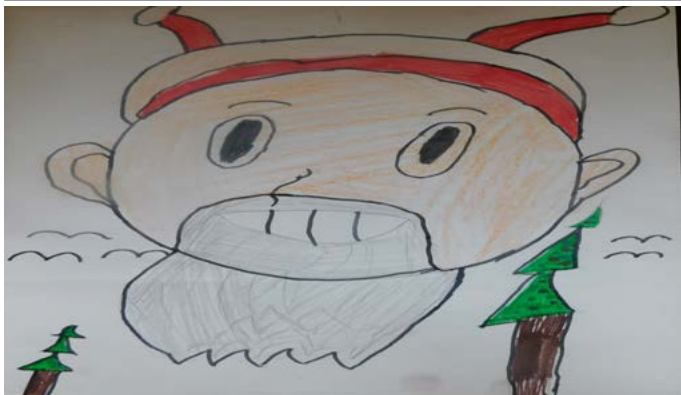
Стелияна Атанасова, 9 г. (Дуранкулак)