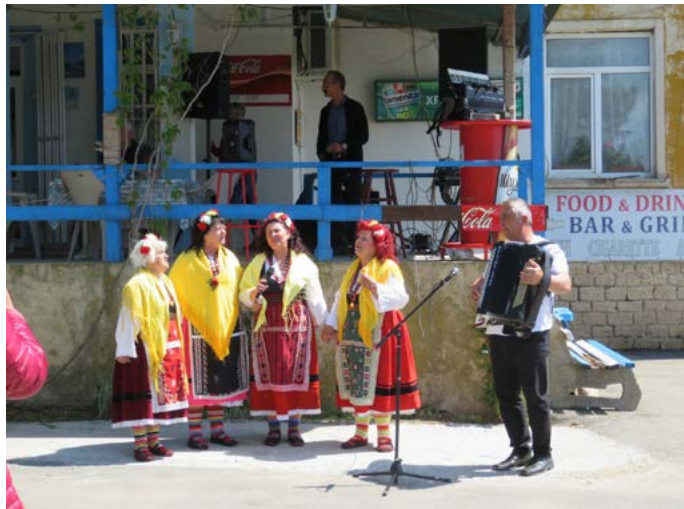
Фолклорната група от с. Горун – едни от тези, които се погрижиха за доброто настроение на празника на Езерец.

Елен Сабатини, читалищен секретар на НЧ „Отец Паисий“, с. Езерец