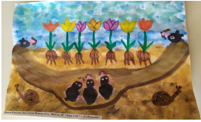
Ванеса Ялнъзова - Елис Илиева, на 6 години от ДГ „Дора Габел“ Шабла. Тяхната творба се нарича „Събуждане“.