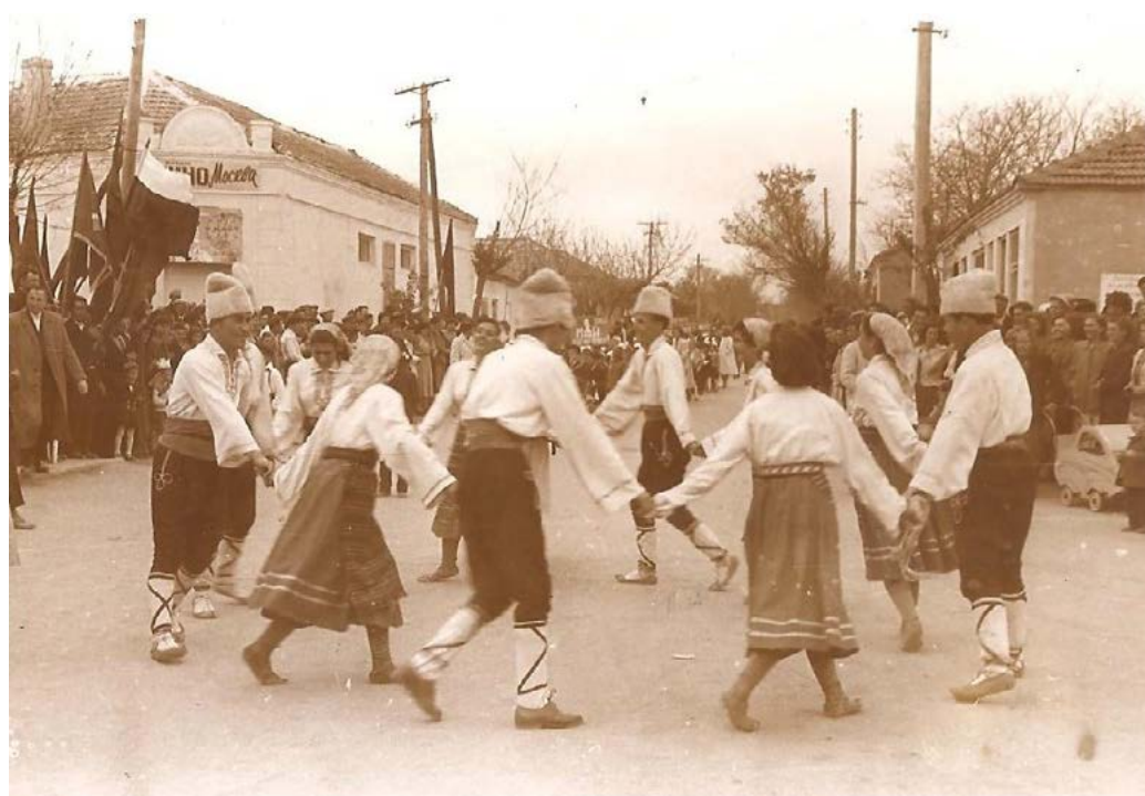
Празнуване на 1 май пред кино „Москва“ през 1956 г.