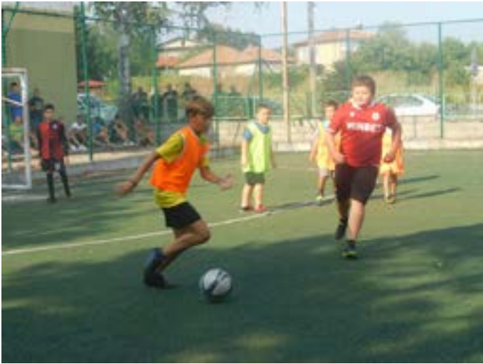
Първия мач от турнира започна с най-малките.

На 13 август в двора на СУ „Асен Златаров“ Шабла се проведе турнир по футбол за деца и юноши – част от Дните на морето, Шабла 2022 година.