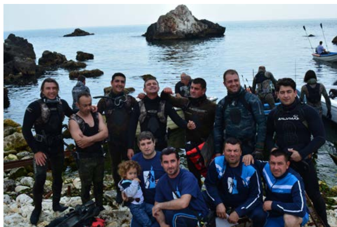
Отборът на „Портус Кариа“ е готов за сезона.

На подводните риболовци предстои и международен тур-