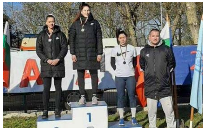
Подробности четете в следващия ни брой.