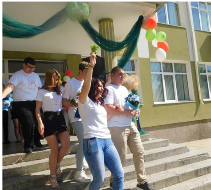
Последни мигове в родното училище...

От името на родителите дванадесетокласниците при-