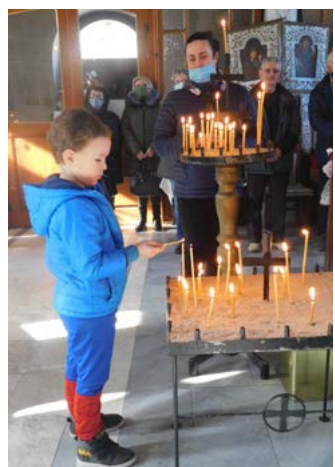
Малки и големи запалиха свещичка за здраве и берекет.

от манастира „Свети Пантелеймон“ (в местността Патлейна до град Велики Преслав) води празничната света литургия в съслужение с отец Павел Максимов от нашия храм и свещеници от Варненската и Великопреславската епархия.