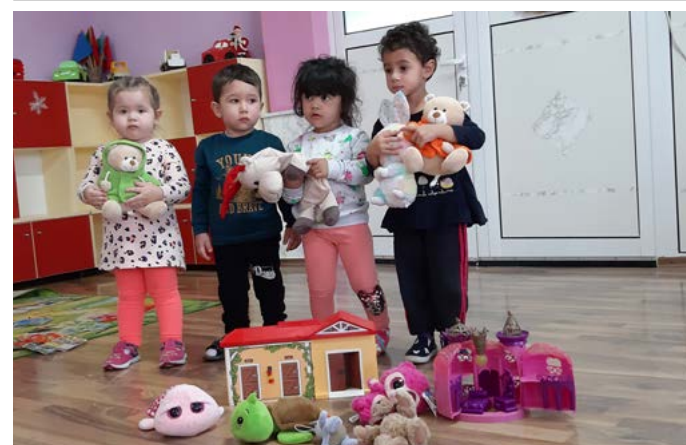
И при децата от ЦДЯ „Радост“ Шабла дойде добрият, белобрад старец.