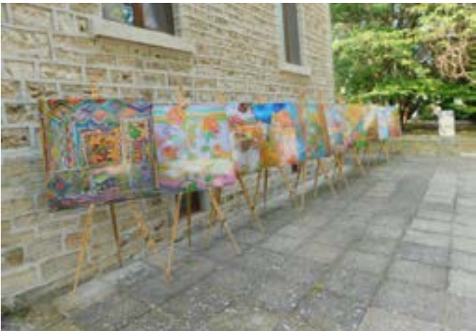
Част от картините бяха изложени в двора и „посрещаха“ посетителите.

На следващия ден, 13 август, желаещи се включиха в творческо ателие, където сами нарисоваха своя картина върху коприна, разбира се под ръководството на чаровната дама и творец Ива Пенчева.