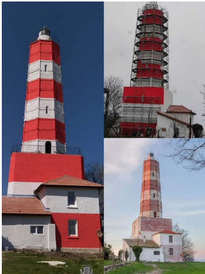
Фарът Шабла сега, по време на ремонтните дейности и преди тях.

Фирмата изпълнител е „Ню Пауър груп“ ЕООД, като поръчката е възложена от командването на Военноморските сили на РБългария.