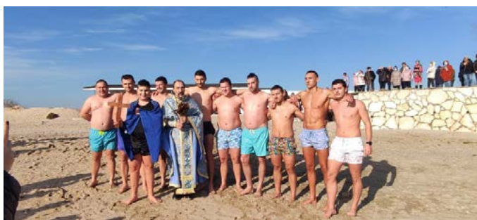
В Дуранкулак, както в Крапец и Шабла, 10 мъже скочиха за Богоявленския кръст.