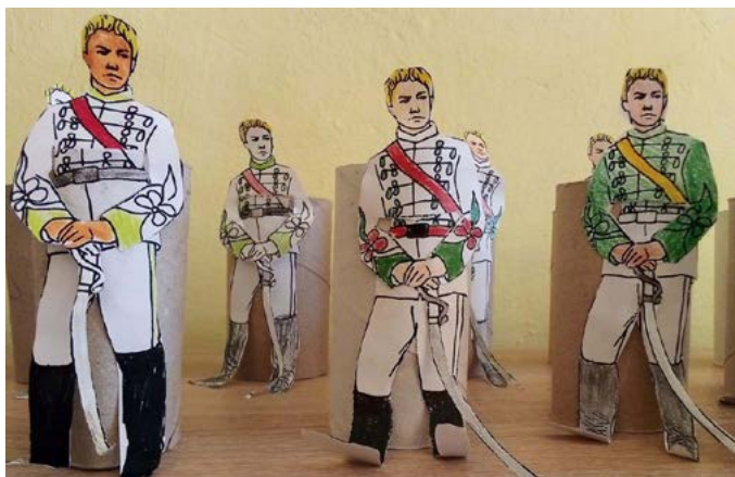
В „Занимания по интереси“, второкласниците при СУ „Асен Златаров“ изработиха макети на Апостола на свободата.