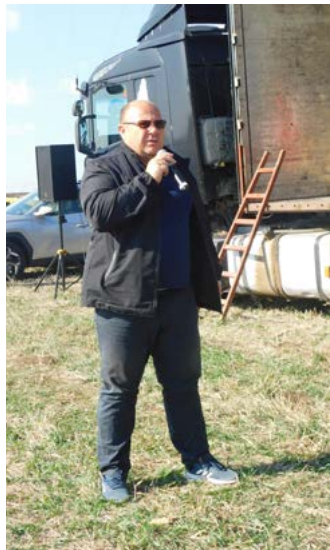
Приветствие от кмета на общината.

На 8 октомври 2022 година в Шабла се проведе турнир по конни надбягвания в памет на Панайот и Константин Карамилеви – баща и син.