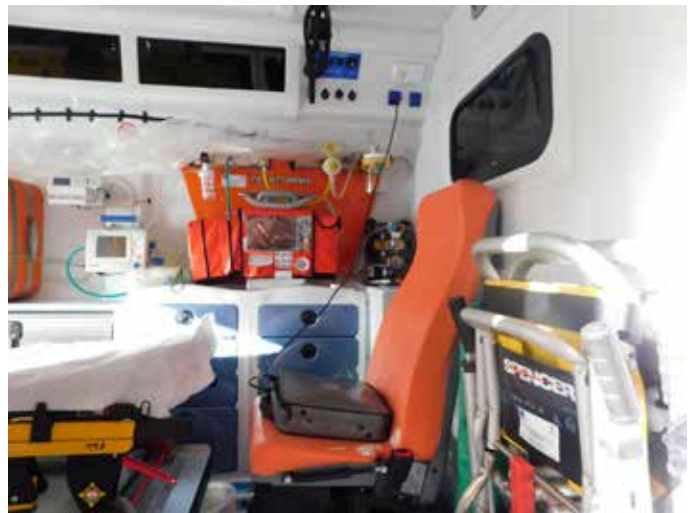
Една от линейките на спешния център в Шабла е оборудвана с животоспасяваща апаратура.

„Изгрев“ – Спомняте ли си кога за първи път се сблъскахте с това заболяване?