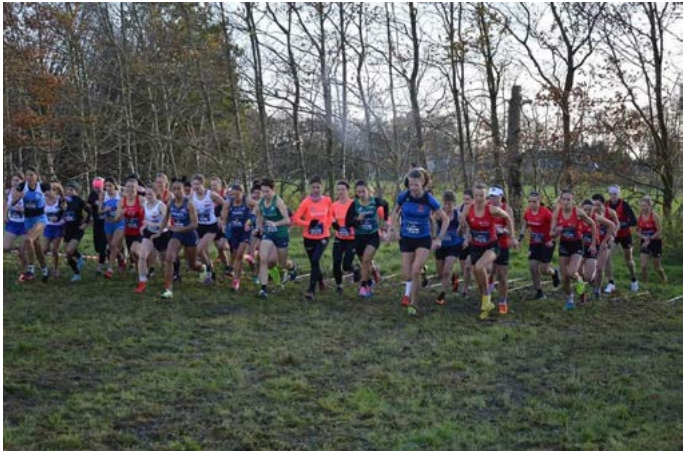
На старта в Орхус.