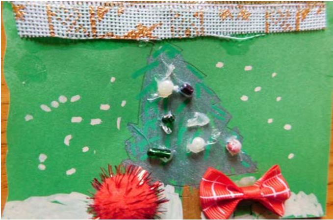
Константин Костов, 8 г. (Езерец)

изработени от децата от община Шабла за дарителската кампания „От дом на дом, от сърце на сърце“.