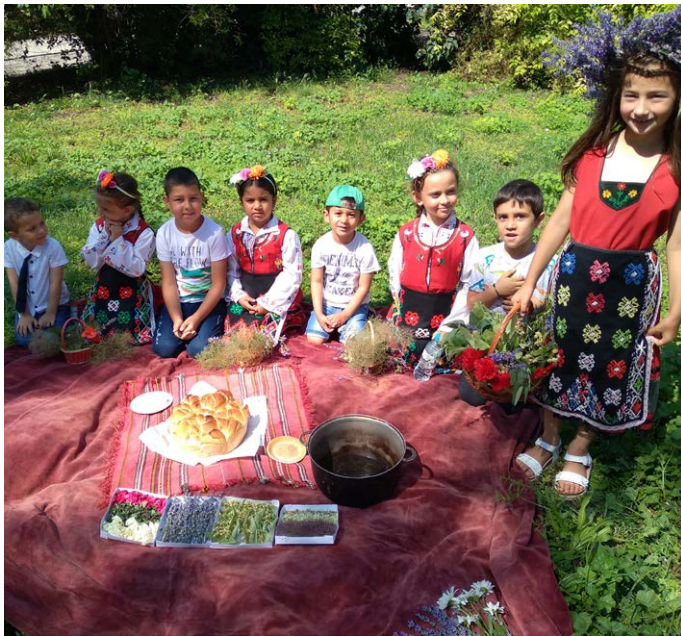
Срещу Еньовден звездите слизат на земята, омайват тревите и цветята, придавайки им магическа целебна сила. НЧ „Дружба 1898“ с. Дуранкулак, съвместно с група „Слънце“ от детската градина, отбеляза Деня на билките!

На основание чл.15, ал.4 от ЗУЧК, строителни и монтажни работи в определените територии се допускат само за неотложни аварийно-ремонтни работи и геозащитни мерки и дейности.