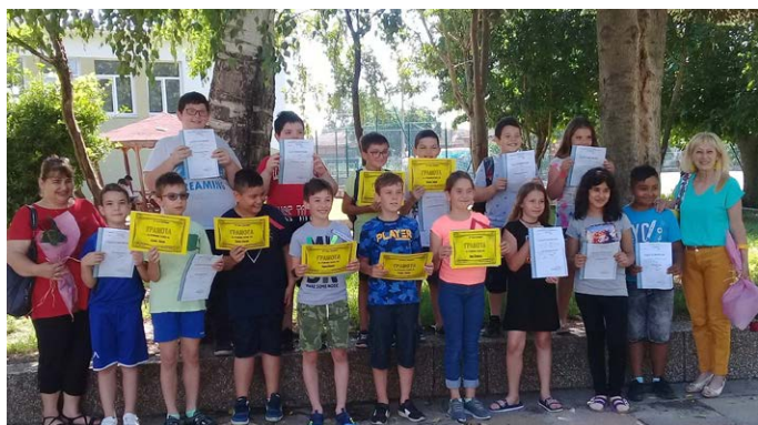
Учениците от трети клас.