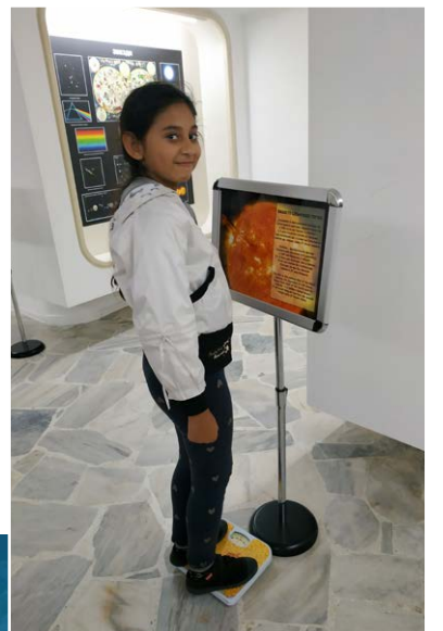
Теглене на лунен кантар в планетариума.

гическата, както и Ботаническата градина в гр. Балчик, но посещенията не се осъществиха поради влошените метеорологични условия. На тяхно място направиха разходка из Вселената в Планетариума, от който излязоха с много впечатления и нови знания за галактиките и слънчевата система.