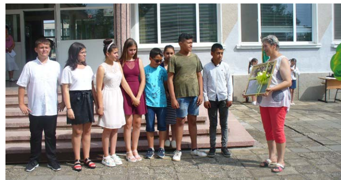
Раздалата със седмокласниците.

Тържеството беше посветено и на 155-годишнината от основаването на училището и премина като „Усмивки от старите ленти“. Учениците по класове представиха откъси