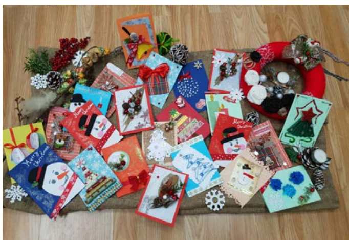
Коледните картички, изработени от малките потребители на ЦОП Шабла.

Екипът на Център за обществена подкрепа гр. Шабла