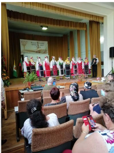
...от клуб „Надежда“ – Шабла.

Фестивалната програма бе придвидена за четири сцени, съответно в четири села. Участниците от