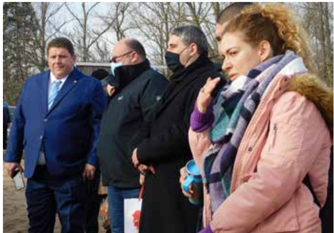
Областният управител и заместниците му бяха част от ритуалите.

Осем бяха желаещите да извадят богоявленския кръст на къмпинг „Добруджа“ в Шабла.