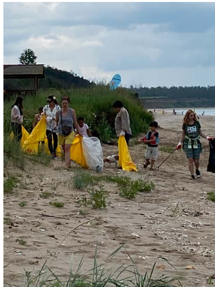
Доброволците в акция...

с подкрепата на Фондация „Кока-Кола“. В Община Шабла дейностите се реализират от НЧ „Отец Паисий 1901“ и неформална гражданска Група „Място Езерец“, в партньорство с община Шабла.