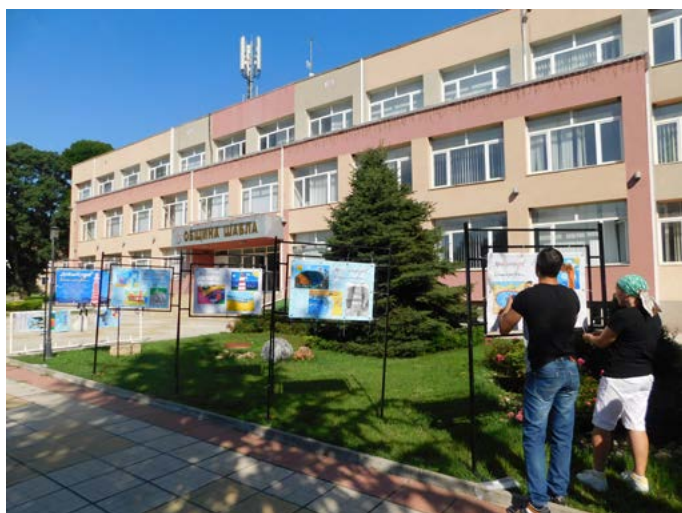
От ОДК поставят банерите с рисунките на децата пред общинската сграда.

Екипът на ОДК - Шабла изказва благодарност за ен-