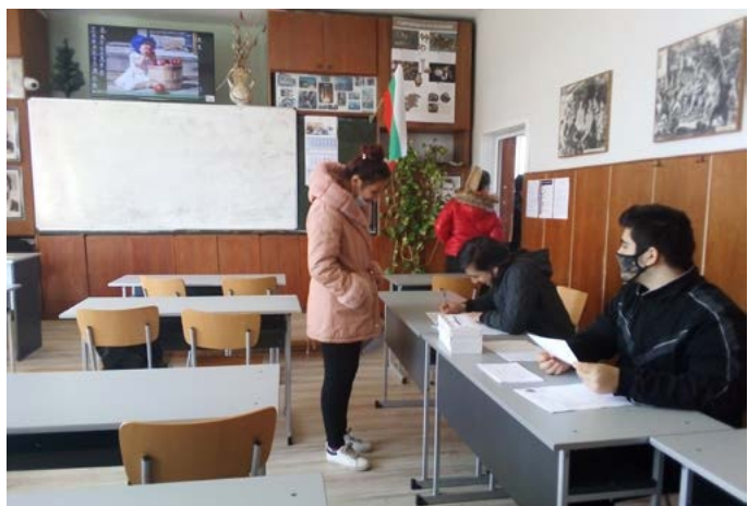
По време на „изборите“...

та беше да се упражни пропорционален вот и да се използват преференции. Други трима трябва да се кандидатира за кметове на населено място, също с програма за действие, за да се упражни и мажоритарния вот. Самата симулация на избори, в подготовката на която активно се включи тричленна