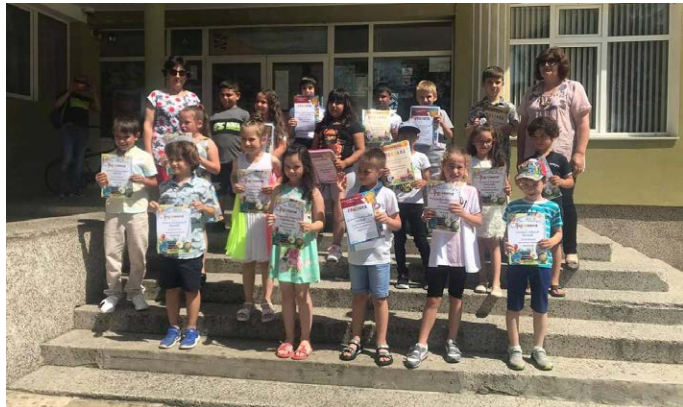
Празникът в I-III клас.

На 24.06 и учениците от I до III клас в ОУ „Св. Кл. Охридски“, както всички в страната, получициха своите удостоверения, показвайки пред своите родители какво са научили през учебната година.