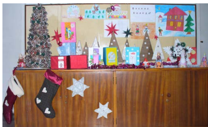
Коледно настроение в училището в Дуранкулак.