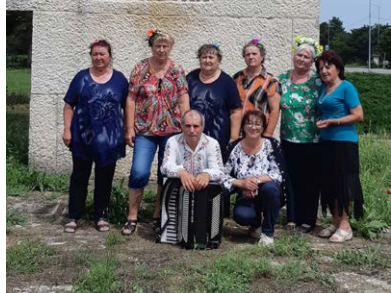
Самодейците от Крапец.