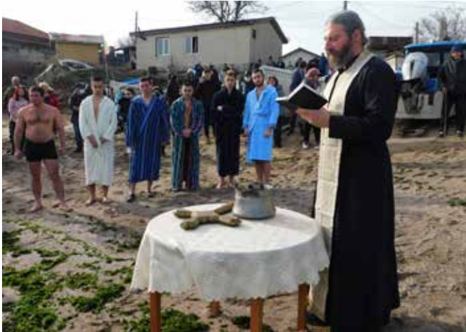
Богоявленски водосвет в Крапец.