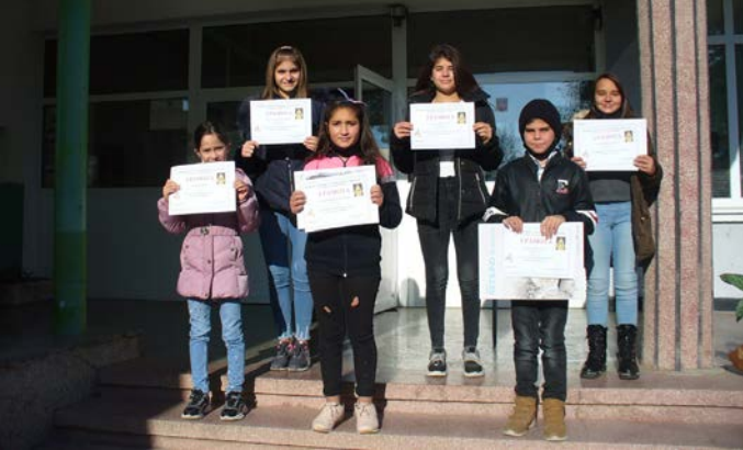
Отличените ученици в училищните конкурси, посветени на празника.

„Св. Климент Охридски“ прочете поздравителни адреси. Поздравление към колектива отправи кметът на община Шабла Мариан Жечев. Гости на