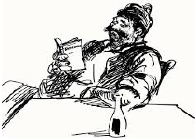
„Бай Ганьо чете „Бай Ганьо“ от Илия Бешков

Преди 125 години Алеко Константинов отпечатва в самостоятелна книга събраните в сп. „Мисъл“ истории за Бай Ганьо. По този повод, детският отдел на библиотеката при НЧ „Зора 1884“ Шабла, обявява конкурс за рисунка на тема „Бай Ганьо днес“.