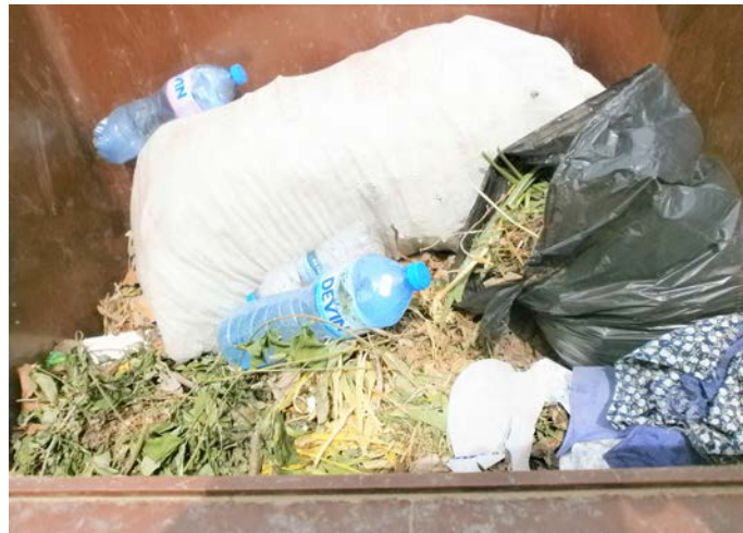
Неправилно използване на кафявите контейнери – за смесен битов отпадък.

Съгласно чл. 11, т. 2 от Наредба за Националния туристически регистър ( Приета с ПМС № 252 от 08.10.2019 г. Обн.ДВ. бр.81 от 15 Октомври 2019 г.) Лицата, които упражняват дейност в места за настаняване със сезонен режим на работа, информират категоризирания орган по електронна поща за периода в годината, през