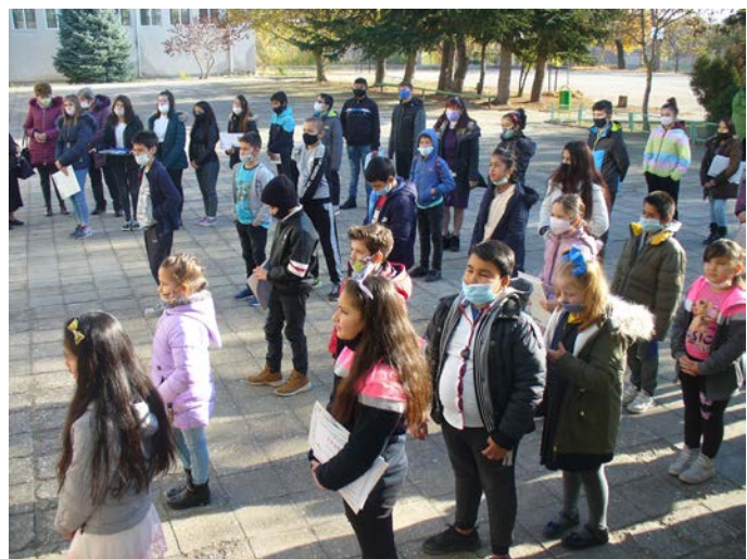
Началото на патронния празник

На 25 ноември колективът на ОУ „Св. Климент Охридски“ в с. Дуранкулак за 62-ри път чества патронен празник.