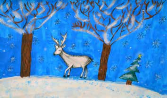
Снимка 9 – Йоана Йотова (11 г.) от Шабла