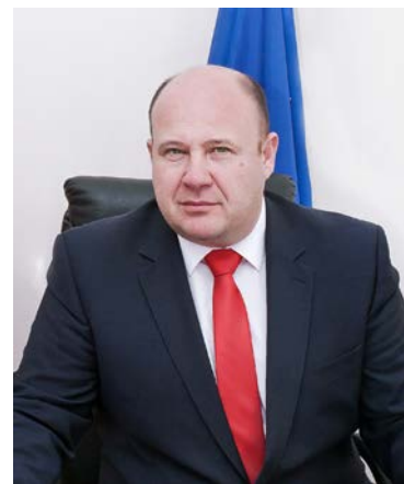
МАРИЯН ЖЕЧЕВ Кмет на Община Шабла