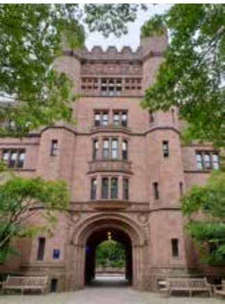
Една от най-старите сгради в Йейл, която в момента се използва като едно от общежитието на първокурсници