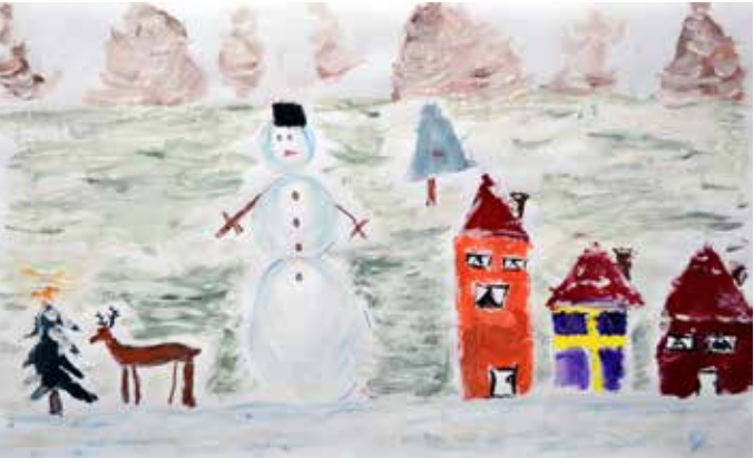
Снимка 7– Даная Казанлийска (8 г.) от Шабла