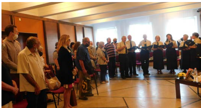
Залата се изпрати на крака при изпълнението на хор „Патриот“.