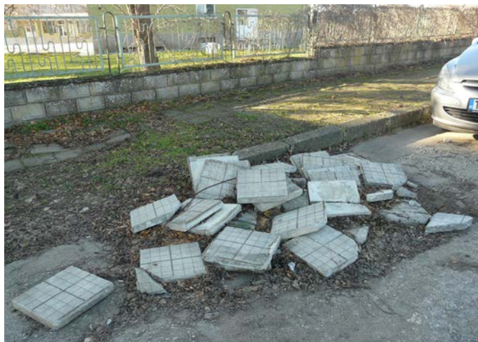
Пет месеца след ремонта на СУ „Асен Златаров“ Шабла...

В срок до 17.01.2020 г. всички граждани на Общината могат да дават идеи, мнения и предложения по проекто-бюджета. Предварителна информация по проекто-бюджет 2020 г., ще бъде публикувана на интернет страницата на община Шабла.