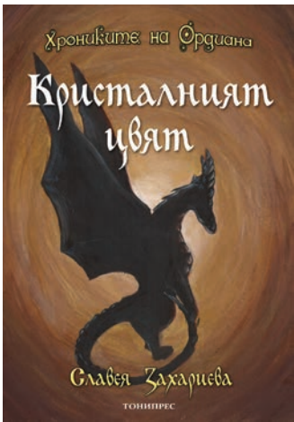
Втората книга от „Хрониките на Ордуана“ – „Кристалният цвят“.

расизъм и равнопоставеност между магическите видове, отмъщение срещу благородност, политическа справедливост срещу корумпираност и желание за власт, лично развитие и търсене на щастие и мир, и т.н. Първите две книги от поредицата („Гора от вятър“ и „Кристалният цвят“) бяха издадени от българското издателство „ТониПрес“, когато бях съответно в 9-ти и 11-ти клас (през 2014 и 2016 година). Това поз-