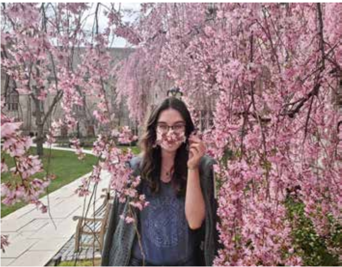
Славей в един от вътрешните дворове на Йейл, през тази пролет