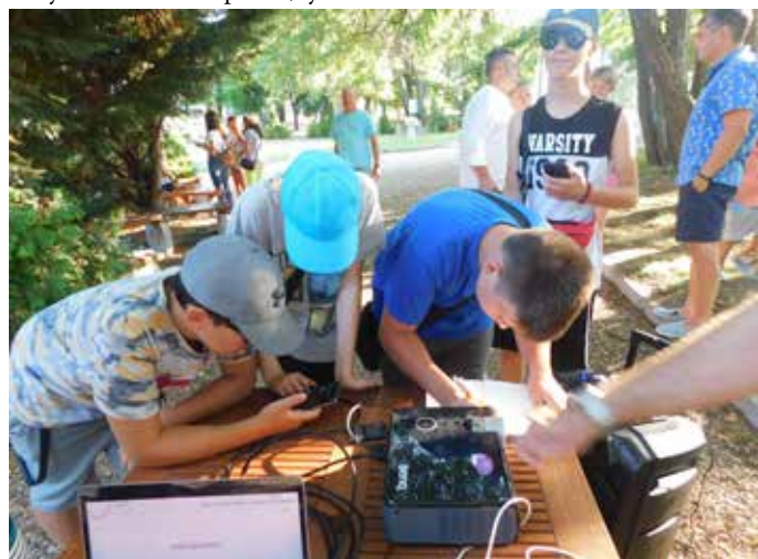
Първите ентузиазирани мореплаватели се записват за курса.