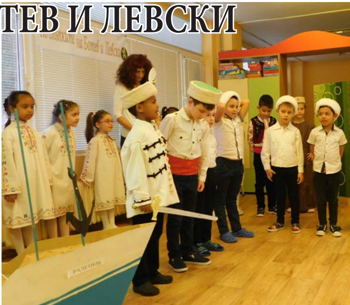
„Ботев“ - детето със сабята, до кораба Радецки

С малките артисти оживяха още сцени от българската