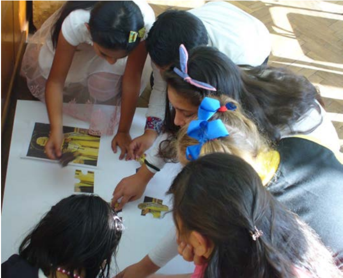
Нашият портрет на св. Климент – I клас.

ги за най-много верни отговори от викторината. Така неусетно изминаха 2 учебни часа, посветени на свети Климент Ох-