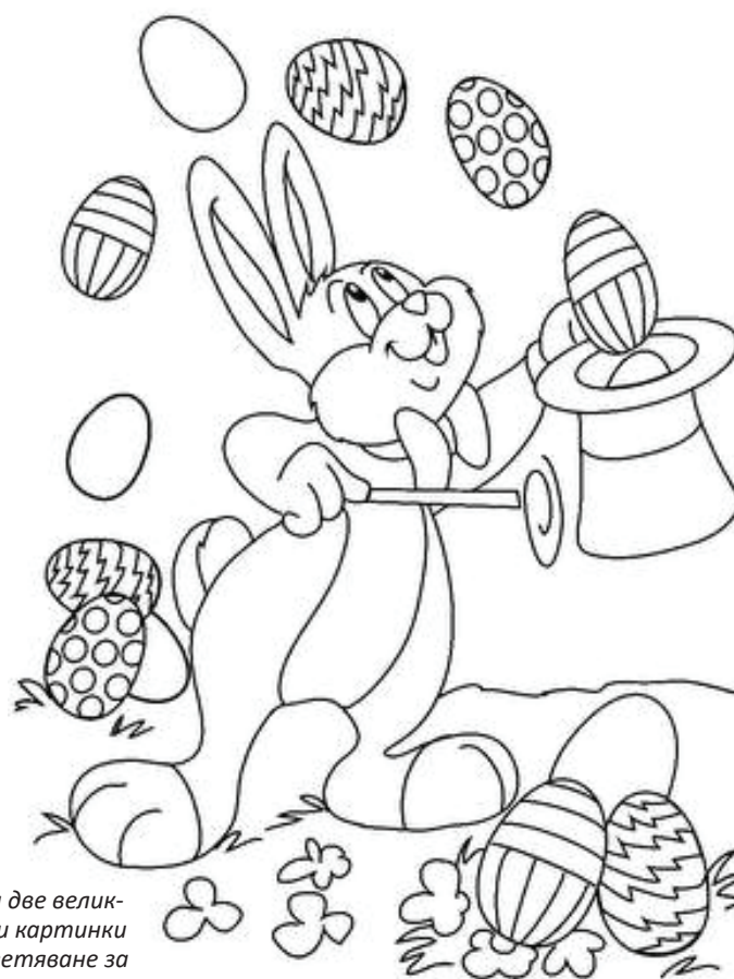
Ето и две великденски картинки за оцветяване за най-малките.

Материалът може да бъде: хартия, картон, природни материали, стиропор или друг по ваш избор. Снимайте ни своите изделия ни ги изпратите на e-mail: d.dimitrova89@abv.bg заедно с трите Ви имена и класа до 18 април. Изпратените великденски изделия ще бъдат публикувани в следващия брой на вестник „Изгрев“ и на