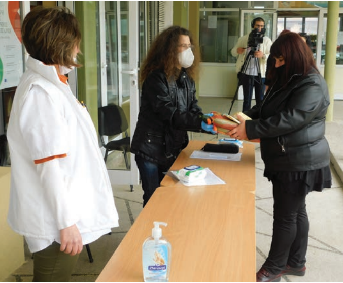
Получаването на хранителните продукти от родителите в СУ „Асен Златаров“.

Библиотеката при НЧ „Зора 1894“ Шабла е отворена за вас, от понеделник до петък, в часовете 9.00-12.00 и 13.30-18.00.