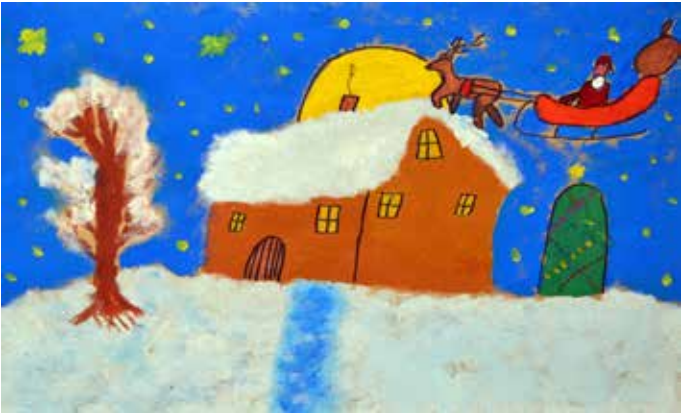
Ивон Великова (9 г.) от Шабла