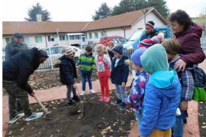
В помощ на децата се включиха и техните бащи.