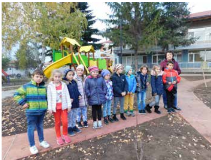
Част от първокласниците до своето дръвче, в любимата детска градина.

Деца знаят, че да засадим дърво е един от най-лесните начини да оставим света след нас една идея по-добър отколкото сме го намерили. Ние, родителите учим наследниците