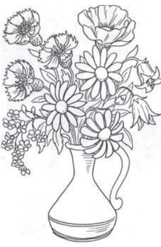
Картинката за оцветяване