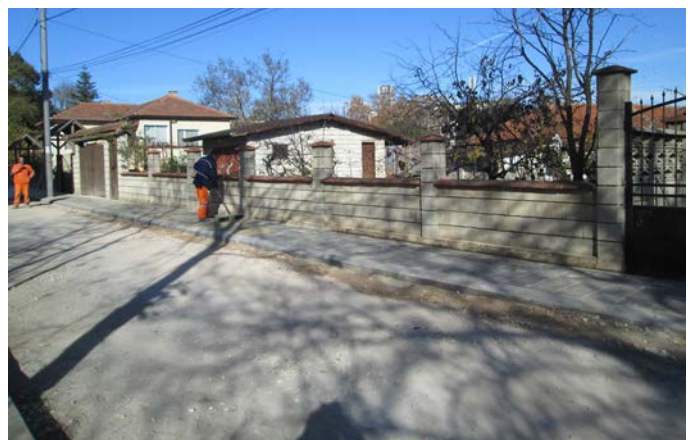
Тротоарът от лявата страна на ул. „Оборище“ (гледано откъм ул. Равно поле“) вече е изграден.

пешеходни, придобили гражданственост като „легнал полицей“. Ремонтирана бе и уличната мрежа в с. Граничар. Извършен бе и текущ ремонт