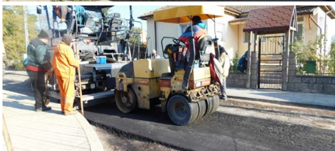
Полагането на асфалта на „Оборище“.