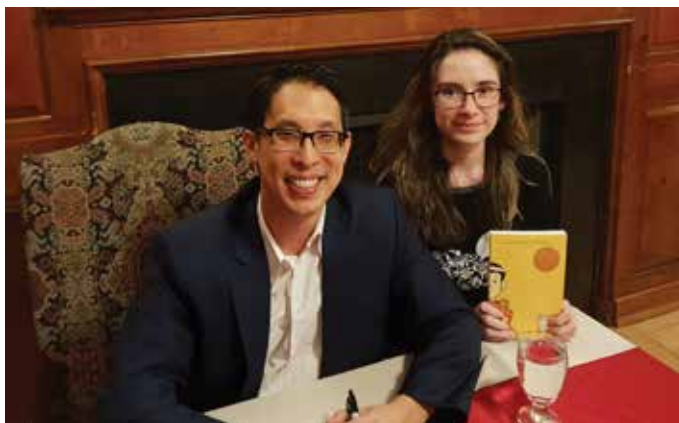
На бизнес среща с Джийн Луен Янг, създател на някои от комиксите за „Супермен“ и „Аватар: Последният въздушен повелител“

Този семестър също така основах и подкаста „Атюн“ (the Attune Podcast) и съм един от изпълнителните продуценти.. Подкастът като форма на творчество става все по-популярен в днешно време в САЩ. Заедно с моя екип подбрахме актьори (озвучители), писатели, както и музиканти, с които да си сътрудничим. Подкастът ни е част от „Yale Daily News“, който е не само най-големият и най-старият студентски вестник в Йейл, но и един от най-старите студентски вестници и органи-