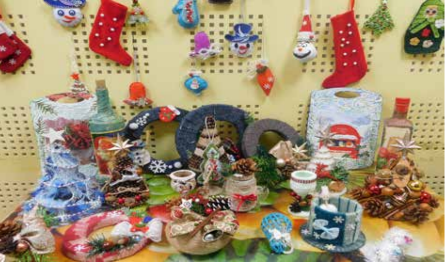
Малка част от „коледните вълшебства“, направени от потребителите на ЦСРИ

паж, апликация и декорация. Екипът на ЦСРИ отправя послание към жителите на община Шабла: „Вече две хилядолетия гори Витлеемската звезда и ни указва Пътя. Трудно се върви по него, защото е белязан от всеопрощението, милостта, състраданието и добротата. Всекидневно се препъваме в неравностите му, но се стремим в заблудите и вярата си да го следваме. Всяка година в белотата на декемврийската свята нощ, светът замлъква и очаква чудото. По стародавна традиция в тези мигове ние