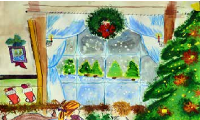
Женя Петрова (13 г.) от Дуранкулак