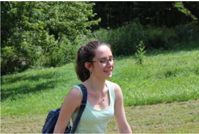
На поход в гора до Йейл

всички бакалаври са разделени в 14 общежития („колежи“), като всяко от тях има собствени традиции, песни, талисман, съветници, декани и т.н. По тази структура те често са сравнявани с 4-те „домове“ в поредицата Хари Потър, където всеки „дом“ има свои тра-