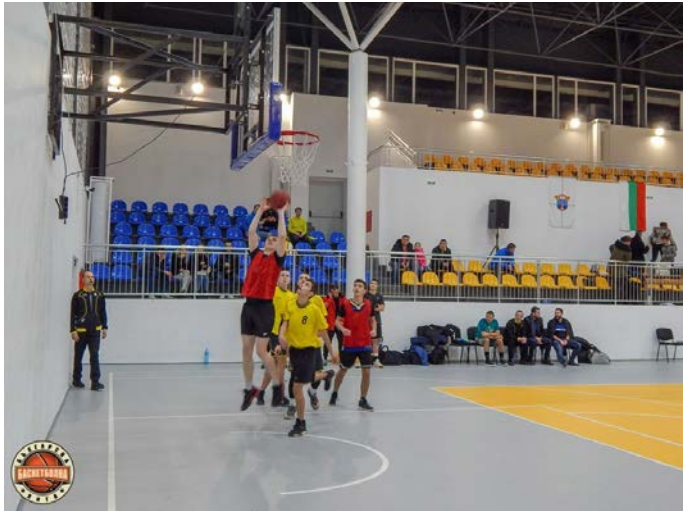
Учениците от СУ „Асен Златаров“ категорично надделяха над тези от каварненското СУ „Стефан Караджа“.