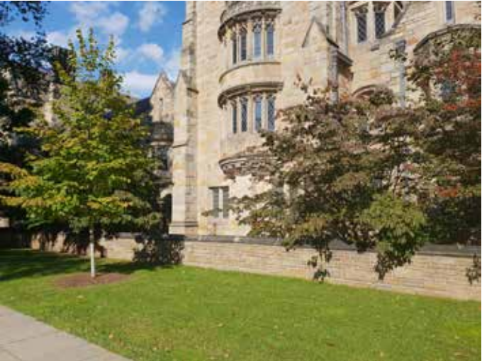
Самото общежитие Брандфърд – едно от най-старите в Йейл