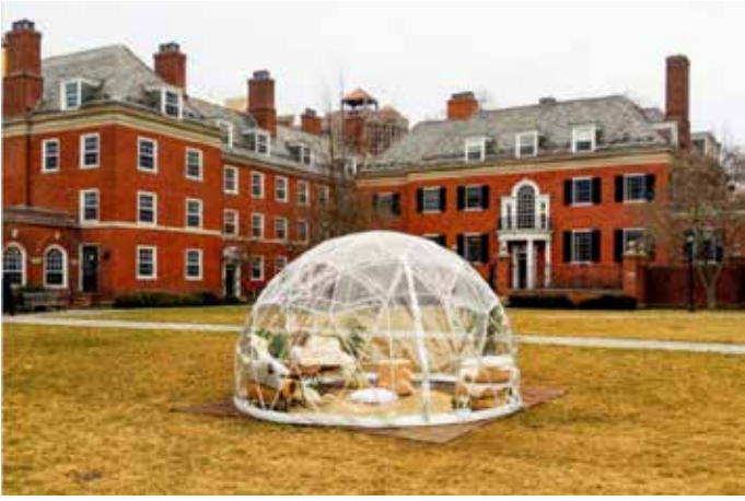
Иглу в едно от дворовете в Йейл. В него студентите могат да учат, ядат и да прекарват време с приятели.

пълнителни занимания се предлагат разнообразни участия според интересите на всеки – действат стотици извънкласни клубове (повече от 300), включително и 100 различни спорт-