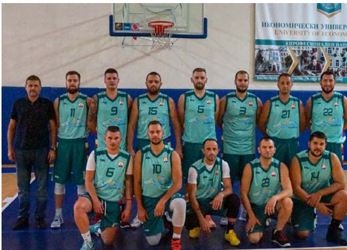
Отборът на баскетболен клуб „Шабла“

„Шабла“ победи съответно: „Ънстопабъл“ (Добрич) с 93:58, „Черно Море (Вн-юноши) с