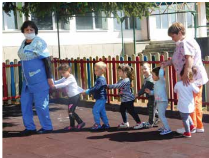
ЦДЯ „Радост“ отвори врати за децата на 26 май 2020 година.