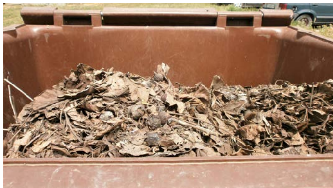
Използване на кафявите контейнери по предназначение – за растителни отпадъци.

растителен отпадък в тях. Важно е да се знае, че растителните отпадъци не следва да се изхвърлят в кафявия съд заедно с чувала, в който са поставени, тъй като той е направен от друг материал и попадането му в контейнера на практика обезмисля целия процес на разделяне – отпадъкът се превръща в смесен битов и се третира