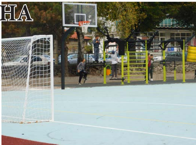
Учениците в СУ „Асен Златаров“, освен учебните часове, няма да могат да посещават и обновената през септември м.г. площадка в училището.

Г.С., майка на ученици и дете посещаващо детска градина – Няма да се правя на героиня, но истината е, че с домашната работа (когато съм у дома, а не на работа) всичко върви чудесно. Но с ученик първи клас, дете на 3 г. и уж контрол върху тинейджър на 17 г. и то дистанционно... И все пак се справяме някак си – преди всичко играем, за да задоволим потребността на най-малкия и на средния, после учим и т.н. Ако и двамата със съпруга ми