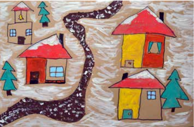
Давид Марчев (8 г.) от Шабла