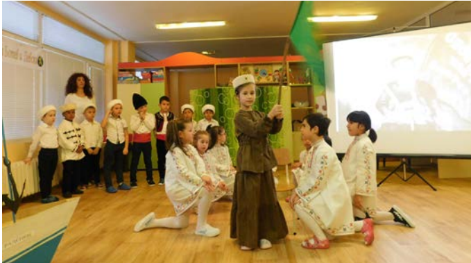
„Райна княгиня“ уши и гордо развя българското знаме.

разказаха какво знаят за капитан Петко войвода, за националните ни герои, за Райна княгиня.