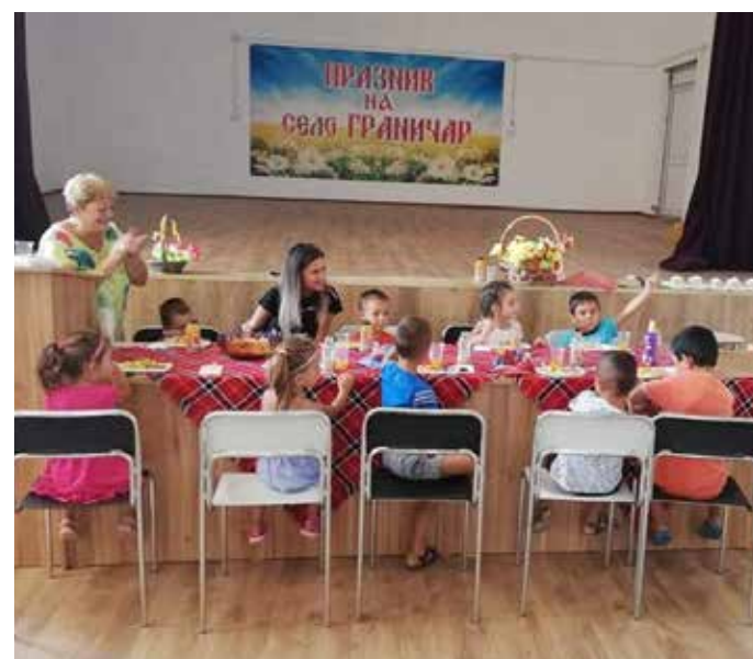
На парти в залата на читалището, децата на село Граничар празнуваха.

Дияна Димитрова, библиотекар в детски отдел на библиотеката при НЧ „Зора 1894“ Шабла