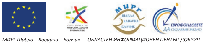
МИРГ Шабла – Каварна – Балчик ОБЛАСТЕН ИНФОРМАЦИОНЕН ЦЕНТЪР-ДОБРИЧ

ИНФОРМАЦИОННА СРЕЩА С РИБАРСКАТА ОБЩНОСТ На 27 януари (понеделник) 2020 г. от 13:00 ч., в Тераза „Тузлата“, КК Тузлата, общ. Балчик, екипът на Областен информационен център – Добрич (ОИЦ-Добрич), в партньорство с Местната инициативна рибарска група (МИРГ) „Шабла-Каварна-Балчик“ ще проведе среща с рибарската общност.