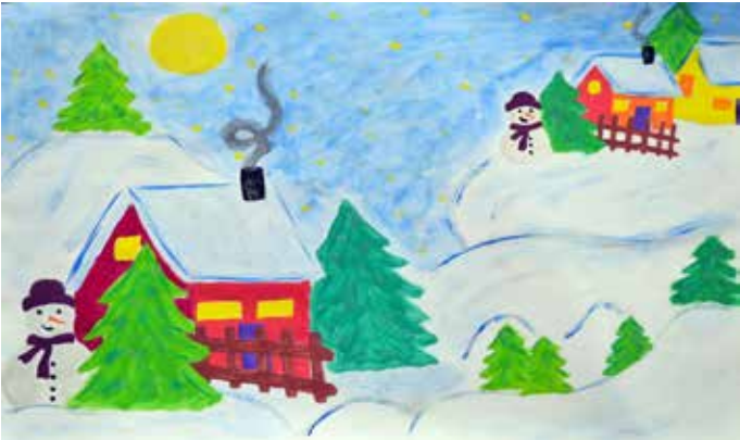
Снимка 10– Стелияна Атанасова (8 г.) от Дуранкулак