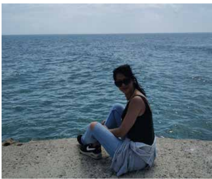
На морския бряг в Несебър...