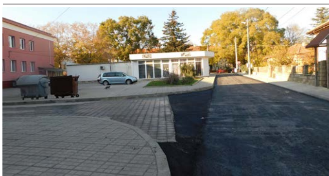
Пътят към общинския паркинг зад шабленското читалище вляво на снимката...