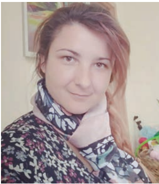
Може би именно заради това на 24 май се обединяваме и се гор- деем с това, което имаме като наследство. Науката, културата и религията са сферите, които са ни запазили като народ и не

Денят на българската про- света и култура и на славян- ската писменост е български национален празник, който се чества на 24 май. Един от най – старите народи е български- ят, не сме си променяли името на държавата, били сме на три морета, дали сме писменост на света. Като се замислим ще ус- тановим, че ние сме големи ин- дивидуалисти в някои черти, но и конформисти – в други. Не приличаме на останалите, но се стремим да се харесаме на по – големите сили в света. И въпреки всичко, което може да се каже за нас, ние си оставаме народ, който милее за младото поколение и за образованието.