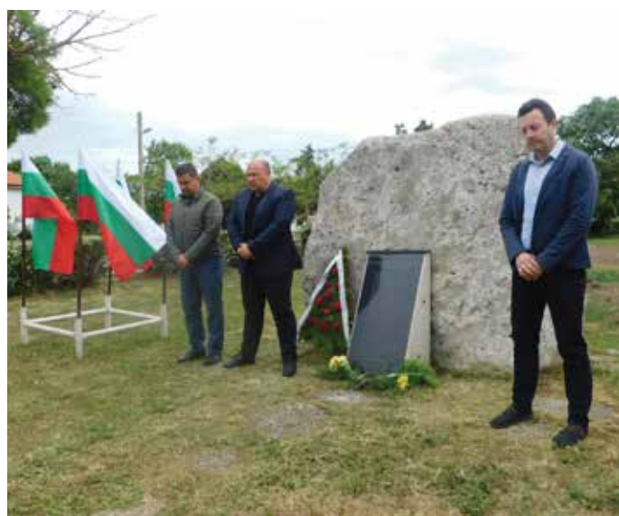
Кметският екип се поклати пред паметната плоча в Шабла.