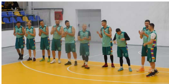
Отборът на „Шабла“ се представя пред публиката в Спортната зала, преди срещата с ИУ Варна

В знакова за шабленския баскетбол се превърна съботата на 18-и януари. Последният Атанасовден се превърна в празник не само на именниците, а и на спорта в града. От обяд до към 19 часа на деня, в Спортен комплекс „Шабла“ се изиграха четирите срещи от поредния кръг на първенството на Българската баскетболна лига за непрофесионалисти (ББЛ), зона „Изток“. В най-важната от тях за местните фенове, домакините от БК „Шабла“ се наложиха над състава на „Икономически университет“ (ИУ) Варна с 81:72. Воденият от именития баскетболен треньор Петко Делев (двукратен национален шампион на България