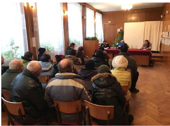
... във Ваклино.

За аварийен ремонт на водопровод по улиците „Свобода“ и „Комсомолска“ са отделени