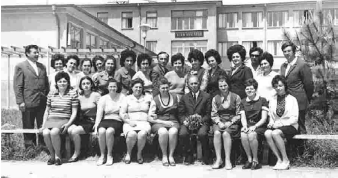
Четири дни преди 24 май, 1973 г., колективът на ЕСПУ „Асен Златаров“ пред училището.

щето и на „своите“ деца! Обучих деца, с които всеки учител може да бъде горд, не мога да ги изброя всички, но примерно