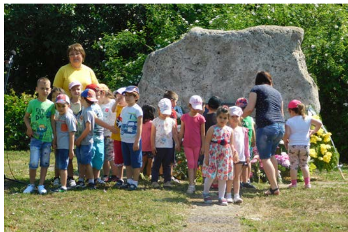
Деца от ДГ „Дора Габе“ току що са положили свежи цветя на паметната плоча в Шабла.