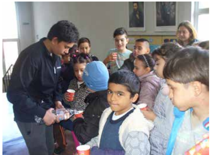
Наливането на водата