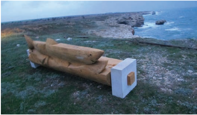
Две от арт-пейките, направени и поставени по еко-маршрутите в община Шабла по проект „Общи ресурси и инициативи, посветени на околната среда“, осъществяван с финансовата подкрепа на Програма за трансгранично сътрудничество INTERREG V-A Румъния-България 2014-2020 г.

На 19 ноември се проведе втора среща по проект „Заедно можем повече“ - BG05M9OP001-2.018-0041 по дейност 1 „Активиране на икономически неактивните лица“ за получаване на базови по-