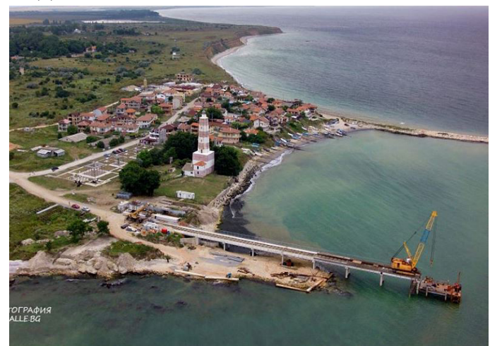
На 6-ти април, 2015-та година, беше сложено началото на възстановителните работи по естакадата на нос Шабла. Според сроковете, които поставят договорните условия, естакадата трябваше да е готова през януари, 2016-та...