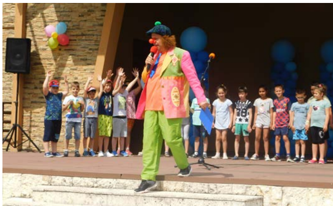
И на сцената имаше шоу...