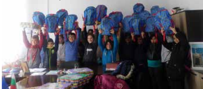
Нашите четвъртокласници с подаръците от румънските приятели

нето в Румъния, шабленските ученици получиха подаръци от своите румънски приятели, без да се познават, но оценили жеста на сръчните наши деца.