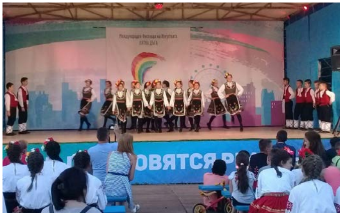
„Бърборино“ на сцената в Китен

Всяка свободна минута се използваше за отмора в басейна или на морето. Децата се чувстваха много добре. Запознаха се с други деца със сходни инте-