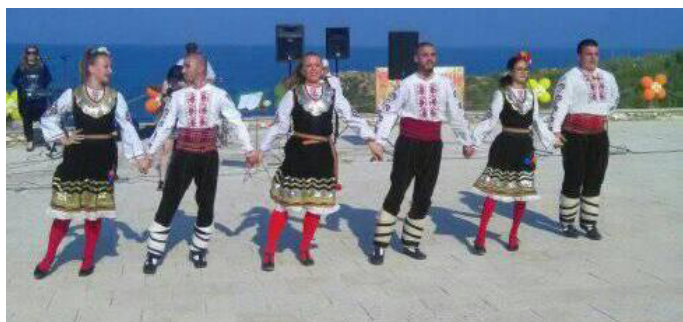
Фолклорни ритми в изпълнение на танцов клуб „Каварна“.

В последния ден от месец май, село Тюленово отбелязва своя празник. Датата за отбелязването на празника на селото не е избрана случайно. На този ден през 1951 година е открит първия нефт в Тюленово.