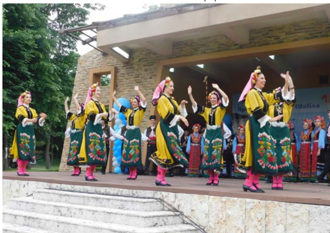
Ансамбъл „Тракия“ на шабленска сцена.