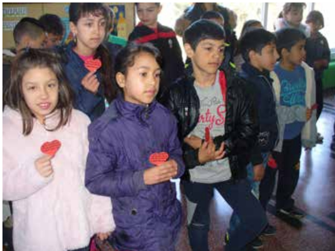
За Деня на търпението...