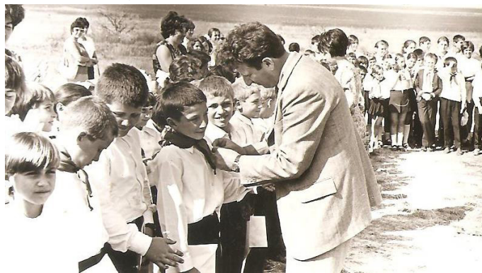
Връзване на пионерските връзки на паметника на съветските летци.

Н.К. – От началото на 60-те години на XX-ти век, Шабла започна да придобива нов облик, създаде се инфраструктура – пътища, обществени сгради... Селището постепенно се благоустрояваше. Това да станем град преди 50 години, не се дължи само на ръководителите на Партия, Държава или Община. Основната заслуга е на хората – жителите на Шабла и Общината! Макар и със славно историческо минало, ние бяхме едно пращино и кално добруджанско село, което благодарение на колективния труд на своите жители, придоби статута на „селище