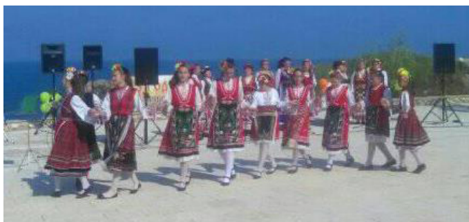
Поздрав от фолклорна група „Шарено коланче“.