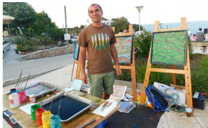
Една от многото атрактивни културни изяви на „Тюленово арт фест 2019“ – перформанс на тюленовския бряг..

годишното шабленско читалище, на творческия и креативен дух на шабленеца и подкрепяни и водени от ангажираните специалисти отбън. Мариан Жечев