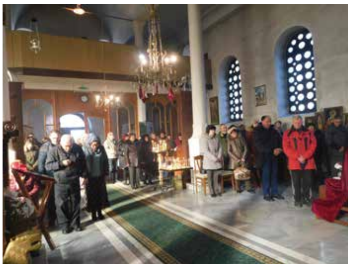
Миряните на празника

За съжаление, Варненския и Великопреславски митрополит Йоан, не успя да присъства на литургията. След празничната