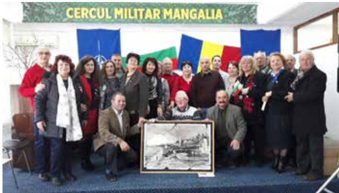
Участниците в празника, в Мангалия