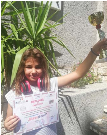
Купа и грамота от фестивала.