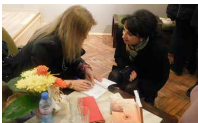
Автографи за почитателите