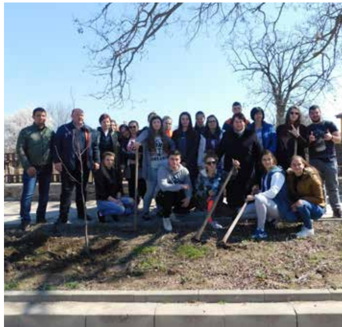
Участниците в инициативата

На 27-ми август, тази година ще отбележим петдесетгодишнината от обявяването на Шабла за град.