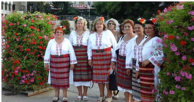
От 23 до 25 август, певческа група „Кардарина“ при НЧ „Победа - 1941 година“ с.Горичане взе участие в румънско - българския фестивал „Тулча 2019“ и се представи достойно.