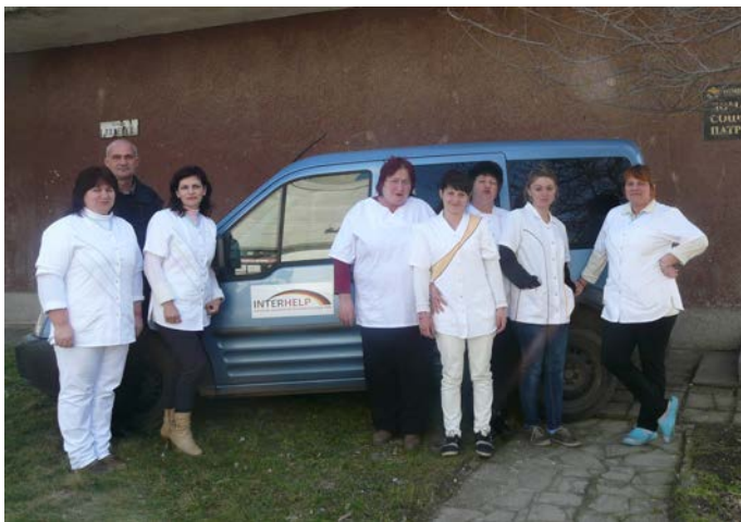
Колективът на Държавния социален патронаж Шабла, на фона на подарения на 22-ри юли, 2016-та год. автомобил за обслужване на потребителите на Патронажа.