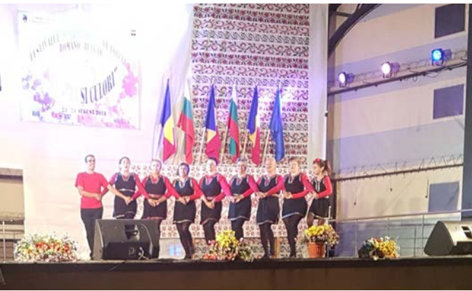
Танцов клуб „Дилбера“ на сцената.