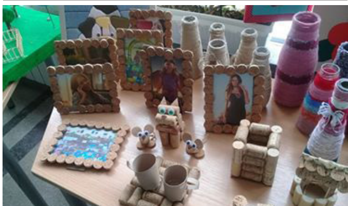
Второкласниците от групата за целодневна организация на учебния ден изработиха това.

ПРОДАВАМ ДЪРВА ЗА ОГРЕВ АКАЦИЯ – 95 лв. цепеници ГЛЕДИЧ, ЯСЕН И МЕШЕ – 100 лв. цепеници Осигурен транспорт в рамките на гр. Шабла Телефон за контакт: 0888/ 78 12 66