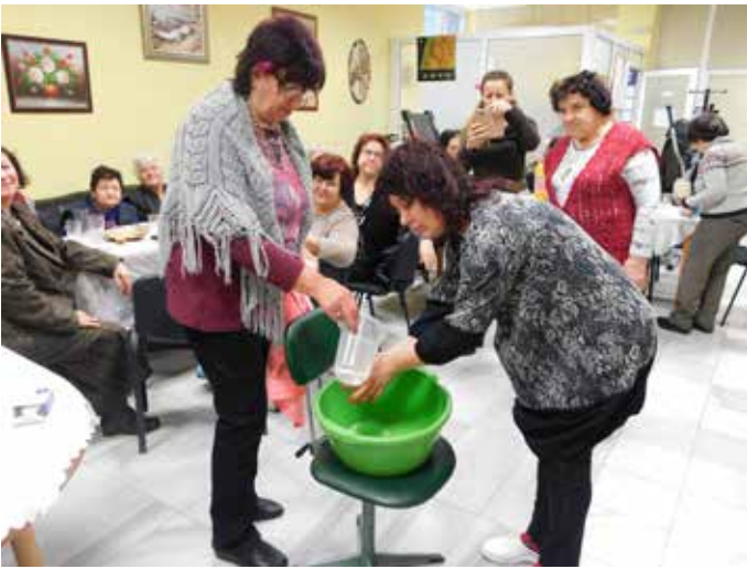
И в ЦСРИ пресъздадохме обичая „Бабинден“. Двадесет и две от потребителките на Центъра, заедно с колектива на ЦСРИ празнуваха вчера.

плакало по едно бебе. От 16-те пеленачета, момичетата са 4, а момченцата 12. Ако се върнем година назад, през 2017 година в Общината са се родили 32 деца, 24 от тях в Шабла и 8 в селата. Представителките на нежния пол са 19, а юнаците са 13. За сравнение, през 2016 годи-