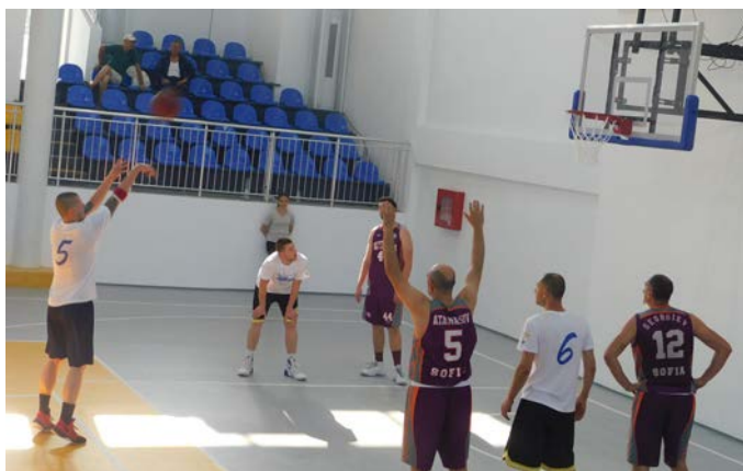
Този път – кош от фаул.