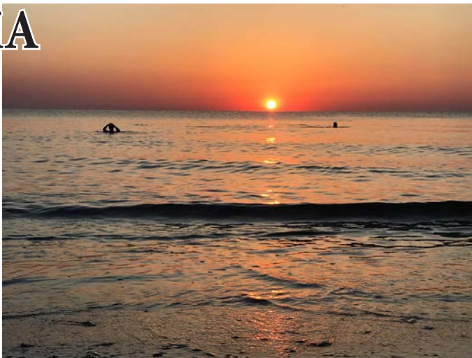
Първото юлско слънце на шабленския бряг

както и с песни от предстоящия им за издаване първи албум. После група „Хоризонт“, доказа защо са име на българската рок-сцена от повече от 25 години. Изнасялата концерти в Европа и извън нея банда, подготви феновете за кулминацията на вечерта – Стефан Вълдобрев и „Обичайните заподозрени“. Повече за тях и шабленската им фиеста, очаквайте в някой от следващите броеве на „Изгрев“ от българската рок-легенда – Иван Лечев.