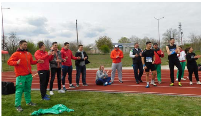
Беларуските атлети, в сектора за хвърляния.

дължина от място с лично постижение – 1,78 м. Той скача заедно с 24 деца. Престижни