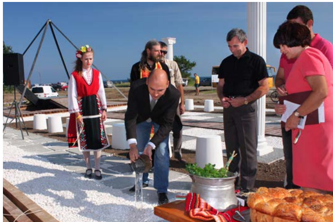
Министърът на земеделието и горите Васил Грудев открива зоната за отдих до фар Шабла, 24 август 2014 година.

РБ – Отрязъкът от време - 2011-2015 г., като кмет на община Шабла, бе чест и изпитание за мен. През 2012 г. общината бе първа в държавата по събрани данъци и такси, факт добре афиширан в пространството, а през следващата - 2013 г., на трето място в номинацията „Кмет на годината“ по важен показател - „за най-много спечелени проекти и подписани договори“. Размерът на субсидията за мандата достигна 25 милиона лева. Разбира се, че проектите могат да бъдат градириани по принос, но подходът е леко лабилен. И все пак най-важен е този за изградената водопроводна мрежа в селата Дуранкулак, Ваклино, Крапец и Езерец, най-красив - градския парк, най-авангар-