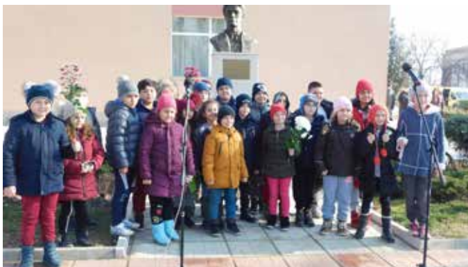
Цветя от второкласниците