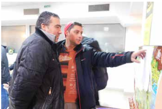
Временното класиране е динамична величина...