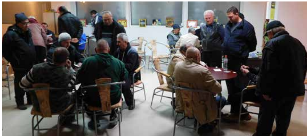
Турнирът в разгара си