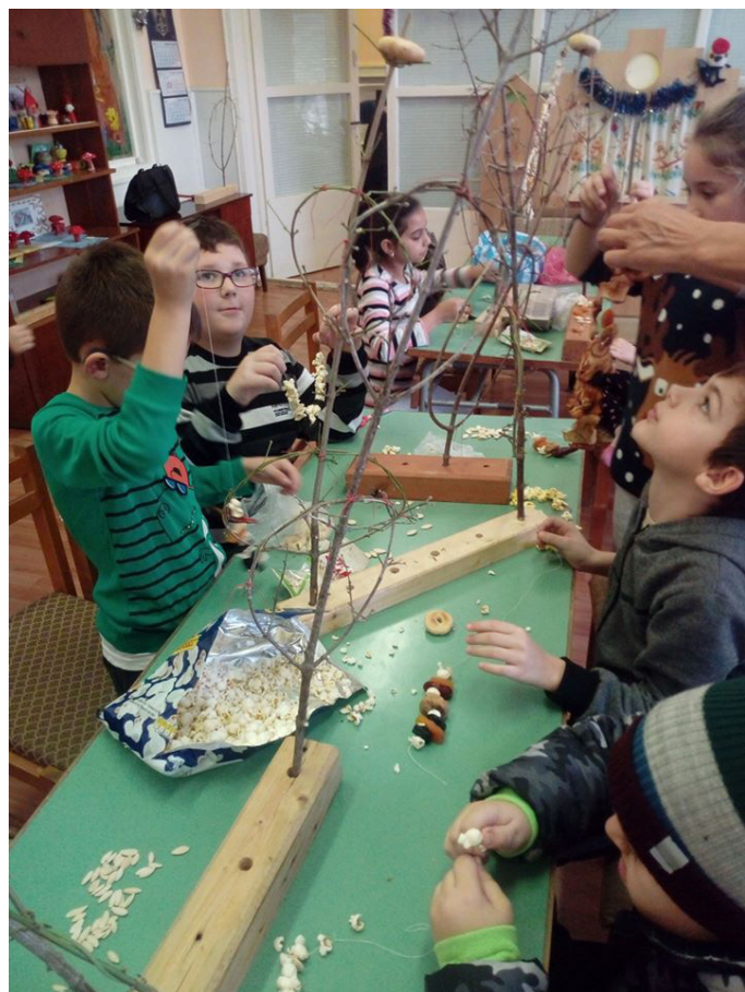
Работилницата за сурвакници в Общински детски комплекс.