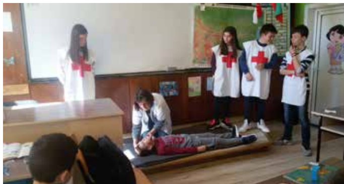
Урок по Биология и здравно образование с учениците от VIII клас - Оказване на първа помощ при различни видове травми