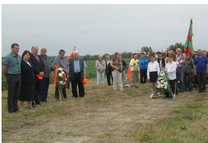
На Грекова могила

По време на възпоменателния митинг в центъра на Дуранкулак към присъстващите се обърна кметът на община