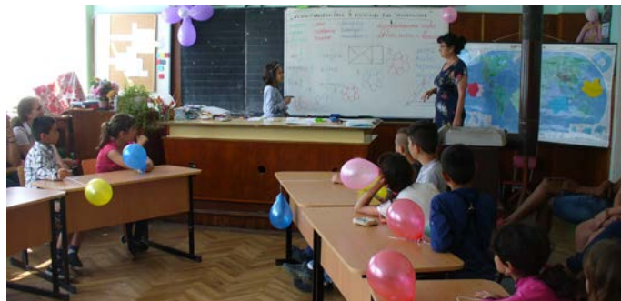
Ученичка обяснява правописа на дума.