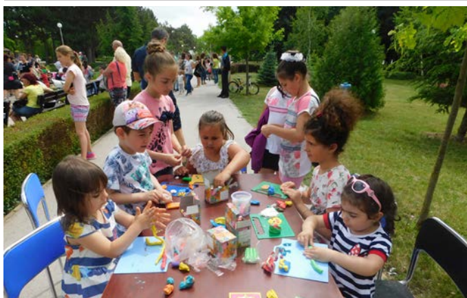
Някои с удоволствие рисуваха и моделираха.