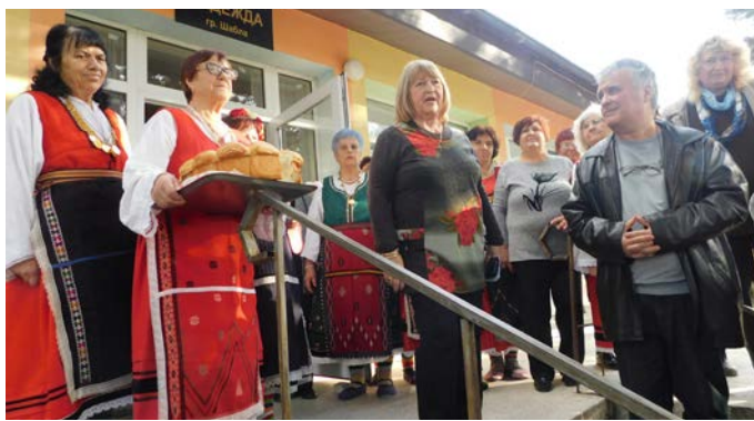
Посрещане на гостите в пенсионерски клуб „Надежда“.

Целта на Форума бе да събере заинтересовани страни, било то местни публични администрации или туристически експерти, за да се направят изводи и да се изкажат обективни становища за това, какви оптимални мерки могат да бъдат предприети в краткосрочен и дългосрочен период, за да може да се постигнат предпоставки за устойчиво развитие на туризма.