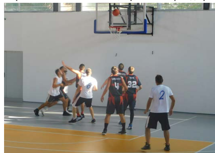
Шабленци атакуват през първото полувреме.

През изминалата седмица, в ремонтираната и реновирана Спортна зала в Шабла бе богато откъм баскетболни събития. От 2-ри до 8-ми септември, със съдействието на община Шабла, тренировъчния си лагер проведеха 42 деца от баскетболен клуб „Unstoppable“ – Добрич на възраст от 10 до 17 години придружавани от трима треньори.