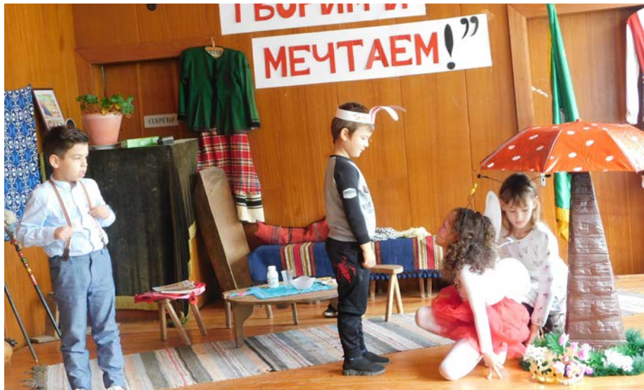
Драматизация на приказката „Под гъбката“ от Владимир Сутеев.

В словото си кметът на общината честити празника на всички и каза, че за пореден път учениците са перфектно подготвени. Поздрави ги затова, че залагат на българското – песни, танци и приказки. Но трябва да познават и красотата на природата, на българската история. Да научават нещо ново за България.