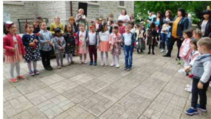
Малчуганите от ДГ „Дора Габе“ отбелязаха Празника на буквите.