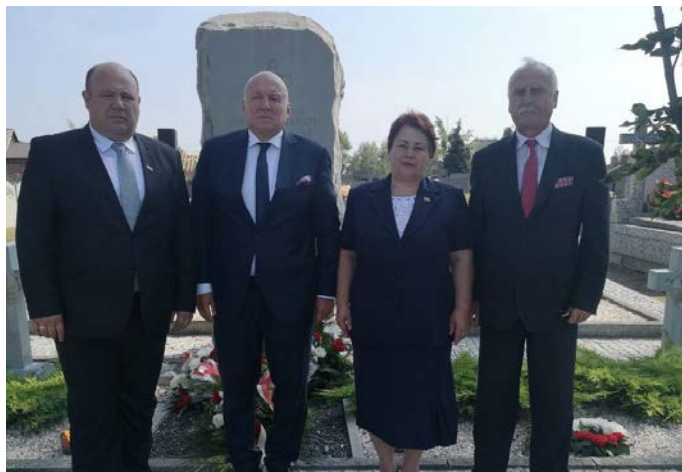
Поклон пред жертвите от войната.