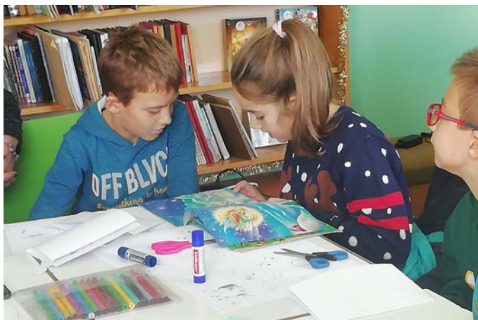
Учениците от втори клас научиха кой е свети Николай.

На 10 декември, детският отдел на библиотеката посети децата от ДГ „Дора Габе“. Най-малките шабленци разбраха каква е ролята на коледните джуджета и чуха коледната приказка „Коледна изненада“, за която бе подготвено и слайд