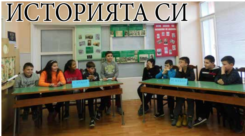
Участниците във викторината