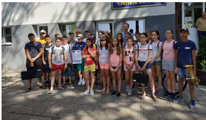
Пред НУМСИ „Христина Морфова“ в Стара Загора

Въпреки ежедневните репетиции, свободното време децата използваха за забавления и за игра на тенис на корт. Изнесените творчески занимания преминаха в дух на разбирателство, партньорство и толерантност.