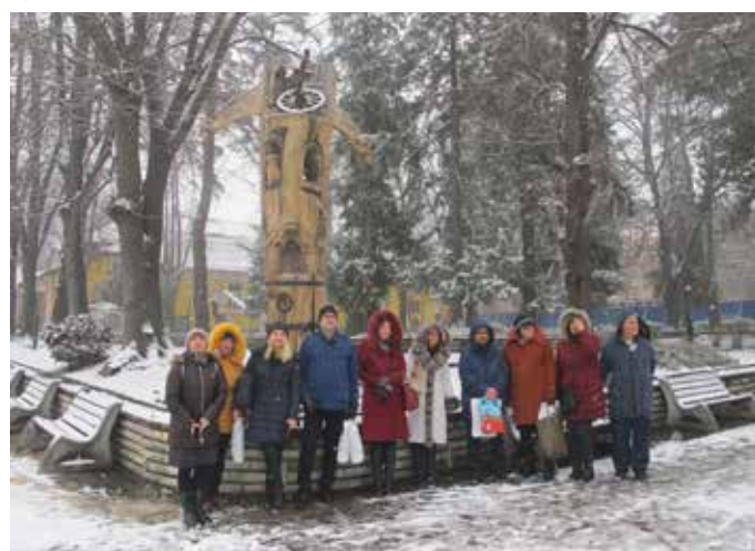
Пред „Дървото на живота“ в центъра на Берковица. Преди години великият Йордан Радичков е завършил гимназия в града. Творчеството му е вдъхновило автора на оригиналната скулптура.

На 24 януари 2019 г. в Заседателната зала на ОБА Берковица се проведе официална работна среща по проект Joyride „Общи ресурси и инициативи, посветени на околната среда“. Екипите от румънските общини Аджиджа и Банаеса и българските Шабла и Берковица обсъдихме устойчивото изпълнение на проекта, основните цели, дейности и очаквани резултати. На