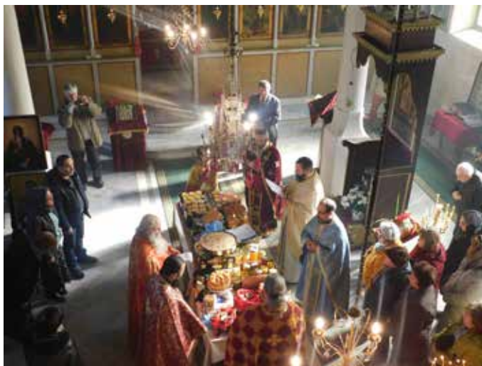
Освещаването на меда

единствен, който празнува на този ден от всички храмове във Варненска епархия.