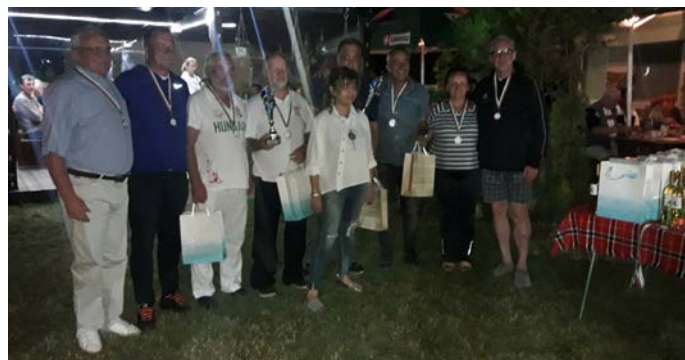
Награждаването на призворите.