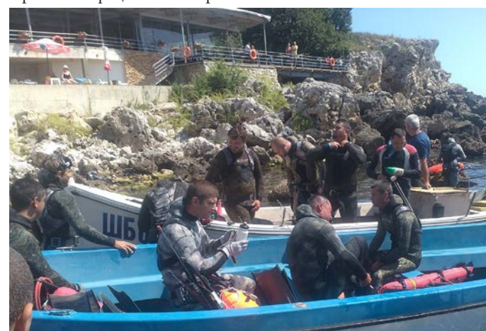
Състезателите на „Портус Кариа“ (на далечната лодка) – на старта

състезанието. Събитието се радваше на голям интерес и посещаемост от състезатели, туристи и местни жители“, информират организаторите.