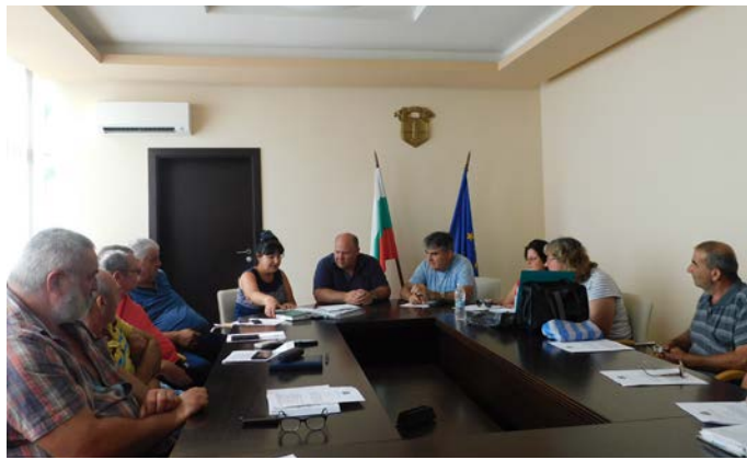
Общинската епизоотична комисия заседава вчера, 29-ти юли.

прасета в т. нар. „заден двор“, имат гратисен период, в който