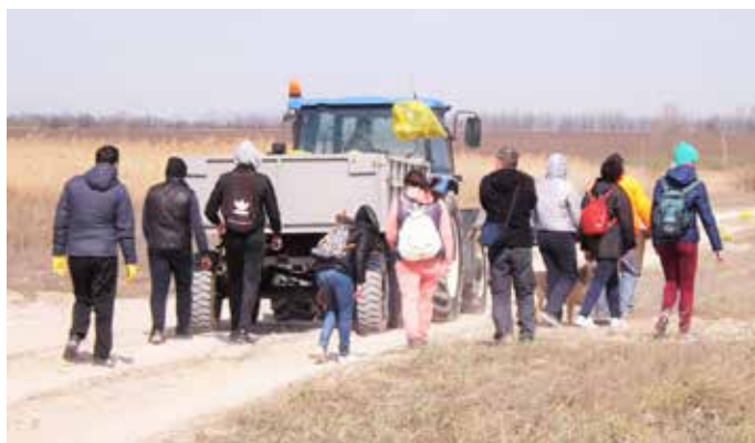
Доброволците в благородната инициатива