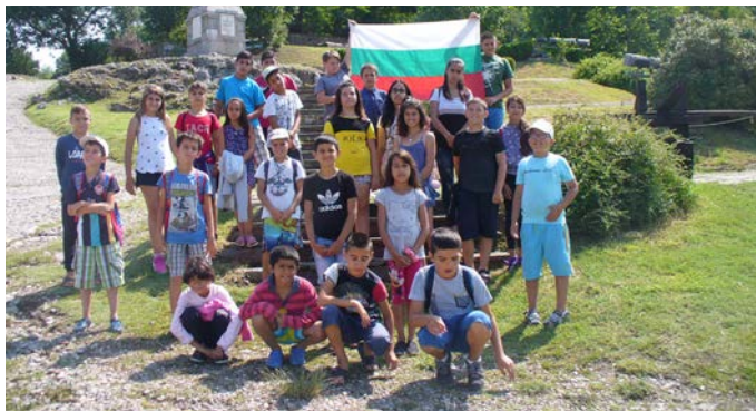
Пред мястото, където цар Фердинанд е обявил независимостта на България