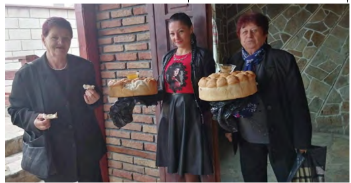
Всеки присъстващ беше посрещнат по стар български обичай.

На 5 октомври 2019 година в село Езерец се проведе Земляческа среща 2019.