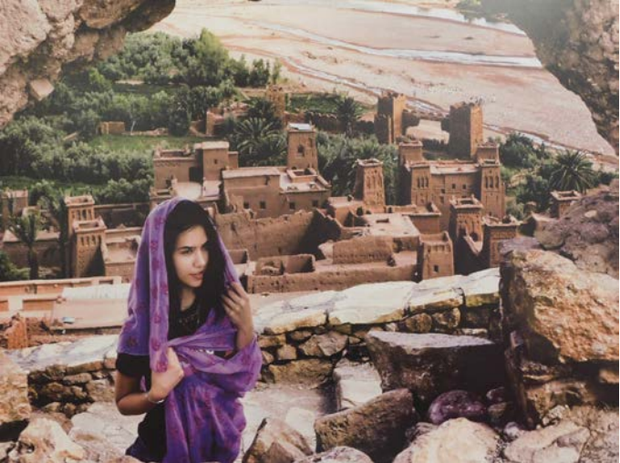
Фотографката е заснела дъщеря си на фона на стара арабска крепост.

В цветната палитра на нови за тях свят и култура се потопиха посетителите на Зеления образователен център в Шабла