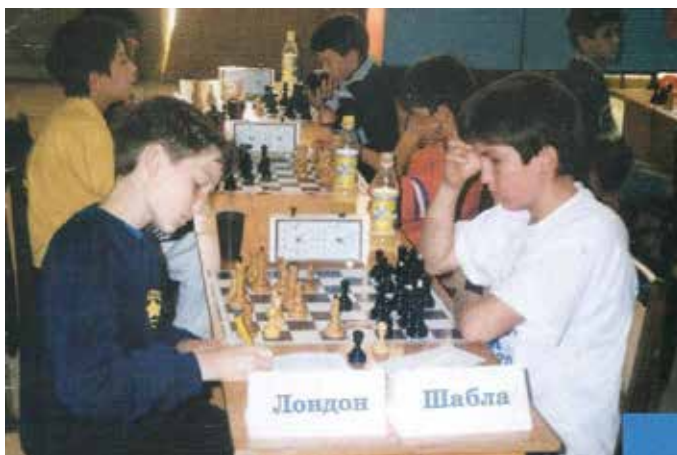
През 2000-та година в гр. Судак (Украйна), на Европейското първенство за училищни шахматни отбори, ЕСПУ „Асен Златаров“ печели седмото място. Победени са Одеса, Ростов на Дон и Москва II.