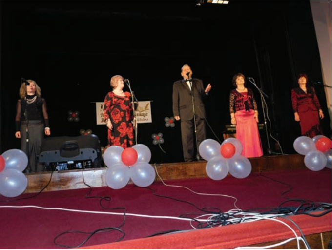
Вокална група „Палитра“