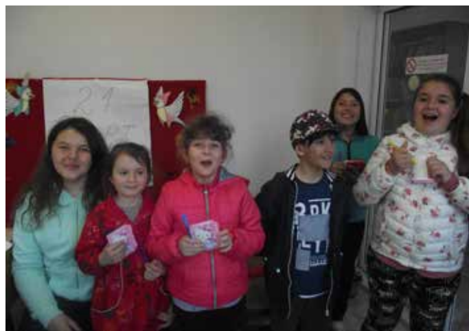
Бъдещите големи творци на перото

По повод Световния ден на поезията на 21 март в библиотеката при читалище „Слънце 1871“, с.Крапец се проведе конкурс за авторско стихотворение.