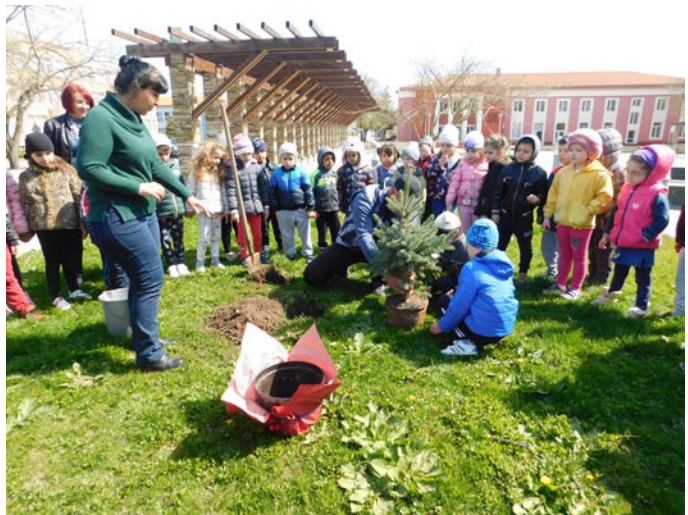
Едно родолюбиво дело...