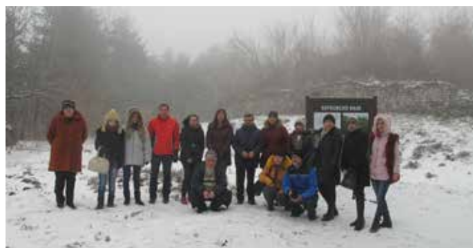
На връх Ком.