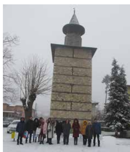
Пред часовниковата кула в Берковица. Тя е строена през XVIII-ти век.