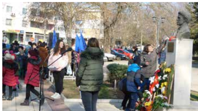
Малки и големи отдадоха своята почит с цвете в ръка