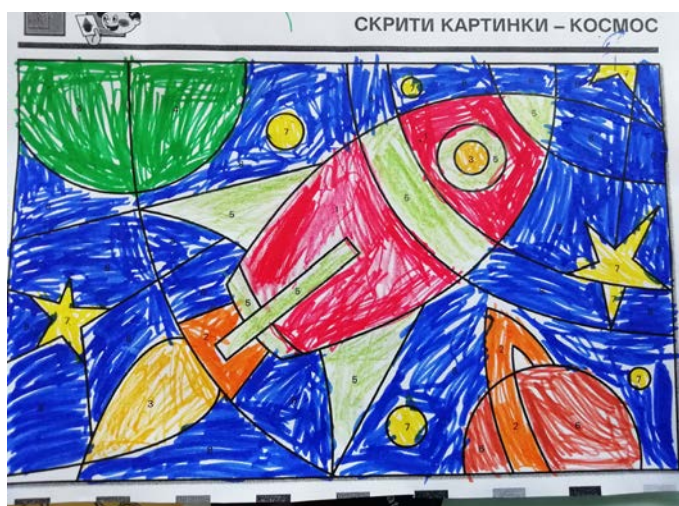
Една от нарисваните от децата ракети

бено впечатление им направи легендата за Малката и Голямата Мечка и те разбраха, защо точно това е мястото на тези известни съзвездия на небето. Читателите изработиха звезди от картон и свързваха съзвездия с техните наименования. По-малките читатели откриха в рисунки с обозначени числа и съответните цветове ракети в космоса. За тях бяха под-