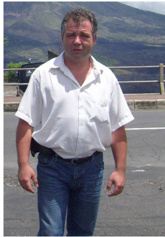
На фона на действащия вулкан Агунг, на о. Бали

ство е морето – то дава много възможности. 22% от плажовете на България са на територията на община Шабла. Тук е и най-старият морски фар на Балканите, най-старото известно каменно селище в Европа (край Дуранкулак), древната крепост Кария - Шабла има и богата история. Всичко избро-