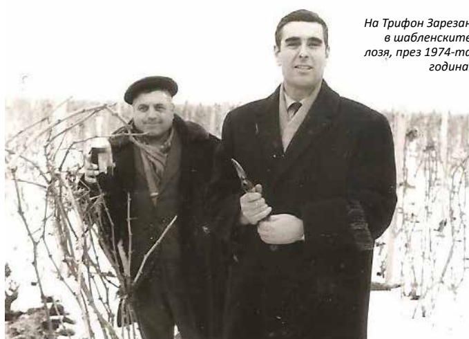
На Трифон Зарезан в шабленските лозя, през 1974-та година.