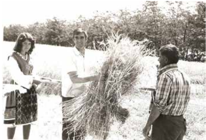
Откриване на жътвата...