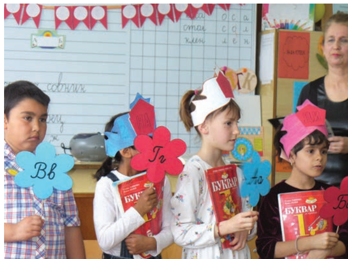
И първокласниците в дуранкулашкото училище показаха пред родителите си, че са научили буквите.