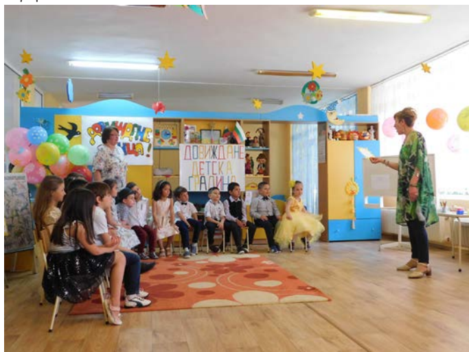
По време на програмата.

На 30 май, ДГ „Дора Габе“ изпрати възпитаниците си от четвърта подготвителна група в първи клас – събитие, което децата чакат с огромно вълнение.