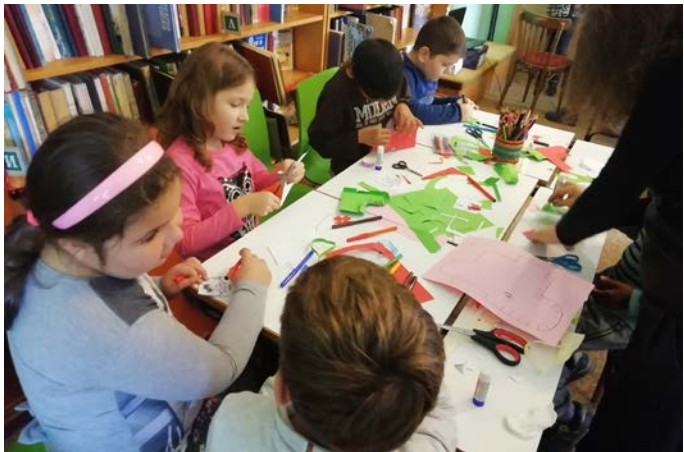
Първокласниците изработиха свои коледни чорапчета от хартия.

На Никулден - 6 декември, Коледното четене в детския отдел на библиотеката завър-