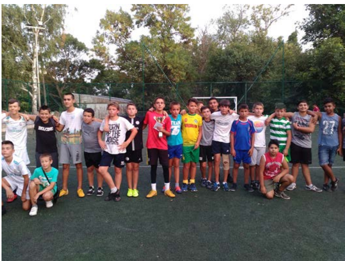
Призьорите след награждаването

„Black tigers“ с 10:1, а ФК „Крапец“, подкрепяни от мощната си агитка, преодоляха „Черно море“ с 6:4.