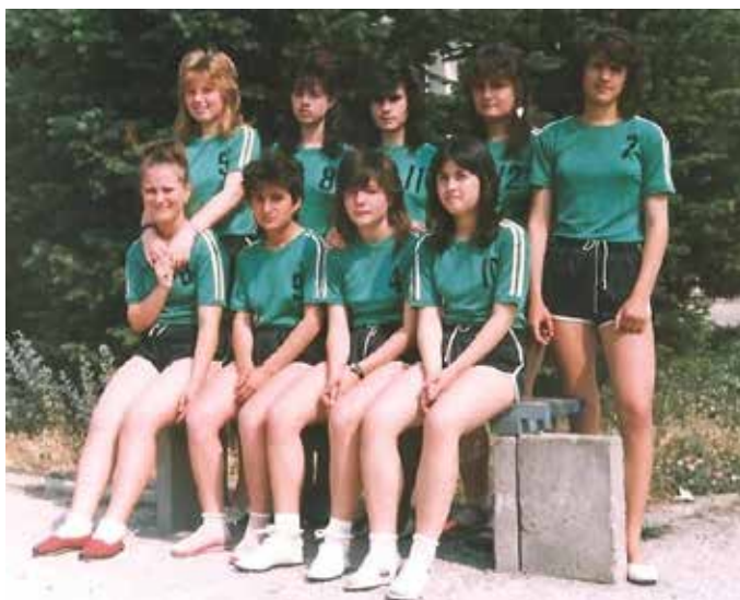
Баскетболният отбор на НОУ „Иван Вазов“ с. Ваклино, класирал се на IV-то място на Републиканското първенство на основните училища през 1990-та година.