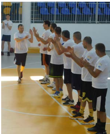
Отборът на Шабла.