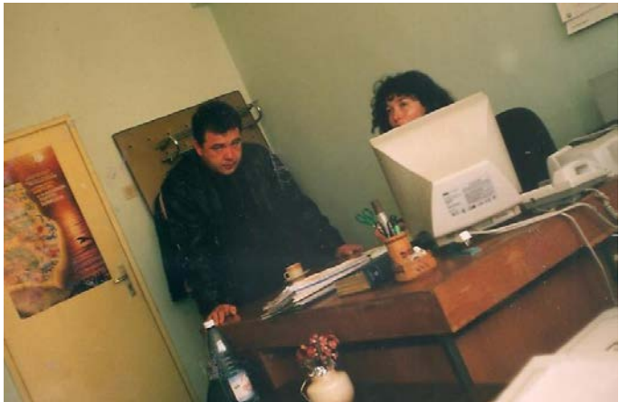
В общинска администрация Шабла, в работна обстановка

сме инженер-агрономи. Когато дойдох тук за пръв път през 1988-ма година си казах – това е райско кътче! От 1992-ра до