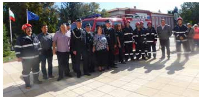
1 септември 2019 г. – пред подарения от община Терешин на община Шабла противопожарен автомобил.