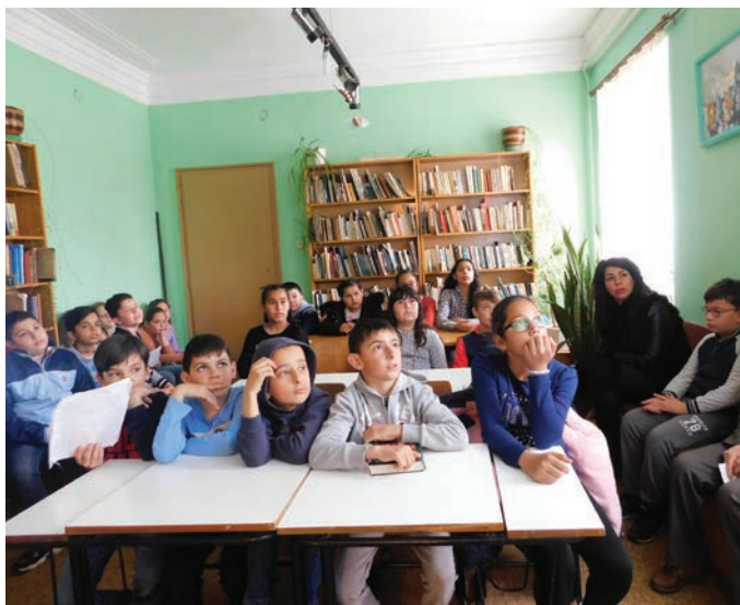
И четвъртокласниците се включиха в маратона на четенето.