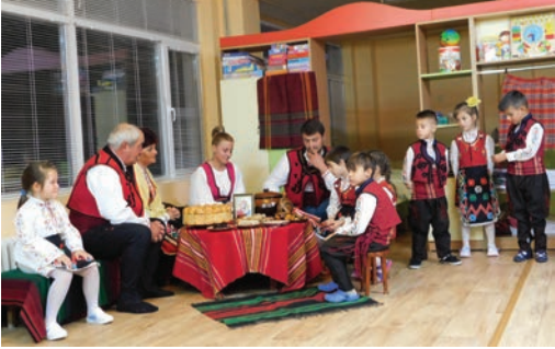
Момент от празника.

В Деня на християнското семейство, 21 ноември, децата от четвърта група „Смехорани“ на ДГ „Дора Габе“ честваха празника със своите родители и близки. Приятна атмосфера, усмихнати деца, облечени в български народни носии, изпълнени с вълнение гости. Песни, танци, стихотворения изпълниха дома на „Смехорани“-те, където обстановката беше типична за някогашните празници – софрата, иконата на св. Богородица, ястията. Децата засвидетелстваха обичта си към всички представители в семейството – мама и татко, баба и дядо, братя и сестри. В инициативата бяха подкрепени от своите родители, от своите близки. Нещо повече – участваха в тържеството, за да насърчат и окуражат децата,