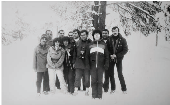
Членове на волейболния отбор към ЕМЗ Шабла със съпругите си на зимен подготвителен лагер.

ния за производството на стъклорингови цилиндри. Поради сложния и абсолютно непознат за нас технологичен процес за