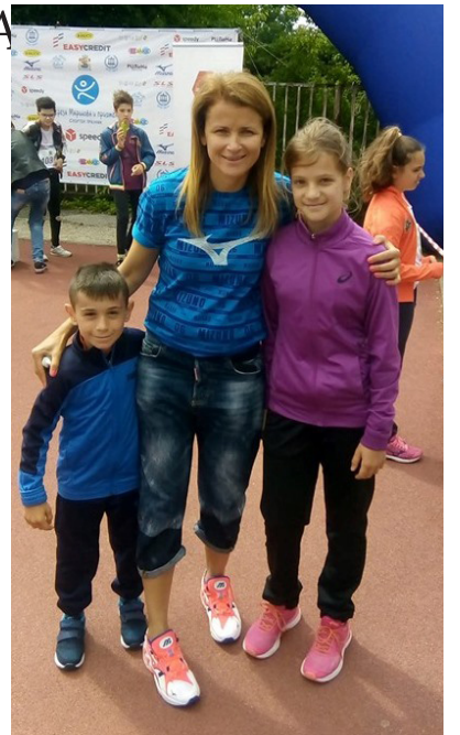
Олимпийската и световна шампионка, Тереза Маринова - с нашите състезатели.

те възрастови групи бяха 40 м, 60 м, 600 м, скок на дължина от място и скок дължина.