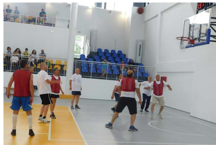
Шабленските ветерани в битка.

защита и то агресивно. Но той няколко пъти стреля и „през човек“, вкара 8 от 10 опита от тройката – статистика, с която може да се гордее и баскетболист от НБА! Изпуснахме и голям процент от наказателните