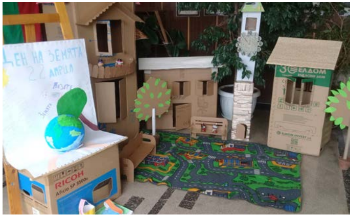
Автори: Йоана Милкова от 7 клас и второкласниците.