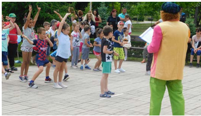
Всички деца се включиха с ентузиазъм в празничните игри.