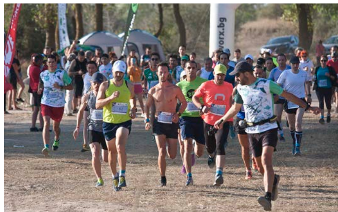
Стартът на дисциплината 13 км. в Крапец