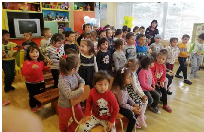
Библиотеката гостува и в детска градина „Дора Габе“- Шабла.