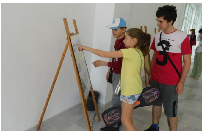
Преди началото на тържеството, малките шабленци с интерес разгледаха фотоизложбата, подредена във фойето на Спортната зала.

бленския баскетбол моменти. Залата на обновения „Спортен Комплекс Шабла“ бе препълнена с баскетболни трениров