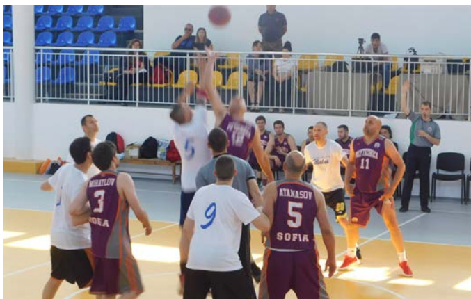
Шабла – „Политехника“ – началото...