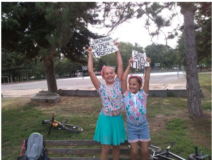
Атрактивните фенки на „Крапец“, непрекъснато подкрепяха отбора си.

За финалната среща се класираха „Нефтяник Шабла“ и ФК „Крапец“, след като на полуфиналите „Нефтяник“ прегази