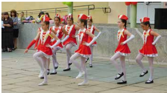
Мажоретките от ОДК, двукратни златни медалистки от конкурса в Генерал Тошево преди месец.