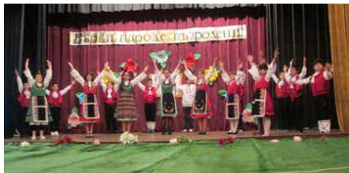
С български народни ритми завърши тържеството в Дуранкулак.