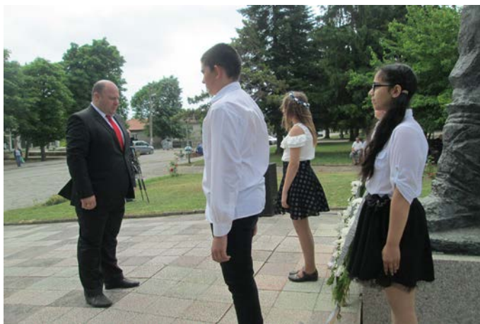
Кметът на Общината сведе глава пред паметника на въстанилия селянин в центъра на Дуранкулак.