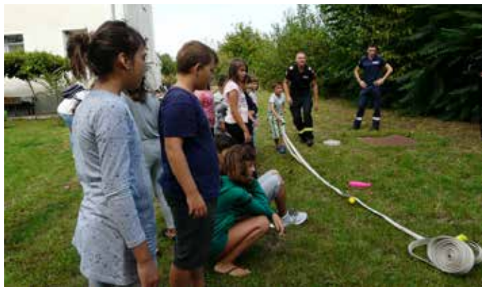
Много бяха желаещите да се включат в играта „Пожарникарски боулинг“, но малцина успяха да се справят.

Традиционната Седмица на пожарната безопасност започна от 10-ти и продължи до 16-ти септември. Тя има за цел популяризиране на професията на пожарникарите и спасителите, провеждане на информационно-разяснителни мероприятия сред обществеността, демонстрации на професионални умения и техника, работа с подрастващите, срещи с граждани и други.