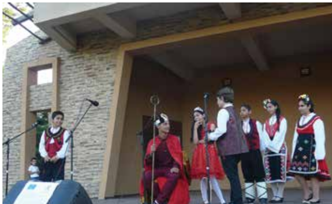
На сцената: ученици от ОУ „Св. Кл. Охридски“ село Дуранкулак

На 14 юни 2018 година, в Градския парк на Шабла се проведе преглед на самодейните състави от Общината и участници по проект „Равни възможности за нашите деца