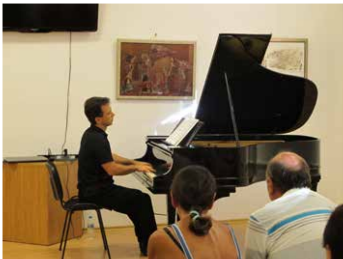
Виртуозът „говори“ с рояла си на публиката