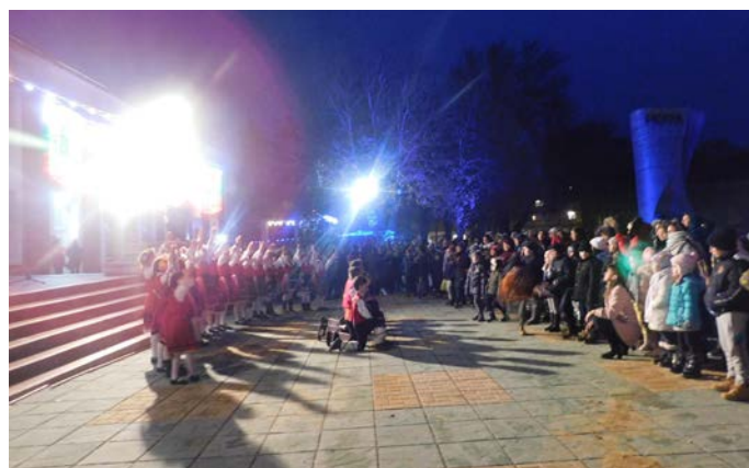
Поздрав от ДТС „Бърборино“

Община Шабла организира в града КОЛЕДЕН БАЗАР от 19 до 21 декември във фойето на НЧ „Зора 1894“