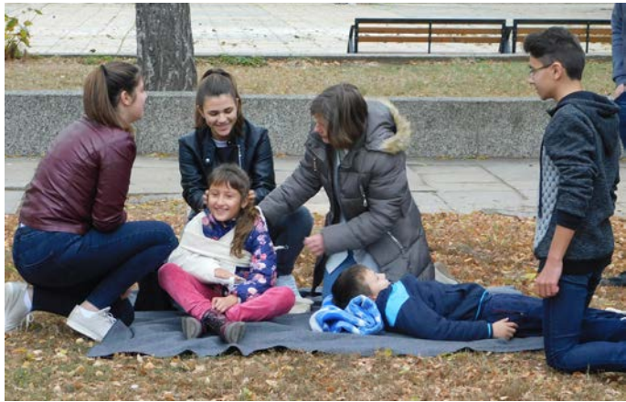
Първа помощ за „пострадалите“...

ръст на установените зад волана без свидетелство за правоуправление на моторно превозно средство. Не на последно място той подчерта, че с направените промени - изискване за завършен 10 клас, за да може да бъде един водач правоспособен, се очаква да се увеличи броят на шофьори зад волана без права. Участниците в комисията одобриха предложението, което ще бъде изпратено по надлежния ред.