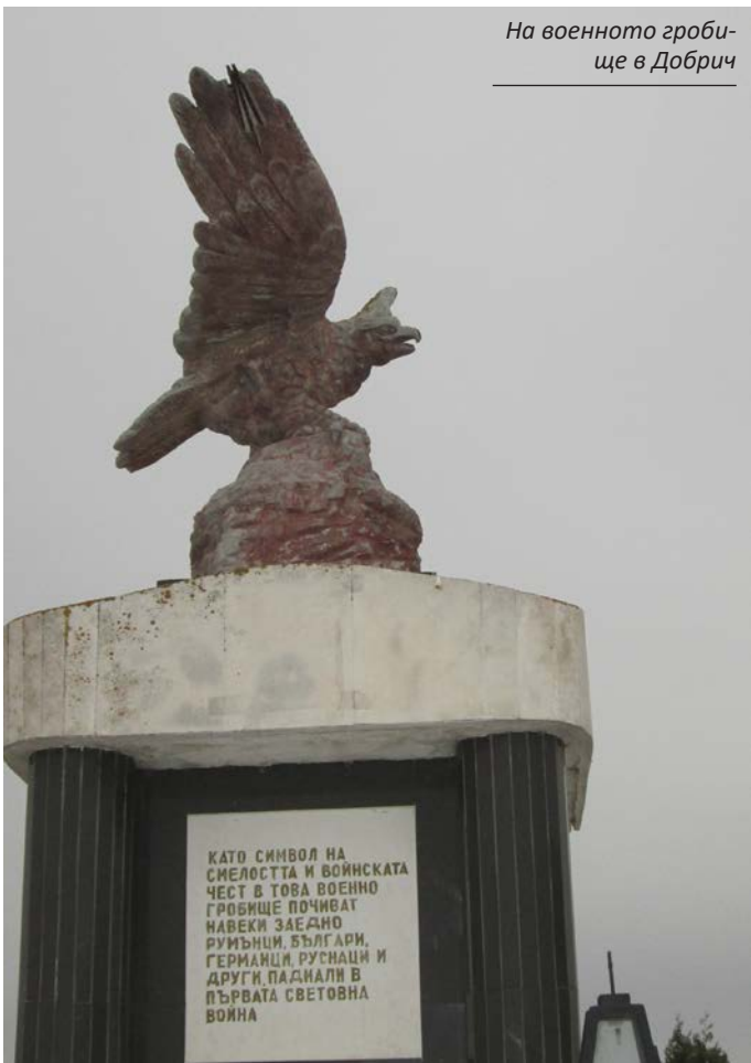
На военното гробище в Добрич

Организирането на конференцията е със смесено финансиране, от проекта и от Националния комитет за честване на 100-годишнината от Първата световна война. Модератори на двете пленарни заседания на 13 ноември бяха проф. д.и.н.