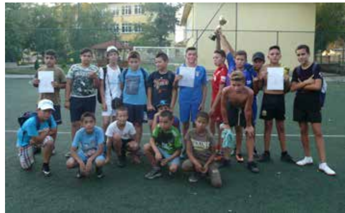
Победителите – с купата, капитаните на другите отбори държат в ръце грамоти за участие