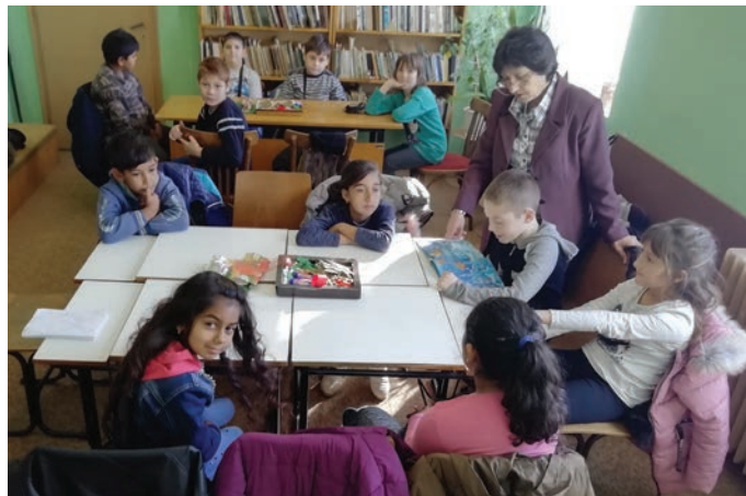
Трети „Б“ клас, всеки момент ще започнат да творят...

Коледното четене продължи и наврх Никулден, 6-ти де-