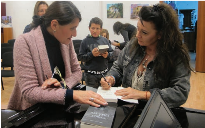
Поредната щастлива читателка, получава автограф-послание от писателката