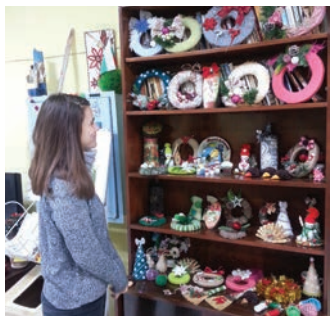
Млада гостенка на Центъра, разглежда в аванс, украшенията, които ЦСРИ ще изложи на Коледния базар.