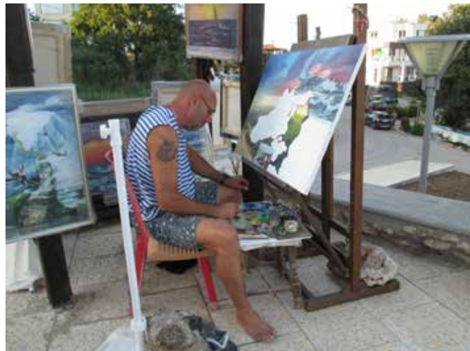
Арката „оживява“ върху платното