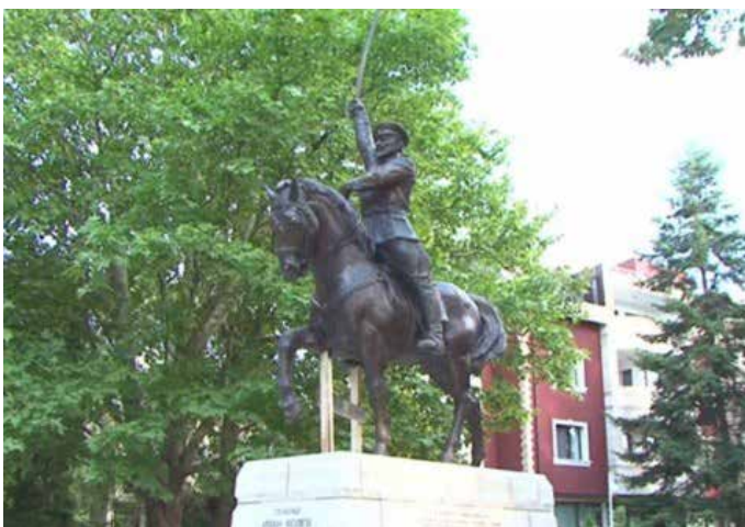
Паметникът на генерал Колев в Добрич, открит преди две години, по повод 100-годишнината от Добричката епопея.

Инициативата за обявяване на двата града за „Град на Българската бойна слава“ е подета с решения на Общинския съвет на град Добрич от 26-и юни т. г. и от 21-ви септември, 2017 г. на Общинския съвет в