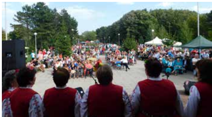
Хилядите гости на празника се наслаждават на фолклорната програма