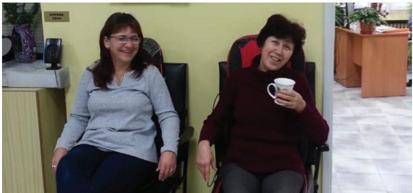
Посетителите ползват безплатните рехабилитационни процедури