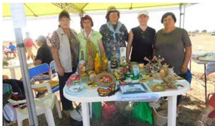
Щандът на ЦСРИ

Един хубав празник за всички свободни души, за всички мечтатели, за всички, които търсят усещане за безграничност и пространство. Празник за малки и големи, където