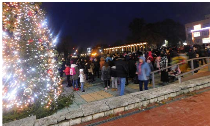
Нагиздената красавица събра малки и големи

На 5 декември, на площада пред НЧ „Зора 1894“ – Шабла, символично бяха запалени светлините на градската елха.