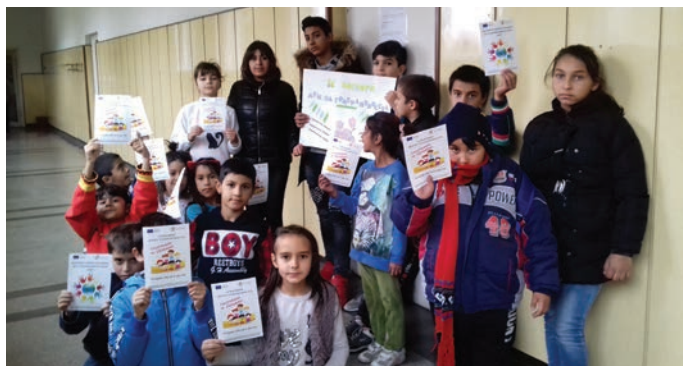
...и в Дуранкулак