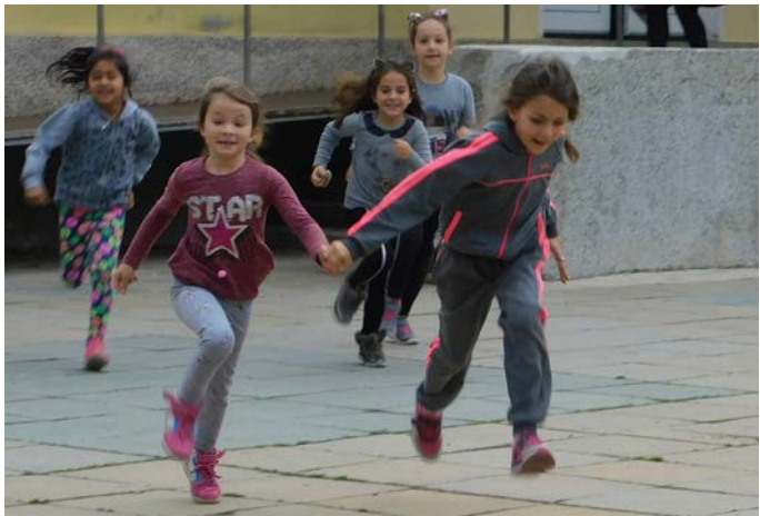
Евакуацията тече по план...

на Александрова и санитарния пост към училището. РС ПБЗН Шабла, подпомагана от гасаческата група към училището, потуши възникналия до физкултурния салон пожар.