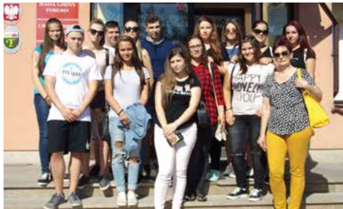
Пред сградата на общината в Терешин

Четвъртият ден бе предназначен за посещение на търговски център, а в късния следобед