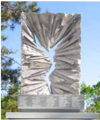
Така ще изглежда паметникът

Изграждането на паметника налага необходимостта от продължаване на кампанията за набиране на средства.