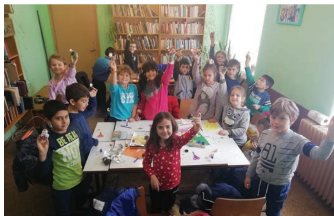
Учениците от II-ри клас гордо показват изработените от тях играчки, с които ще украсят елхата на коледния базар.

Коледното четене продължи и наврх Никулден, 6-ти де-