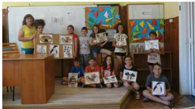
Част от работливите ръчички във вълшебната работилница