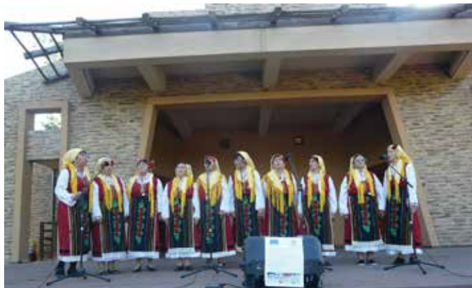
Фолклорната група от село Ваклино