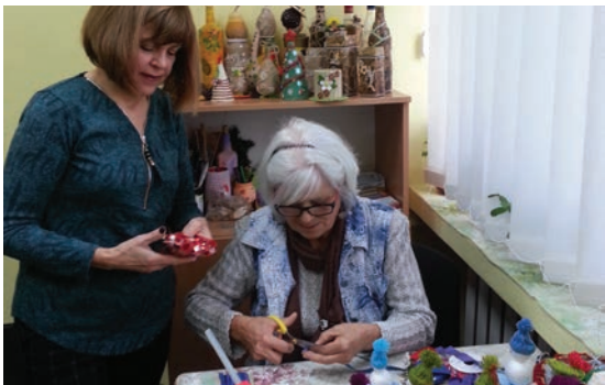
Шабленци видяха, как се изработват коледните украшения