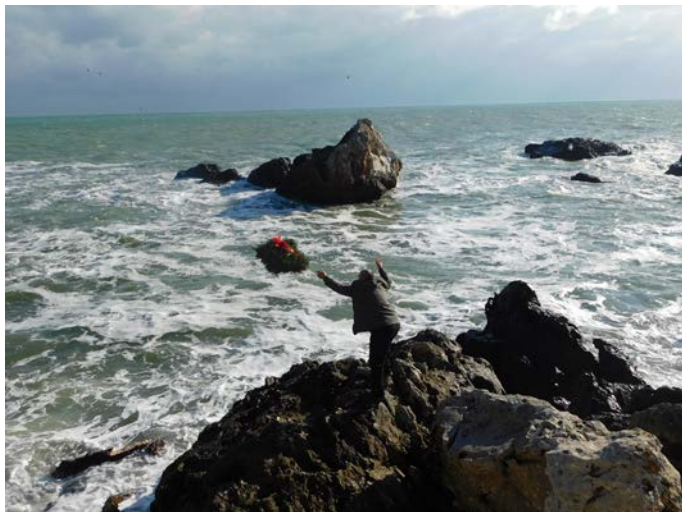
Емил Тодоров хвърли венец в морето, в памет на загиналите моряци и рибари