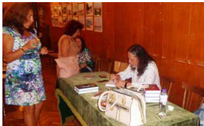
Нидал Алгафари раздава автографи на читателите в Дуранкулак

На 7 септември 2018 г., жителите и гости на Дуранкулак имаха вълнуваща среща с Нидал Алгафари - продуцент и режисьор на телевизионни предавания, документални и игрални филми, автор на художествени романи.