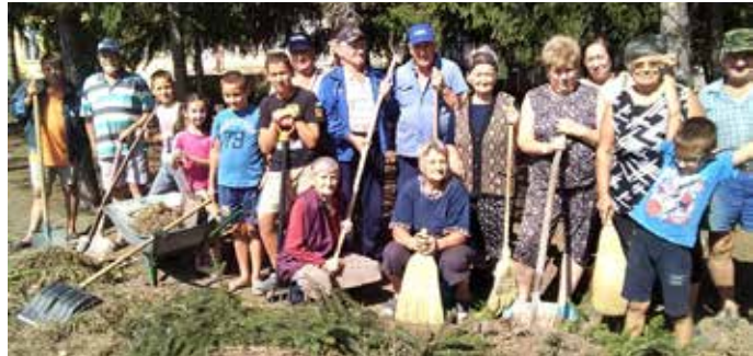
Пролезчани изчистиха своята част от България пет дни преди самата акция

Всяка година на 10-ти септември, село Пролез празнува.