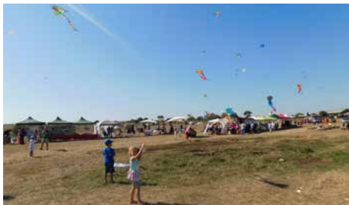
Ти лети, лети...

На фестивала можеха да се видят демонстрации на ори-