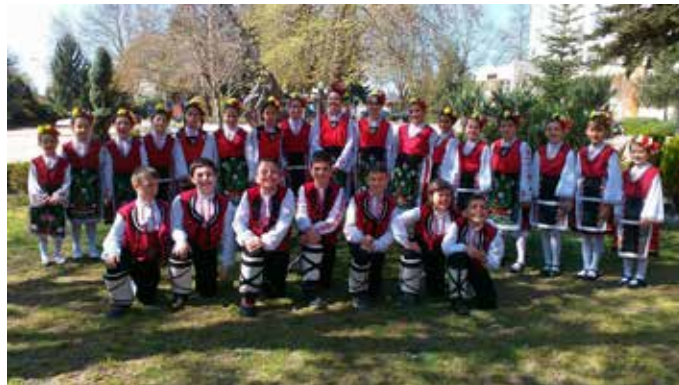
Самодейците от детски танцов състав „Бърборино“ бяха на фестивал в Балчик. Подробности очаквайте в следващия ни брой.