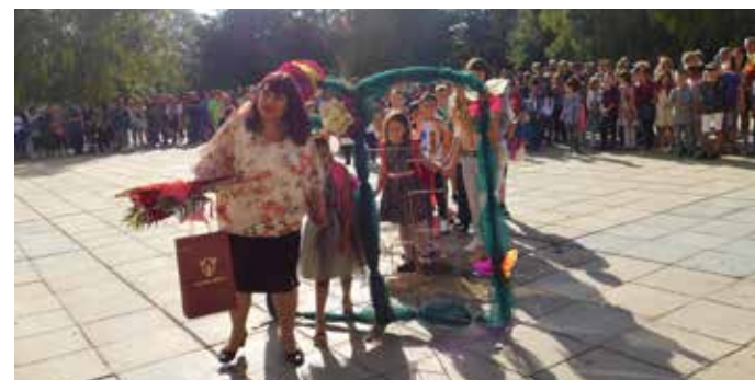
Шабленските първолаци преминаха през Буквара на знанието

каза Валентинова. Тя се обърна към най-малките ученици, първокласниците, които за първи път прекрчават училищния праг и към тези, които за последна година ще се обучават в шабленското училище-дванадесетокласниците. Приветства и учителите, пожела им сили и търпение, за да превърнат целите си в успех. Поздравиха родителите, които заедно с педагозите ще бъдат опора и подкрепа на учениците.