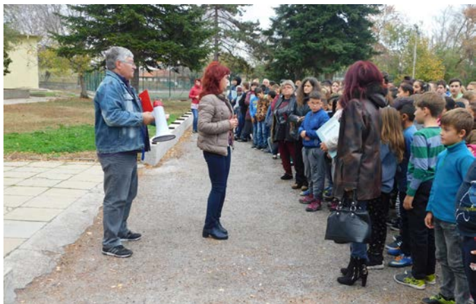
Директорът и зам. директорът на училището проверяват личния състав

Добрич с писмо на Министъра на вътрешните работи, бяха запознати всички участници в заседанието. В него са планирани дейности, които произтичат от Националната стратегия за подобряване безопасността на движението, от някои положителни европейски практики и от характерни особености, свързани с тежките произшествия на територията на нашата страна.