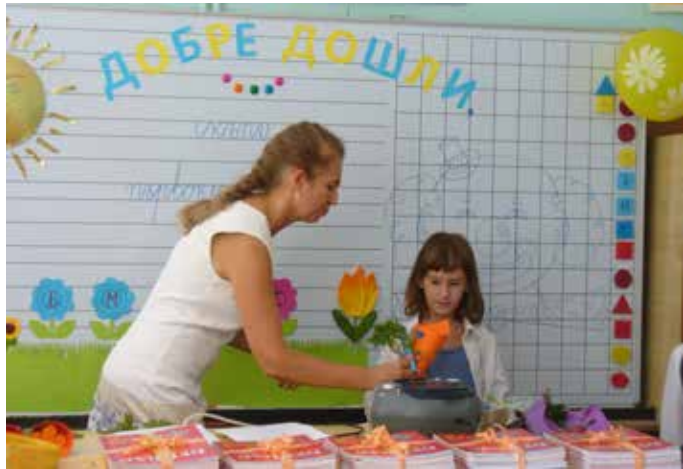
Започва първият урок в Дуранкулак