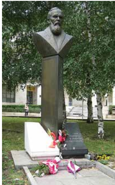
Паметникът на Фьодор Достоевски в Добрич

Паметникът- костница, в която се съхраняват костите на руските воители, загинали в бое- вете за освобождението на Ха- джиоглу Пазарджик между 17 и 27 януари 1878 год. се намира в бившите южни гробища край пътя за Варна (дн. кв. Доброти- ца). Построен е през 1900-1901