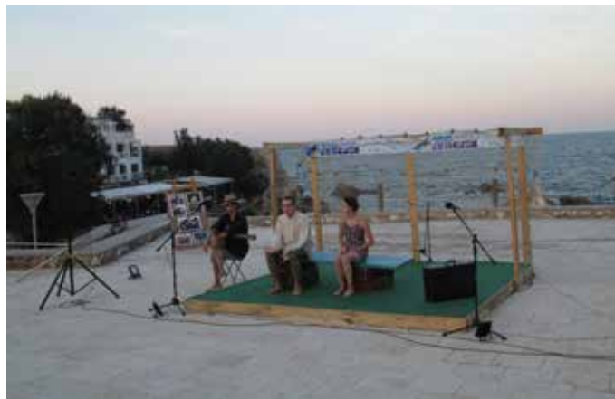
Спектакълът „Заминавам“ на тюленовска сцена