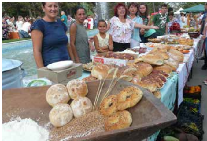
Не е малко в Добруджа да получиш наградата за „Най-вкусен обреден хляб“. Дуранкулак го направиха с новата си фурна.