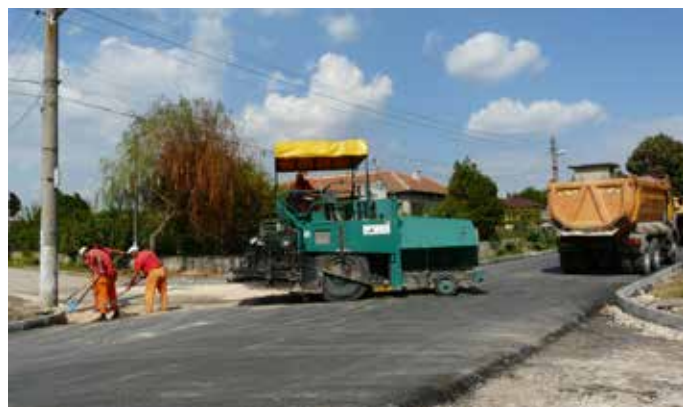
Асфалтирането на улица „Добруджа“.