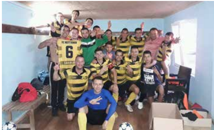
Нашиите момчета от ФК „Нефтяник 2010“