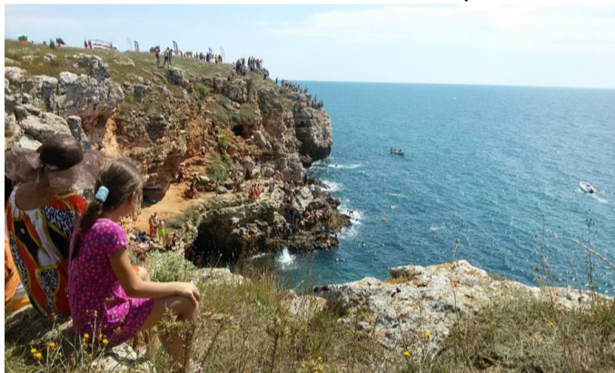
Участници и публика се събраха на скалистия бряг край село Тюленово, за да станат част от Великото скачане, 2017

За втора поредна година на 29 юли 2017 годинасе проведе Великото скачане от скалистия бряг на село Тюленово. Почивният ден събра около 1000 ентузиаста – участници и публика.