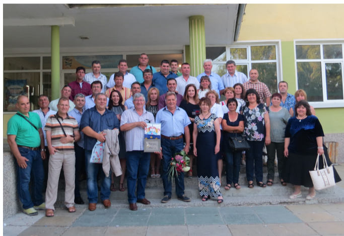
...и тези от набор 1969 година