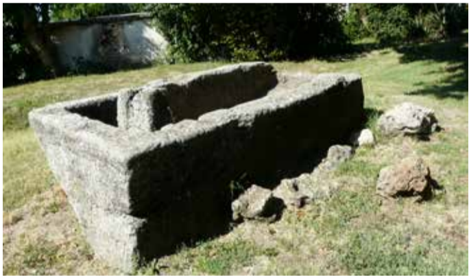
Каменно корито, олук за поене на едър рогат добитък

В настоящият ни брой стартираме нова рубрика „Познаваме ли града си“. В нея ще можете да прочетете за обекти и сгради, покрай които минаваме всеки ден, но като че ли не ги забелязваме и не знаем тяхната история.