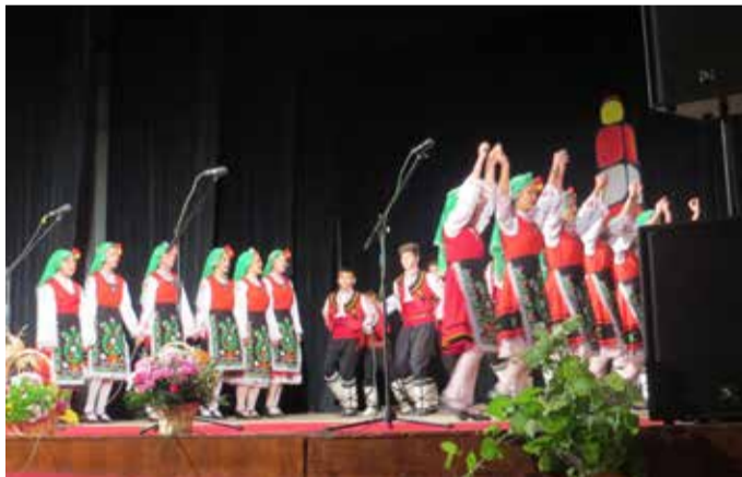
Фолклорната магия на младежки танцов състав „Българка“