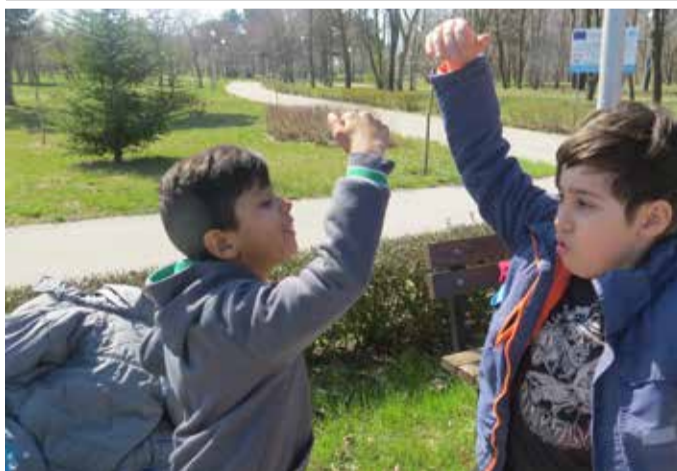
И момчета показаха танцови умения