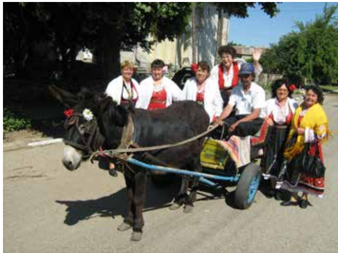
Група „Добруджанка“ на път към нивата не с CLAAS, а с магарето Чана.