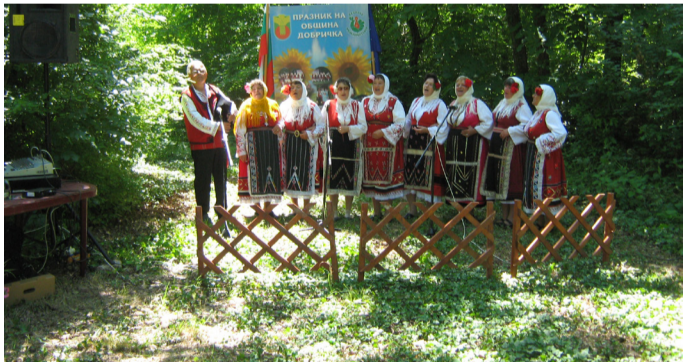
Групата от Граничар

На фолклорния събор „Песни и танци от слънчева Добруджа“ в местността „Славната канара“ край село Дебрене, взе участие певческата група „Добруджанка“ при НЧ „Свобода 1940“ с. Граничар.