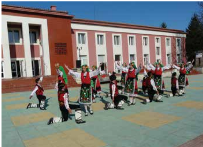
Танцов състав „Бърборино“