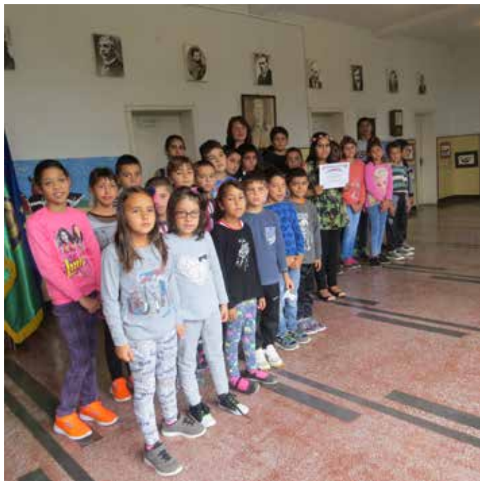
За спомен с победителката

Наградената рисунка пресъздава две природни бедствия: земетресение и наводнение. На