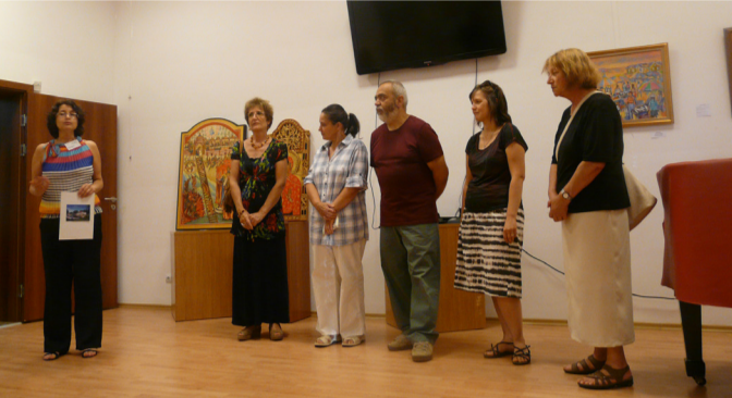
Откриването на изложбата

и поетичния диптих „Ангели“. Творбите носят красотата и хармонията на човека с природата. Галина Върбанова представя три морски композиции в голям формат, където асоциацията за соленото, изкристализирало море е пълна. Нежни и лирични платна, иначе декоративни, но разиграни от морския бриз... Художникът Живко Арнаудов присъства в изложбата с два топли, оживени, урбанистични пейзажа, в обработен маниер – „Рибен площад“ и „Пазар“.