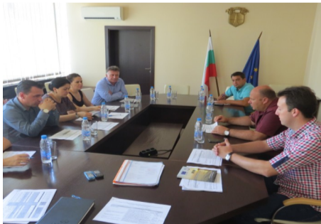
Румънската делегация беше приета от кметския екип

Следващата стъпка е подготовката на техническата документация по проекта, необходима за кандидатстването на II-ри етап по Програмата. Основните дейности, които се предвиждат по проекта, са следните: „Изготвяне на съвместно проучване на културата „Хаманджия“ и нейното въздействие в целевия регион на ЧВ;