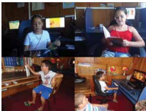
Летни занимания в Дуранкулак