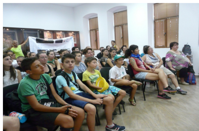
Учениците от Младежкия воден парламент

Инициативата се осъществява с финансовата подкрепа на Министерството на околната среда и водите и Басейновите дирекции на територията на България.