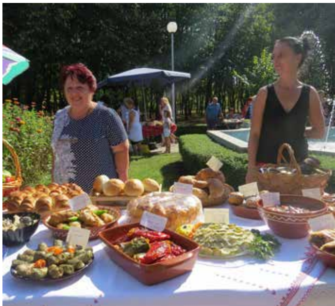
Щандът на РПК „Прогрес“ - Шабла беше с най-вкусните месни и национални ястия