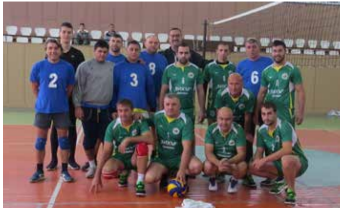
Отборите на Шабла в синьо и Сенокос в зелено, преди началото на мача