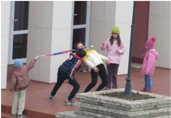
„Лимбо рок“ пред читалището – децата приветстват пролетта