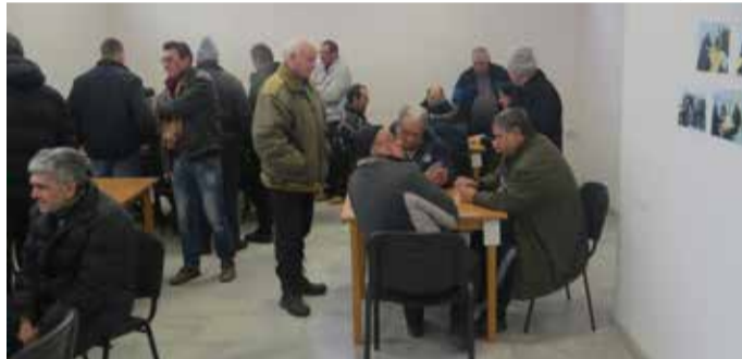
Залата е нажежена от градуса на емоциите