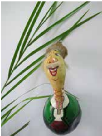
Как посрещнахме 1 април – четете в следващия ни брой

Девойки до 20 години (родени 1998 и 1999 година):400 м и копие Юноши до 20 години (родени 1998 и 1999 година): гюле (6 кг) Девойки до 18 години (родени 2000 и 2001 година): 400 м и гюле (3 кг) Юноши до 18 години (родени 2000 и 2001 година): 100 м Момичета до 16 години (родени 2002 и 2003 година): 100 м, 200 м и скок дължина Момчета до 16 години (родени 2002 и 2003 година): гюле,100 м и 200 м Момичета до 14 години (родени 2004, 2005 и 2006 година): трибой (60 м, скок дължина и 600 м) Момчета до 14 години (родени 2004, 2005 и 2006 година): трибой (60 м, скок дължина и 800 м) Момичета родени 2007, 2008 и 2009 година: 60 м и скок дължина (3 опита) Момчета родени 2007, 2008 и 2009 година: 60 м и скок дължина (3 опита)