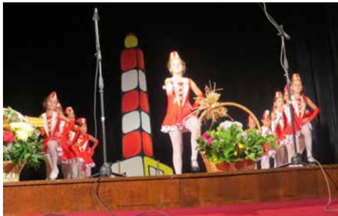
Мажоретният състав към ОДК