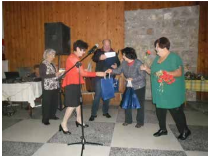
Кметът на община Шабла връчва грамоти на пенсионерите-юбиляри