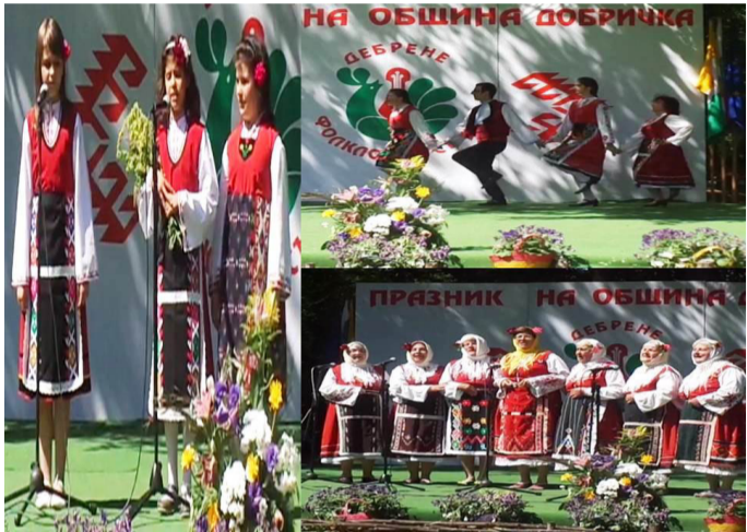
Самодейците от Дуранкулак

На Енъовден самодейците при НЧ „Дружба 1898“ с. Дуранкулак взеха участие в празника на община Добрич в 49-тото издание на фолклорния събор „Песни и танци от слънчева Добруджа“ в с. Дебрене. Самодейците от Групата за народни песни, Детската група за народни песни и Танцов клуб „Кибела“ показаха своите умения като певци и танцьори, за което получиха грамоти и парична награда. Най-развълнувани бяха нашите малки