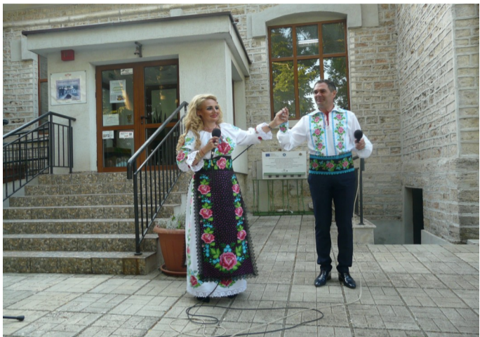
Гостите от Румъния

На 8 август в Зеления образователен център се състоя ден на румънската култура в Шабла.