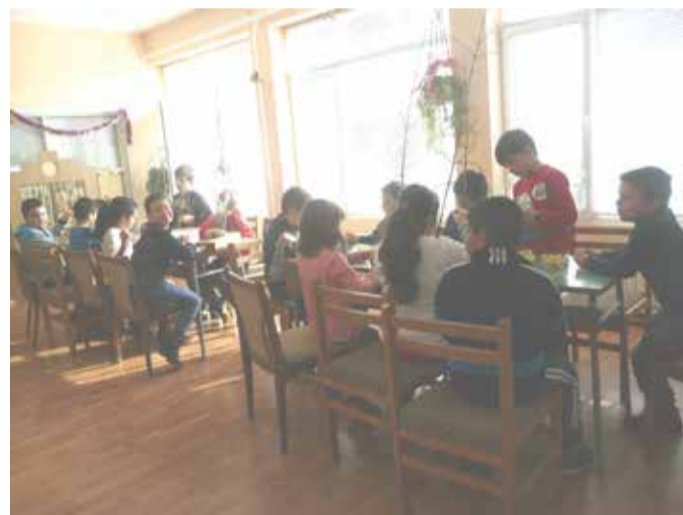
Учениците от клуб „Мозайка“ при ОДК-Шабла подготвят своите автентични сурвакници