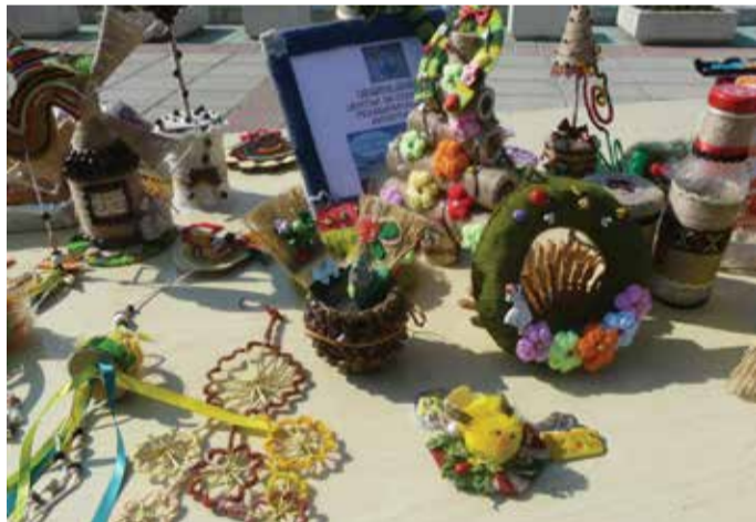
Експонати на потребителите от Центъра за социална реабилитация и интеграция