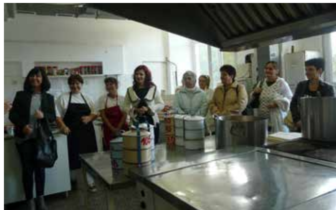
В кухненското помещение на ДСП-Шабла

В последния работен ден на миналата седмица, служители от Домашен социален патронаж (ДСП) - Провадия посетиха идентичното социално заведение в град Шабла.