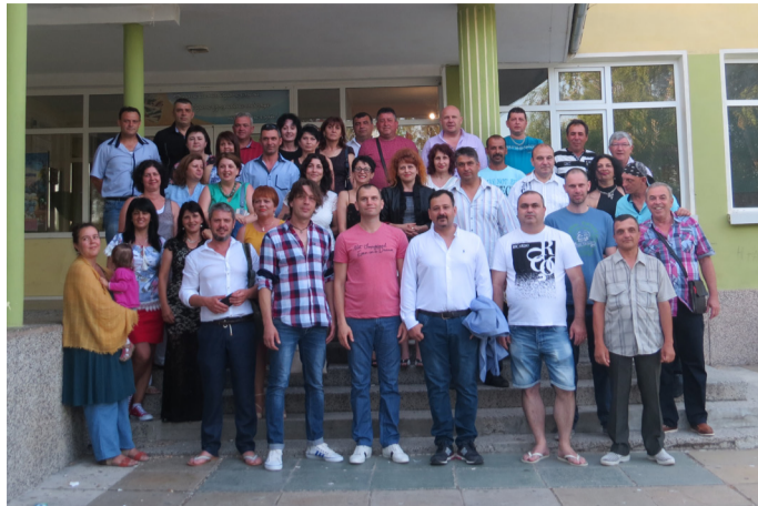
Момичетата и момчетата от набор 1974 година