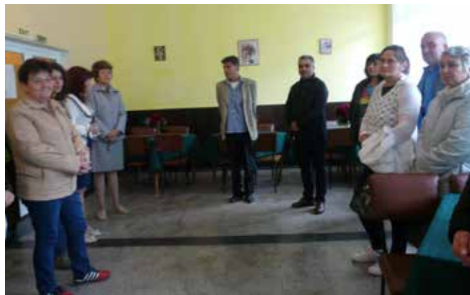
Официалното посрещане на гостите от Провадия