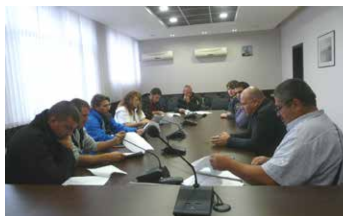
Членовете на доброволното формирование

Новата структура, която ще действа на територията на Общината се създава с цел предотвратяване или овла-