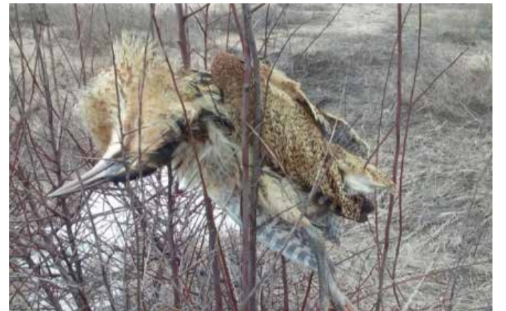
Убитият воден бик

Само за една седмица две червеногуши гъски и голям воден бик станаха жертви на незаконен лов в района на Ша- бленско езеро, алармират от Българското дружество за за- щита на птиците. Червеногуша- та гъска е световно застрашен вид. Днес в света са оцелели не повече от 50 000 червеногуши гъски. Езерата Шабла и Дуран- кулак са едни от най-предпо- читаните места за зимуване на този вид гъски. Големият воден бик е включен в Червената кни- га на България. Числеността му през размножителния период е не повече от 100 до 150 птици.