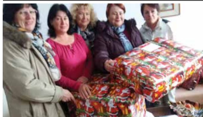
Членовете на Общинската организация на БСП -Шабла поздравиха с предстоящите празници децата и колектива на детска градина „Дора Габбе“ гр.Шабла и им поднесе подаръци.