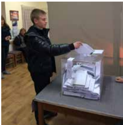
Най-младият гласоподавател в Общината