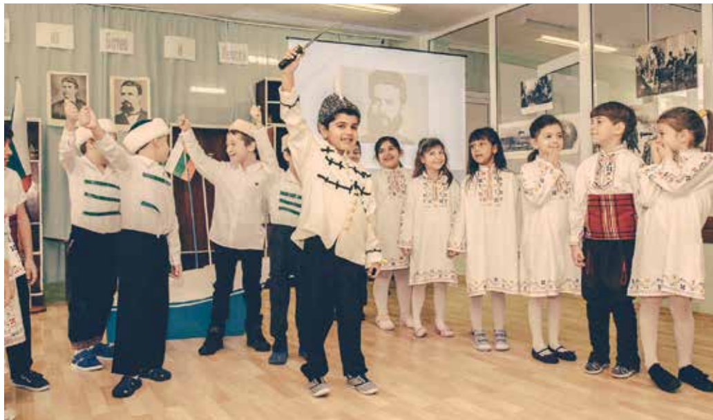
Ботев и неговите четници

Гостите на поетично-театралния спектакъл станаха свидетели на изключително емоционално поднесена въз-