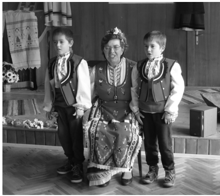
Приемствеността между поколенията в Дуранкулак е жива – баба и внучета пеят народна песен