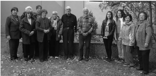
Малки и големи пред туята, засадена в чест на празника.