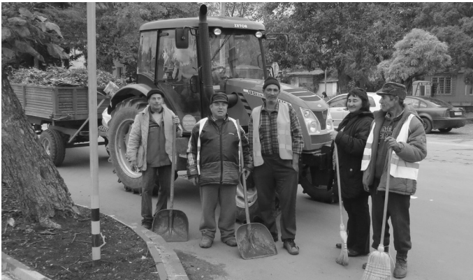
Работниците от Временната заетост хвърлят много труд, за да бъде Шабла чиста от падналите по улиците листа.