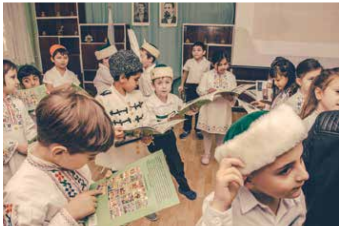
Новата книга – нов приятел

становка на паметни събития – разпитът на заловения Васил Левски, везането на изправения лъв и надписа „Свобода или смърт“ върху въстаническото знаме от Райна Княгиня и стъпването на четниците на Ботев на българска земя. С неочаквано сериозния си подход, с разбирането си за важността на претворяваните събития и със своите артистизъм и емоционалност децата докоснаха сърцата на зрителите и извикаха сълзи в очите им, а пламенното изпълнение на малкия Боримечка и усмихна мнозина. Подходя-