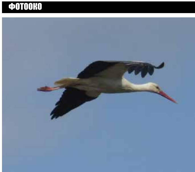
Пролетта дойде и в нашата община. Щъркелите вече са тук.