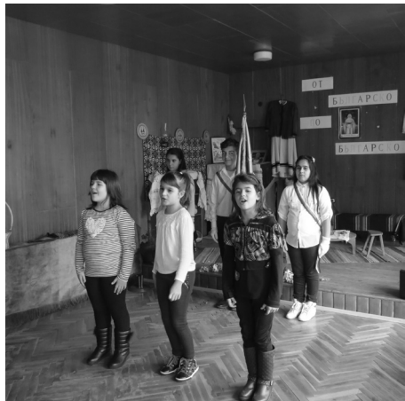
Песен пред знамето на училището

След това започна празничната програма, която не можеше да не направи впечатление на аудиторията със своето богатство и многообразие. Всички ученици от школото – от най-малките до осмоласници-