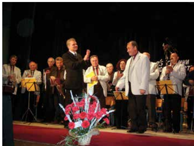
Архивна снимка от концерта по случай 25-та годишнина от създаването на духовия оркестър в Шабла