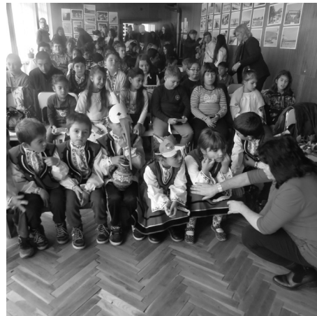
Последни инструкции към първолаците

те дадоха своя дан с рецитиране на стихотворения и народни мъдрости, пеене на песни, игра на народни танци. Децата проявиха завиден артистизъм при представянето на сценки по народни приказки. Особено запазени и усърдни, разбира се бяха първолаците.