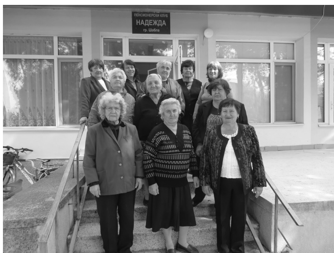
Част от пенсионерите от клуб „Надежда“

Празникът започна с поздравителен адрес от Общински