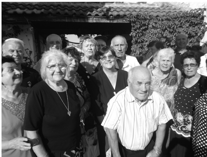
...и на наша почва

Бих казала, че се докоснахме до райски кътчета от природата на България. Останаха ни трайни спомени от това, което видяхме. За разлика от друг път, през месец септември отпразну-