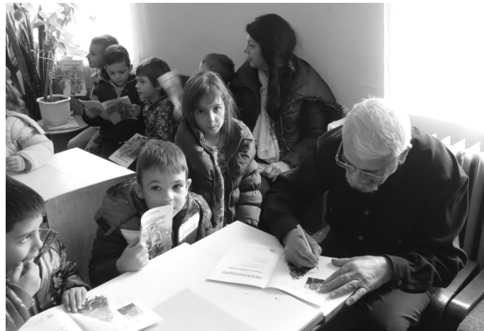
Писателят дава автографи на своите книги.