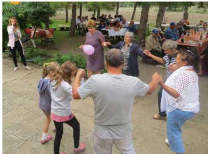
Пролез се весели