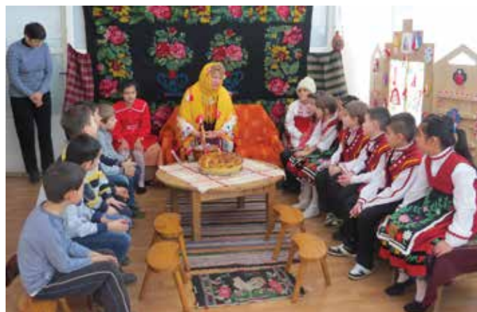
Децата със затаян дъх слушат Баба Марта. След миг те ще получат от нея любимите си червено-бели украшения.

диционното българско хоро, големи. на което се хванаха малки и