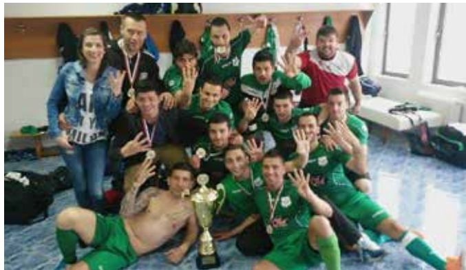
Четири пръста, които показват футболистите на Гранд Про секунди след спечеления финал, символизират четирите поредни държавни титли

попадне директно в групите на Шампионската лига по футзал. За да разбере колко престижно е това класиране на отбора на Багера, ще ви информираме,