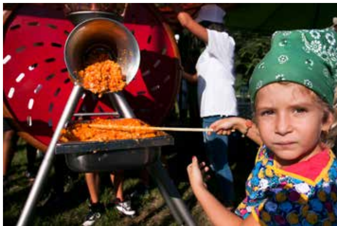
Най-малката помагачка за УТИницата