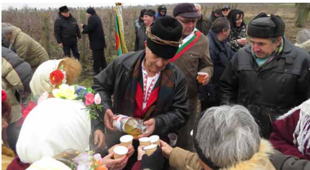
На лозята новият „цар“ черпи хората със своето вино