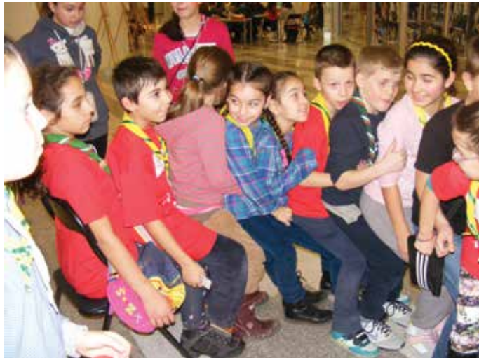
Шабленските скаути се веселят във Варна

На 22 февруари бе честван световният ден на скаутското движение. Това е рождената дата на неговия основател – сър Бейдън Паул от Англия.