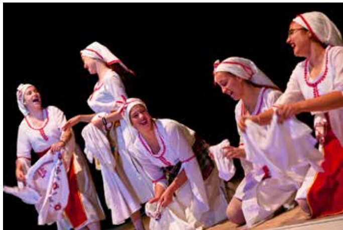
Групата на „кляукарките“ свързва отделните фрагменти на спектакъла чрез коментарите си