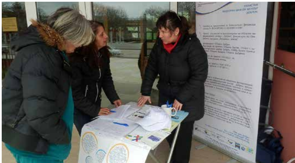
Откритата приемна на входа на сградата на Общината

Инициативата ще продължи във всички общини от Областта, като ОИЦ-Добрич ще проведе изнесени приемни, както и информационни срещи с ученици, пенсионери, трудоустроени, спортни клубове, рибарски групи и др., където