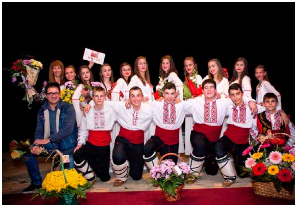
Колективът, който стои зад представлението