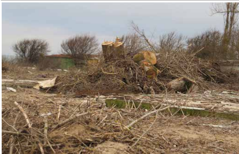
Така изглежда днес цялата територия на къмпинг „Добруджа“. Държавно ловно стопанство – Балчик, стопанисващо обекта, е превърнало терена в сечище. Тук след три месеца би трябвало да стартира туристическият сезон.

На 23 февруари 2015 година се навършват 15 години от смъртта на