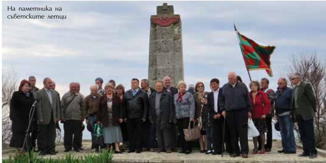
На паметника на съветските летци