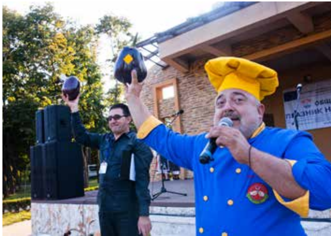
Нека публиката избере победителя