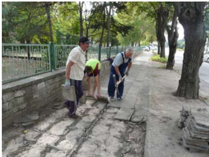
И покрай училището работата е в ход.

За да стане по-красив и благоустроен нашият град, в момента в центъра му се работи по три различни проекта – проект „Център за обществена подкрепа и превенция на риска в община Шабла (реновира се старата поликлиника), проект „Тротоари по ул. „Равно поле“ и ул. „Нефтяник“ гр. Шабла, общ. Шабла, обл. Добрич“ по Публична инвестиционна програма „Растеж и устойчиво развитие на регионите“, както и подмяната на тротоарните плочки по ул. „Добруджа“ (откъм входа на СОУ „Асен Златаров“, извършвана по ОП „Подкрепа за заетост“ и подпомогната със средства от общинския бюджет.