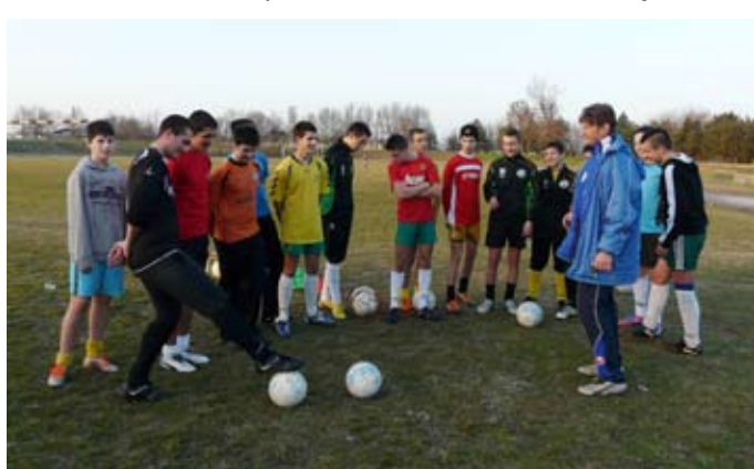
Отлично настроение цари сред юношите на първата тренировка за полусезона.