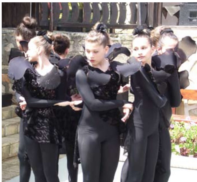
„Танцът на черната роза“ в изпълнение на самодейци от Генерал Тошево, съпътстващ конкурсната програма