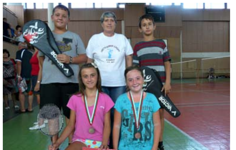
На Националния турнир по бадминтон „Шабла 2014“