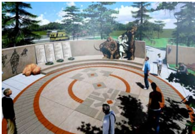
Проект № 1