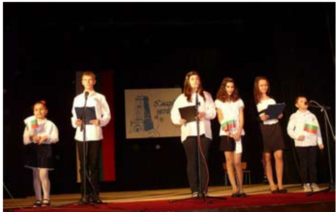
„Българийо, бъди благословена....“