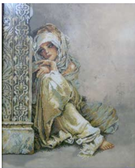
„Арабско момиче II“, автор Нина Петрова.