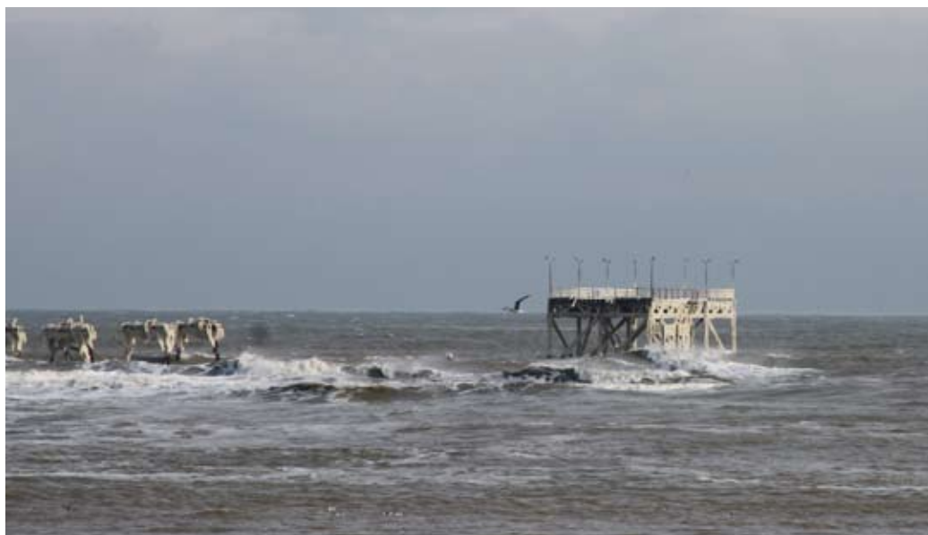
Така изглеждат остатъците от старата естакада сега.