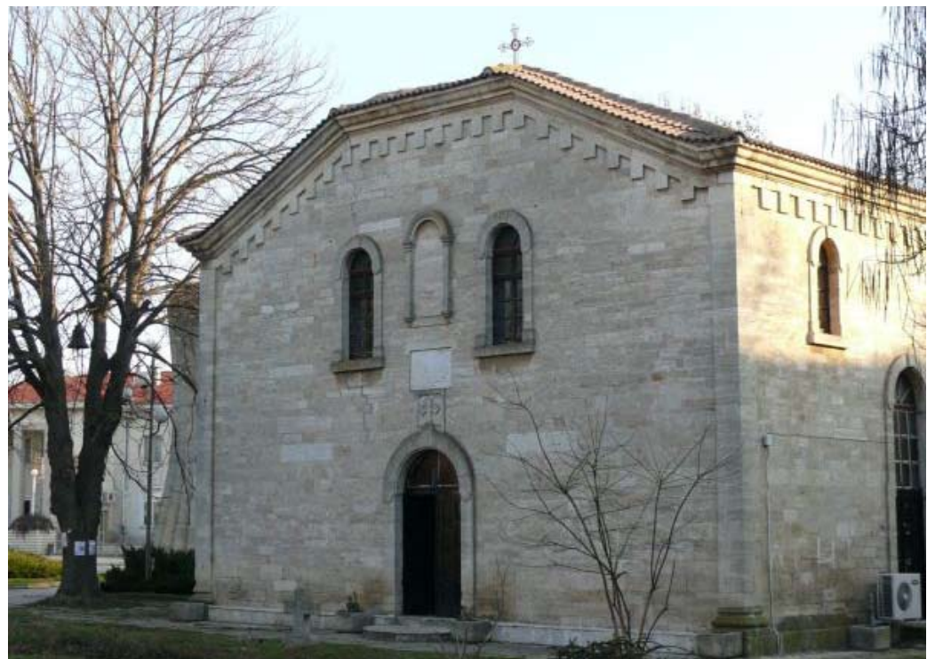
Храм „Св. свѣщмѣх Харалампій“ в Шабла

Свети вмчк. Харалампий е живял през II век. Той бил епископ на гр. Магнезия в Мала Азия. През целия си живот проповядвал Христовата вяра, но император Септимий Север започнал страшно гонение над християните. Тази съдба сполетяла и Свети Харалампий. Той бил на повече от 100 години, когато го заловили и принуждавали доброволно да се отрече от Христос. Естествено той категорично отказал. И как да постъпи по друг начин, когато през целия си живот разпространява Божие слово.