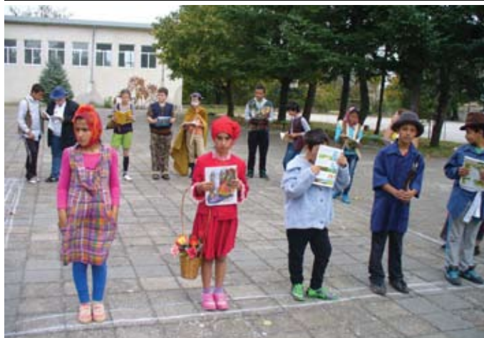
В рамките на инициативата "Чети с мен" на Президента на Р България Росен Плевнелиев на 16 октомври възпитаниците на ОУ "Св. Кл. Охридски" с. Дуранкулак направиха книга, от чиито "Живи страници" излизаха герои от любими детски произведения.