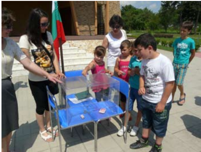
С удоволствие, децата пускаха в урната своите левчета.