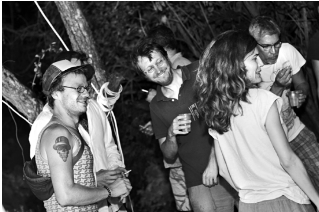
Танцуващото парти е в разгара си

„Точно така, произведение беше самото мазе. Нарекдохме го Белият куб – като изчистена идея за неутралното изложбено пространство. Известно време, 2 или 3 години няха идеи какво да правя с него. После мой приятел ме запита: ама... наистина ли няма да го използваш?... И така тръгнахме – с привидно наивистичната, уж детинска форму-