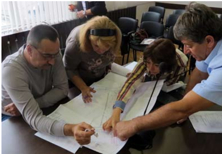
Работен момент от заседанието

Решението на съветниците ще даде основания за предприемане на последващи действия, свързани с изграждането на брегоукрепващо съоръжение от две буни, позиционирани навътре в морето. Напомняме, че брегоукрепването пред къмпинг „Добруджа“ започна още през 2001 година и беше изпълнено частично. В началото на 2013-та година община Шабла възложи изготвянето на работен проект за следващ етап от укреп-