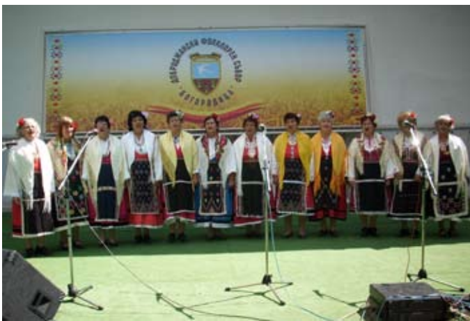
„Кария“ президивка бурни овации в Генерал Тошево.