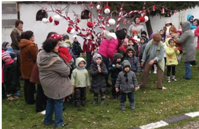
Всички заедно окичиха дървото-мартеница

В брой 7 на в. „Изгрев“ от 24 февруари 2014 година бе публикувана статия „Работилница на баба Марта“, с автор Йордан Енев. В нея пишеше за децата от ЦДГ „Дора Габел“ - IV група, „Шарено петле“, с музикален ръководител Росица Монева. Те гостуваха на клуба на учителя „Будител“, преобразен с много вкус в експозиция на народни носии и етнографски предмети.