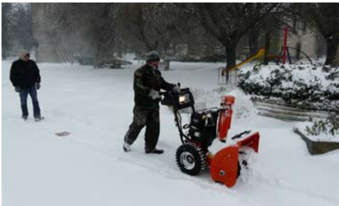
Почистване на площада след снега, миналата седмица

Дирекция „Пресцентър и връзки с обществеността“ на МВР съобщи, че временно е преустановено преминаването през граничните пунктове Кардам и Дуранкулак.