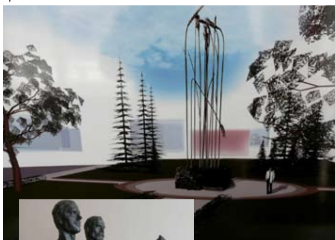
Проект № 2