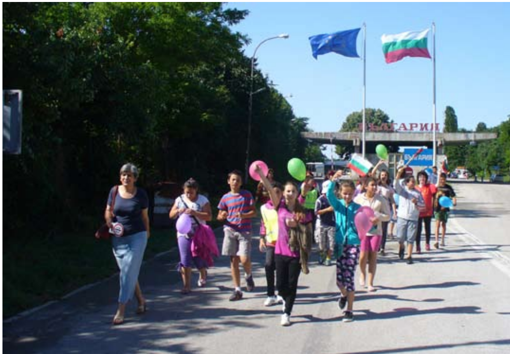
Шареният гайдар поведе шарените деца от ОУ „Св. Климент Охридски към добри дела.

Бел. ред. Желаете да се включат в начинанието на „Интерхелп“, „Шарен гайдар“ могат да получат повече информация на интернет адрес www.pied-piper.challenge.de .