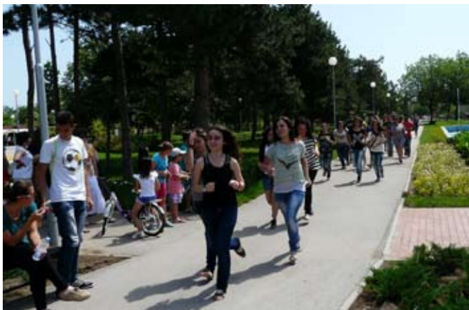
Чрез спорт, към благотворителност.

За положения труд в спортните изяви, които проведоха в парка, децата бяха възнаградени от своите родители със скромни парични суми. Тези средства, подрастващите дариха на нуждаещите се деца от