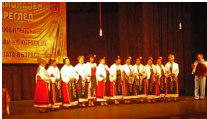
Фолклорната група при НЧ „Зора 1942“, Вакулино се изяви и на Националния преглед на любителските състави на хората от третата възраст, провел се наскоро в Балчик.