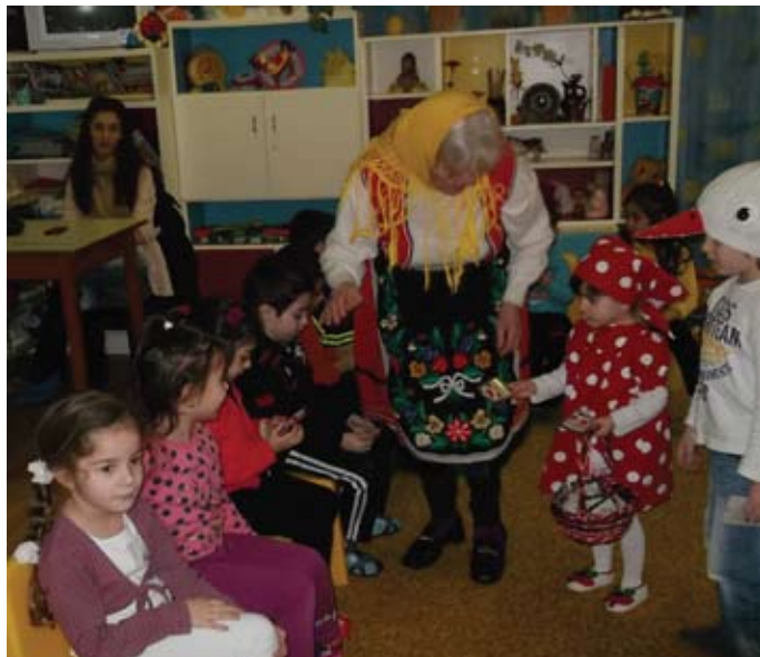
Баба Марта заедно с помощницата си раздаде мартеници на децата

Този празник е едно много вълнуващо преживяване за тях. Атмосферата на красивия пролетен празник се