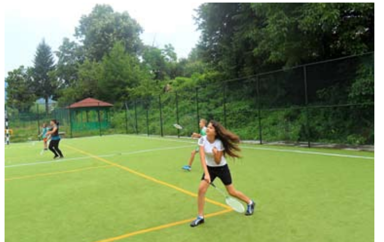
Тренировъчният лагер в Троян