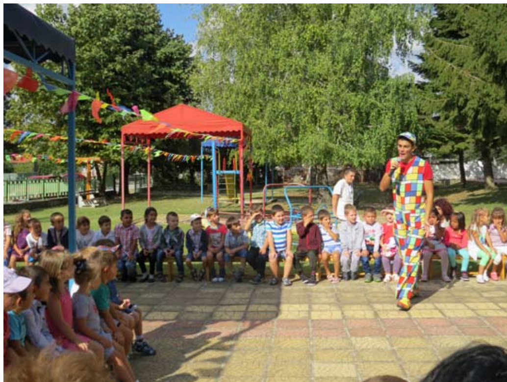
Ето как посрещнаха първия учебен ден децата от ЦДГ „Дора Габе“.

Къща в центъра на гр. Шабла – 120 кв. км, на ул. „Искър“ № 26, ремонтирана с PVC-дограма, санирана, 4 спални, кухня, баня с тоалетна, с две мазета и гараж за две коли, двор 1200 кв. км., лозе, овошци дървета, или продавам. Телефон за контакти: 0885/11-70-51