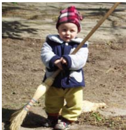
„Да изчистим България за един ден!“