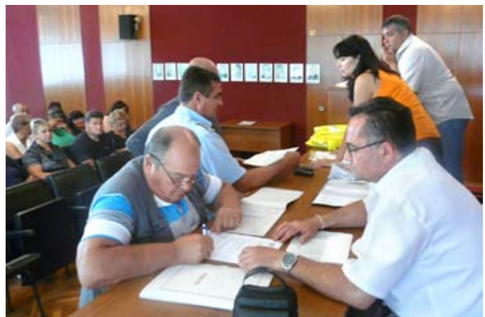
Връчването на договорите на новоназначените сътрудници по НП „Сигурност“