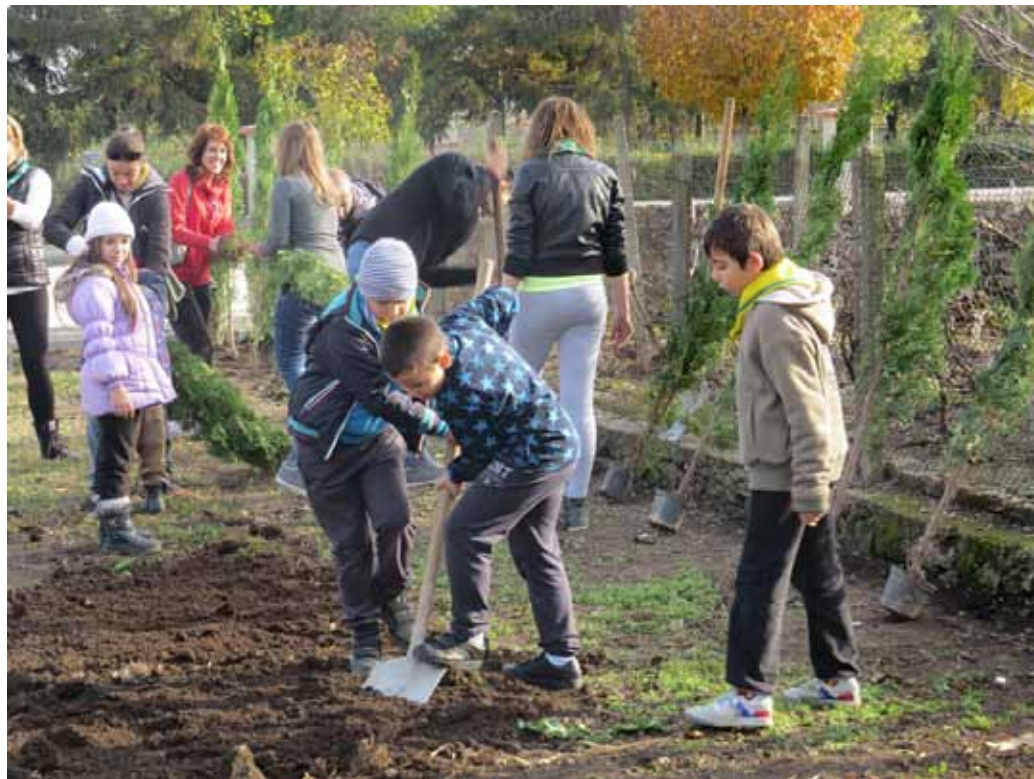
Скаутски клуб „Ястребите“ Шабла дава своя принос в озеленяването на центъра на града.