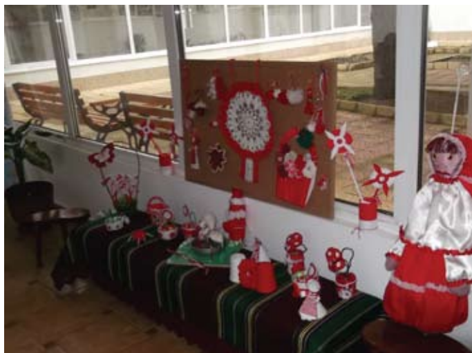
Празничен кът в детската градина

Благодарим ви, колеги за гостоприемството. С тези занимания, вие ни накарахте да