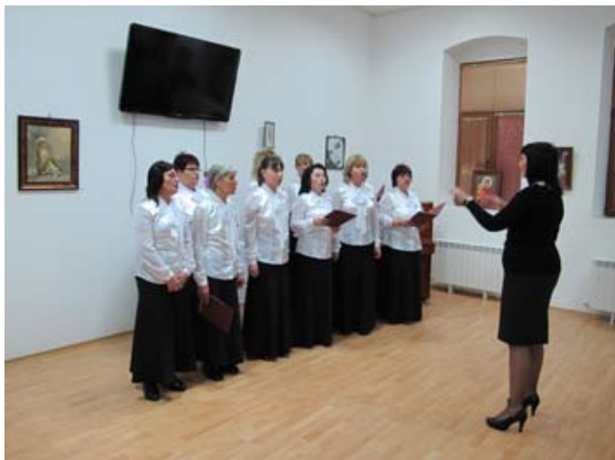
Градският хор поздравява гостите на експозицията с народни песни, любими на всеки българин.