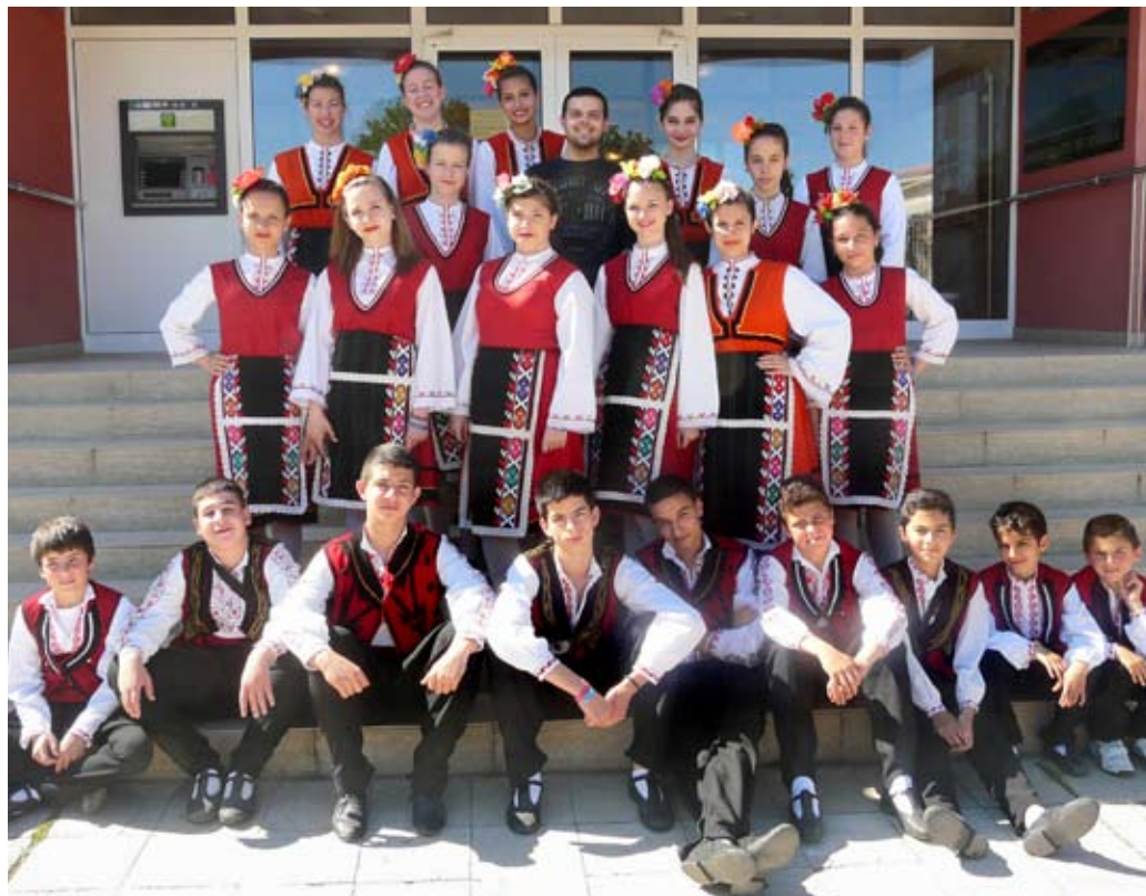
Младите танцьори от „Бърборино“