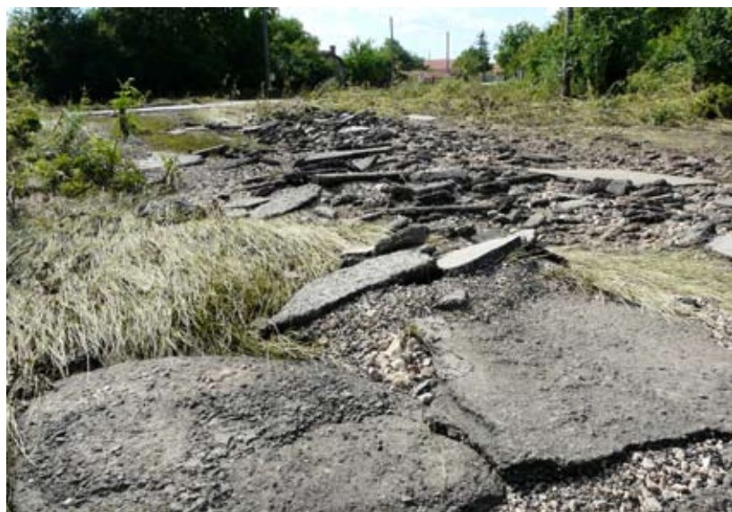
Така изглеждат днес улиците на село Черноморци след потоп. На мястото на водните потоци сега има реки от асфалт.

От 10.05.2014 г. в СОУ „Асен Златаров“, гр. Шабла стартира проект „Изграждане на безжични комуникации с мултифункционално предназначение“ по Оперативна програма за развитие на сектор „Рибарство“ на Р България, финансирана от Европейския фонд. Одобрената стойност на проекта е 33 128 лв. а срокът за изпълнение му 10 месеца. Проектът ще обогати МТБ на СОУ със следното съдържание на ДМА: