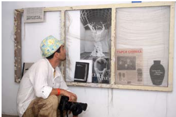
Този път изложбената зала предложи на посетителите си една нестандартна библиотека

Десислава Донева