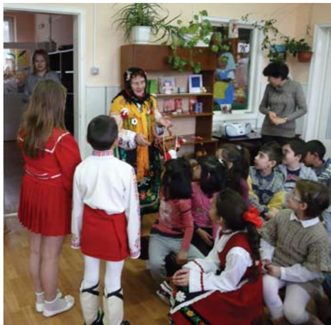
Посрещане на скъпата гостенка в ОДК

По стар обичай, децата посрещнаха Баба Марта с питка и мед, за да е сладка и добричка, да дарява здраве и късмет. Песните, стихчетата и танците на първокласниците поддържаха веселото настроение. Първолаците зарадваха не само Баба Марта, но и своите родители, учителите и гостите си. Очарована и много доволна от изпълненията на малчуганите, Баба Марта заки-