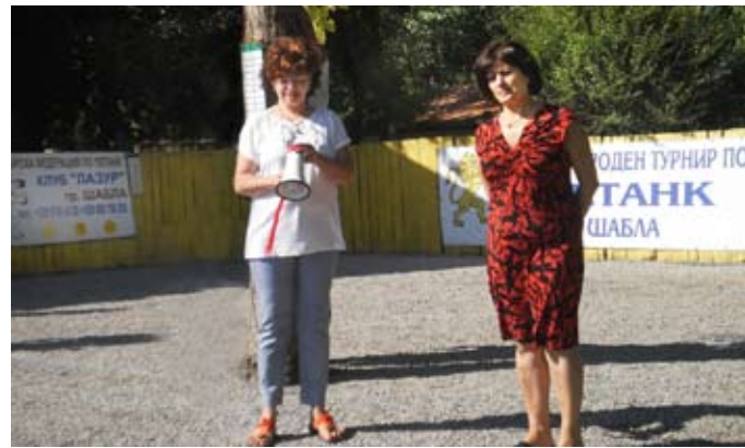
Откриването на турнира

Доскоро малко известният спорт, чиято родина е Франция и който продължава да набира все повече и повече привърженици и желаещи да го практикуват навсякъде по света, намира прием в нашата община през недалечната 2001 година. Самият международен турнир има богата история и много приятели, натрупани през годините на провеждането му – традиционно в навечерието на Джулая, в самото начало на активния летен сезон. За тазгодишното, празнично издание на най-северното ни Черноморие пристигнаха клубове от Унгария, Австрия, Словакия, Англия, Франция, Италия и българските градове София, Пловдив, Севлиево, Белене и Козлодуй. Те се взеха участие в надпреварата по покана на домакините от Спортен клуб по петанк „Лазур“, които за пореден път създадоха най-добри-