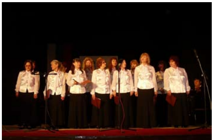
Дамският камерен хор спечели много овации за изпълнението на химна на Шабла