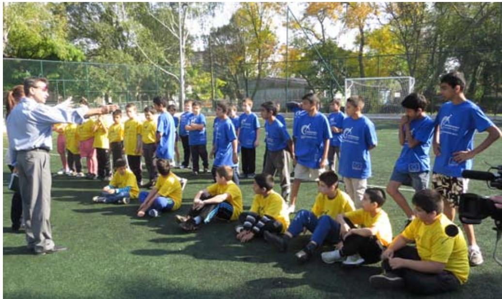
Кратък инструктаж преди мача

листите от втори „б“ клас, изненадващо или не, надделяха над бабковците си от трети клас с резултат 4:3, като проявиха мъжество, неприщящо за възрастта