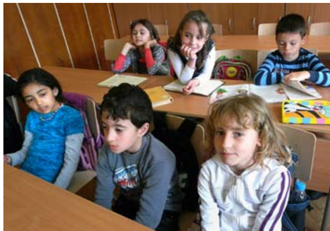
Третокласниците от СОУ „Асен Златаров“ са си останали в България...

От тях само 10% посещават български неделни училища