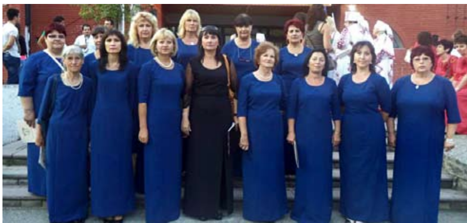
Хорът в Македония

тим свои записи. Задължително условие беше да се подготвят изпълнения върху обработки на църковна и фолклорна музика. Минахме успешно тази първа