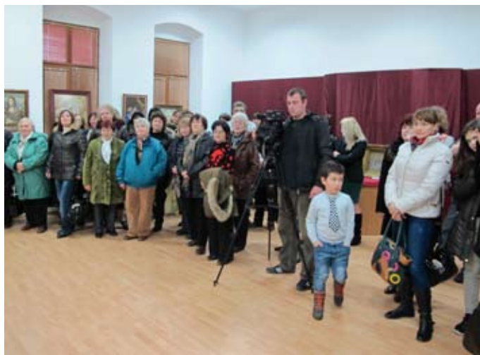
Изложбата предизвика голям интерес у шабленци.

Благодарим на всички за участието и в знак на нашето възхищение им връчваме Сертификат за участие в изложба в ЗОЦ. Инициативата – да направим изложба на гоблени, ще продължи да се развива. Нашето намерение е да обявяваме и други теми според различни поводи и празници, така че да можем да видим и да се насладим на колкото се може повече творения. Надявам се, че ще подкрепите тази