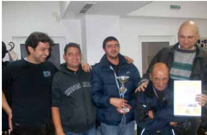
Щастливите победители от СКШ „Хармония“, Шабла