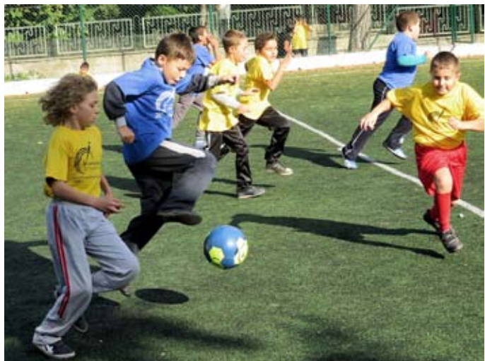
Напрегнат момент от първата среща