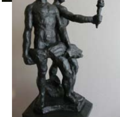
Проект № 3