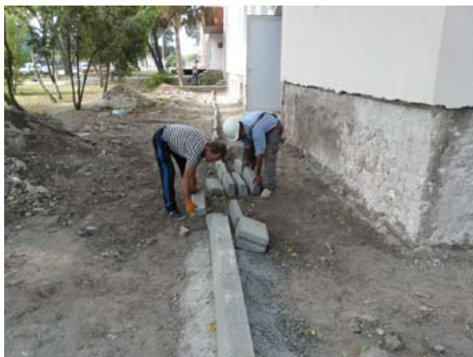
Сградата на старата поликлиника вече е ремонтирана, в момента се полага настилка около нея.