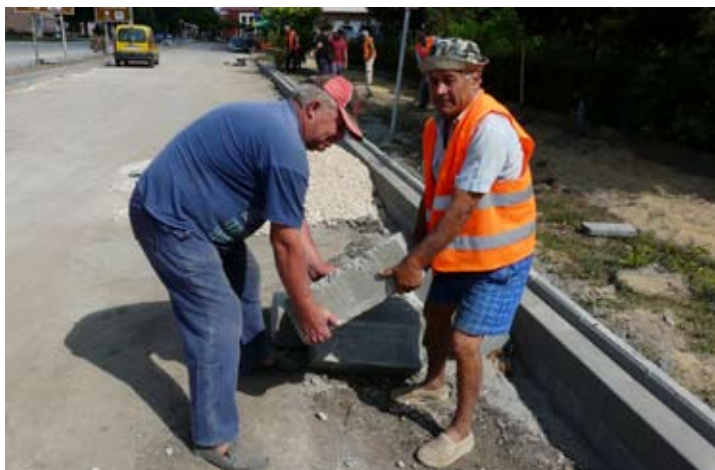
Полагат се основите на тротоарите по „Равно поле“.

На въпросите на наши читатели защо се премахват дърветата по ул. „Равно поле“, отговаряме – кореновата им система беше повдигнала и разместила старите плочки, и полагането на новата тротоарна настилка също би било невъзможно. В бюджета на Общината за 2015 година ще се предвидят средства за закупуване и засаждане на нови дръвчета, с вертикална коренова система, които няма да увредят новите тротоари.