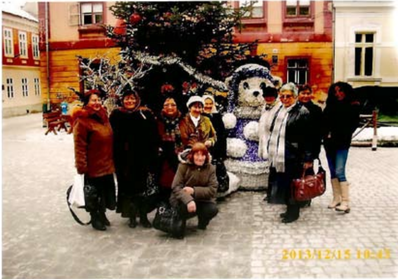
Делегацията посетила Брашов

сална църква, посетихме и село Бран, където видяхме замъка на митичния граф Дракула.