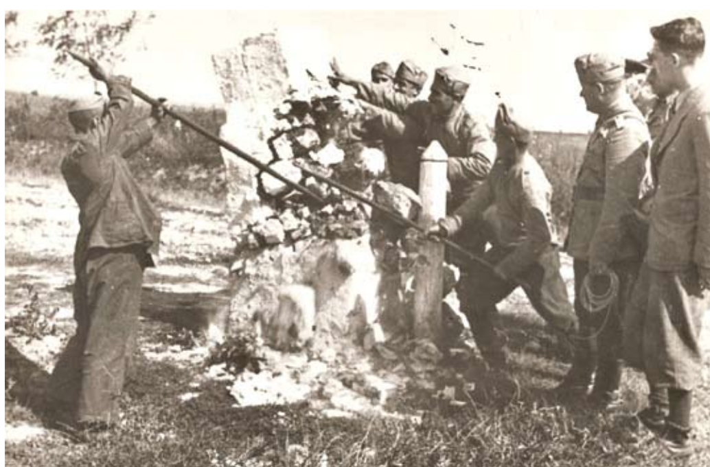
Български войници събират гранична пирамида на българо-румънската граница през септември 1940 година

На 11 септември 2014 г. в пенсионерски клуб „Надежда“ бе организирано тържество по случай седемдесет и четвъртата годишнина от присъединяването на южна Добруджа към България.