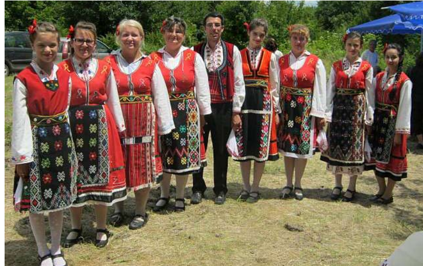
Фолклорна група „Кибела“

жер и съседните села. Форумът е носител на добруджанските култура и бит, на народните традиции и българската духов-