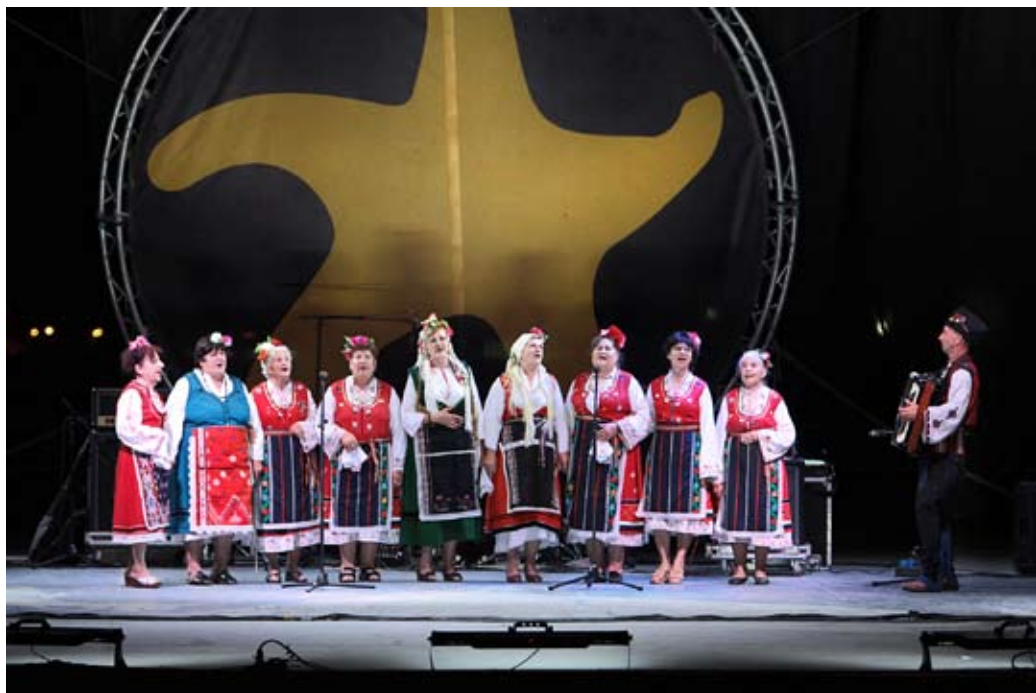
Съставите представиха българското фолклорно богатство върху платформа в морето. На снимката – групата от Крапец вечерта на 10 август.