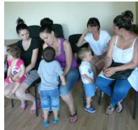
Родителите, разтревожени за съдбата на детското заведение

След направени предписания от Регионалната здравна инспекция – гр. Добрич, със Заповед на Директора й, считано от 25 февруари 2014 година бе спряно функционирането на филиала на ЦДГ „Дора Габе“ в с. Крапец. Ще бъде така, до отстраняване на проблемите и приведането на сградата във вид, отговарящ на здравно-хигиенните норми за детско учебно заведение. Съобразно направените експертизи и оценки, предвидените