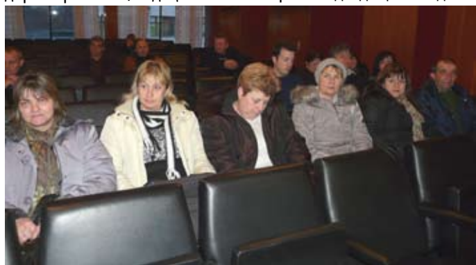
Част от аудиторията в залата.