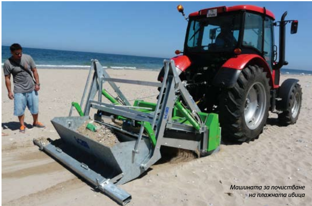
Машината за почистване на плажната ивица