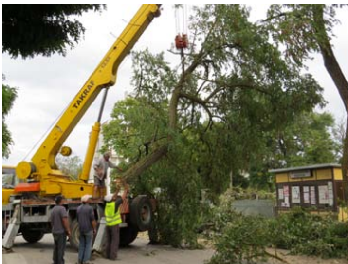
Премахването на пречещите дървета от БКСТРО със съдействието на Енерго Про.