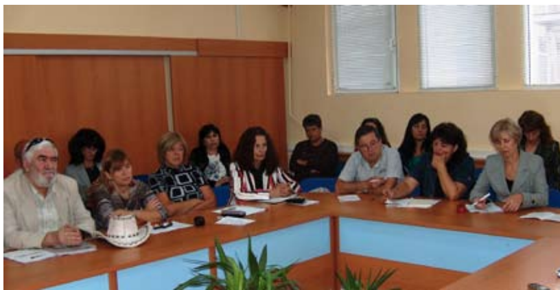
Участниците в работната среща

старта на съвета, който ще бъде гъвкава и отворена структура, и изрази желание, той да се изпълни със съдържание и конструктивни дискусии по актуални въпроси в интерес на жителите на цялата област. Доказателство за това намерение е темата на следващото заседание - "Водата на област Добрич". Община Шабла ще участва в новоучредения обществен съвет заедно с други