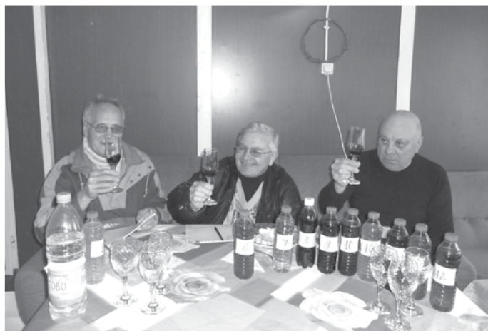
Сомелиерите от село Тюленово

Молитва за благословение и берекет бе отслужена от