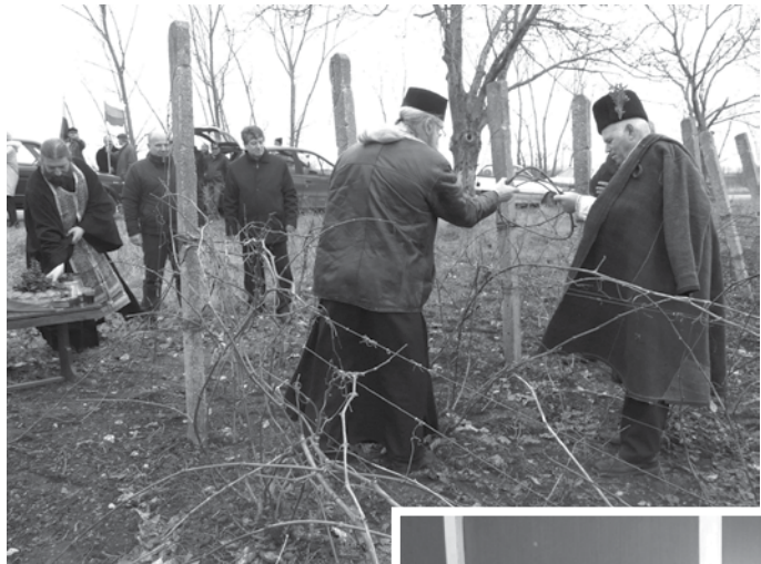
„Царят на лозето“

ето-общинска администрация-Шабла и Съюзът на офицерите и сержантите от запаса и резерва, вярващи в истинността на думите, че правенето на добро вино е умение, а правенето на прекрасно вино е изкуство, бяха осигурили за присъстващите руйно червено вино, което да стопли душите и внесе празнично настроение.