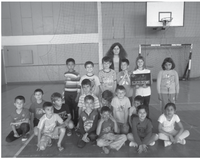
Участниците в проекта, който спортен клуб „Кария“ реализира миналата година по същата програма.

ответно на баскетбола в размер на 4700 лева и на шахмата - 3000 лева.