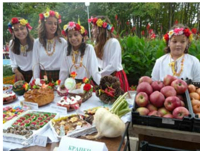
И „Сладураните“ от Крапец допринесоха за доброто настроение на Празника на плодородието