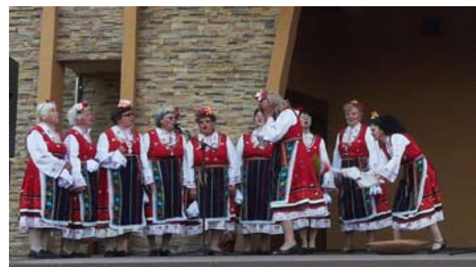
Група „Фолклорика“ от село Крапец