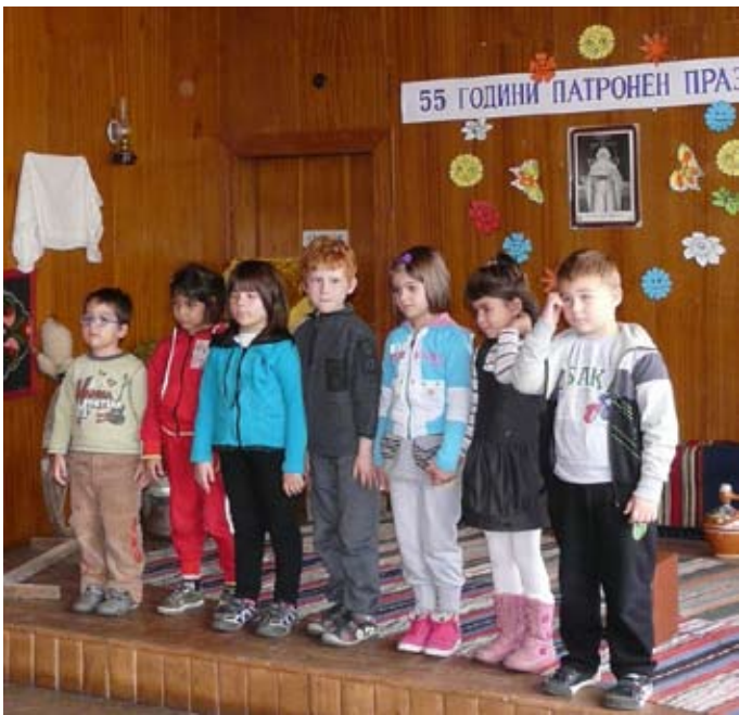
Поздрав от бъдещите първокласници

Клед това думата има имаха участниците в богатата литературно-музикална програма. С помощта на своите учители те се бяха погрижили празникът им да е неповторим. На сцената се редуваха рецитатори, певци, оживяваха герои от приказки. Беше споменато, че тази традиция води началото си от 1941 година, когато за пръв път в училището е направена драматична