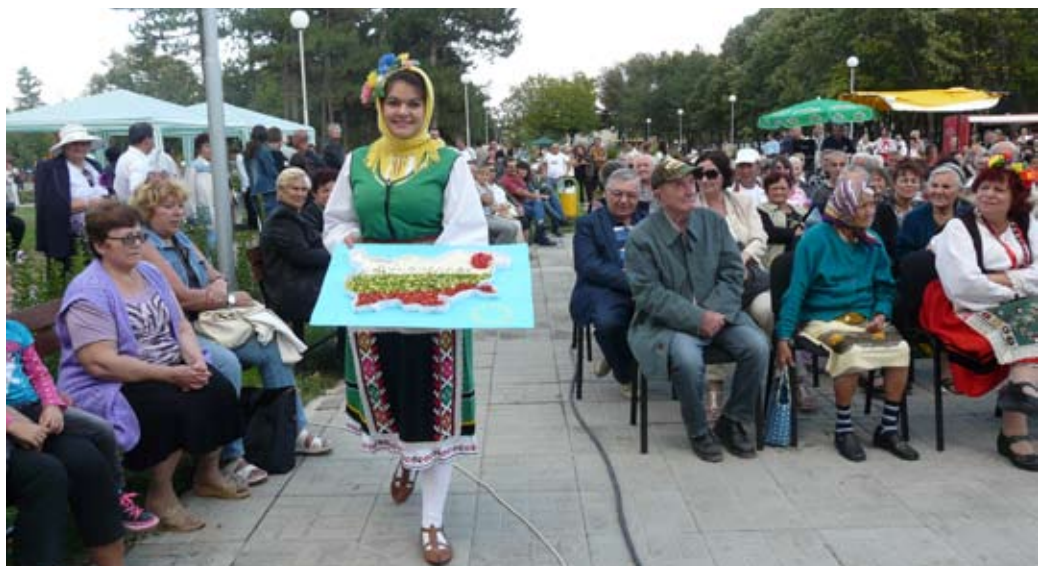
Лицето на танцов състав „Българка“ дефилира с наградения експонат на село Дуранкулак