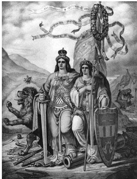
„Съединена България“ - Николай Павлович

към Съединението министър-председател Петко Каравелов. Министър-председателят, изо-