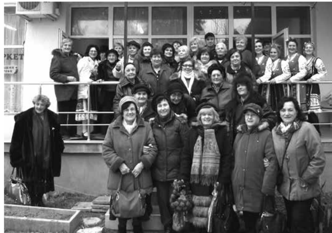
Самодейци от Крапец и Балчик празнуваха заедно