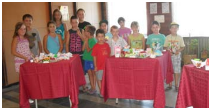
Участниците в „Лятната читалня”

От началото на месец юли до 22 август 2013 година, детският отдел на читалищната библиотека, отвори врати по един по-нестандартен начин. За своите малки читатели бяха организирани занимания и игри по интереси, в т.н. „Лятна читалня”.