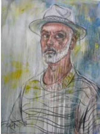
„Автопортрет като плерист“, автор Кирил Батембергски

Участвал в осмото издание на „Арт пътеки“, 2013