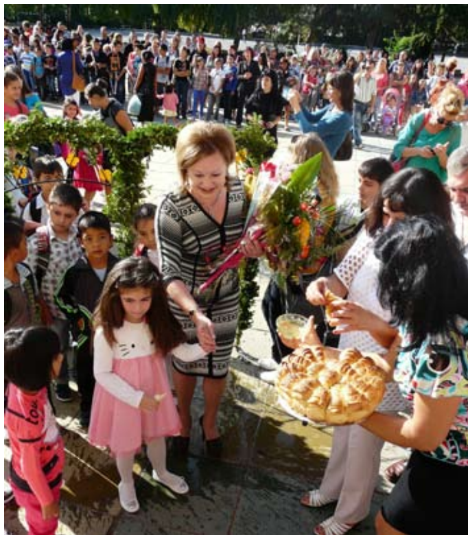
Първокласниците с трепет прекрачиха прага на СОУ „Асен Златаров“

„Тези красиви растения години наред присъстват в празничната украса, а вложената символика е - както те се обръщат към слънцето, така и