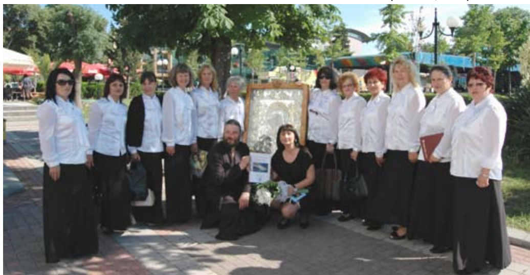
Дамският камерен хор при храм „Св. свщмчк Харалампий“ с иконата „Света Богородица-Достойно ест“