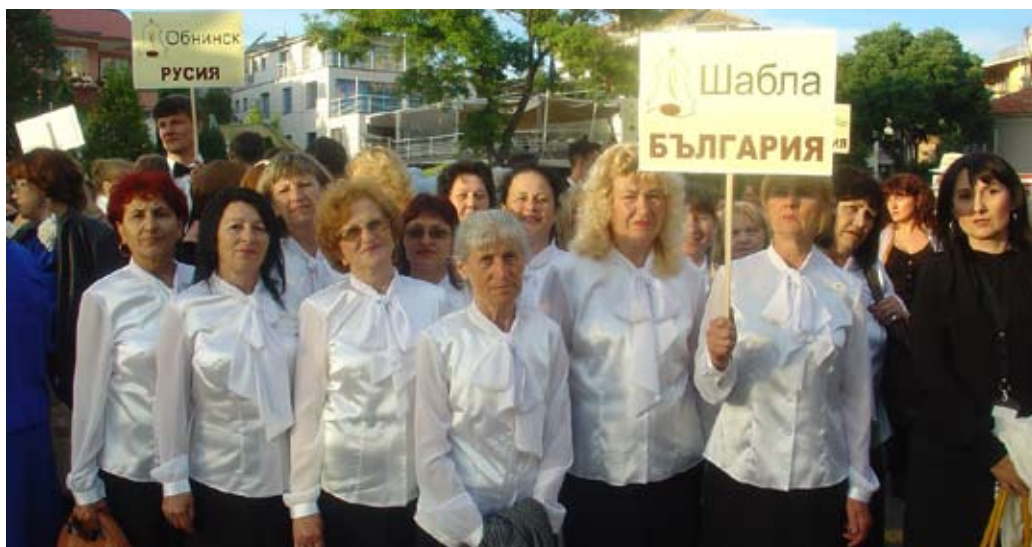
Делегацията от Шабла по време на литийното шествие, при посрещането на чудотворната икона на Света Богородица „Достойно ест“

„Фестивалът няма конкурсен характер, а е един празник на духовността, чрез църковната песен. Трудната част е селекцията за участие. Изпращат се нотните партитури, видео с изпълнение на хора и биография на състава и диригента, а още по-отговорно и трудно е, да защитиш високото ниво на фестивала с участието си. В деня на пристигането ни, 7 юни-петък от 11.00 часа имаше среща на диригентите със селекционната комисия и организаторите. Всеки от нас трябваше да представи пред колегите си своя състав, кратка негова история