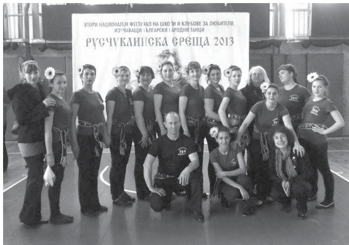
Танцов клуб „Кибела” село Дуранкулак