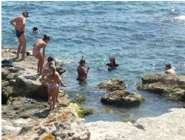
Скалистите брегове на нашия край са любимо място за много туристи

Шабла, като община с традиции в този бранш разполага с над 100 средства за подслон и настаняване. От началото на 2013 година до края на месец август общината са посетили 3416 български и 728 чуждестранни граждани, при което са реализирани 19725 нощувки.