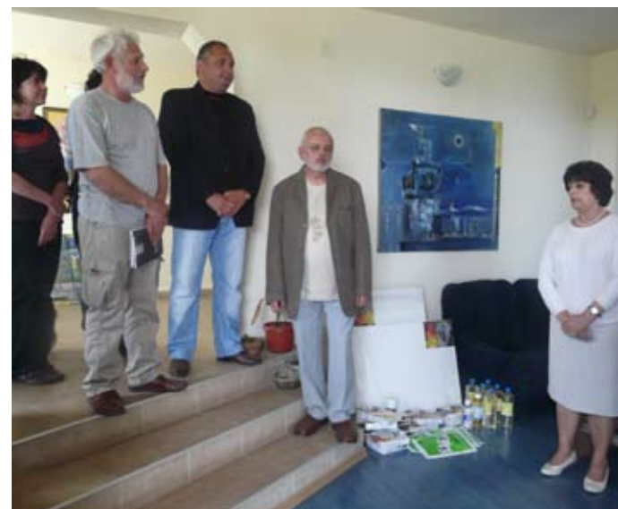
Откриването на пленера

На 14 май, във вила „Артеа“ село Крапец бе открит VIII-ят национален пленер по живопис „Арт пътеки, Шабла 2013“.