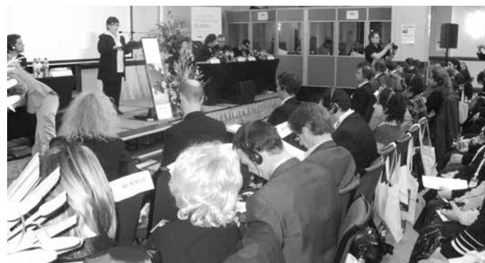
Представянето на България, на форума