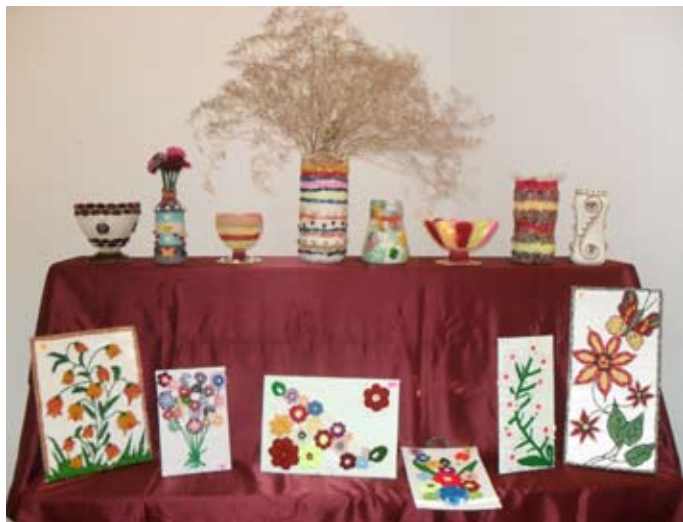
Част от експонатите на изложбата