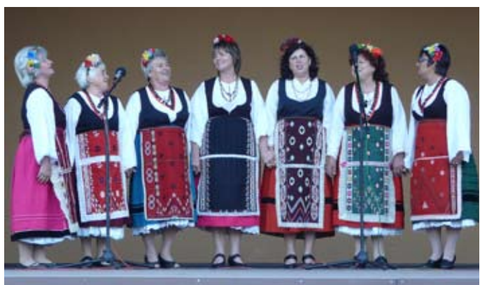
ФГ „Росна китка“ село Горун