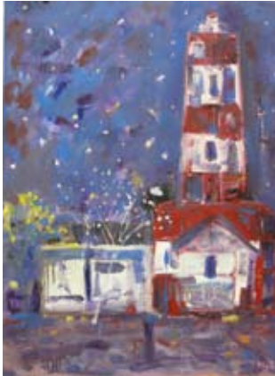
„Нощен фар“, автор Лили Сотирова

През 2010 година, Лили Сотирова представя първата си самостоятелна изложба «Образи и усещания» в зала София на Столичната библиотека, където отправя заявка за сериозно и зряло творчество. Уникалното в експозицията е съчетанието на слово и рисуване, които изразяват усещанията и чувствителността на един млад човек