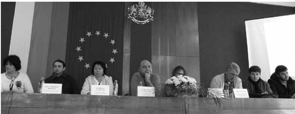
Представителите на институциите участвали в работната среща

Държавно ловно стопанство-гр. Балчик, Регионална инспекция по околната среда и водите - гр.Варна, Фондация „Льо балкан“, СНЦ „Зелени балкани“, БДЗП, Българска фондация „Биоразнообразие“, Клъстер екотуризъм, Фондация