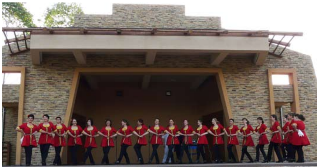
Танцов клуб „Жива вода“