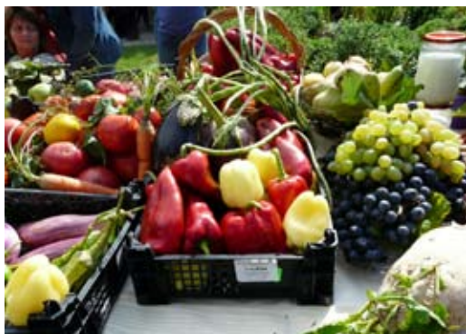
Щандът на село Горун