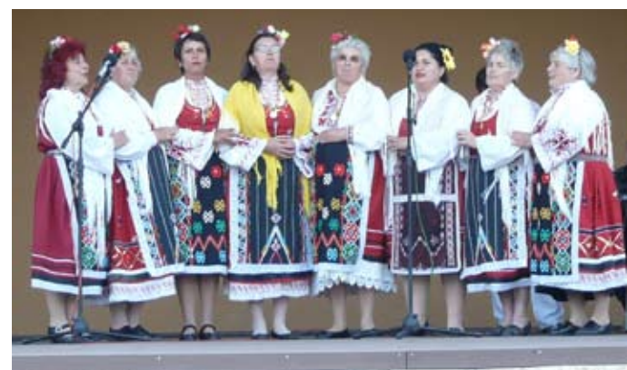
Фолклорна група от село Дуранкулак