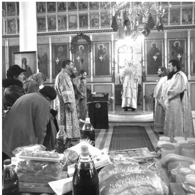
Празничната служба в храма

бий, в шабленския храм, носещ името на светеца, викариен епископ Йоан извърши света