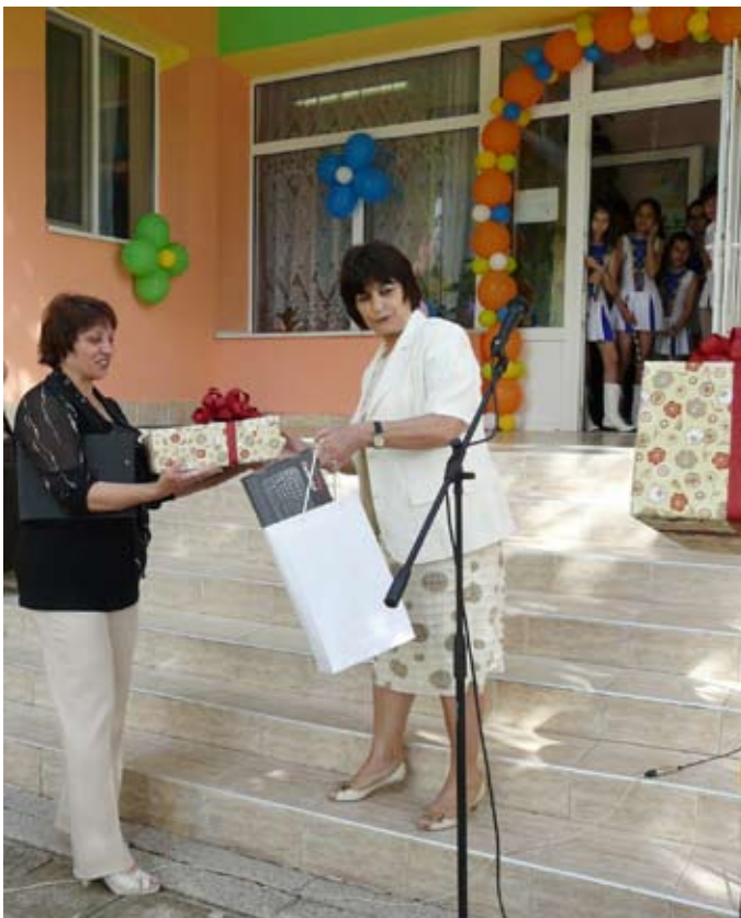
Подаръци за юбилея от община Шабла

Горните два факта доказват, че ако се докоснеш до детския свят, трудно можеш да промениш професията си, а тази професия е призвание, не е за-