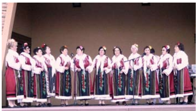
Фолклорна група от село Ваклино