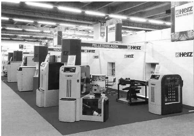
Част от изделията, които фирмата произвежда

В заключение Тодоров посочи, че отоплението с котли, които използват биомаса е напълно приложимо в нашата