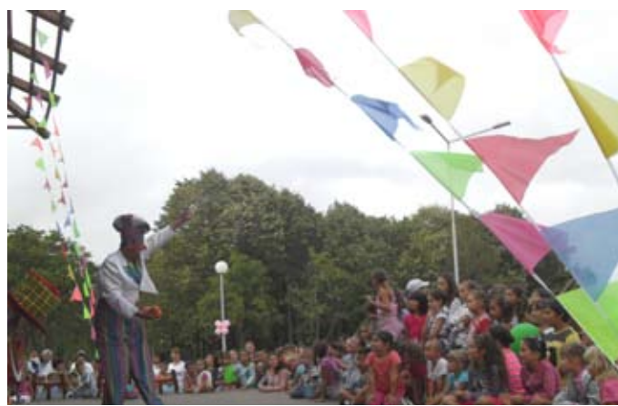
МИМО забавлява децата на Шабла