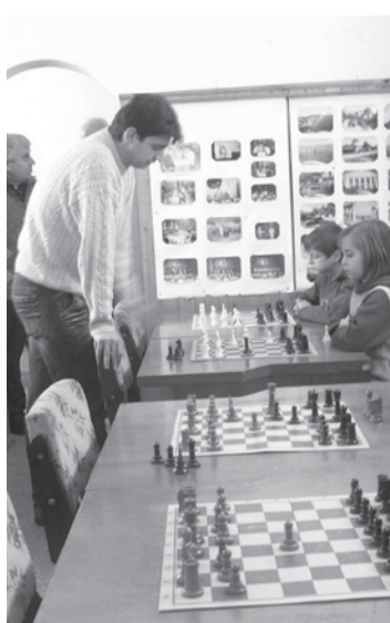
Малките шахматисти от шахклуб „Хармония“.

Сред одобрените са Спортен клуб „Кария“ и Шахклуб „Хармония“ - Шабла по направление „Начално обучение по вид спорт“ с финансиране, съ-