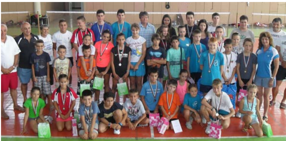
След финала на турнира

Спортните деятели в Общината изказват своите бла-