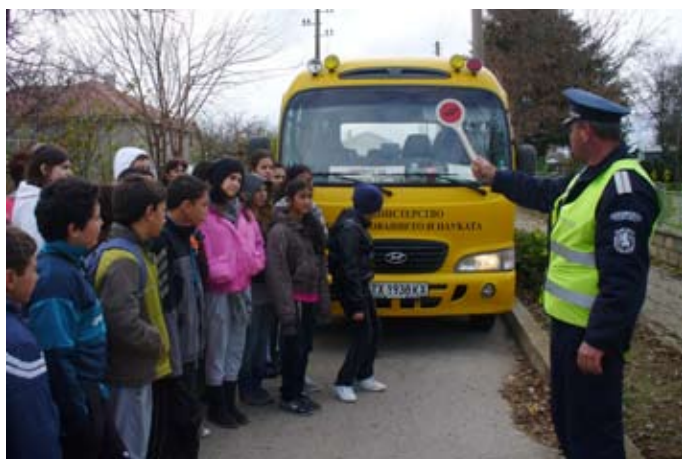
В часа по безопасност на движението

Богородица, детски библии за училищната библиотека, и