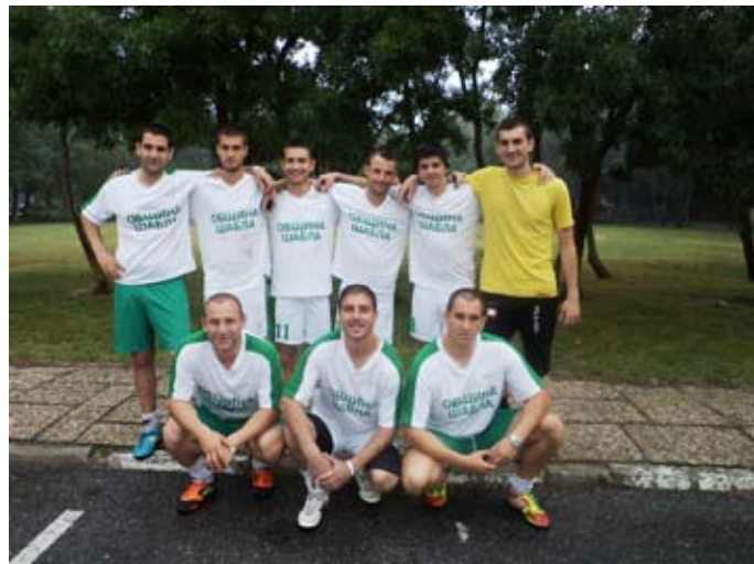
„Извънземните“ от Шабла

„ШАБЛА-КАВАРНА“ На 22 ЮНИ 2013 ГОДИНА - 10,00ч. в спортен комплекс „Шабла“ ВХОД СВОБОДЕН