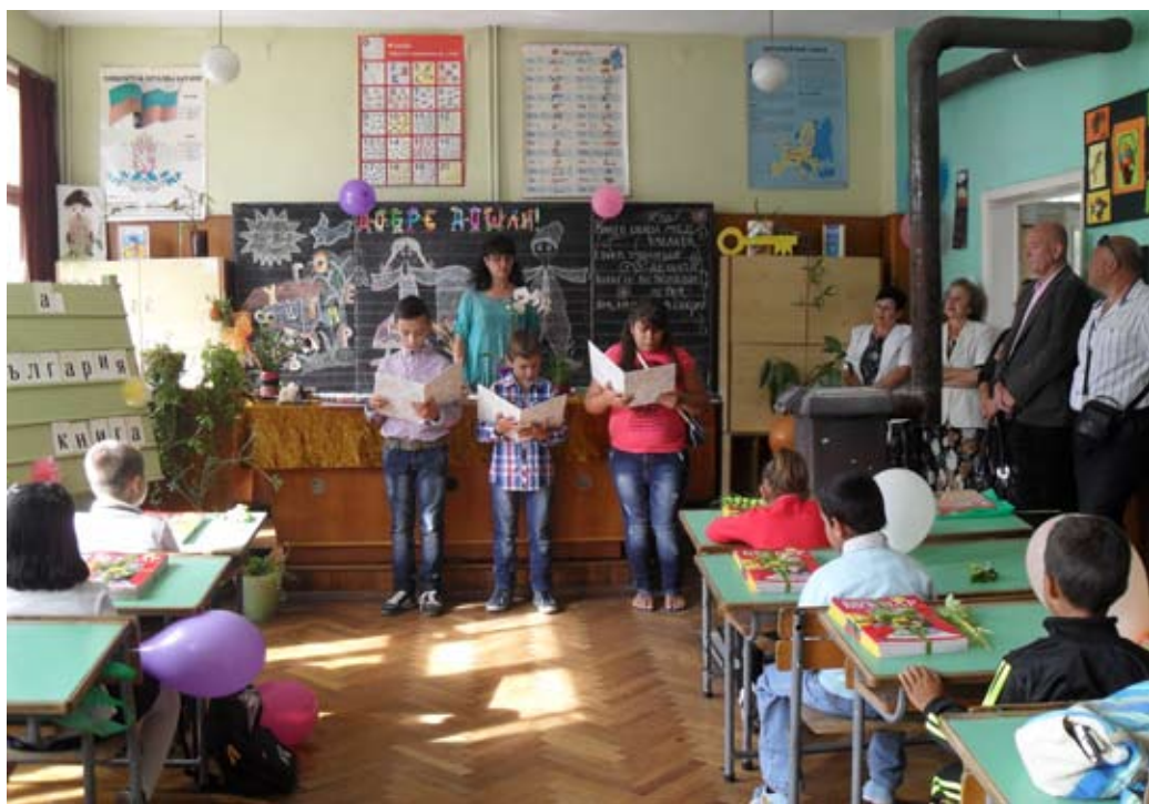
Първият учебен час в дуранкулашкото училище