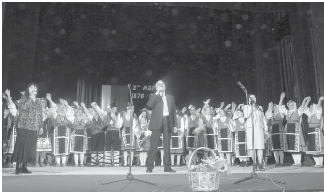
„За теб, България...“