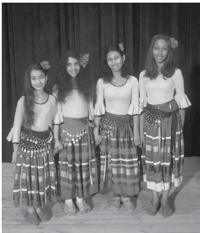
Танцьорите от клуб „Ромски фолклор”