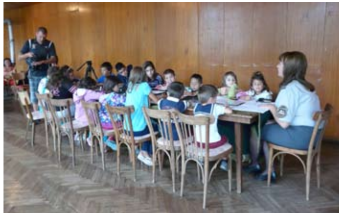
Децата изучават основните правила за безопасност

Припомниха си, че при нужда трябва да се обаждат на телефон 112, като си кажат бързо