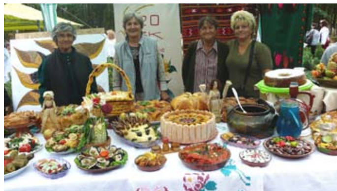
С това се представиха тюленовци