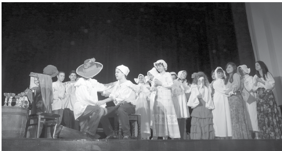
Момент от спектакъла

година, в навечерието на 16 февруари, когато чества своя патрон, проф. д-р Асен Златаров.