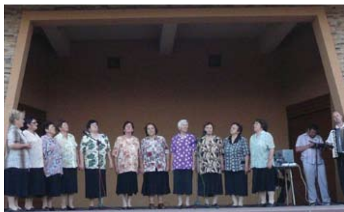
Група за стари градски песни от село Ваклино