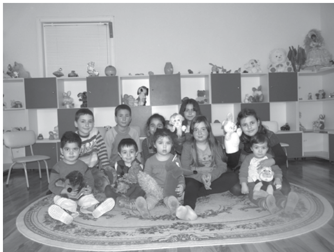
Домакините и гостите

Авторът на архивния материал добавя още, че за децата в новооткритото заведение се