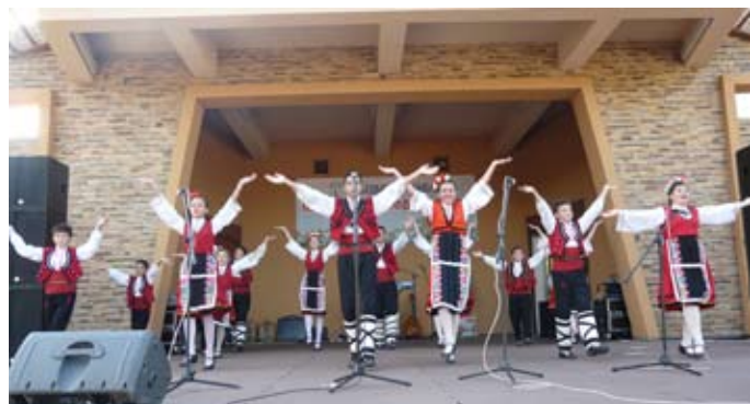
Танцов състав „Бърборино“