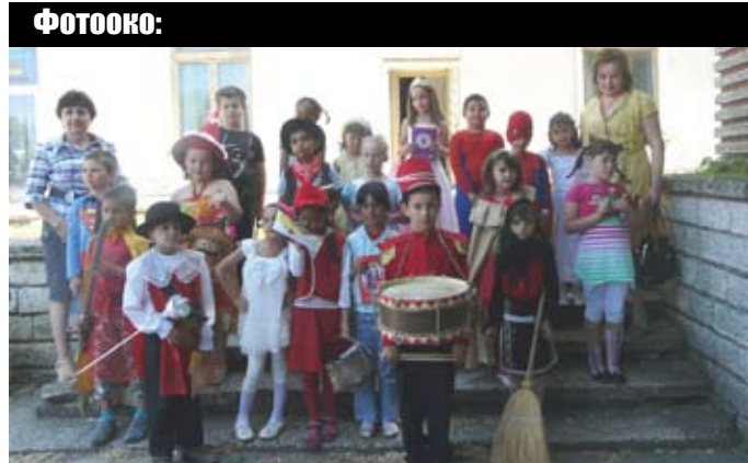
Всяка година в календара на Общинския детски комплекс е заложен Парадът на приказните и литературни герои

Адрес на редакцията: 9680 град Шабла, ул. „Равно поле“ № 35, тел: 05743/ 44-21, e-mail: izgrev@ob-shabla.org , vestnik.izgrev@gmail.com интернет страница: www.shabla.info