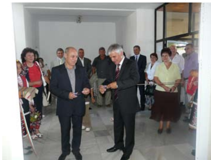
Откриването на ЦСРИ.

От началото на тази година имаме и социален работник. Новият рехабилитатор прилага масаж с луга и ултразвук, след