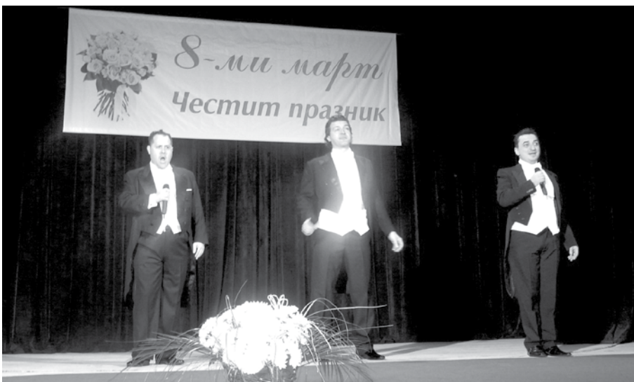
Трио „Гранди тенори“