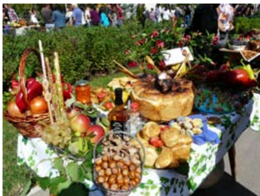
Всичко, което ражда шабленската земя