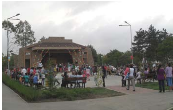
Малки и големи се събраха на детския празник в Градския парк

„Децата на Шабла“ беше наречен празникът за най-малките жители на Общината. Той се състоя в Градския парк и бе посветен на 44-та годишнина от обявяването на Шабла за град.