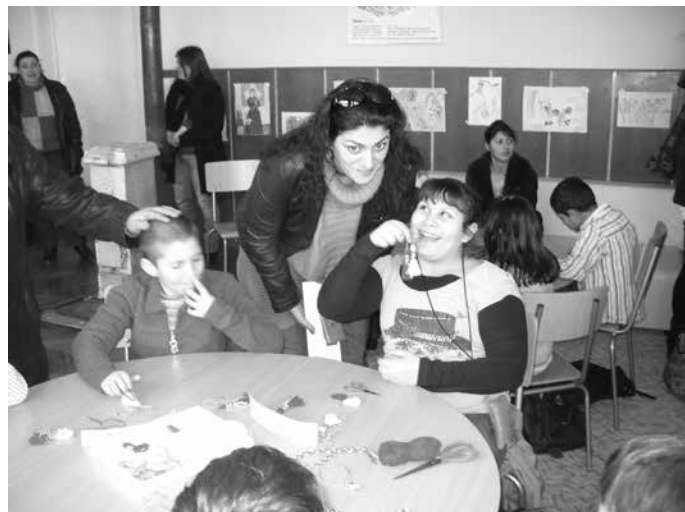
Училище за родители

Родителската среща се проведе под надслов „Да поговорим за децата ни на чаша чай“. Тя беше съчетана и с предстоящите празници - 1 март и 8 март.