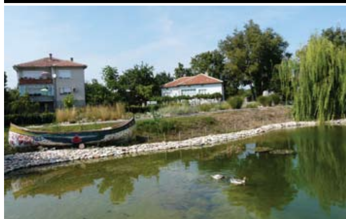
Нови обитатели в езерото на Зеления образователен център

Всеки ден от 10.00 до 17.00 часа. Телефон: GSM 0888 / 707 979