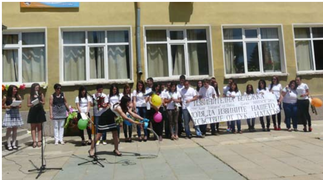
Да Ви върви по вода...

Благословен да е трепетът на всичко чисто и прекрасно,