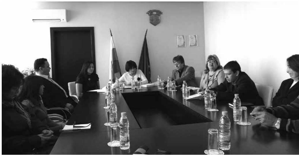
Участниците в срещата

Беше обсъдено и какво предвижда новото експлоатационно решение за водоснабдяване на град Шабла и подписване на споразумение между община Шабла, която притежава разрешителни за водовземане от сондажи на територията ѝ и В и К, което ги експлоатира.