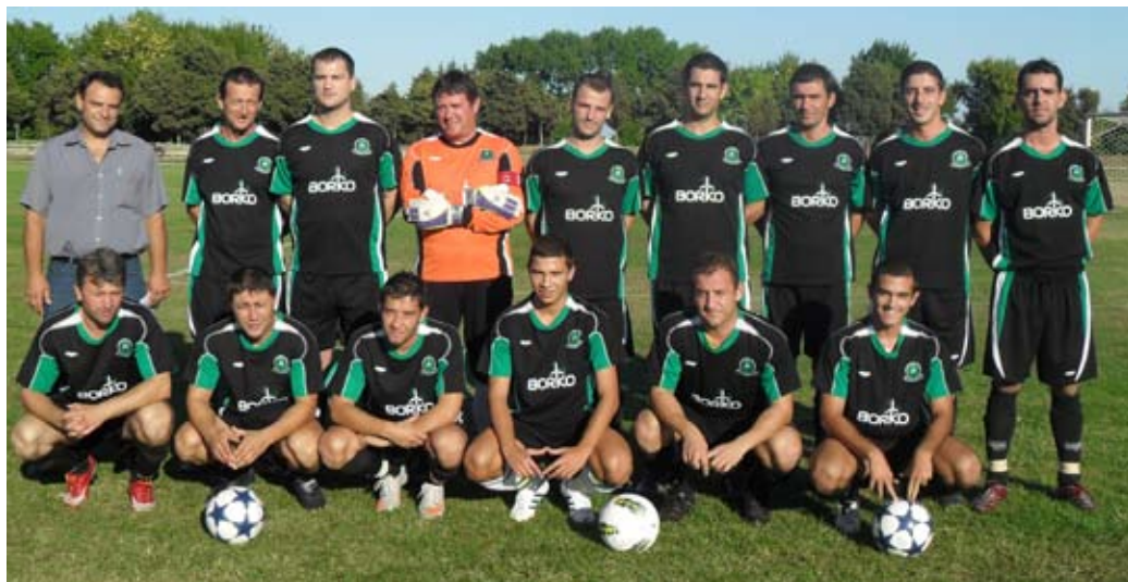
Отборът на „Нефтяник-2010”