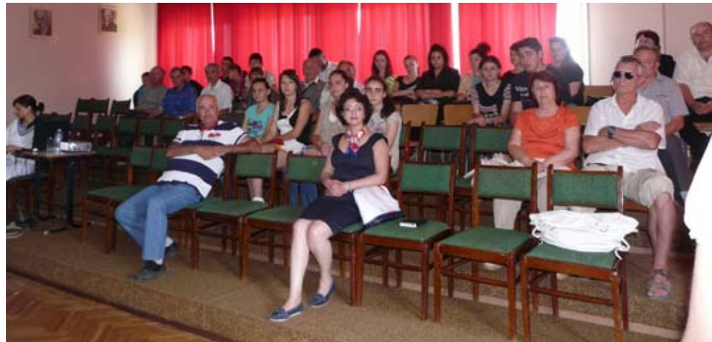
Присъстващите на срещата