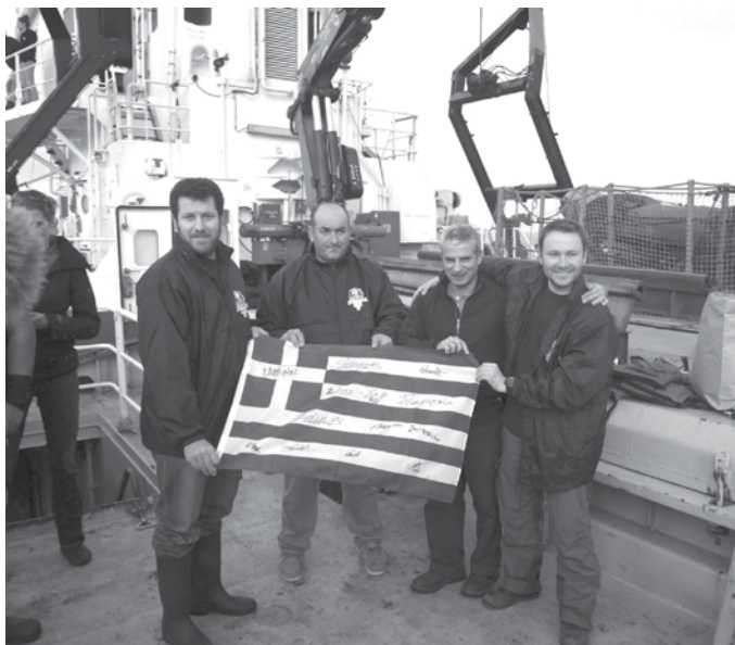
На кораба „Arctic Sunrise“ по време на плаването

Пътуването е съпътствано от тренировъчни демонстрации на екипажа с участието и на гостите.