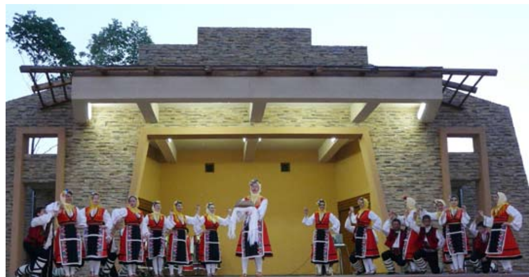
Танцов състав „Българка“