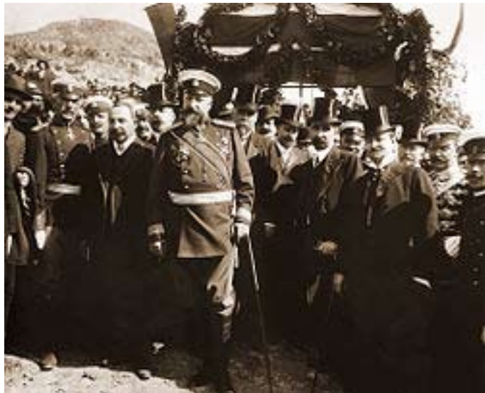
Фердинанд I, министър-председателят Александър Малинов, членове на правителството и генерали при обявяването на Независимостта на България

Материали и заявки, съобщения и рекламни карета се приемат в редакцията на вестник „Изгрев“ до 14.00 часа в петък.