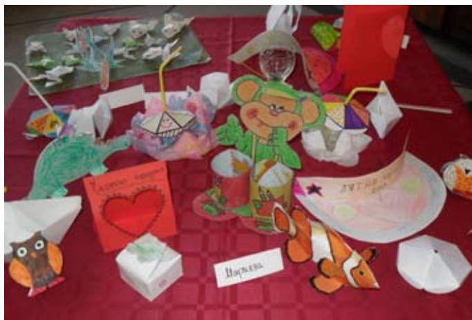
Част от експонатите