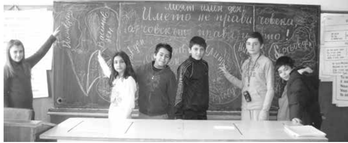
„Човекът прави името“