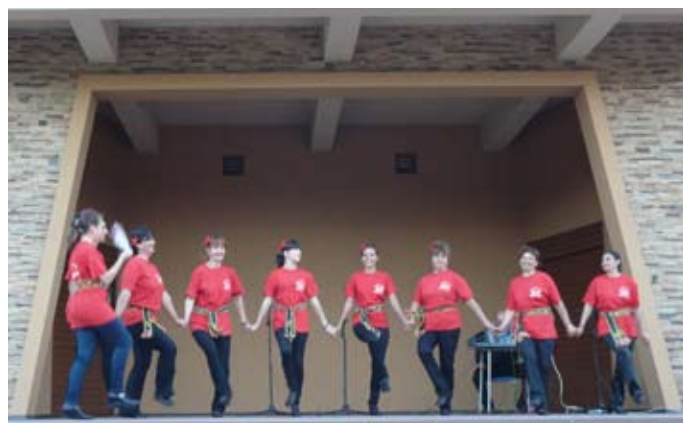
Танцов клуб „Кибеа“ от село Дуранкулак