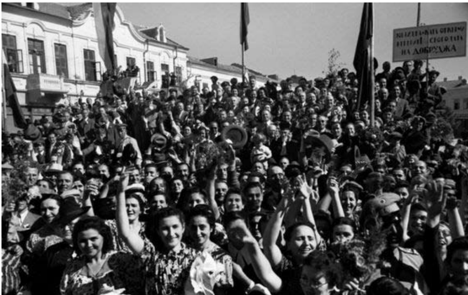
25 септември 1940 година, Добрич. Част от възстановената 3-та Българска армия под командването на генерал - лейтенант Георги Попов влизат в столицата на Южна Добруджа

Втората Световна Война е времето, в което родното парче земя отново става българско, при това чрез посред-