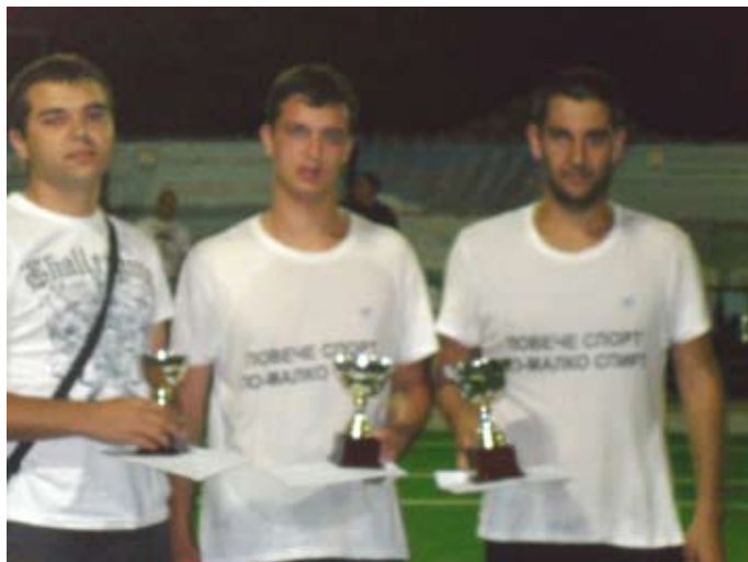
Първият, вторият и третият (отляво наляво)