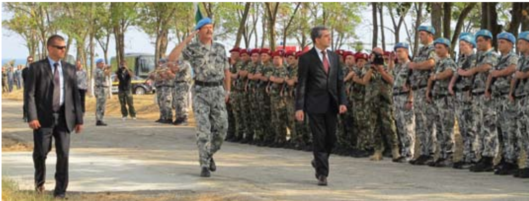
Главкомандващият поздравя участващите в учението

пие презентираща Плана на настоящото учение.