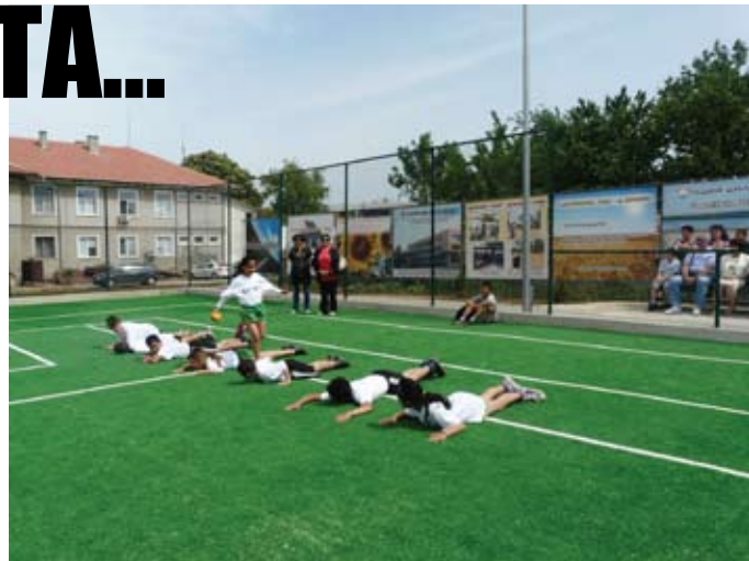
Бързи, смели, сърчни