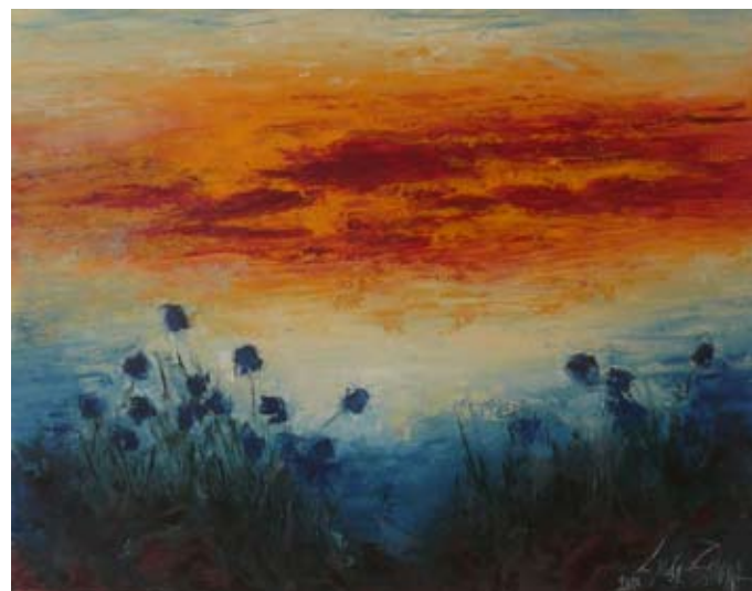
„Изгрев“, автор Люба Захова

ОРГАНИЗАТОРИ: СДРУЖЕНИЕ „ОБЕДИНЕНИ ЗА ШАБЛА“ И ОБЩИНСКА АДМИНИСТРАЦИЯ