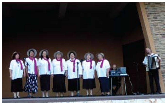
„Млади момичета“ от село Дуранкулак