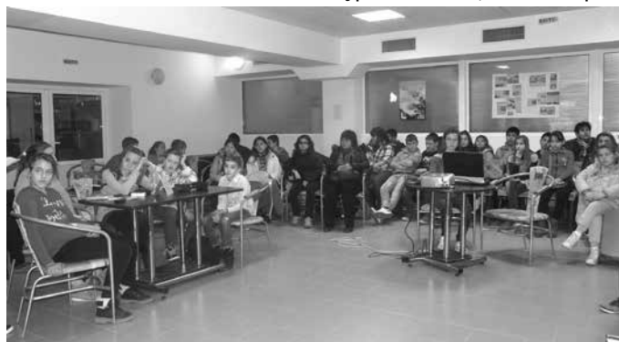
Знаем ли историята на свято българско знаме?