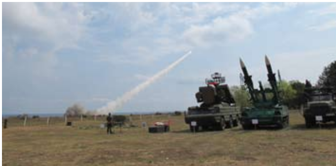
Огън по целта...