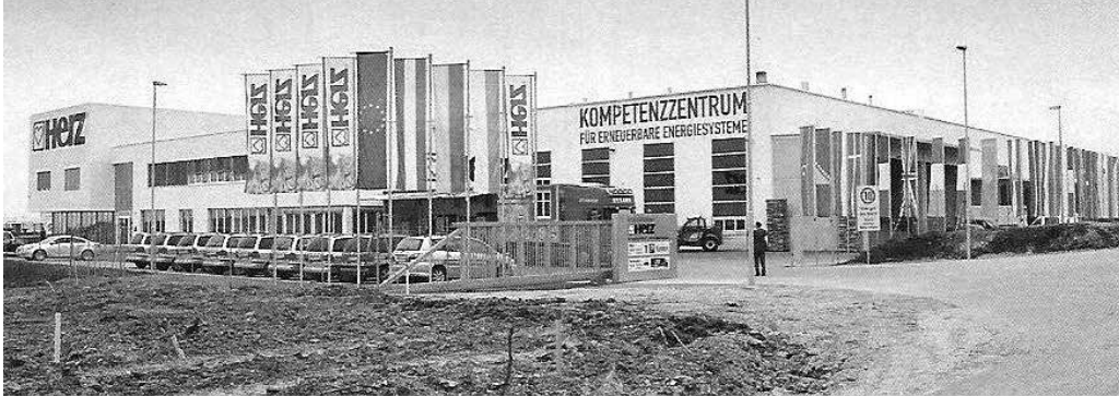
Производствената база на фирма „Херц“