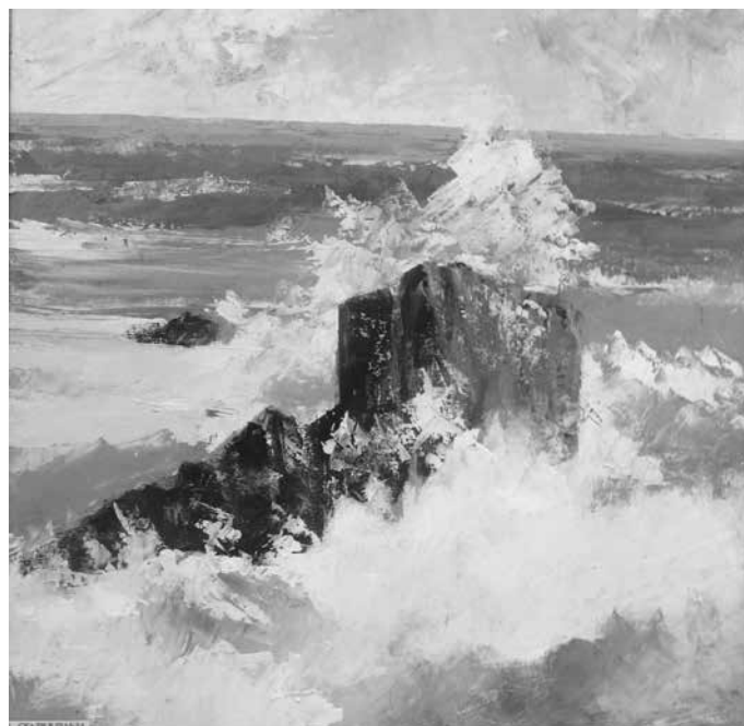
„Скали в Шабла“, автор Йон Баланю

вет в Шабла, д-р Йорданка Стоева-председател на Комисията по образование, култура, спорт, здравеопазване, социална по-