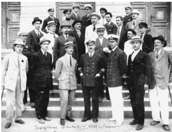
Учредителите на Българския народен морски сговор.