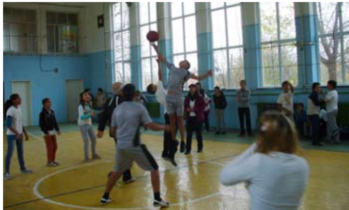
На баскетболната площадка срещу съперниците от Белгун

нието му от далечните години до сега. Особено място отдели на живота и делото на свети Климент. Макар и без предва-