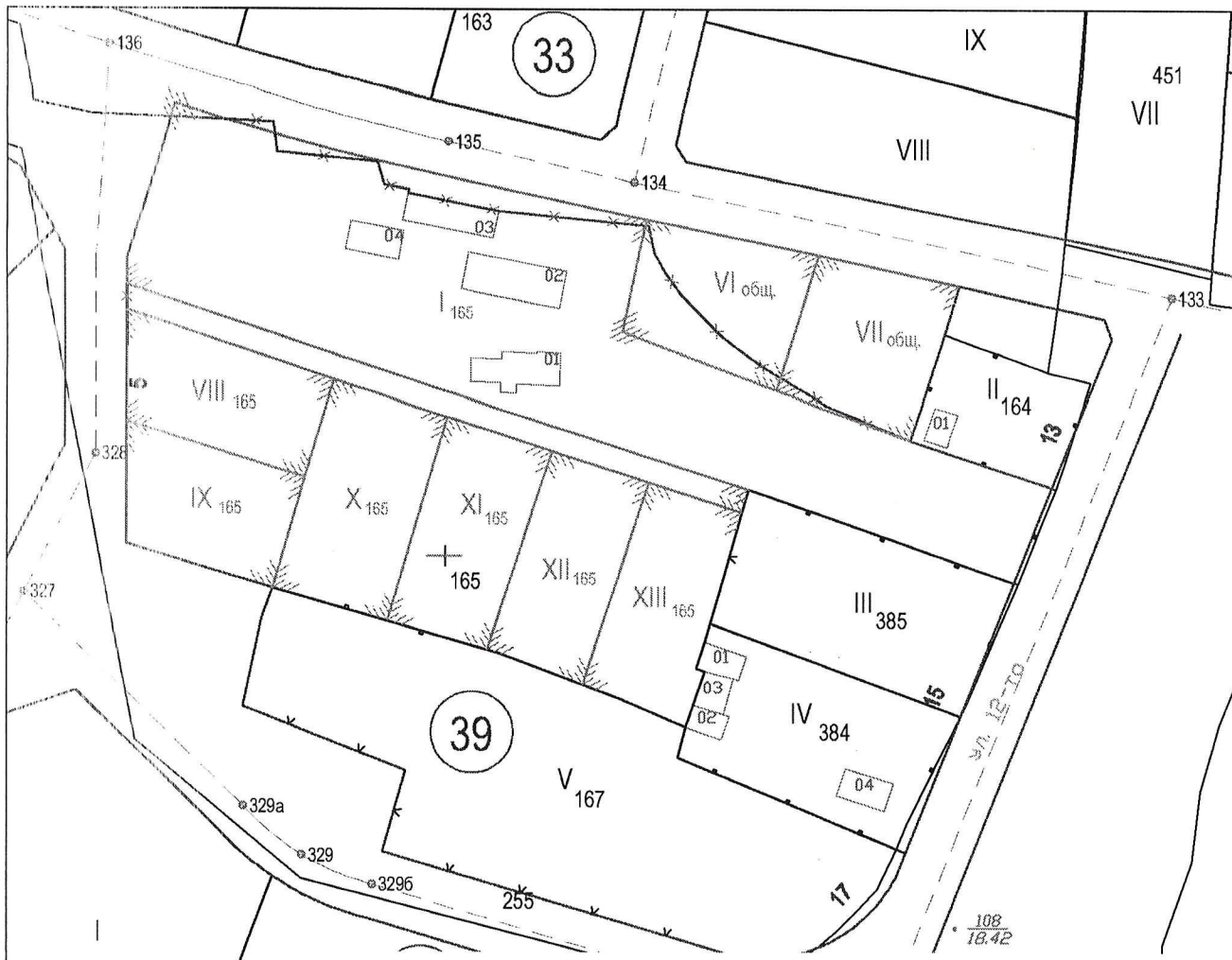
РЕКАПИТУЛАЦИЯ НА ПЛОЩИТЕ (м 2 )