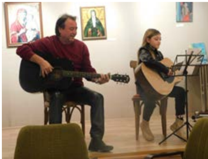
Гостите от Каварна.