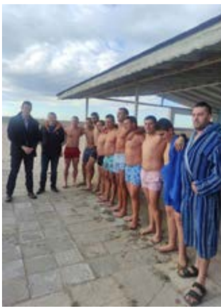
В Дуранкулак се хвърлиха десет смели момчета.

Ритуалът с хвърлянето на кръста традиционно се провежда на къмпинг „Космос“.