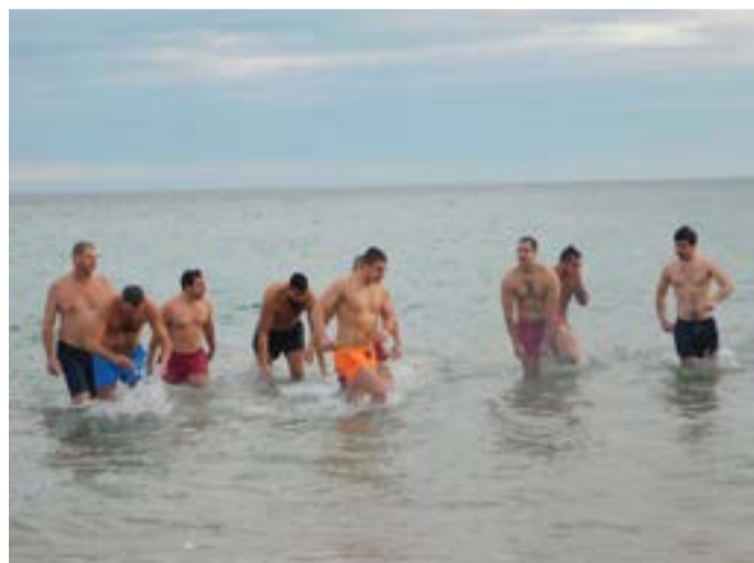
Ритуалът в Шабла.