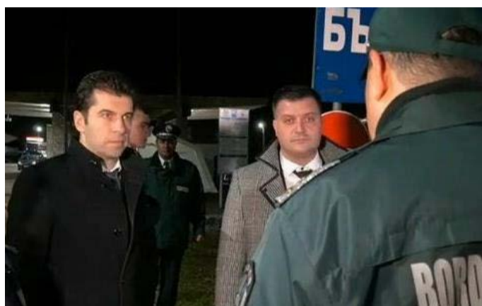
Премиерът Кирил Петков и Областния управител Галин Господинов на ГКПП-Дуранкулак.

въведено е обучение по график, при което не се допуска едновременно провеждане на практически или семинарни упражнения на повече от 50%