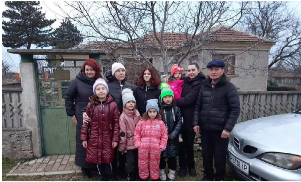
Трите украински семейства – приютени в нашето село.