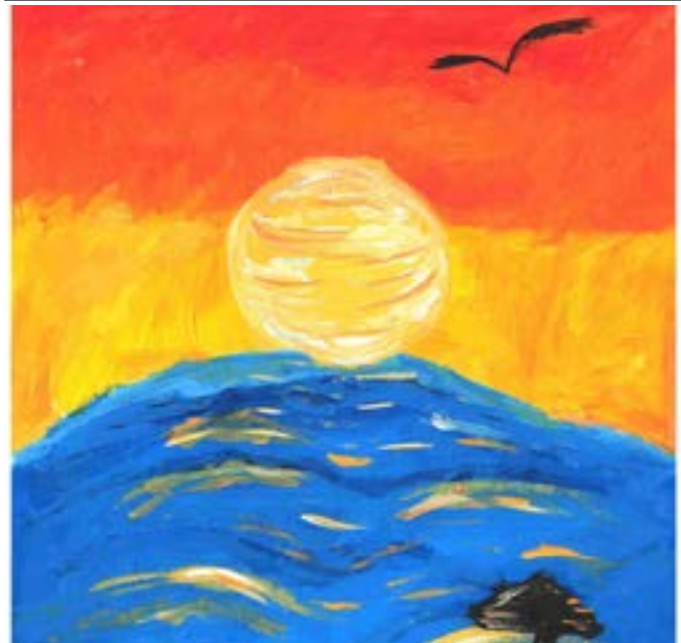
„По жътва“, Калоян Керчев, 3 кл.