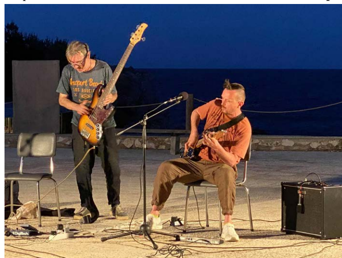
„Басче и китарче“ в Тюленово.