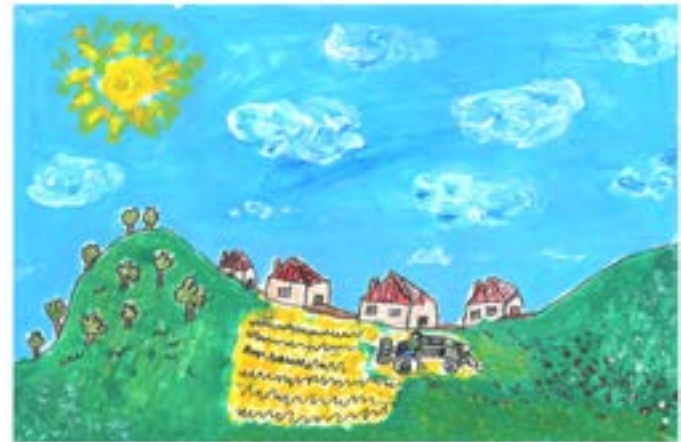
„Изгрява слънце“, Иванина Огнянова, 3 кл.