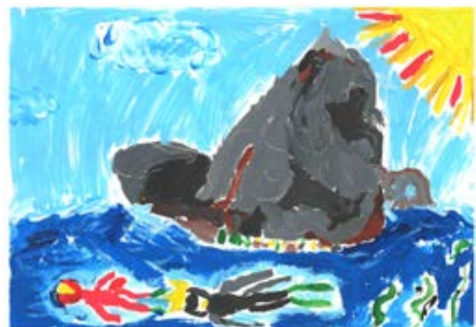
„Водолази в Тюленовския залив“, Радост Русева, 2 клас.