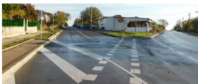
Улица „Заводска“ (вляво на снимката), от кръстовището с ул. „Нефтяник“