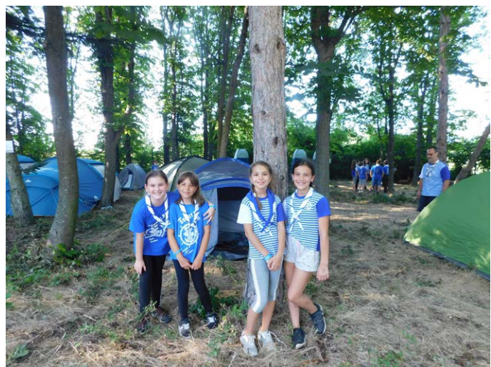
Усмивки в скаутския лагер...