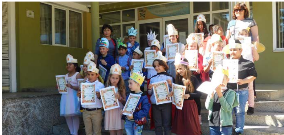
Първокласниците получиха свидетелствата си за грамотност.