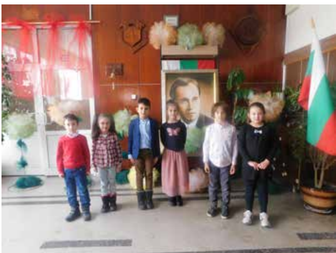
Най-малките възпитаници на СУ „Асен Златаров“.