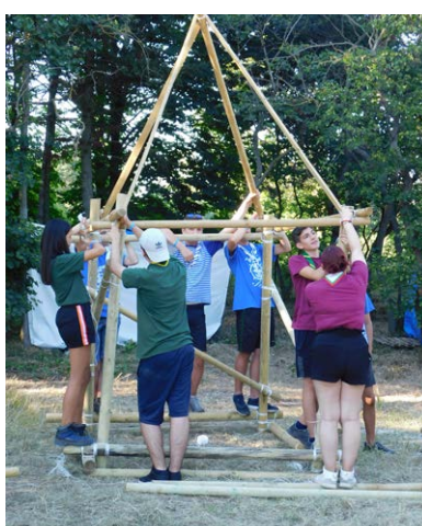
Скаути строят макет на Фара Шабла в Градския парк.