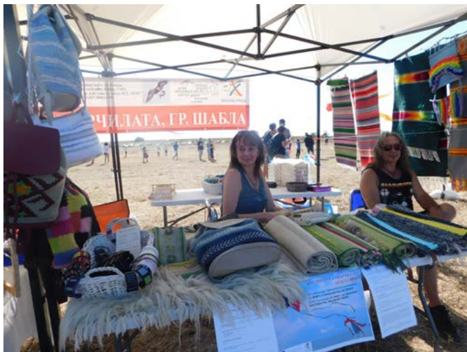
Щандът за битови изделия на гостите от Варна.

„Обичам България. Тук имам много приятели. Идвам на фестивала всяка година, за-