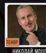
ТЕНОР НИКОЛАЙ МОЦОВ