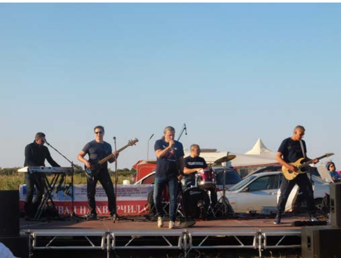
Хедлайнерите от БТР.