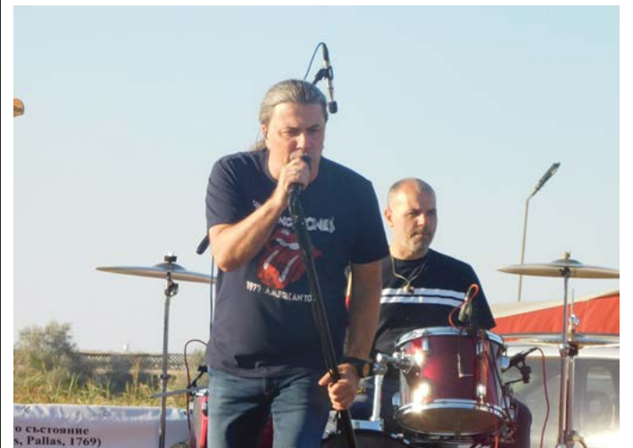
Култовият фронтмен на БТР – Наско Пенев