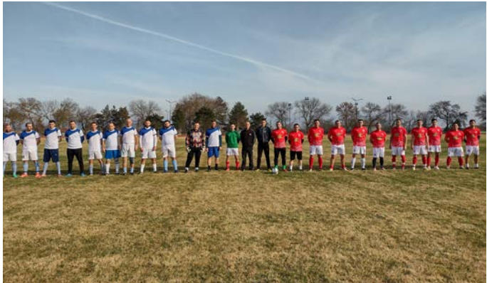
Отборът на „Спортист“ (вдясно на снимката), на терена на Градски стадион Шабла, секунди преди първия съдийски сигнал на контролата срещу „Калиакра“.