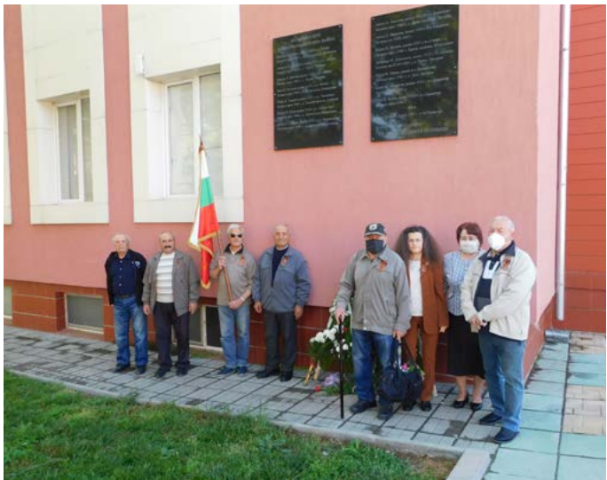
Пред паметните плочи на загиналите във войната жители на общината.