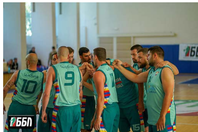
Баскетболистите на „Шабла“ – вече с мисъл за „Шумен“...