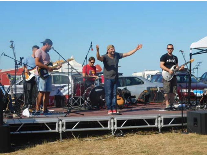
На сцената: група „До Шо бенд“ от Каварна.