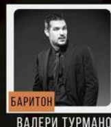
БАРИТОН ВАЛЕРИ ТУРМАНОВ