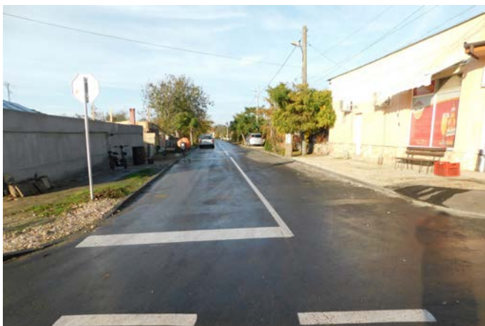
Улица „Нов живот“