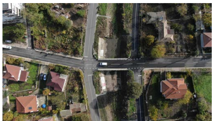
Кръстовището на ул. „Свобода“ (хоризонталната на снимката) с двете платна на ул. „Долина“

Приключи аварийния ремонт и възстановяването на пътната настилка на ул. „Долина“ в Шабла – ляво и дясно платно (по протежение на т.н. „дере“). Ремонтните дейности са на стойност 763 000 лв. с ДДС, а финансирането е от Междуправителствена комисия за възстановяване и подпомагане към Министерски съвет.