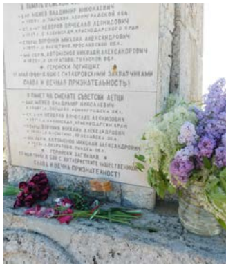
На паметника на съветските летци – цветя, хляб и вода...

„Днес свеждаме глави в знак на дълбока признателност към хилядите достойни български воини, които записаха в нашата история безброй победоносни битки по бойните полета на няколко войни. Част от история-