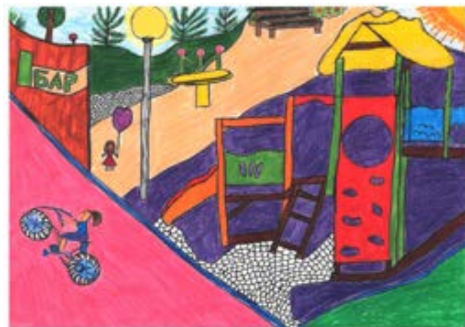
„Аз и сестричката ми в Шабленския парк“, Гергана Ялнъзова, 5 кл.