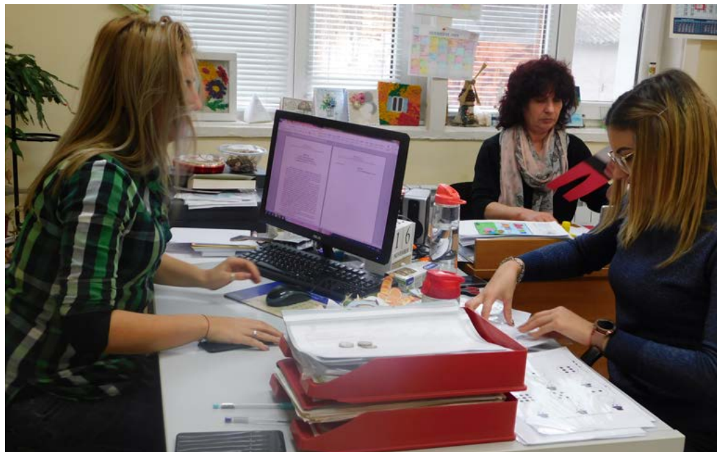
В Центъра за обществена подкрепа в Шабла не са спрели занятията със своите потребители и по време на пандемията.

При всички случаи тази пандемия ни провокира да мислим различно, доста по-творчески, отколкото в нормална ситуация. Понякога нашите опити имат успех, но друг път е необходимо малко повече стимулация от наша страна към детето, за да получи правилната мотивация за промяна. Не мога да кажа, че онлайн-срещите с нашите потребители нямат ефект върху тях, но истината е, че по-добро от личните срещи няма. Безспорно личният контакт е най-ефективен. Тогава ти можеш да погледнеш детето, да му привлечеш вниманието с присъствието си, не позволяваш то да се „отвлече“ и разконцентрира. Личната среща е същинската терапия и консултация.