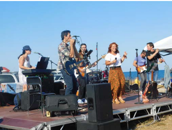
Местната група „Фара бенд“.