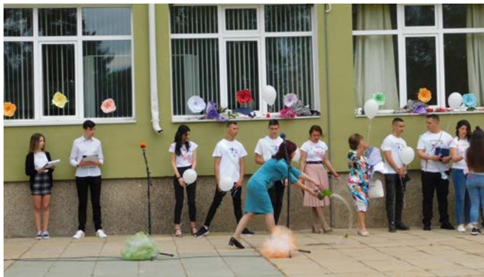
На добър час...

На 14 май СУ „Асен Златаров“ гр. Шабла изпрати своите абитуриенти.