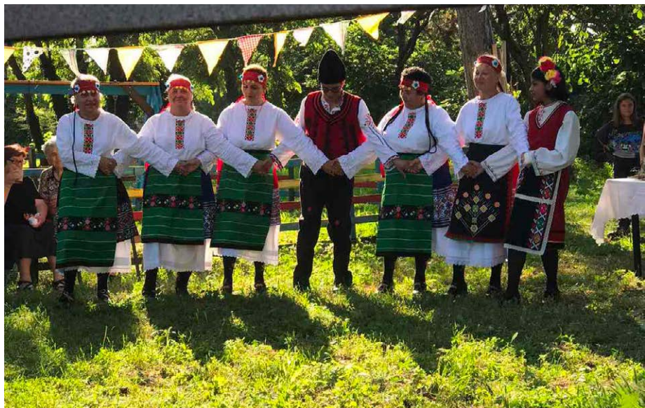
„Дилбера“ от Ваклино играха за празнуващите.