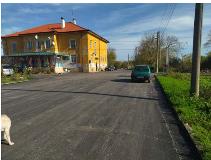
Водещата до кметството на с. Езерец улица №2 в селото.