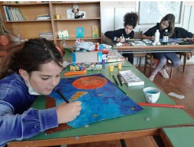
В „Еко-арт ателие“

по-богата материална база. Избрахме тези три направления, изхождайки и от интересите на децата, от изявиите и успехите им през последните години. Изкуството винаги е давало свобода и полет на въображението, то вдъхновява и мотивира. Ето защо очакваме нашата нова придобивка да привлече и повече малки творци. Искаме да им дадем място,