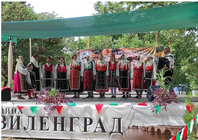
Наградените самодейци от Шабла.