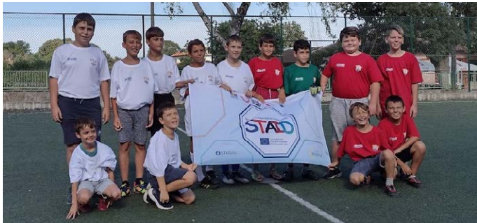
Мач между децата на Шабла откри турнира, а накрая те получиха наградите си.

Турнирът премина под мотото „Не на насилието“. Съдийстваха Владислав Овчаров