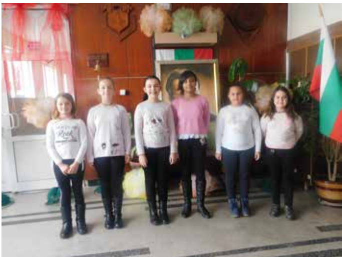
Във виртуалния концерт се включиха и учениците от IV клас.