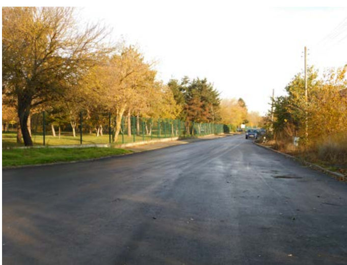
Улица „Черни връх“ (вляво на снимката е Градския парк)