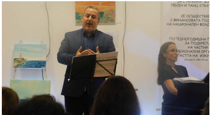
И Маестро Моцов пъ на концерта.