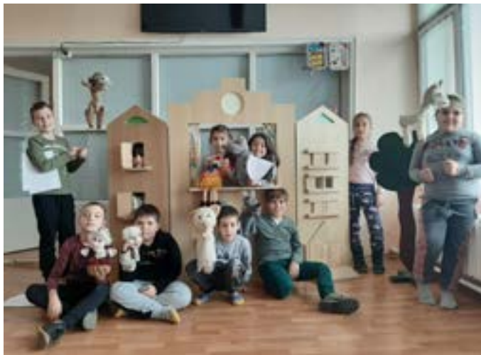
Участниците в Куклено-театралния състав с нетърпение очакват новите си кукли.

дучилищното и училищното образование. Изготвихме документацията и я подадохме през пролетта и в края на лятото научихме, че сме одобрени за финансиране. Това е чудесна възможност да надградим вложенията през годините и да дадем на своите възпитаници шанса да имат едни добри условия за развитие на своя творчески потенциал, да разполагат с нова, много по-удобна и далеч