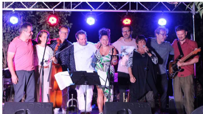
Всички изпълнители на „Джаз до морето“ под аплодисментите на публиката.