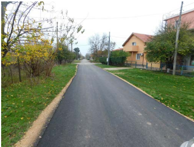
Улица № 17 в с. Крапец.