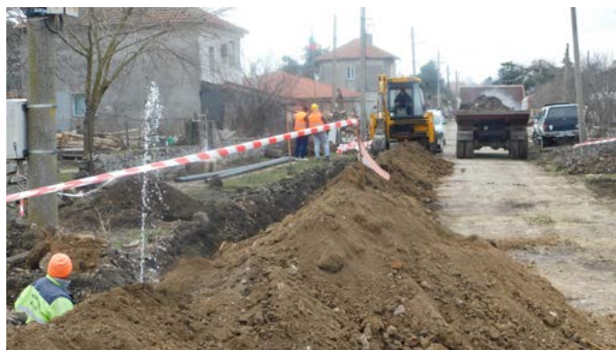
На ул. „Черни връх“

Сега се изпълнява и авариен ремонт по улица „Комсомолска“ в Шабла, като той се осъществява от общината, съвместно с „ВиК Добрич“ АД и е финансиран изцяло от общинския бюджет. Улица „Комсомолска“ се подготвя за предстоящия основен ремонт по проект на Програмата за развитие на селските райони за периода 2014-2020 г., съфинансирана от Европейския земеделски фонд за развитие