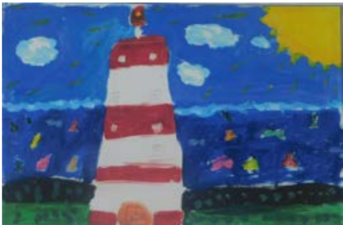
„Пасаж край нос Шабла“, Кристиана Стефанова, 2 клас.

В „Изгрев“ продължаваме да публикуваме рисунките на децата от ОДК Шабла, експонирани пред сградата на Общинска администрация в града.