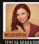
МЕЦОСОПРАН ТЕРЕЗА БРАКАЛОВА