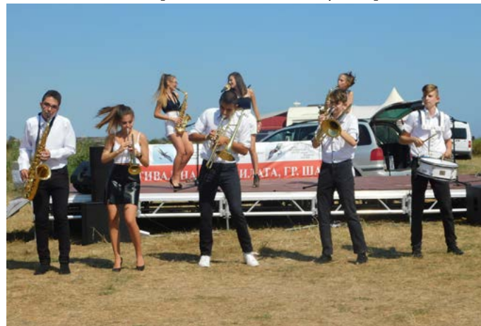
Участието във втория фестивален ден на „Капитанов брас бенд“ от Добрич.