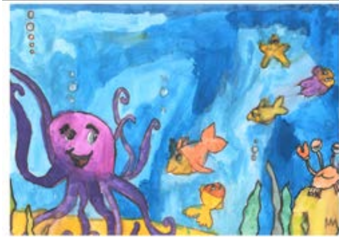
„Морско дъно“, Елиза Пеева, 2 кл.