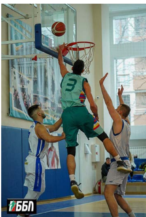
БК „Шабла“ прекърши отбора на ИУ Варна, въпреки че изоставаше в сериата.