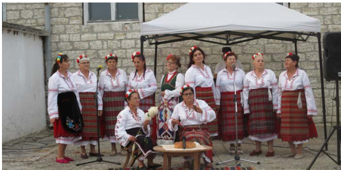
Приятелите от село Българево.