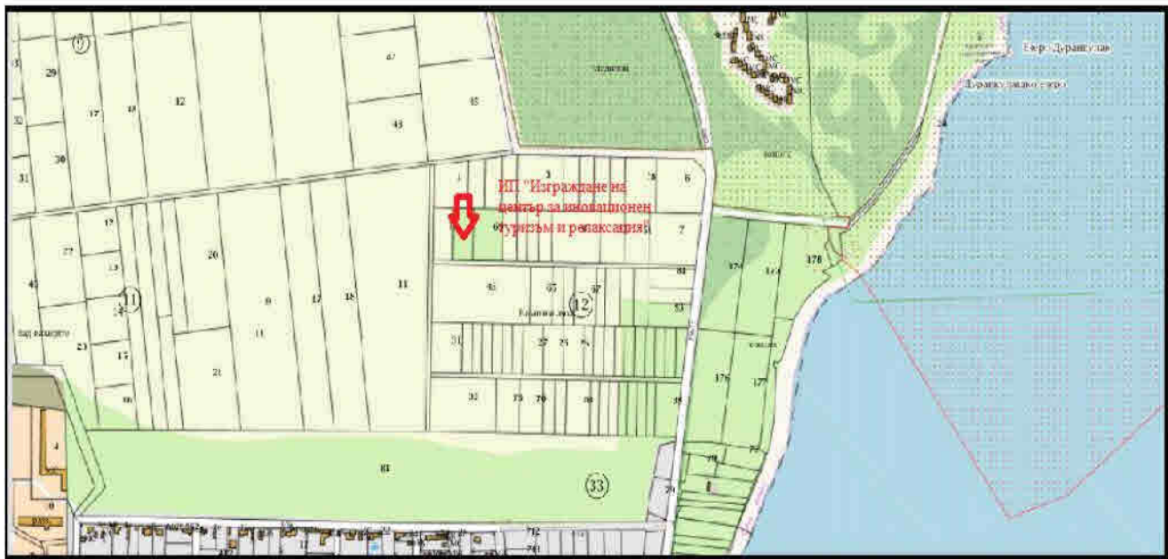
Карта с местоположение на обекта на ИП и най-близко разположените защитени зони