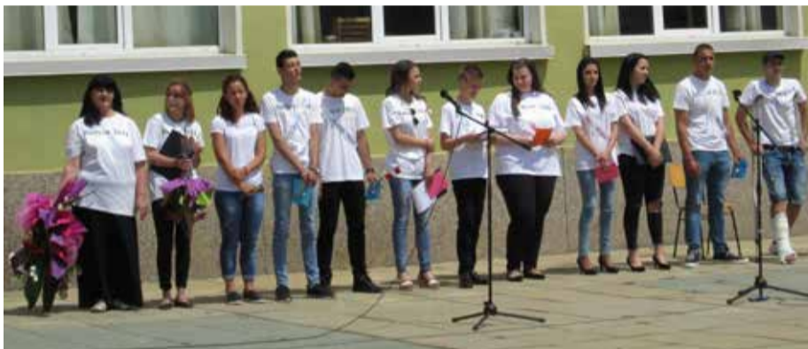
Абитуриентите, с техния класен ръководител