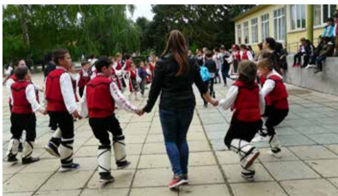
На хоро се хванаха и учениците от училището в Шабла.

УВАЖАЕМИ ЧИТАТЕЛИ НА ВЕСТНИК „ИЗГРЕВ“ съобщаваме Ви, че освен в редакцията на вестника, в стая 324 на общинска администрация - Шабла, можете да подавате вашите обяви и съобщения и в стая 10б.