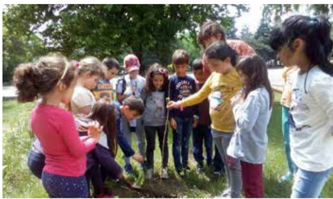
В Деня на Победата и Европа, първокласниците от СУ „Асен Златаров“ - Шабла посадиха дърво в училищния двор