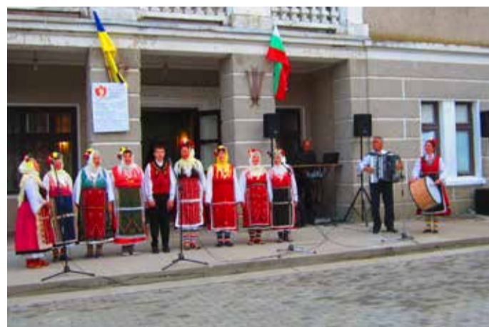
Фолклорна група „Добруджанка“