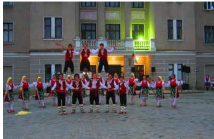
Танцов състав „Българка“

Осъществена визита е поредната крачка в съвместните усилия на двете общини за укрепване на сътрудничеството между тях.