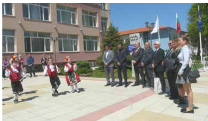
Посрещане на гостите с българска народни танци