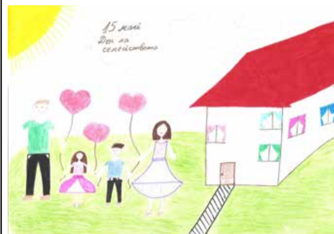
Автор на рисунката е дете, посещаващо ЦОП

ОБЩИНА ШАБЛА И ЦЕНТЪРЪТ ЗА ОБЩЕСТВЕНА ПОДКРЕПА ОРГАНИЗИРА КОНКУРС НА ТЕМА: „МОЕТО РОДОСЛОВНО ДЪРВО“. ПОСВЕТЕН НА МЕЖДУНАРОДНИЯ ДЕН НА СЕМЕЙСТВОТО (15.05.2018Г.)