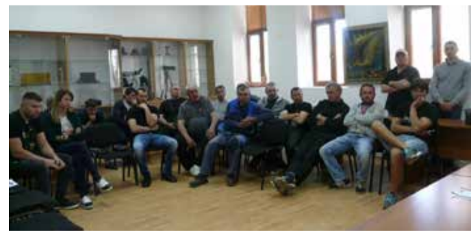
Рибарската общност от община Шабла

чин и предпазва дребния улов. Посочено беше, че до сега няма субсидии за рибари.