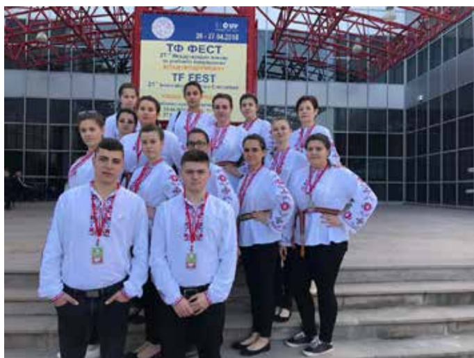
Младите предприемачи и техния преподавател

Учениците преминаха през всички етапи за изграждане на предприятие – от подаването на документите за вписване в Търговския регистър до изграждане на подходяща маркетингова стратегия. Панаирът в Пловдив бе най-естествената крайна точка, където учениците да получат оценка в конкур-