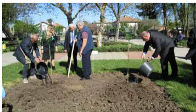
Да растат, както отношенията между двете общини