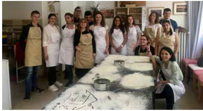
...месиха и хляб

На 15 април 2018г. завърши Младежката академия за граждански права в гр. София - още едно незабравимо преживяване, което ще остане завинаги в моите спомени! Обучението беше организирано от Национална младежка карта в партньорство с Младежкия съвет към Американското посолство, като имаше за цел да подкрепи развитието на компетенциите на младите хора между 16 и 26 години на локално и национално ниво, за да укрепи активното гражданско участие, развитието на гражданско общество и да създаде мрежа от алумни на Академията.