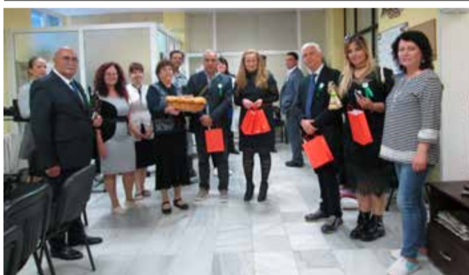
Посещението в ЦСРИ

рят нишите, където ще могат да обсъждат проблеми и да си сътрудничат в различни области, след което презентира нашата община – географско положение, туризъм, социални, здравни, образователни и културни дейности, селско стопанство и др.