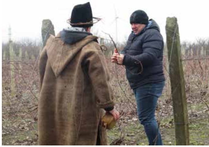
Кметът на Общината зарязва за здраве и берекет

„Трифон Зарезане, днес е твоят ден. Буйни филизи да