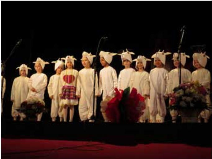
Поздрав от първокласниците

Всяка година училището в Шабла на 16 февруари, провежда празничния концерт с участието на негови възпитаници. И тази година празникът бе отбелязан по случай патрона на СУ „Асен Златаров“.