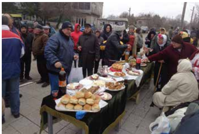
Трифон Зарезан в Дуранкулак

На импровизираната сцена пред кметството се извиха самодейни състави от Дуранкулак, Граничар, Ваклино и Кра-