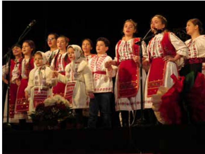
Гостите от Румъния на шабленска сцена

Празникът събра малки и големи – деца и техните семейства, настоящи и бивши преподаватели и служители в шабленското училище, носещо името на големия български учен и общественик. На сцената на читалището се извиха много таланти. Подобни поводи са възможност те да се развиват и насърчават. След време, тяхното призвание ще бъде изкуството, защото то извисява личността и прави живота ни