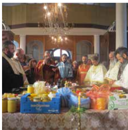
Освещаването на меда