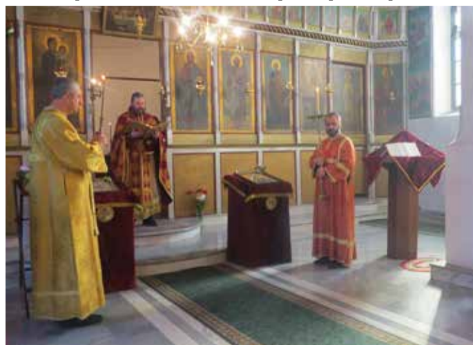
По време на литургията