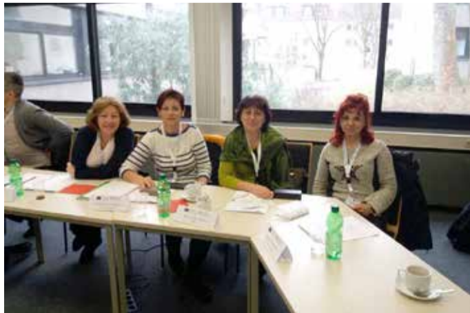
Представителите на шаблоенското училище

През месец май 2017 към Центъра на Учебно Тренировъчните Фирми в гр. София и СУ „Асен Златаров“ като училище, в което се прилага успешно метода на учебно тренировъчните фирми, бе направена покана от страна на СВЕТОВНАТА ОРГАНИЗАЦИЯ НА УЧЕБНИТЕ ПРЕДПРИЯТИЯ В ГЕРМАНИЯ - EUROPEAN за участие в техен проект като партньори по европейска програма ERASMUS+ KA3 - „Подкрепа за реформиране на политиките“, която има за цел да улесни модернизацията на системите за образование и обучение, чрез изграждане на политическо сътрудничество между държавите-членки.