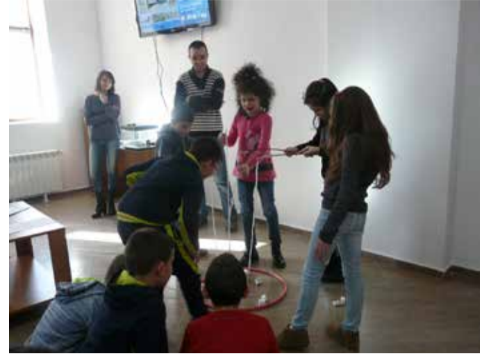
На улов за риба

На 2 февруари в Зеления образователен център - Шабла гостуваха експерти от РИОСВ - Варна. Те се срещнаха с ученици от трети клас на СУ „Асен Златаров“ в града ни, участници в клуб „Природолюбител“ към Общински детски ком-